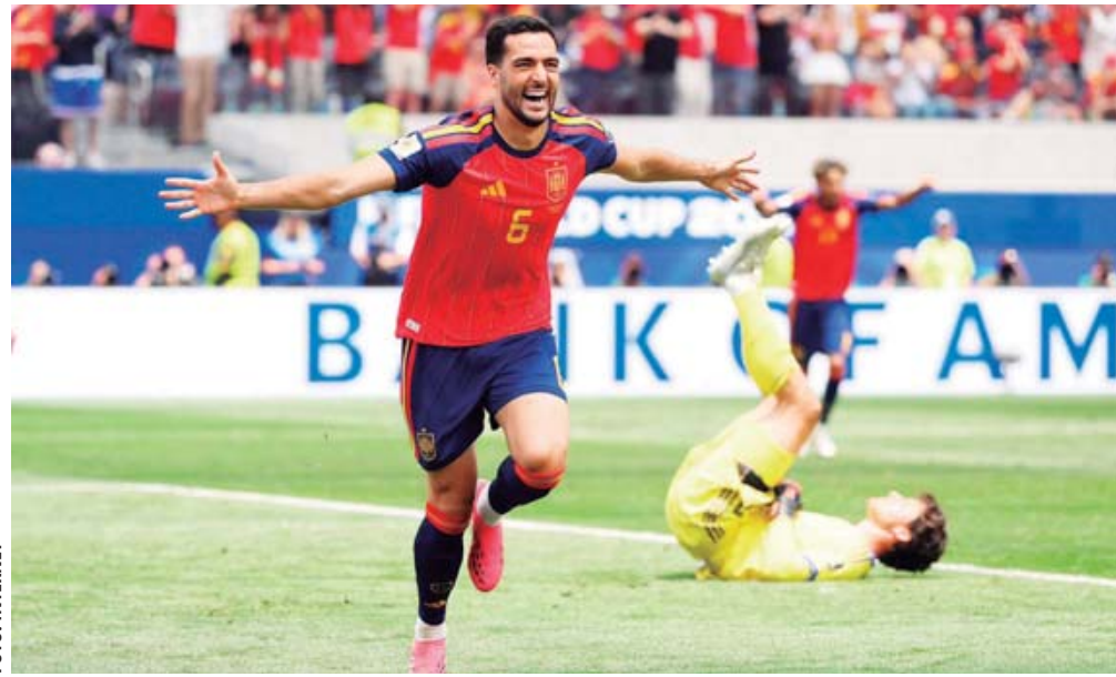
En un dramático cierre, España gana 2-1 a Bélgica, con goles de Fabián Ruiz y Mikel Merino; va contra Francia en las semifinales.

Después de la pausa de hidratación, España retomó la posesión y encontró el gol al 29. Yamal