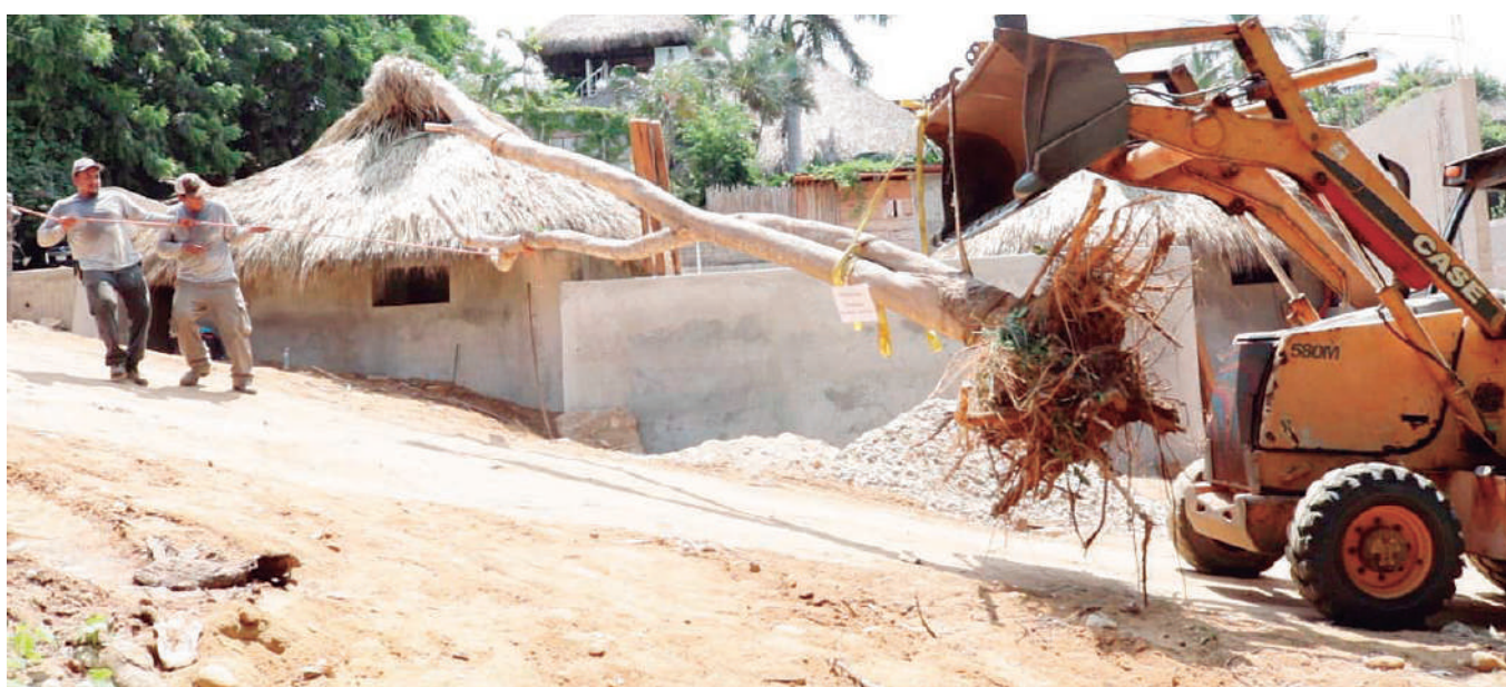
La proyección del próximo 15 de julio es por los festejos de los cinco años de la casa productora.

“Puerto no Escondido” es un documental de 16 minutos en el que Rojas se inspiró en la literatura de Eleuterio Gopar, un historiador independiente y originario de San Pedro Mixtepec.