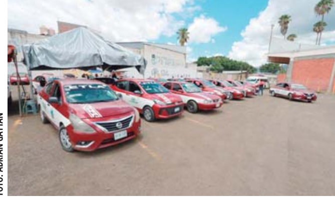
■ Hacinamiento, inseguridad y nula infraestructura en las nuevas "bases" de taxis foráneos.