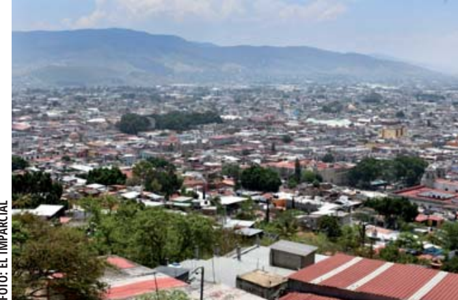
■ Zona metropolitana de la ciudad de Oaxaca, creciente aumento de población con consecuente demanda de servicios.

Envejecimiento, reto demográfico para la entidad; edad mediana pasará de 19 años a entre 33 y 40 años en 2050