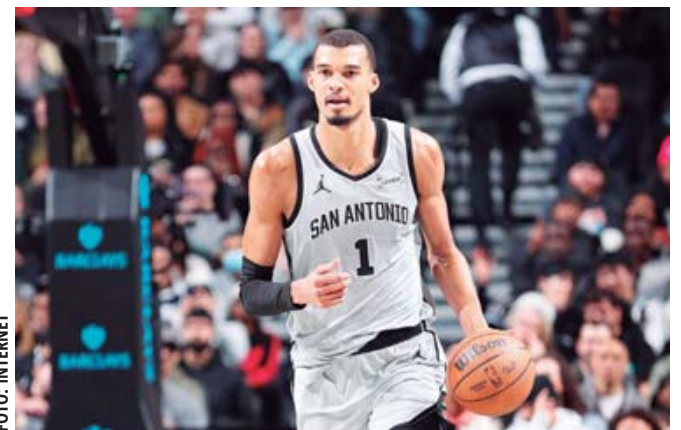
Victor Wembanyama acuerda con los San Antonio Spurs una extensión de contrato por cinco años.