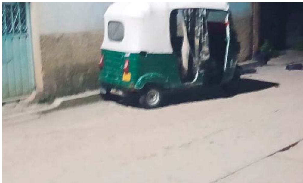
Vecinos de la demarcación notaron que un mototaxi de color verde se encontraba estacionado de manera inusual.