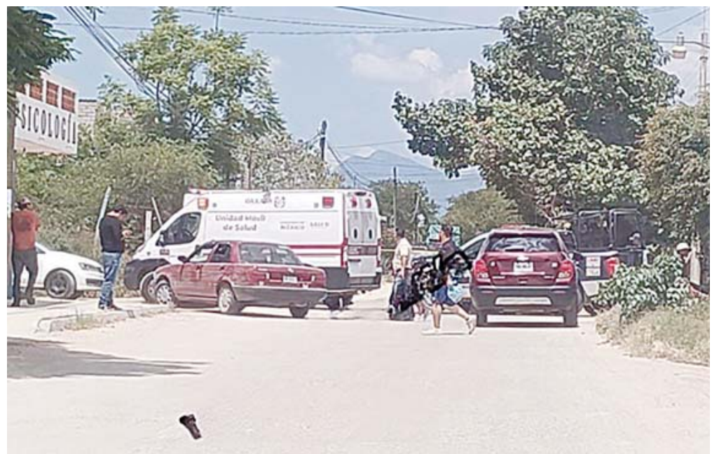
Elementos de la Policía Municipal acordonaron el perímetro del taller "El Búfalo" tras el sangriento ataque. Peritos recabaron indicios balísticos al interior del inmueble.

Sujetos desconocidos irrumpieron en el taller "El Búfalo" para masacrar a las víctimas mientras reparaban un vehículo