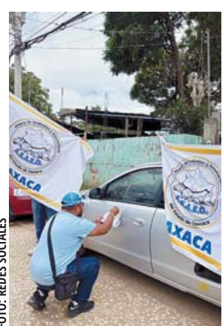
Afiliación bajo presión por parte de sindicatos violentos que, presuntamente, será frenada por el gobierno.

si todos los asociados a los sindicatos a los que dicen pertenecer están siendo presionados o si están dados de alta ante las instancias correspondientes.