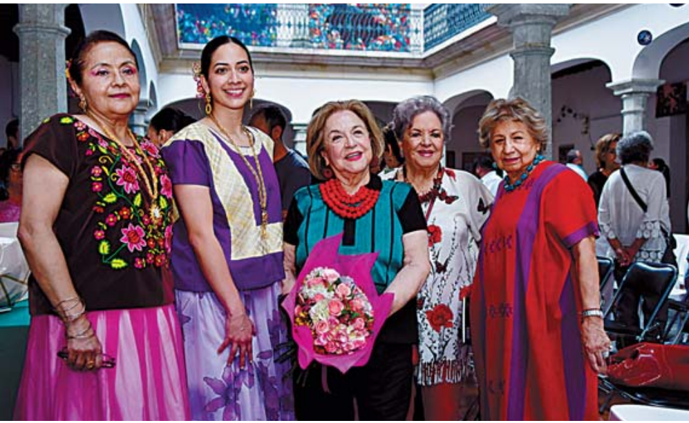
■ Distinguidas personalidades de la sociedad oaxaqueña asistieron a la presentación de la reedición del libro Margarita Toledo.

Requieren sombra parcial, riego frecuente para mantener el sustrato húmedo sin encharcar, y suelos porosos con buen drenaje. Evita el sol directo fuerte y abona cada 15 días en primavera y verano para estimular su abundante floración.