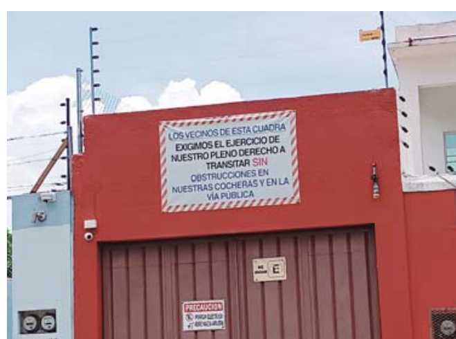
En la calle de La Reforma se mantiene la protesta de vecinos que demandan que los puestos no vuelvan a instalarse en esa vialidad.

operación de tres expoferias de Guelaguetza del 16 de julio al 3 de agosto. En ese entonces, nuevamente hubo inconformidades entre y los artesanos que exigían permisos para su instalación y que ante los presuntos cobros ilegales y exorbitantes desistieron de participar. También para evitar afectaciones a los vecinos de la calle Reforma.