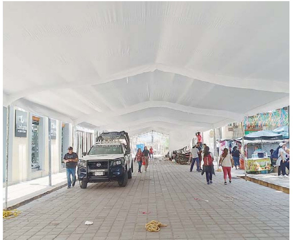
Este jueves fue colocada una carpa en la avenida Hidalgo, a un costado de la Alameda de León.

Desde temprana hora de este jueves, empleados comenzaron a instalar la carpa en la avenida, en pleno centro histórico y en la zona prohibida para el comercio en vía pública.