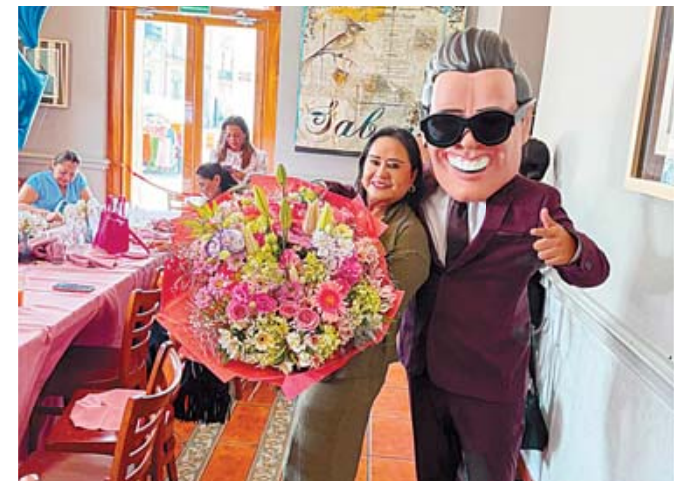
■ Las invitadas sorprendieron a la festejada con un hermoso arreglo floral y una divertida botarga de Luis Miguel.