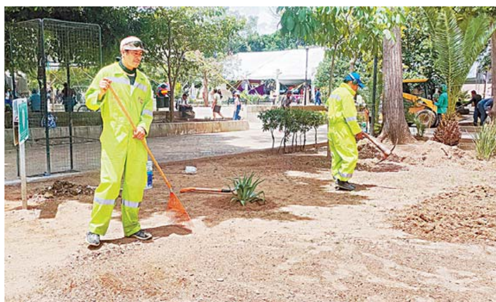
El caucho para calistenia está cancelado, pero prosiguen las obras en el Paseo Juárez, El Llano.

Estos señalamientos se suman a los que ha aportado la asociación civil Amigos del Centro His-