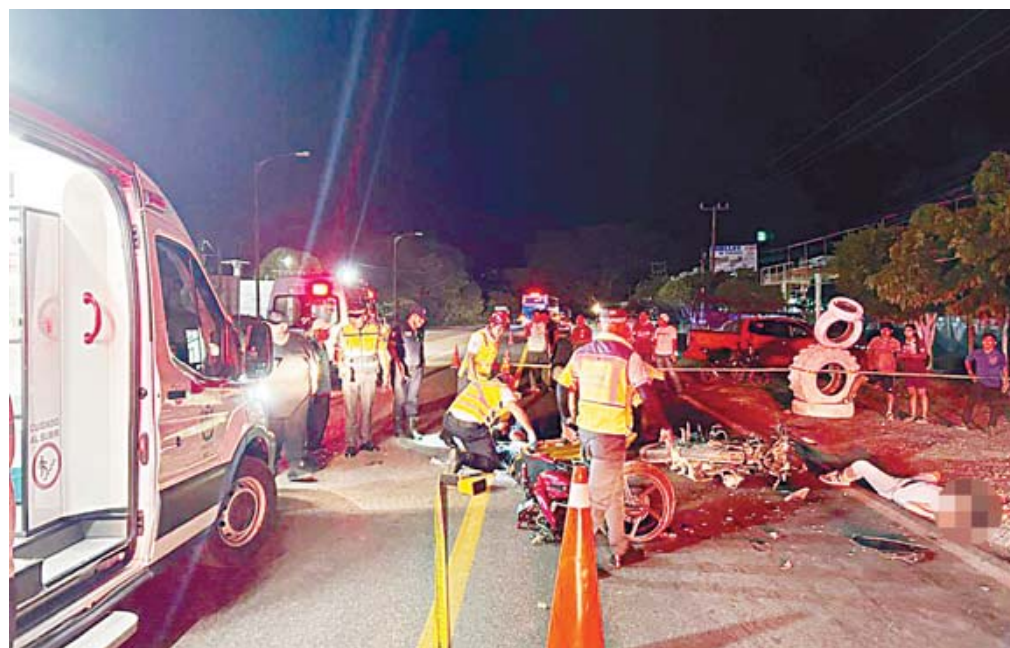
Elementos de la Policía Municipal y el Heroico Cuerpo de Bomberos auxiliaron a los tres heridos tras el fuerte impacto registrado en el acceso de la calle Porfirio Díaz.

Las víctimas, quienes viajaban a exceso de velocidad y sin casco de seguridad, terminaron intubadas en el IMSS