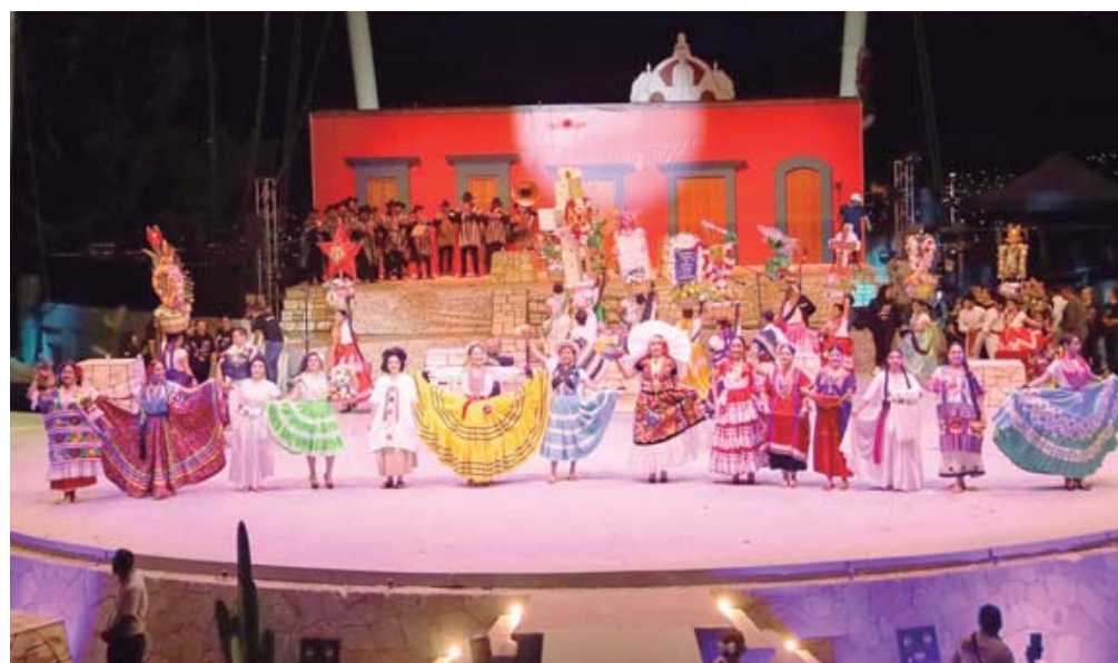
■ Ante la premura, el grupo ha tenido que reforzar sus ensayos para lograr la función.

Tras una consulta con las y los integrantes, el Grupo Folklórico se comprometió para efectuar una función, el 24 de julio. Habitualmente, han sido