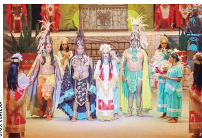
■ Se detalló que por ser una única función se ha pedido un presupuesto menor.