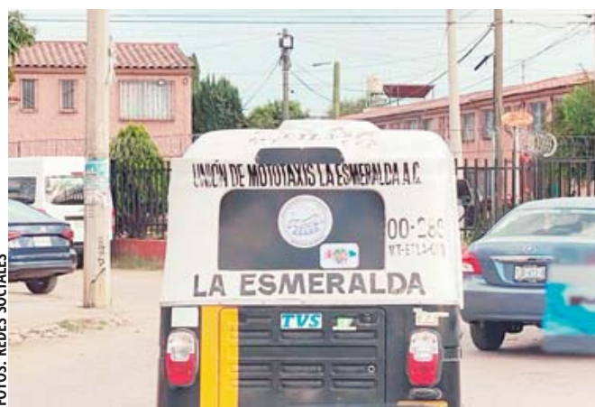
■ Habitantes de Hacienda Blanca cerraron uno de los accesos al fraccionamiento para manifestar su rechazo.

Los vecinos señalaron que la organización cuenta presuntamente con autorización de la Secretaría de Movilidad y del Ayuntamiento de San Pablo ETLA; sin embargo, expresaron su rechazo a la forma en que se estaría incorporando el servicio en la zona.