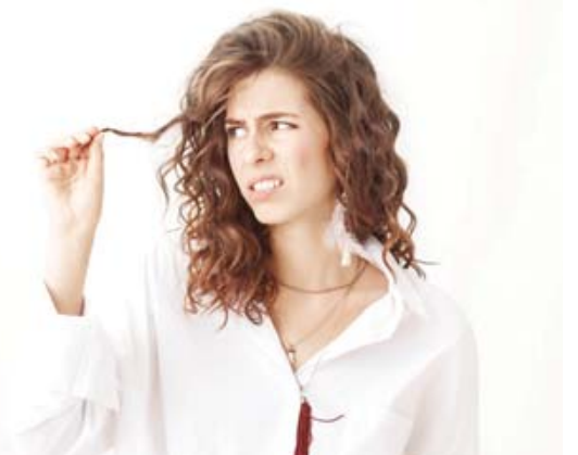
■ La caída de entre 50 y 100 cabellos al día es parte del proceso natural de renovación capilar.

Este proceso inicia con la fase anágena, en la que el cabello crece de forma activa durante varios años. Posteriormente entra en la fase catágena,