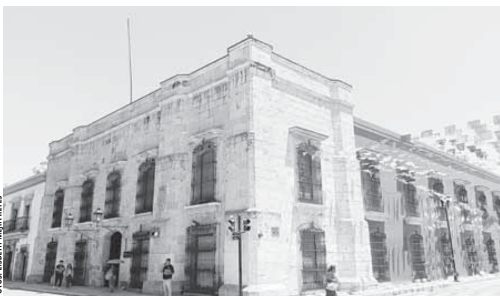
La Secretaría de las Culturas y Artes realizará una segunda votación después de las fiestas de Guelaguetza.

Aunque sí hubo preferencia por una de las tres propuestas, la Secretaría de las Culturas y Artes realizará una segunda votación después de las fiestas de Guelaguetza, con fecha por definir y en la que espera una mayor