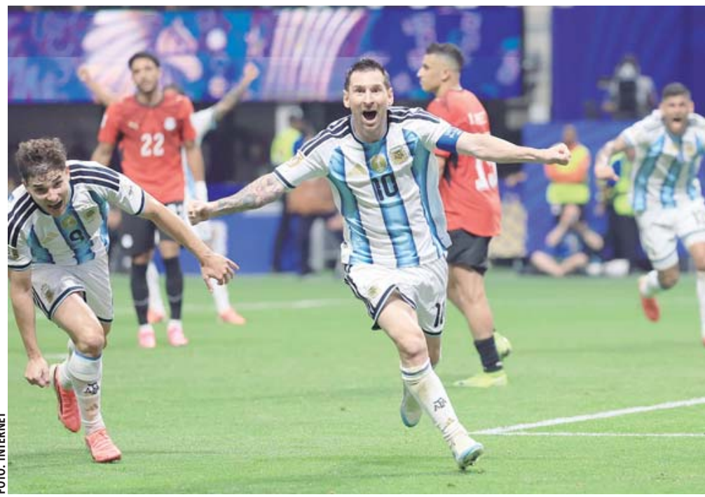
Argentina y Messi remontan un 0-2 ante Egipto, y ganan 3-2.

Argentina acusó el impacto y, aunque encontró pronto una oportunidad inmejorable con un penal sobre Nicolás Tagliafico, Messi falló desde los once pasos al minuto 20 ante Mostafa