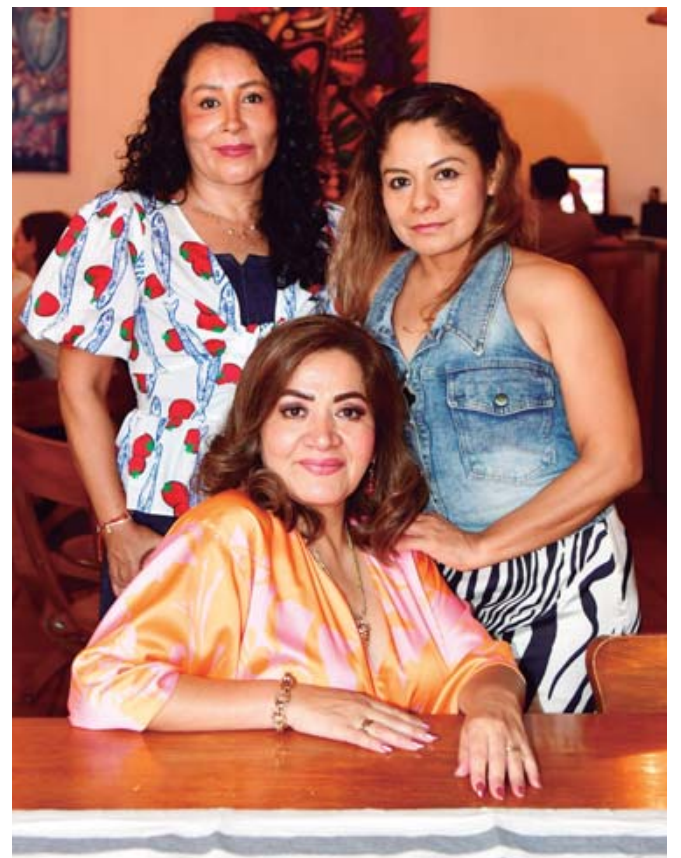
■ Las amigas compartieron una agradable mañana de convivencia.

La celebración transcurrió en un ambiente de cordialidad y convivencia, dejando gratos