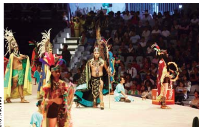
■ Rescatan la tradición dentro del programa de los Lunes del Cerro con el Bani Stui Gulal.