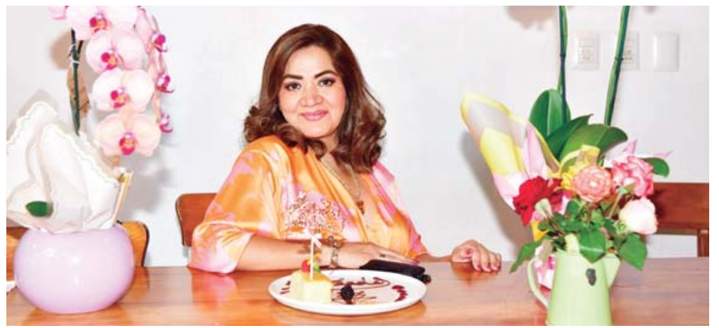
■ Las tradicionales "Mañanitas" y el corte del pastel fueron algunos de los momentos más emotivos.