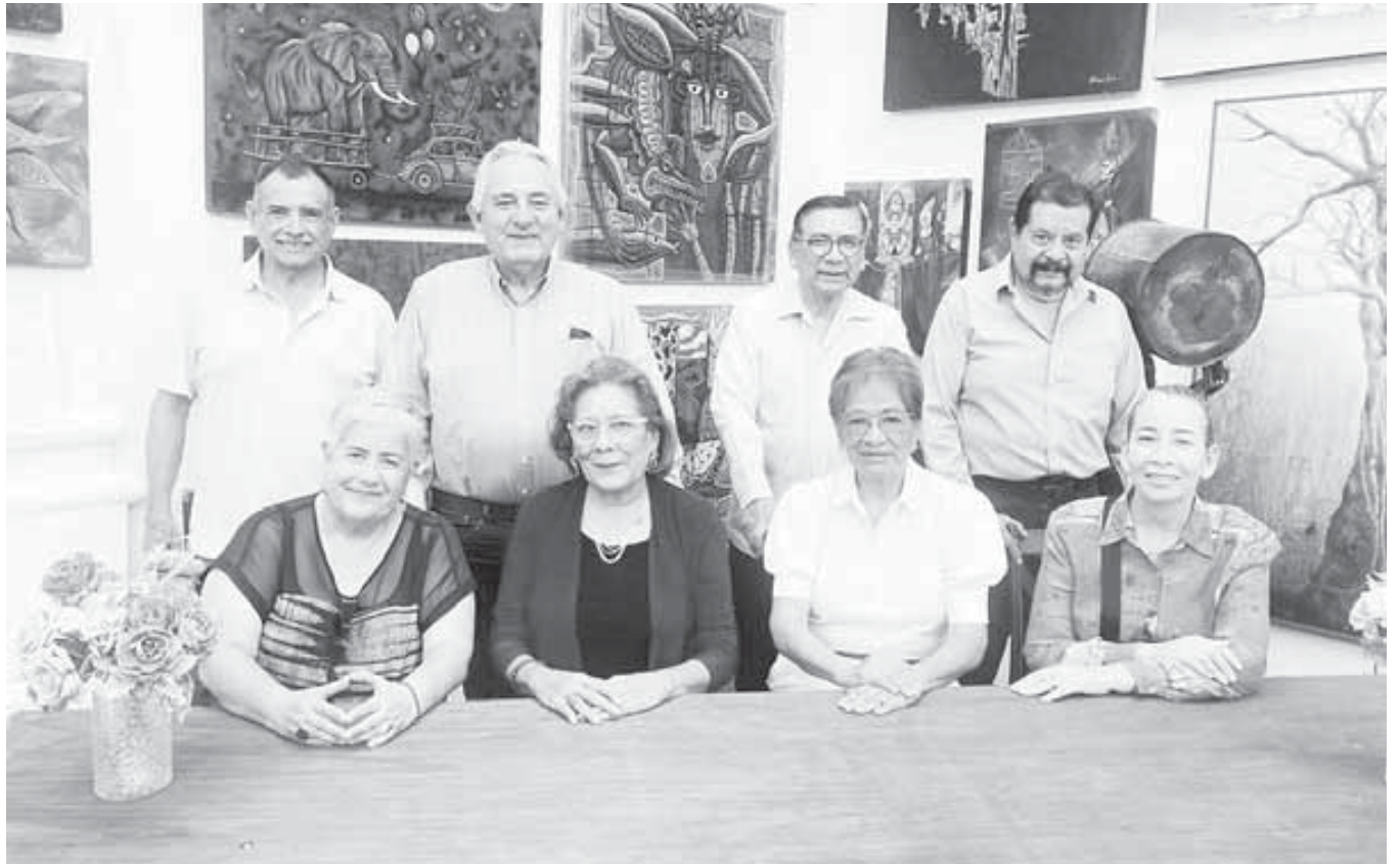
La entrega física del acervo se realizó el 6 de julio y el acto oficial se llevará a cabo hoy 8 de julio.

Actualmente, los mexicanos leen en promedio 2.4 libros al año, por lo que también se busca desalentar la compra de ejemplares pirata, los cuales no pagan impuestos, vulneran los derechos de autor y afectan directamente a la industria editorial nacional.