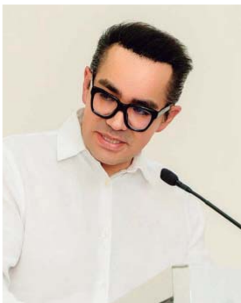
■ Juan Díaz Carranza presidente de la Comisión para la implementación del Código Nacional de Procedimientos Civiles y Familiares.

El magistrado Díaz Carranza resaltó que esta actividad se realiza sin intervención del presupuesto del Poder Judicial y mencionó que Oaxaca enfrenta retos mayúsculos, no solo por la compleja orografía, sino por otras razones de peso: La primera, es porque las personas y comunidades indígenas demanda redoblar esfuerzo para caminar de la mano con nuestros pueblos originarios y llevar