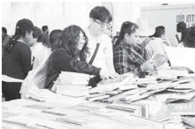
El crimen organizado produce cinco de cada diez ejemplares vendidos.