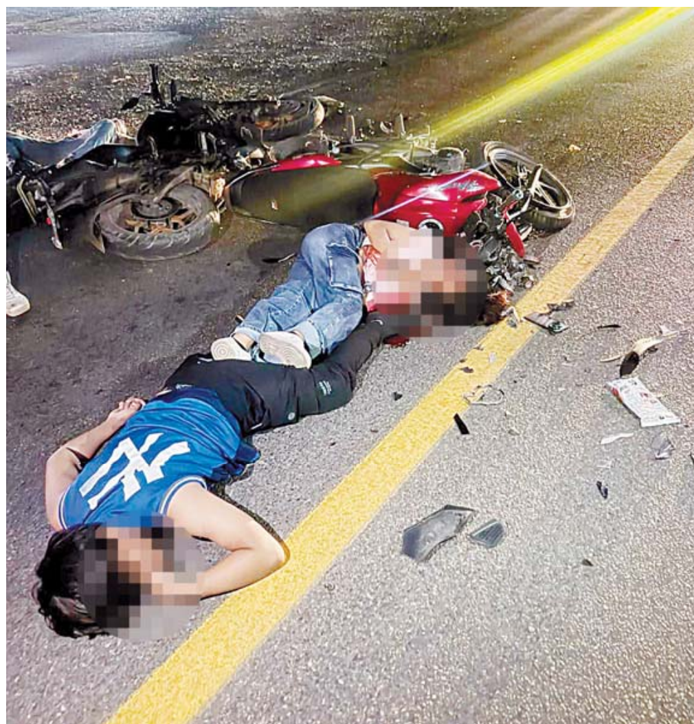
Los tres motociclistas permanecen intubados en el Hospital General de Zona del IMSS en Matías Romero debido a severos traumatismos craneales por no portar casco.

Durante las horas posteriores al siniestro, comenzaron a difundirse falsos rumores en redes sociales que aseguraban el fallecimiento de uno de los involucrados en el transcurso