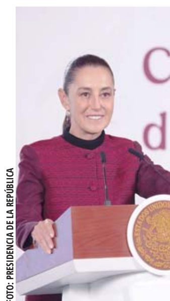
Claudia Sheinbaum, presidenta de la República.