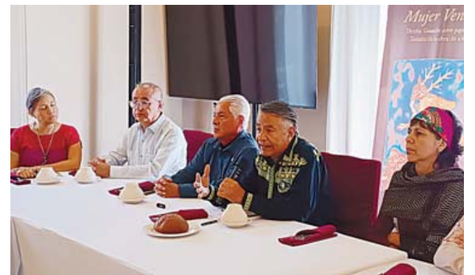
Con esta obra se busca dar un mensaje contemporáneo a esta leyenda ancestral.

La pieza está pensada para un público amplio, dijo Farrés. “Cuando hablamos de la creación de arte en Oaxaca estamos