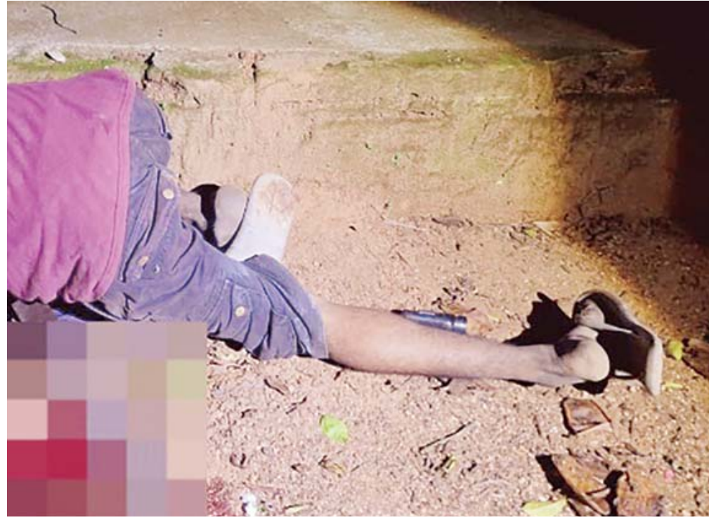
Elementos de la AEI recolectaron un casquillo percutido calibre 9mm en el paraje El Calvario tras el homicidio del joven de 27 años.

Al momento del hallazgo, el joven vestía una sudadera color vino, bermuda negra, sandalias blancas y un cinturón de tela. Una vez concluidas las diligencias en el lugar del crimen, aproximadamente a las 00:20 horas del lunes,