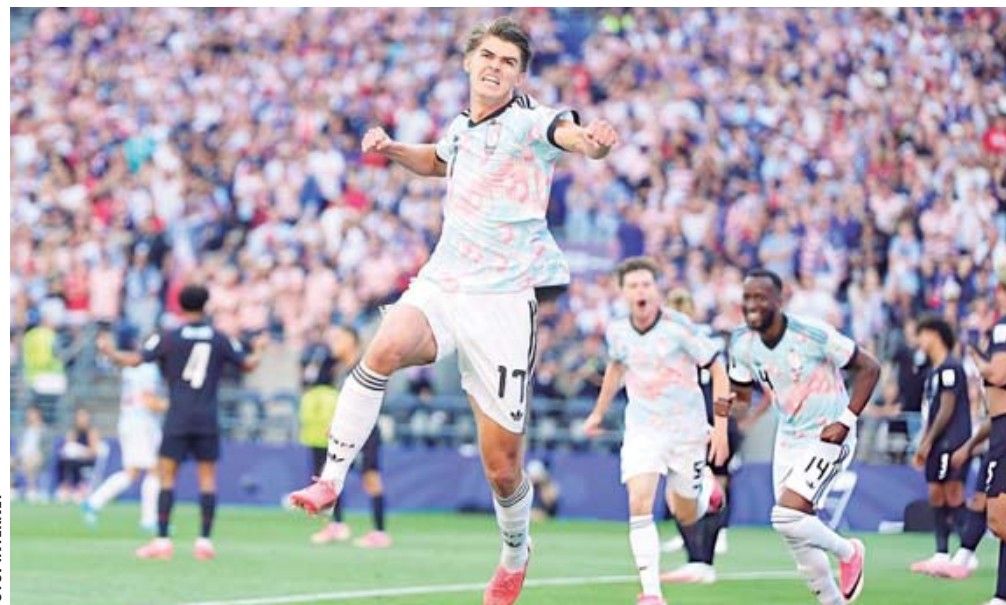
■ Bélgica golea 4-1 a Estados Unidos y avanza a los cuartos de final del Mundial.

respondió rápidamente con un segundo gol de De Ketelaere tras un centro desde la banda de Leandro Trossard, recuperando la ventaja antes del descanso. La primera mitad reflejó el dominio belga en posesión y creación de oportunidades, mientras que Estados Unidos tuvo que replegar-se en varias ocasiones.