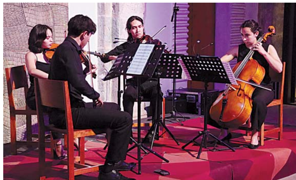
Con un concierto inaugural en el Centro Cultural San Pablo dio inicio la séptima edición del Festival Internacional de Cuerdas SA’Oaxaca.

El festival se desarrolla del 5 al 18 de julio y contempla más de 20 actividades artísticas y académicas, entre ellas conciertos, clases magistrales, talleres y conferencias dirigidas tanto a estudiantes como al público en general. La programación incluye obras de compositores clásicos como Ludwig van Beethoven y Johannes Brahms, así