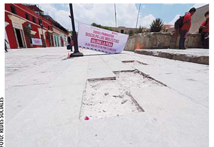
Entre los espacios en los que se apresura el remozamiento están la Plaza de la Constitución y sus alrededores.

En esta ocasión, las esculturas volvieron a