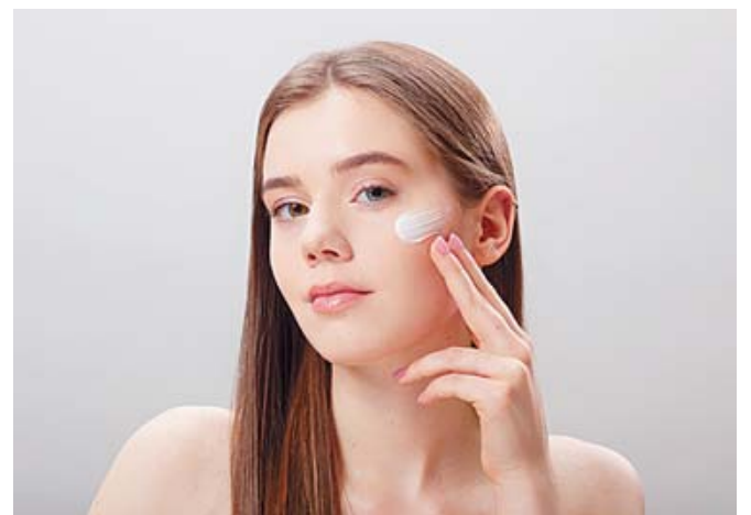
El protector solar, junto con ingredientes como retinol, forman parte de una rutina efectiva para prevenir el envejecimiento.

La radiación ultravioleta es considerada el