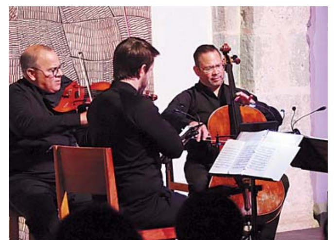
Este festival es considerado el primer encuentro de música de cámara especializado en instrumentos de cuerda que se realiza cada verano en la entidad.