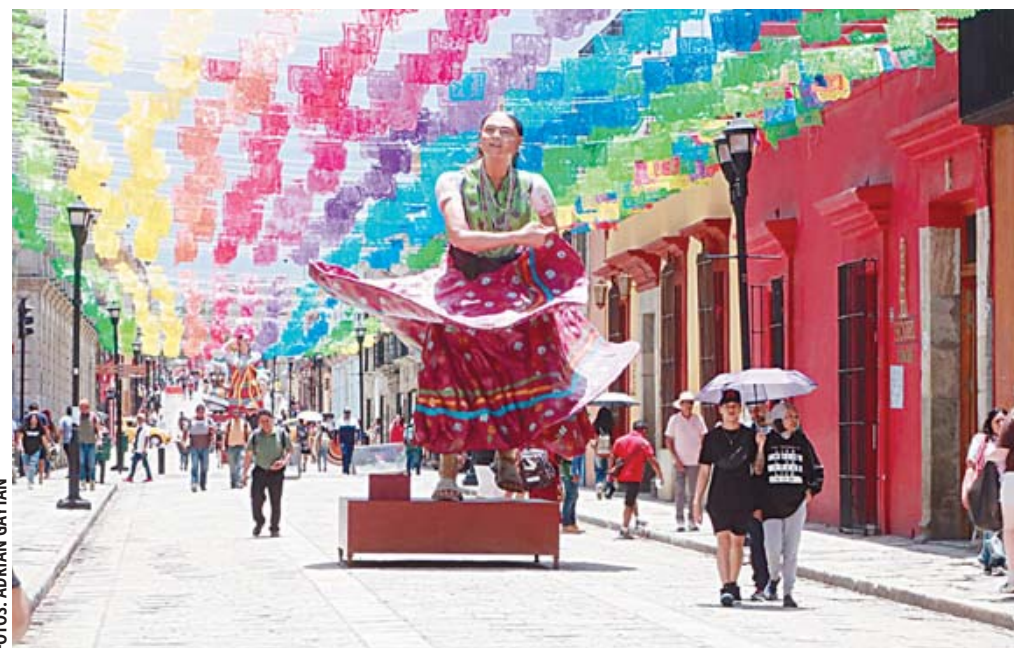
Las esculturas volvieron a ser colocadas en la calle Macedonio Alcalá (andador turístico), paso obligado de visitantes.

Entre los espacios en los que se apresura el remozamiento están la Plaza de la Constitución (zócalo) y sus alrededores. En las últimas semanas, luego de que se retiró el plantón de la Sección 22, decenas de empleados han repintado las bancas metálicas y las esculturas con las que el gobierno representa la