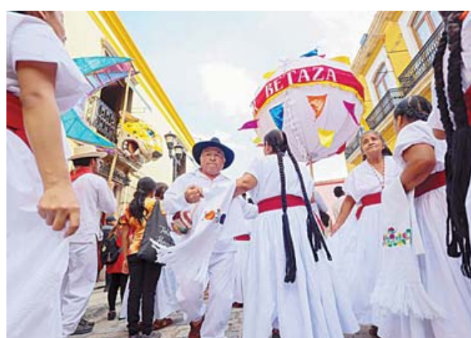
Con trajes típicos, música y bailes tradicionales, personas mayores de las ocho regiones de Oaxaca protagonizaron esta edición.

gaciones recorrieron el Centro Histórico de Oaxaca de Juárez hasta arribar a la Plaza de la Danza.