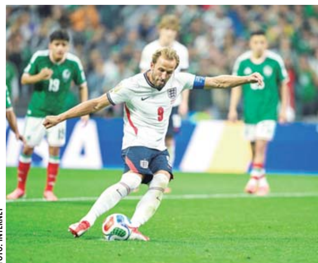
■ Harry Kane marcó de panel ante México.