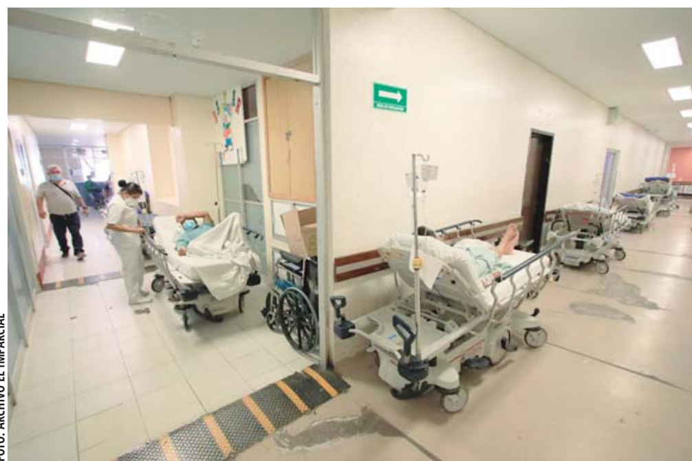
Deficientes medidas sanitarias en hospitales públicos e incluso privados.

Este acumulado ubica a Oaxaca en el décimo primer lugar de los estados del país con el mayor número de casos, donde los más afectados son menores de edad y perso-