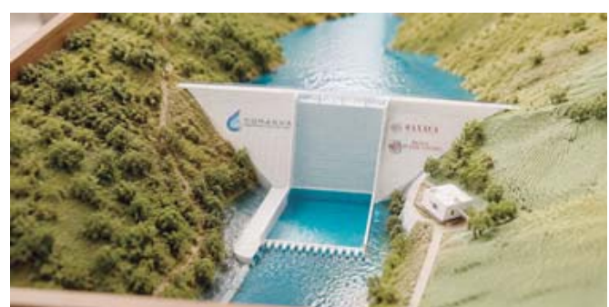
Presa Mujer Solteca, carrera de obstáculos.

Recordó que los beneficiarios de la Pensión Adultos Mayores, reciben 6 mil 400 pesos; de la Pensión Mujeres Bienestar, 3 mil 100 pesos; de la Pensión para personas con discapacidad, 3 mil 300 pesos; del programa de Madres Trabajadoras, mil 650 pesos y de Sembrando Vida 6 mil 450 pesos.