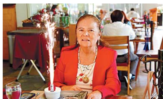
La festejada disfrutó de un agradable desayuno, pastel y las tradicionales "Mañanitas".

en una fecha tan especial, las tradicionales "Mañanitas" resonaron para homenajear a la festejada, quien agradeció las muestras de cariño y los buenos deseos recibidos en este