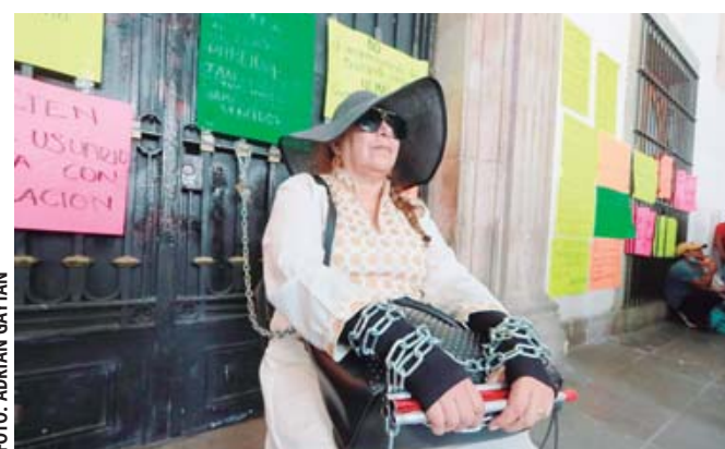
Una usuaria invidente se encadenó en Palacio de Gobierno pues el reordenamiento ha complicado su movilidad en la ciudad.

Las protestas, a las que también se sumaron comerciantes y usuarios, fueron principalmente en contra Semovi, que desde junio comenzó a restringir el acceso de las unidades al centro de la capital y finalmente las reubicó en dos estacionamientos improvisados en la central camionera y en las riberas del río Atoyac, cerca de las bodegas de Sahuayo.