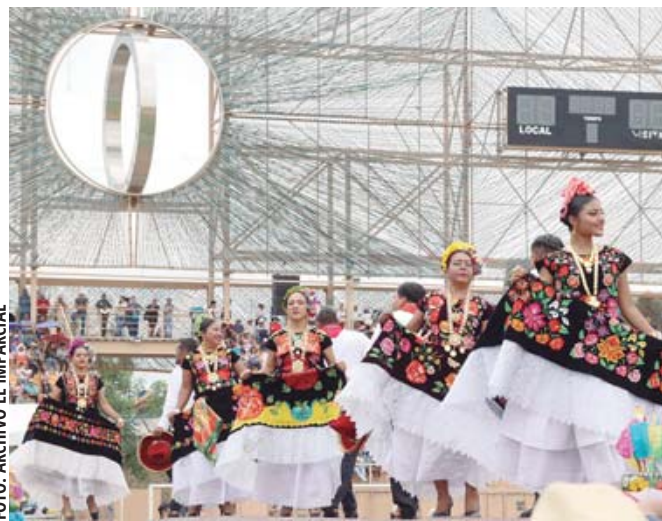
■ Alistan la presentación de la Guelaguetza del magisterio.