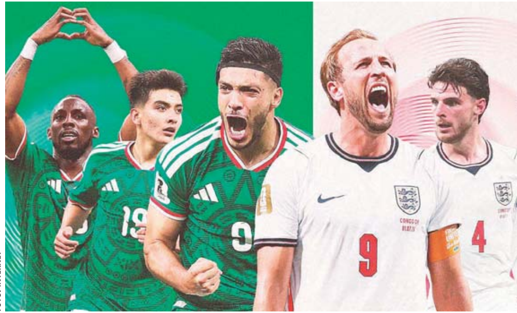
Todo listo para el partido entre México e Inglaterra, este domingo a las 18:00 horas.

Tras varias reuniones a lo largo del día, donde hubo discusiones sobre el cambio de horario, se