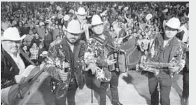
■ Han estado de gira en México, presentándose en eventos culturales en estados como Guerrero y Querétaro.

Las autoridades de su estado natal Nuevo León les han reconocido por su esfuerzo y resultados en los escenarios. "Nos acaban de entregar algunos premios por nuestra trayectoria, y eso nos motiva a seguir adelante", finalizan.