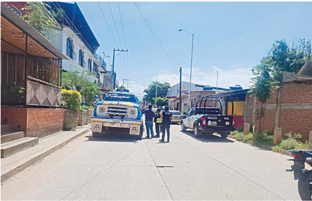
La pipa de agua fue asegurada por la Policía Vial.