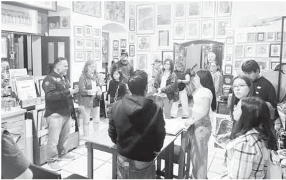
■ Proponen un recorrido por la diversidad de procesos y lenguajes que mantienen vigente la plástica contemporánea.