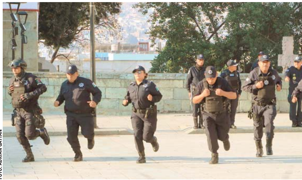
■ Prestaciones, salario digno, equipamiento, seguridad laboral, seguro de vida, igualdad de género, homologación, entre los asuntos pendientes para policías de Oaxaca.

La policía de Oaxaca, con un salario mensual neto de 12 mil 921, alrededor de 430 pesos diarios, es la quinta peor pagada del país; además, está den-