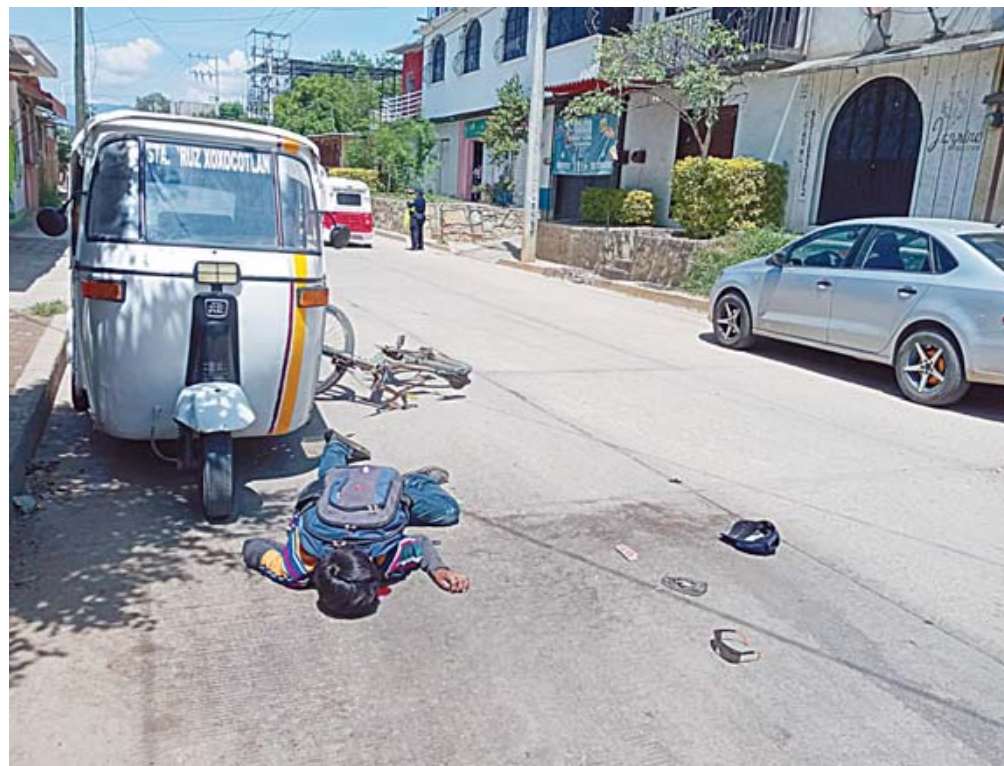
La víctima circulaba en su bicicleta cuando presuntamente rozó el espejo retrovisor de un automóvil que se encontraba estacionado en una zona prohibida.

De acuerdo con el informe de la Policía Vial