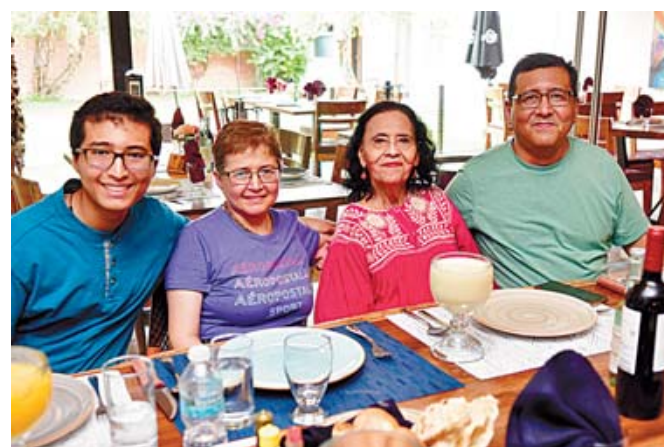
■ Familiares de distintas generaciones disfrutaron de una tarde llena de calidez y afecto.

Durante la reunión, familiares de distintas