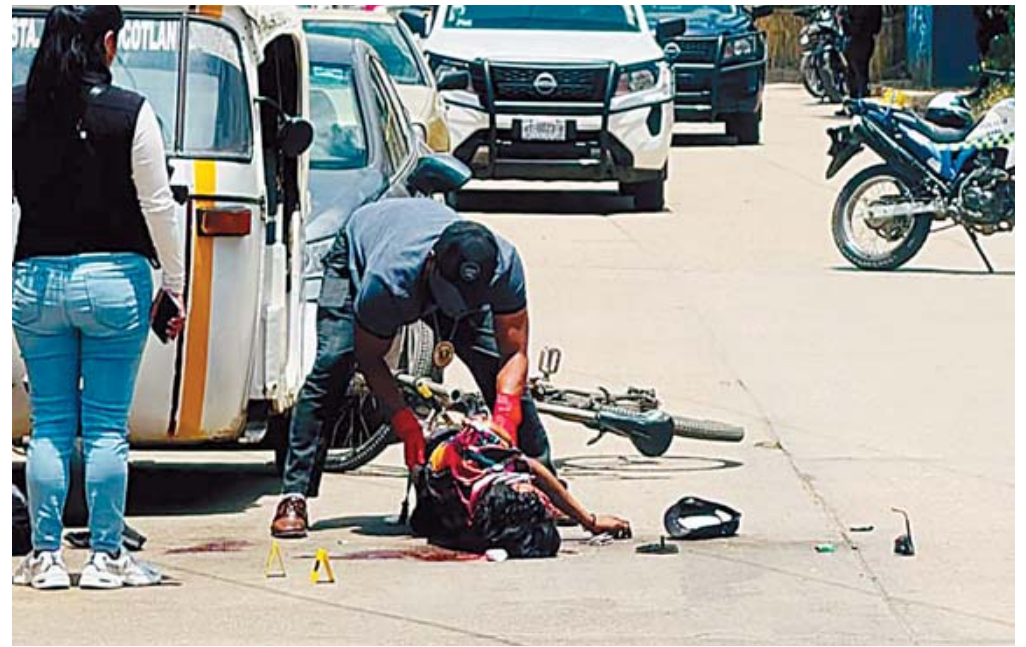
Paramédicos de Protección Civil confirmaron el deceso del ciclista.

La víctima perdió el control tras rozar un auto mal estacionado y cayó bajo las llantas del camión cisterna