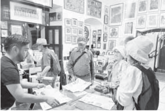
■ "Gráfica Nacional" será inaugurada el viernes diez de julio a las 19:00 horas.