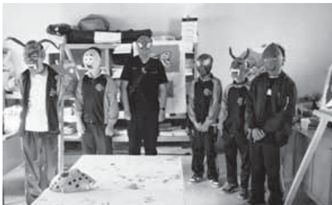
■ Los pequeños expositores explicaron a los asistentes las técnicas y materiales utilizados en la elaboración de sus obras.

La exposición permitió a los familiares, docentes, terapeutas e invitados apreciar la creatividad y el esfuerzo plasmados en cada uno de los trabajos elaborados por los estu-