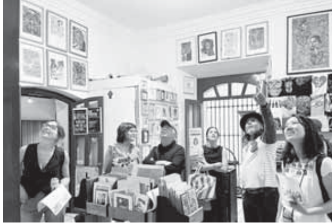
■ La exposición tendrá la intervención de más de 40 artistas visuales y plásticos del país.