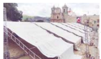
■ Retiraron las estructuras del Mundial Vecinal de la Plaza de la Danza.