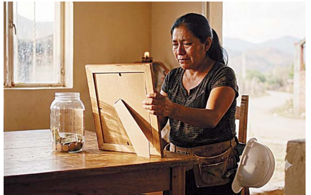
■ En Oaxaca el tiempo corre en contra de una familia que debe procesar el duelo en medio de una colecta forzada contra el reloj.