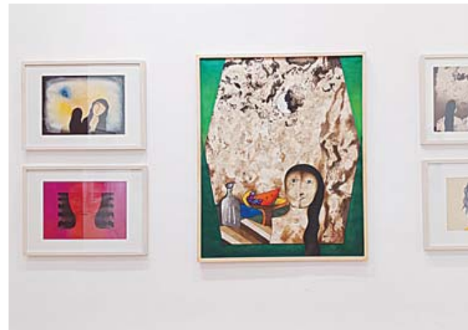
Esta exposición estará abierta al público hasta el 3 de septiembre, en el MUPO.