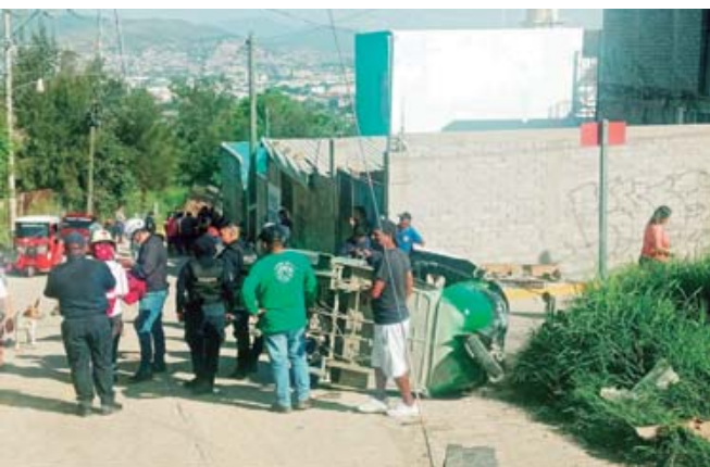
Paramédicos y vecinos unieron esfuerzos en San Antonio de la Cal para rescatar a las víctimas del mototaxi que terminó llantas arriba.

El fuerte percance vial se registró durante las últimas horas en una de las principales vialidades de esta demarcación conurbada a la capital