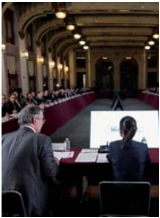
■ Claudia Sheinbaum recibió a representantes empresariales en Palacio Nacional.

Pide Sheinbaum a la IP cuidar inversiones