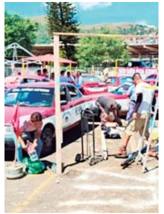
■ La improvisación en nuevas “bases” de taxis foráneos.

Caos, irritación y amenazas al reordenar taxis