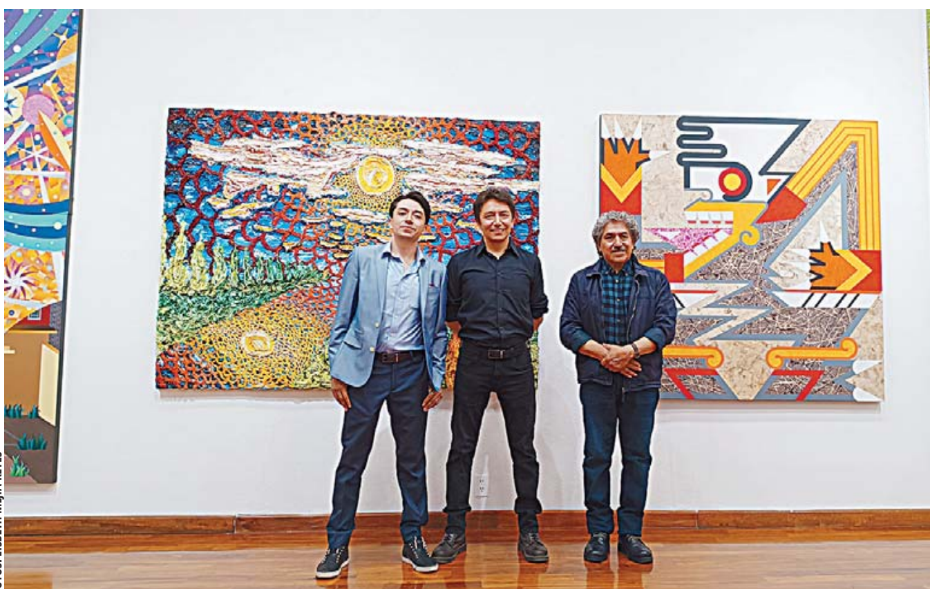
La exposición reúne 35 piezas de pintura, obra gráfica y digital, además de animación y material documental.