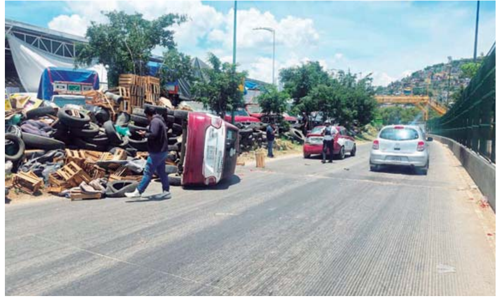
El taxi foráneo de Santiago Tenango terminó volcado y con severos daños materiales tras chocar lateralmente contra otro vehículo de alquiler en las inmediaciones del mercado.

Un veloz impacto lateral entre dos unidades de alquiler movilizó a los cuerpos de rescate a la altura de las bodegas de fruta