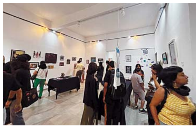
La muestra está integrada por obras de estudiantes del área de Artes Plásticas y Visuales.

Por ahora, la participación en la votación ha sido alta y se espera que en estos días expresen su voto las y los estudiantes de artes, artistas oaxaqueños y ciudadanía en general.