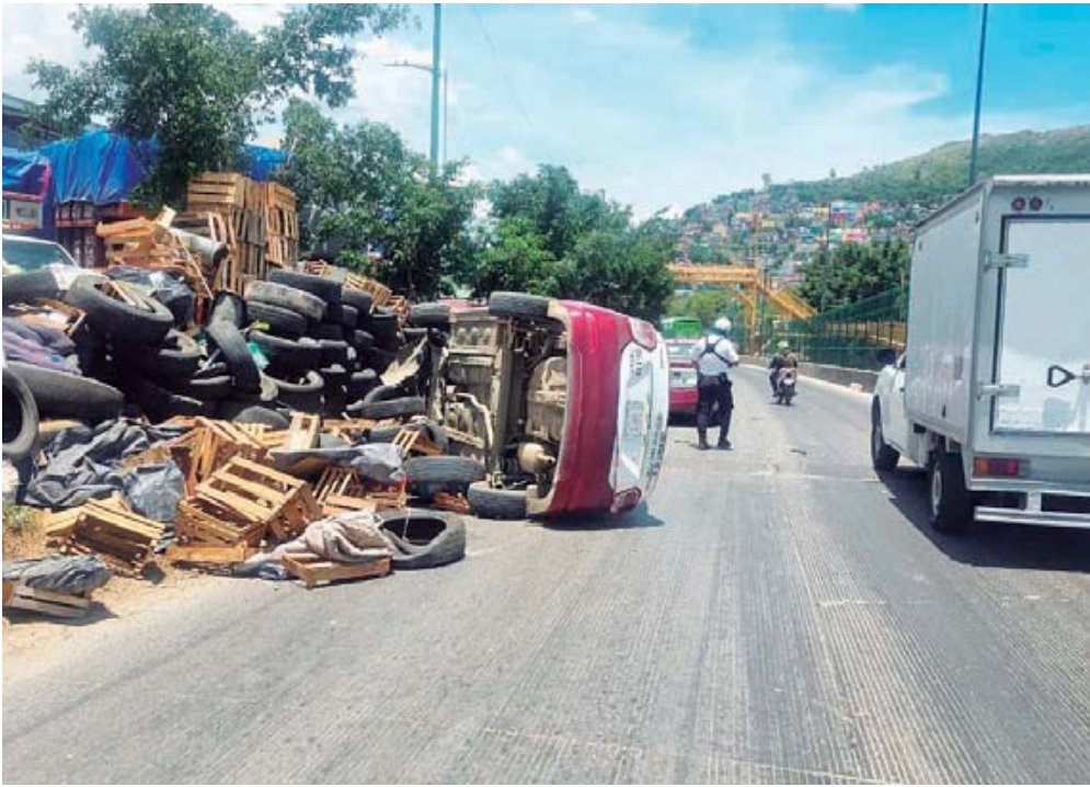
La unidad de pasaje resultó con severas deformaciones en su parte frontal izquierda y daños totales en prácticamente todo el costado derecho.

El aparatoso percance se registró aproximadamente a las 12:40 horas del jueves 02 de julio sobre la transitada vialidad de las Riberas del río Atoyac. El punto de impacto ocurrió justo a la altura de la zona de las bodegas de fruta, un sector con alta afluencia peatonal y comercial que complicó el paso de las unidades de emergencia.