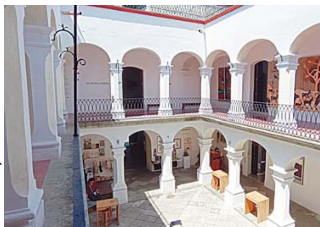
Se espera que sea el próximo 6 o 7 de julio cuando se conozca el resultado de la votación.

realizar a través de la plataforma digital Google Forms, disponible en el siguiente enlace: