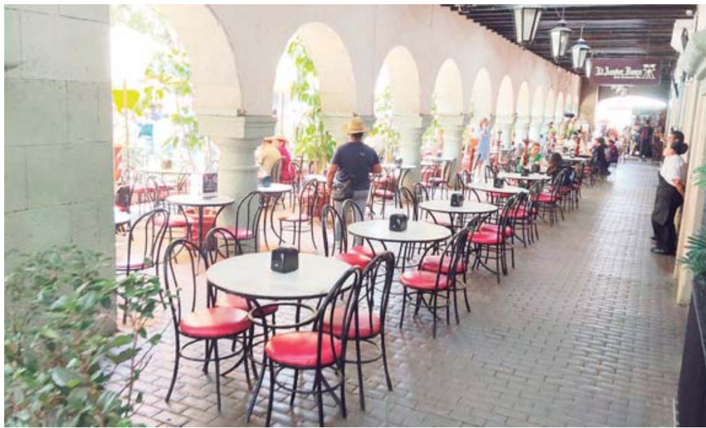
■ Con tiendas de campaña de profesores frente a los negocios, los restauranteros tuvieron pérdidas que nadie va a resarcir.