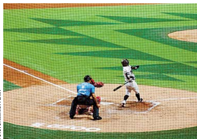
■ Los Diablos Rojos del México se quedaron con el tercer juego de la serie al derrotar a Guerreros 9 carreras por 4.

En la quinta alta, Moisés Gutiérrez abrió el ata-