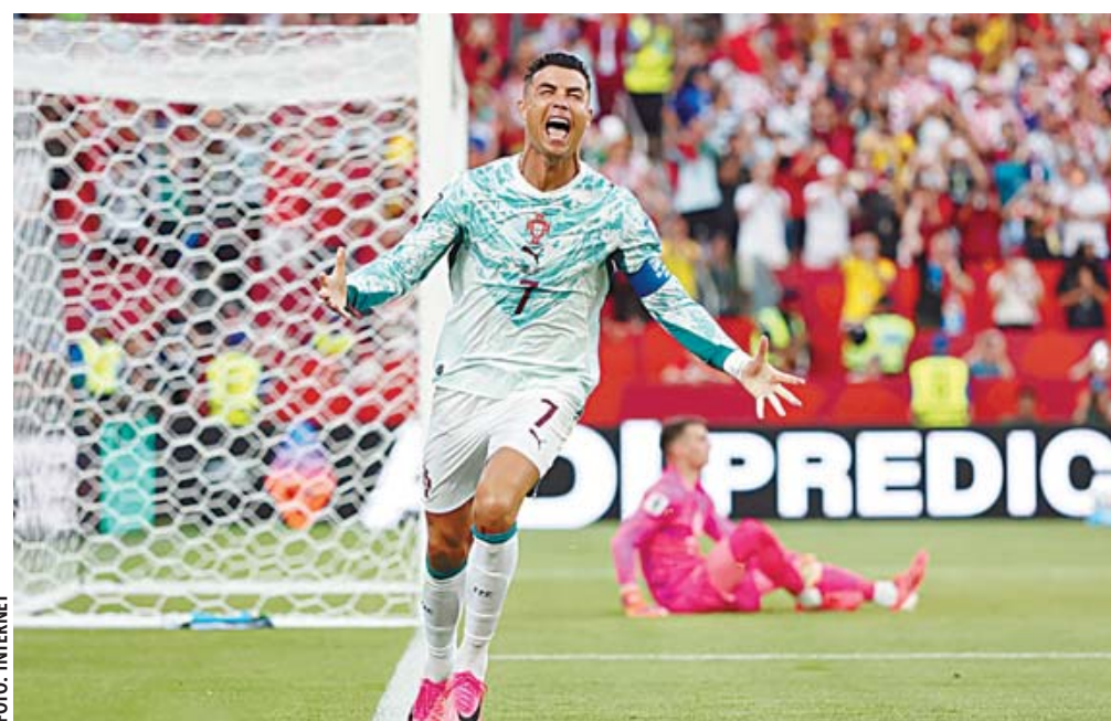
■ Cristiano Ronaldo igualó a los 68 minutos desde los 11 pasos y Gonçalo Ramos marcó el 2-1 para Portugal ante Croacia.

Portugal comenzó con mayor presencia en campo rival. Pedro Neto, Rafael Leão y Bruno Fernandes participaron en las primeras aproximaciones, mientras Ronaldo tuvo una opción de cabeza al minuto 8 tras un cen-