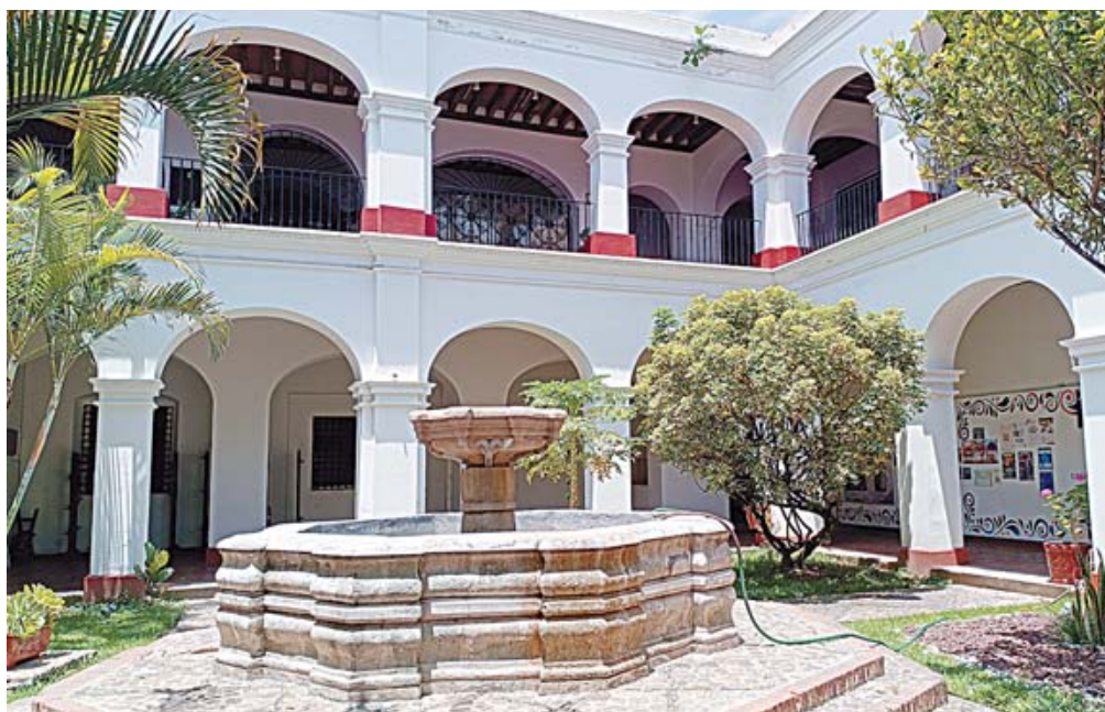
La Casa de la Cultura Oaxaqueña celebrará este 2 y 3 de julio su aniversario 55.