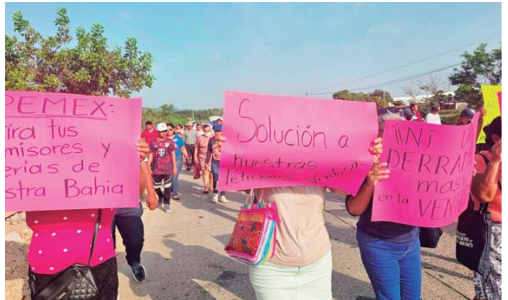
El fin de semana pobladores, comuneros y pescadores de Bahía La Ventosa marcharon en contra de PEMEX.

petroleros, el "flamazo" ocurrió mientras la planta se encontraba fuera de operación; obreros, sin identificar si eran de alguna empresa o de Pemex, realizaban la apertura de una brida cuando un remanente de hidrocarburo atrapado en la línea se liberó. Al hacer contacto con los trabajos de soldadura que se ejecutaban de manera simultánea en la periferia, se generó un flamazo inmediato.