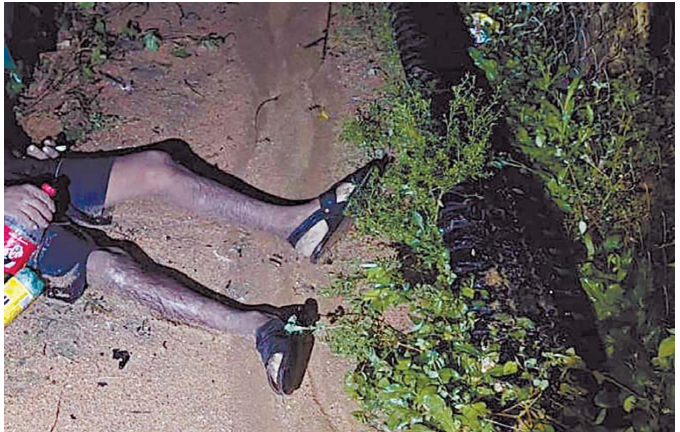
Peritos de la Fiscalía de Oaxaca recolectaron casquillos percutidos calibre .40 para integrarlos a las investigaciones del homicidio.

en el lugar del hallazgo, el cuerpo fue levantado y trasladado al descanso municipal para la práctica de la necropsia de ley, procedimiento que determinará científicamente la causa exacta del deceso. En tanto, las autoridades continúan entrevistando a los vecinos del Barrio Grande para ubicar a posibles testigos que aporten datos sobre los responsables de este homicidio, cuya carpeta de investigación ya se encuentra en integración.