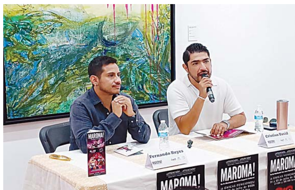
Las funciones serán los días 21 y 22 de julio, a las 17:00 y 22:00 horas.

En esta obra, que también se incluye el arte del oaxaqueño Sergio Hernández, la compañía se inspira en los antiguos acróbatas, payasos, músicos y poetas ambulantes que llevaban la tradición de la maroma a las comunidades. Todo esto a partir del personaje de