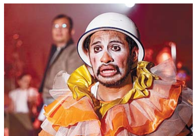
Las temporadas previas han conseguido una gran respuesta del público.

"Es un homenaje desde la teatralidad y lo que nos interesa es crear el acontecimiento con las y los espectadores, que ese espacio se vuelva vivo, y con la música, con las convenciones teatrales, con la utilización de recursos como el teatro de sombras, los títeres y la poderosa música de Pasatono, en vivo, en combinación con toda la puesta en escena y desplome técnico, es un pasaje mágico para las