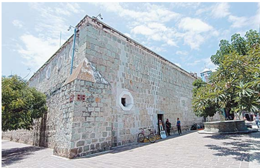
Las exposiciones de aniversario de la CCO estarán hasta el 31 de julio.