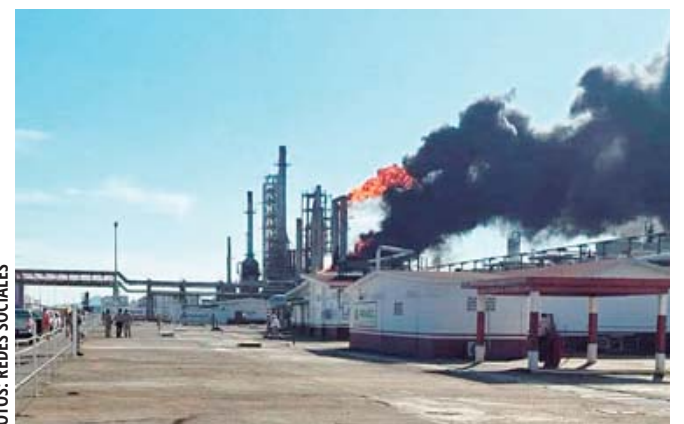
Obreros realizaban la apertura de una brida cuando un remanente de hidrocarburo atrapado en la línea se liberó.

Alrededor de las 18:00 horas, finalmente Pemex aceptó el incidente y, mediante una tarjeta informativa indicó que "durante la ejecución de trabajos de mantenimiento en la Planta de Alkilación de la Refinería Salina Cruz, se registró un fla-