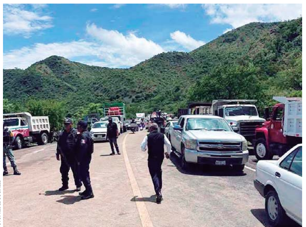
Durante la protesta los inconformes abrieron el paso algunos minutos cada dos horas.

Por segundo día consecutivo, conductores y dueños de camiones materialistas adheridos a la Confederación Internacional de Trabajadores (CIT) llevaron a cabo un bloqueo en la carretera federal 190 tramo Huajuapán-Oaxaca a la altura de la desviación a Tezoatlán de Segura y Luna contra la intervención del ASAEO en la región.