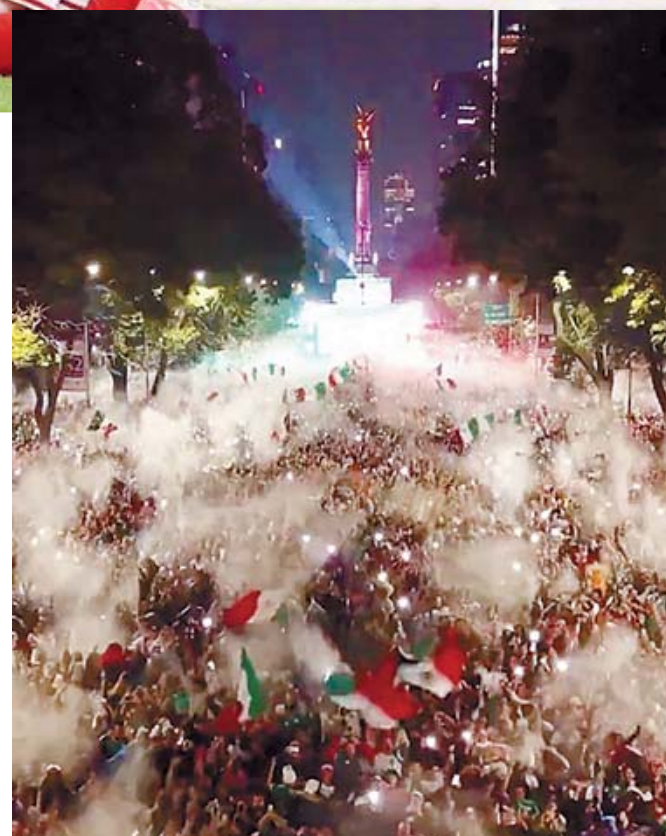
■ Miles festejan en el Ángel de la Independencia, en la Ciudad de México.

El tramo final fue para Ecuador, que adelantó líneas en busca de la remontada. México redujo el ritmo y cedió la posesión, permitiendo que la Tri intentara generar peligro con centros al área.