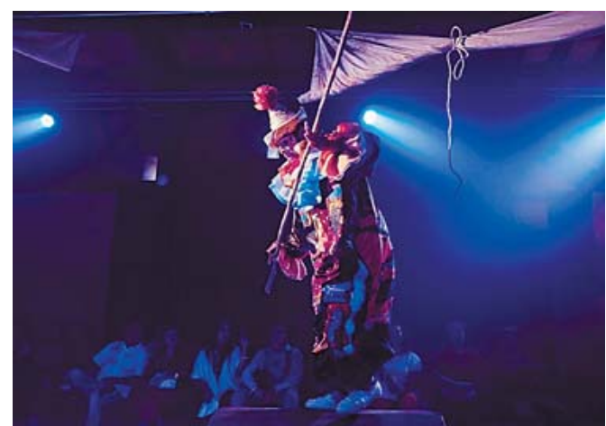
Tendrá cuatro funciones en el espacio cultural de la Ex Hacienda San José.