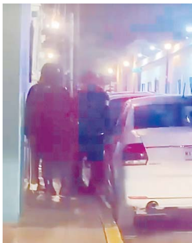
Usuarios de redes sociales compartieron ampliamente el video donde se capta el momento exacto de la agresión y exigen el cese de abusos por parte de la Policía Municipal.

La intervención cronológica de los hechos ocu-