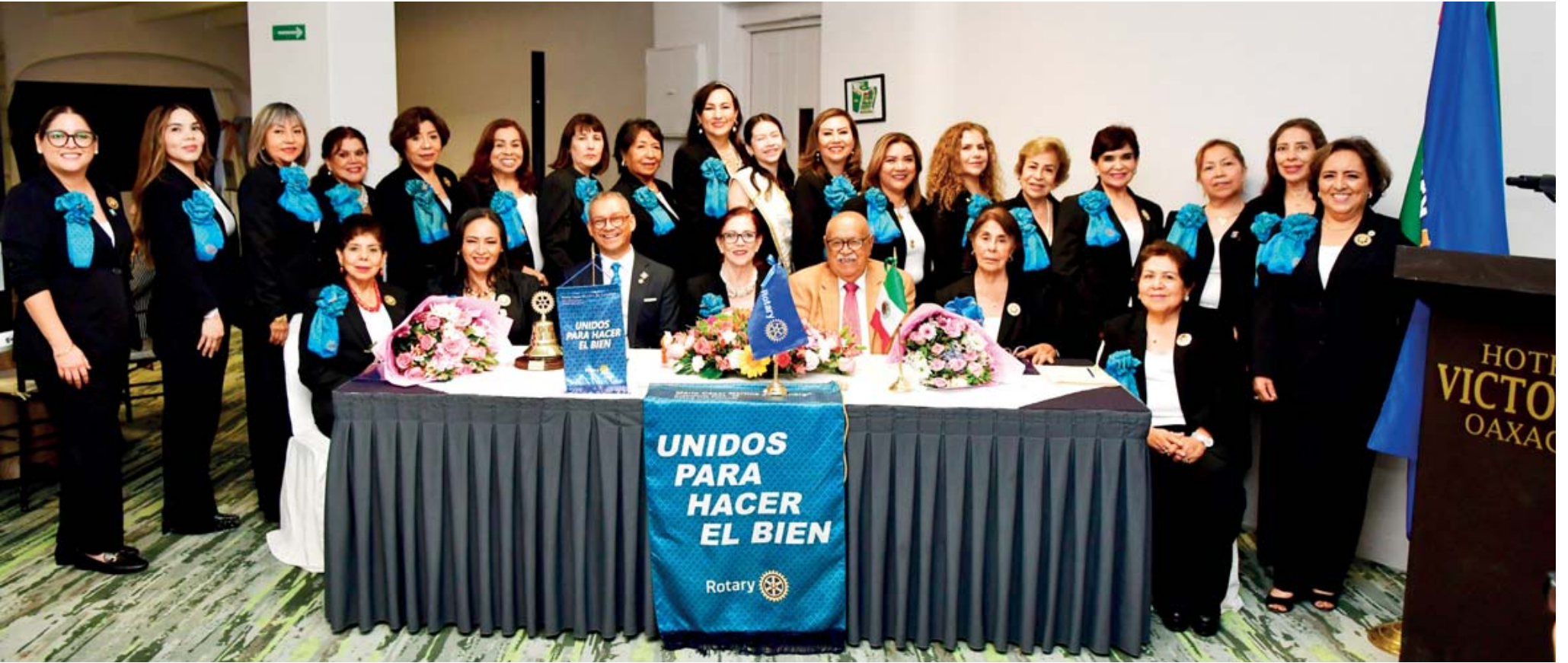
El Club Rotario celebró el cierre del Año Rotario 2025-2026 con una emotiva ceremonia realizada en un salón del Hotel Victoria.

Son plantas de exterior muy resistentes y de bajo mantenimiento que necesitan sol directo para abrir sus flores. Requieren un riego moderado (dejando secar el sustrato para evitar que se pudran las raíces), y un suelo con excelente drenaje rico en materia orgánica.