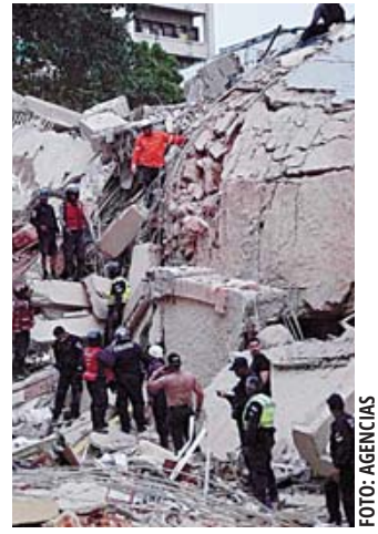
■ Nueva réplica de los sismos sacudió el lunes a Venezuela.