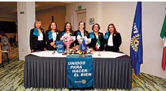
En el evento se reconocieron a las past presidentas.