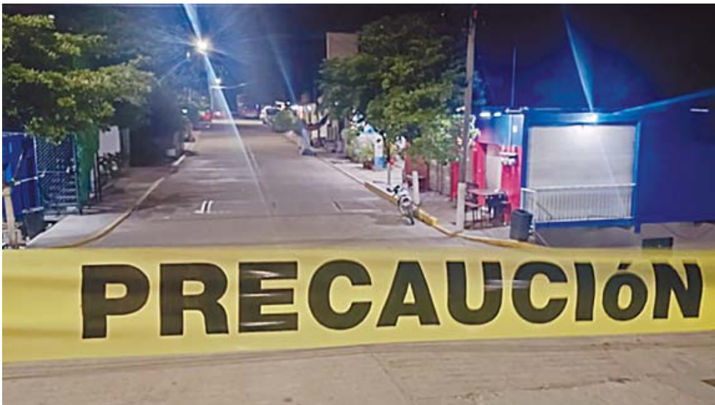
Peritos de la Fiscalía de Oaxaca recolectaron un total de 24 casquillos percutidos.