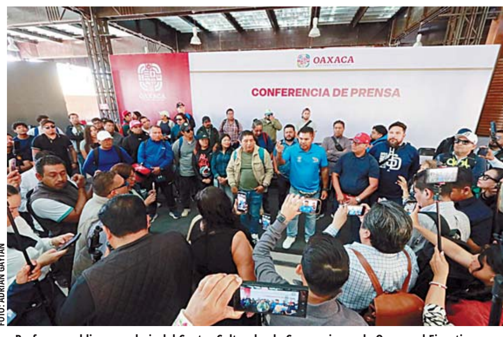
■ Profesores obligaron a huir del Centro Cultural y de Convenciones de Oaxaca al Ejecutivo y a parte del gabinete.

La conferencia matutina tuvo que ser suspendida por la presencia de los