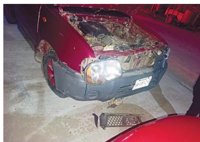
El incidente dejó únicamente daños materiales y se ignora si alguno de los involucrados requirió valoración médica.

El percance ocurrió sobre la calle Quintana Roo, entre Ricardo Flores Magón y Benito Juárez, en la colonia Oaxaqueños Ilustres, cuando una camioneta Ford F-150, color blanco, con-