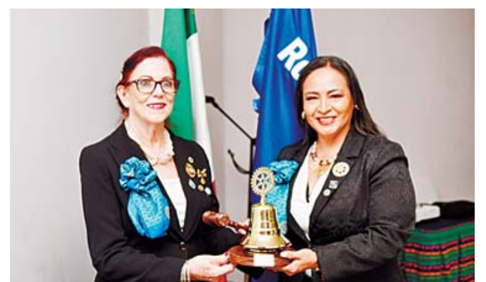
Se realizó el intercambio de la campana entre la presidenta saliente y la entrante.