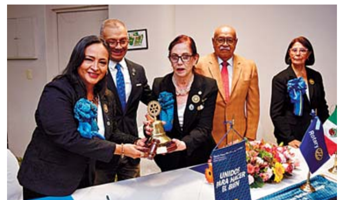
Último y primer campanazo del año rotario.