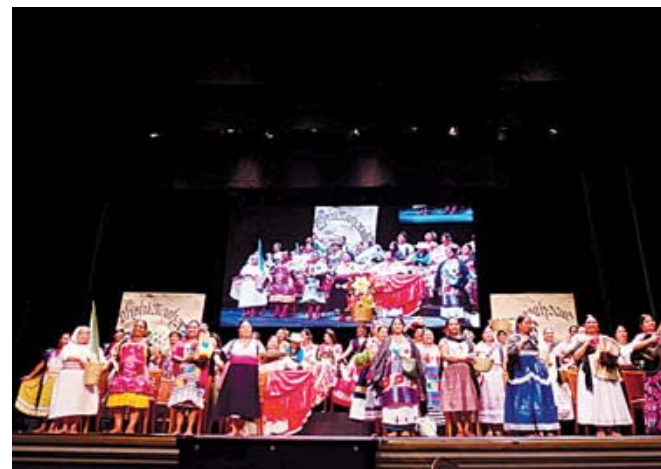
■ La elección se realizó en dos etapas en el Teatro Macedonio Alcalá.