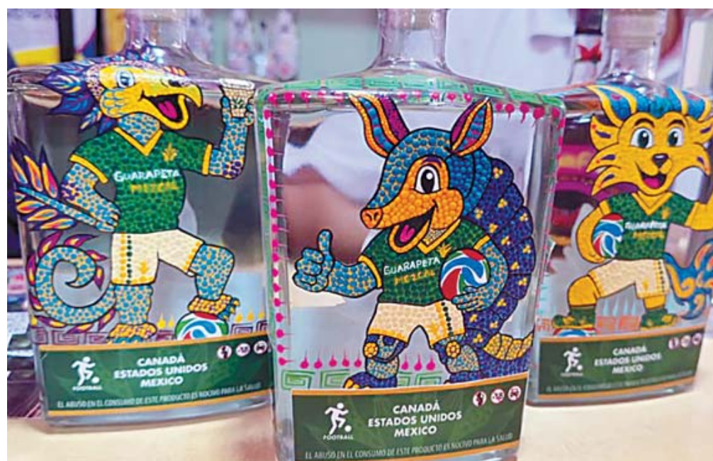
■ Mezcales artesanales, cartonería, barro negro, textiles y productos gastronómicos forman parte de la oferta de “Casa Hecho en Oaxaca”.

la cartonería, los visitantes pueden adquirir piezas de barro negro, textiles, productos gastronómicos y diversas artesanías que reflejan el talento y la creatividad de las comunida-