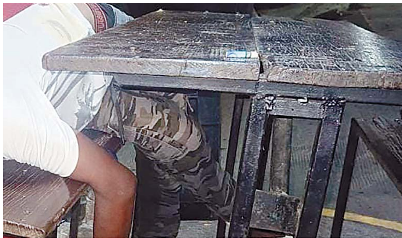
Los cuerpos del tortillero y del carpintero fueron trasladados al descanso municipal; autoridades investigan el entorno de las víctimas tras el hallazgo de presunta droga sintética.