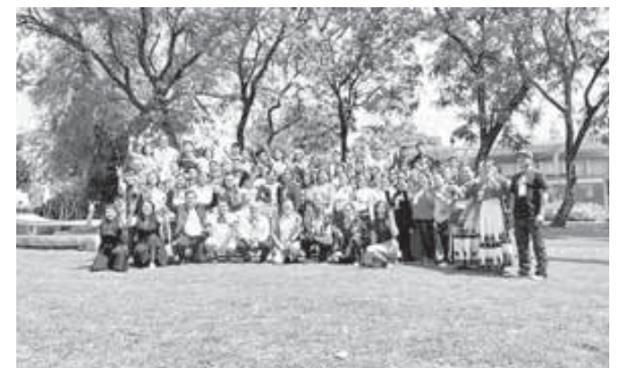
Promotores culturales y hablantes de lenguas originarias participan en un taller nacional contribuyendo a la preservación de la diversidad lingüística del país.

Debido a la relevancia de los descubrimientos, algunas áreas del predio permanecerán bajo resguardo y protección mientras continúan los estudios especializados. Se prevé que las labores de campo concluyan durante agosto de este año, mientras que el análisis de los materiales recuperados se extenderá hasta 2027.