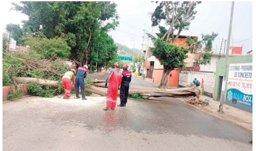
El Heroico Cuerpo de Bomberos de Oaxaca, en coordinación con autoridades municipales, realizó el trabajo de trozar y retirar los ocho árboles derribados.

A través de personal del Heroico Cuerpo de Bomberos de Oaxaca (HCBO), en coordinación con autoridades municipales, se realizó el trabajo de trozar y retirar los