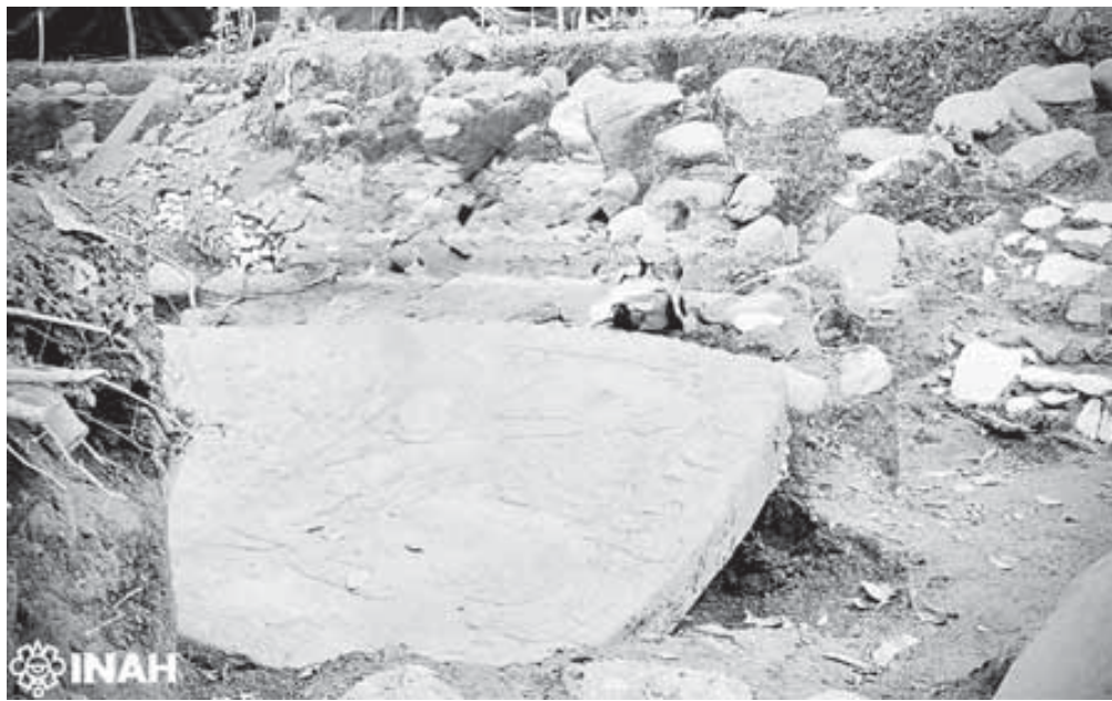
Una plataforma ceremonial y una escultura monolítica con grabados inéditos figuran entre los hallazgos.

Entre los descubrimientos destaca una plataforma de carácter cívico-ceremonial de aproximadamente 30 metros de largo por 12 de ancho, construida con lajas y piedra caliza de tonalidad blanca. La estructura presenta elementos decorativos poco comunes en la región, como diseños geométricos semejantes a cuadrados y piedras circulares colo-