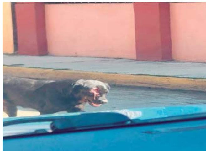
Autoridades coordinaron esfuerzos para poner a salvo al canino lesionado, el cual quedó bajo la protección de la asociación Patitas Felices.

Las acciones de búsqueda se concentraron en la Tercera Sección de