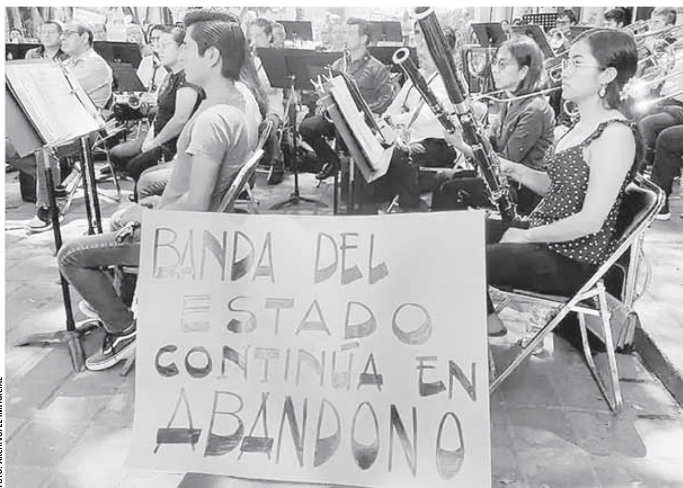
En el mes de abril los músicos se manifestaron en los conciertos “Bajo el Laurel” para exigir atención a sus demandas laborales.

Antes de esta jornada de protestas, un músico de fila adscrito al gobierno del estado percibía ingresos que, sumados a compensaciones, oscilaban apenas entre los 10 mil 700 y los 13 mil 340 pesos brutos mensuales. Con la adición de los 2 mil 500 pesos celebrados por la Seculta, el tabulador oaxaqueño apenas se moverá hacia un