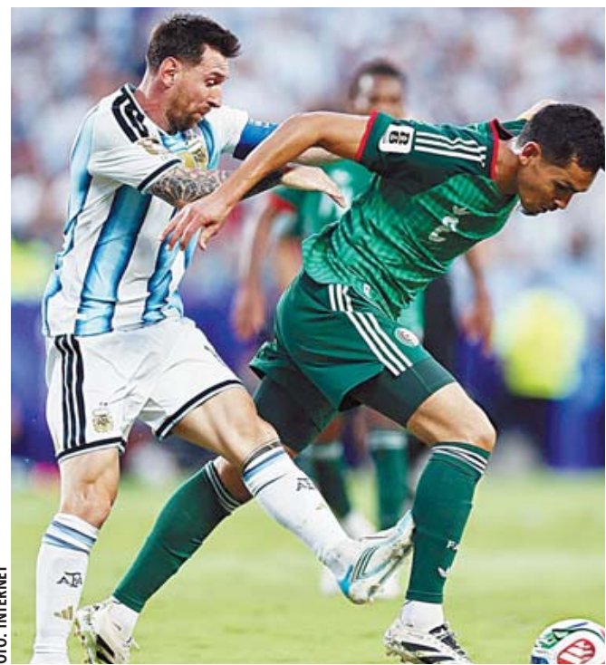
▪ Le perdonaron la roja a Messi, ante una dura entrada a un jugador de Argelia.