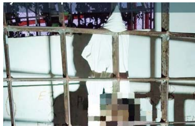
■ La Fiscalía de Oaxaca inició las diligencias y tomó declaraciones al personal de guardia de la cárcel de Santa María Colotepec.