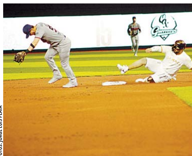
▪ Los Guerreros pierden el primer juego de la serie ante los Acereros.

Los Guerreros tuvieron oportunidades para acercarse en el marcador, des-