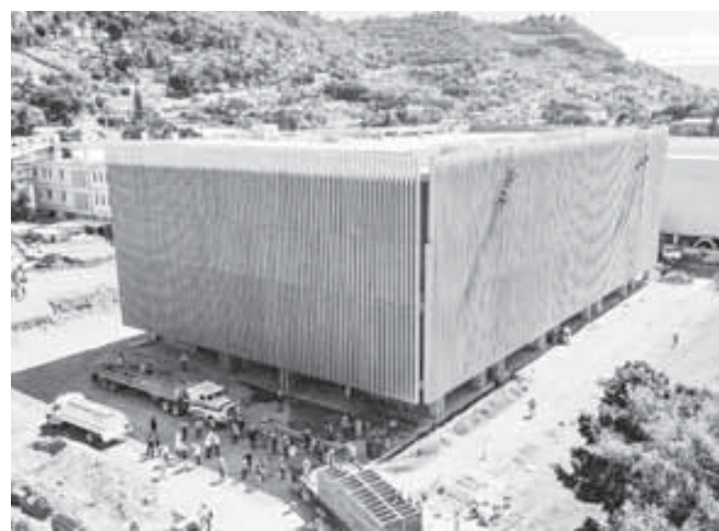
En el 2025 el gobernador también había prometido una inversión para este espacio.