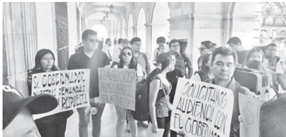
Los músicos llevaron su inconformidad al Palacio de Gobierno, en donde pidieron audiencia con el gobernador.

rango estimado de entre 13 mil 200 y 15 mil 840 pesos mensuales antes de impuestos.