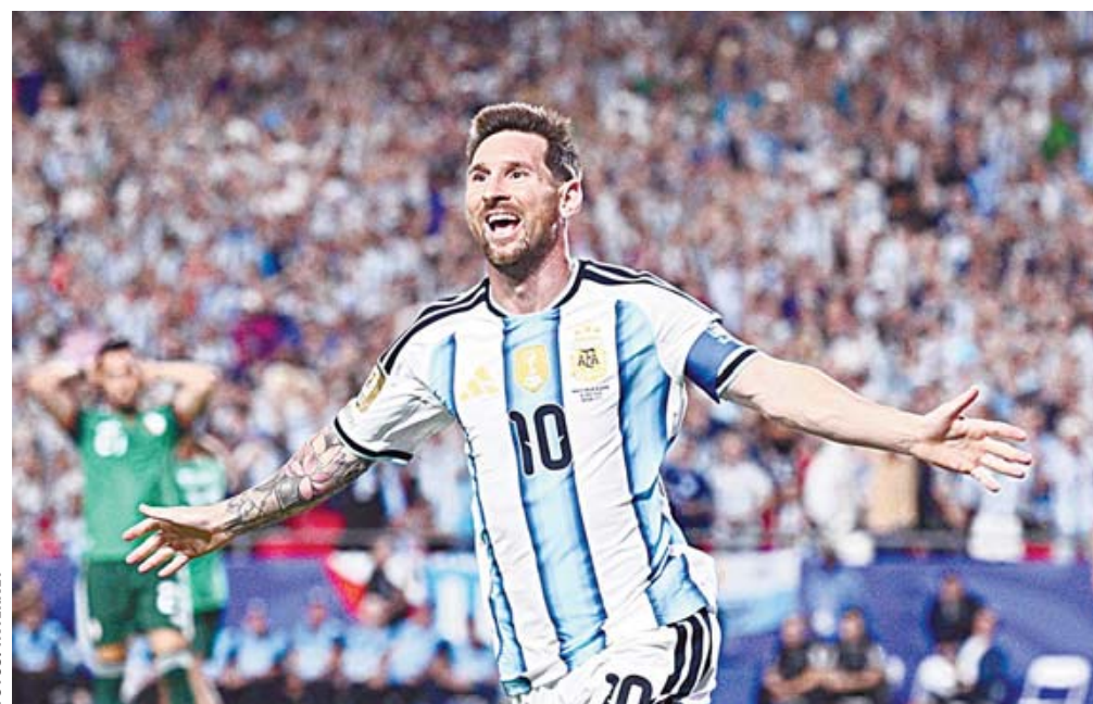
▪ Lionel Messi marcó triplete en su debut en el Mundial 2026, ante Argelia.

El partido comenzó cargado de intensidad, con una albiceleste intentando imponer condiciones desde el silbatazo inicial, ante un conjunto africano que no estaba dispuesto a ser escalón del campeón del mundo. Dio pelea hasta donde pudo, pero la calidad del rival y los errores propios, sentenciaron el encuentro. Esta combinación arro-