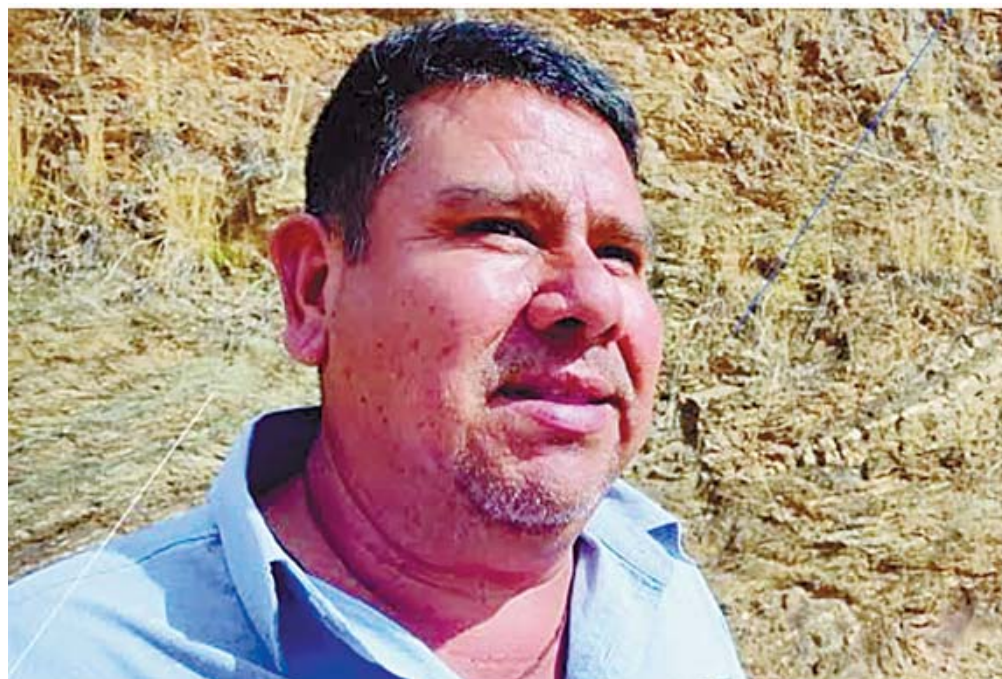
■ El cuerpo del presidente municipal Joel Ángel Bravo Martínez quedó tendido a unos metros de su domicilio tras el ataque.

manera indiscriminada en contra del político emanado del Partido Acción Nacional (PAN), para después abordar sus vehículos y emprender la huida con rumbo desconocido, burlando la presencia de los policías municipales que estaban asignados formalmente a su resguardo y protección.