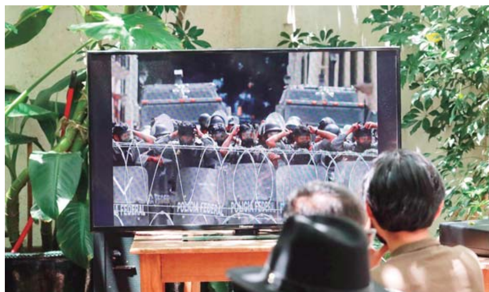
La actividad también fue un espacio en el que se externó la precariedad laboral en el periodismo.

“Sí es mucho amor al arte, sí fue mucha inver-