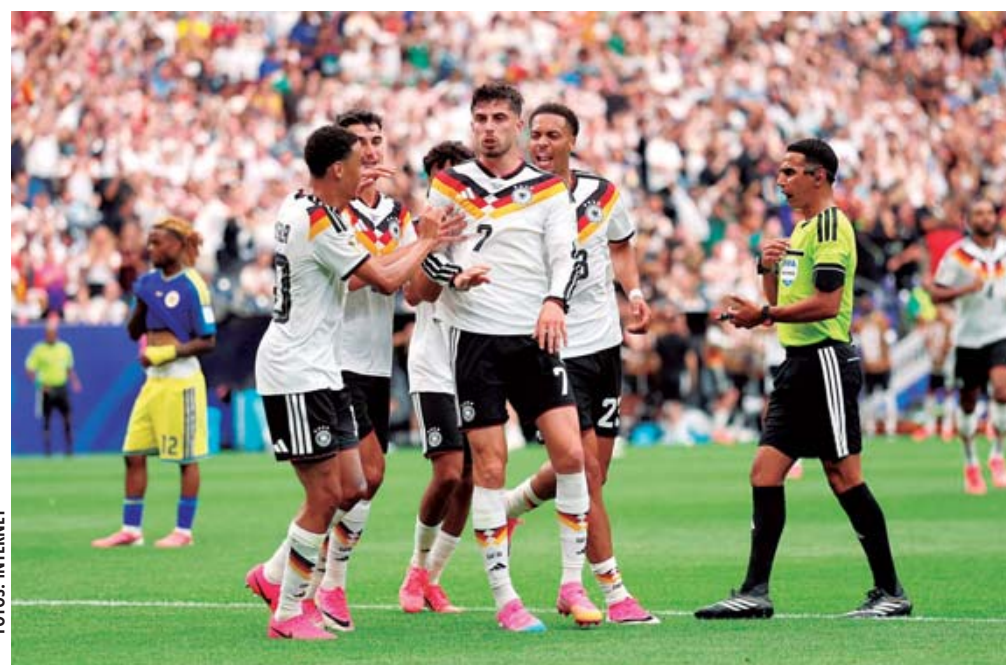
■ Alemania mostró su poderío y aplastó 7-1 Curazao en partido del Grupo E.