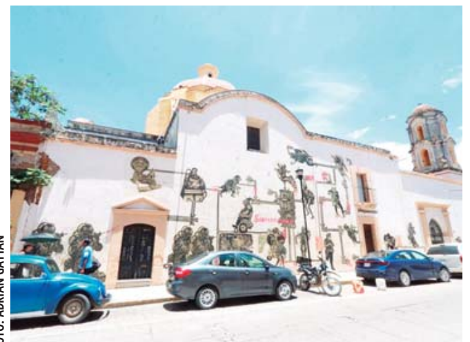
Muros de un edificio catalogado usado como lienzo del "arte urbano" en detrimento de la ciudad patrimonio.