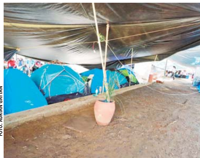
Plantón de semana inglesa. Abandonadas las casas de campaña en el zócalo capitalino.