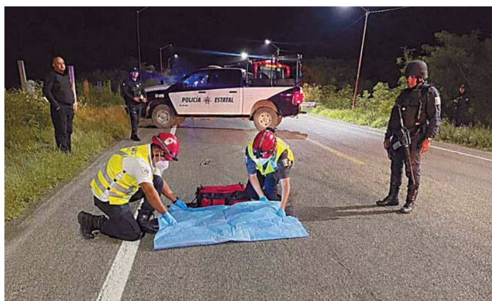
■ Autoridades acordonaron la carretera tras el hallazgo de un hombre sin vida.

Sin embargo, las autoridades no han confirmado aún la mecánica exacta del incidente.