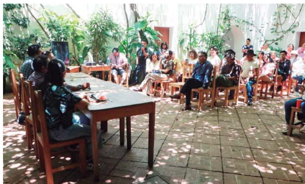
El conversatorio se realizó en el Instituto de Artes Gráficas de Oaxaca (IAGO).