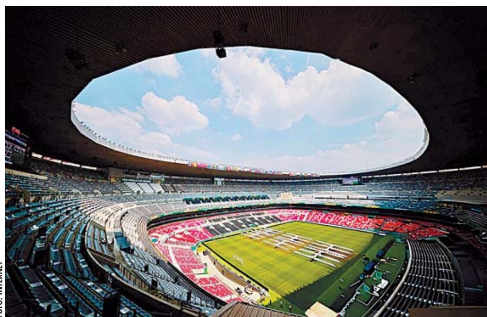
El Estadio Ciudad de México, bajo la operación de la FIFA, está listo para la inauguración de la Copa del Mundo 2026, este jueves 11 de junio.

que no se les va a permitir el acceso, toda vez que sus medidas no están vigentes, por lo que no están surtiendo efectos jurídicos. El estadio se rige por la reglamentación de FIFA. El estadio fue entregado desde el 13 de mayo",