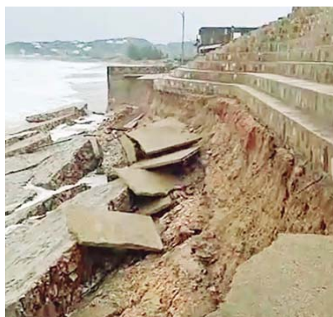
La fuerza del océano terminó por exhibir la fragilidad de la infraestructura.

El mirador formaba parte de un proyecto de rehabilitación urbana impulsado en 2021 por la Secretaría de Desarrollo Agrario, Territorial y