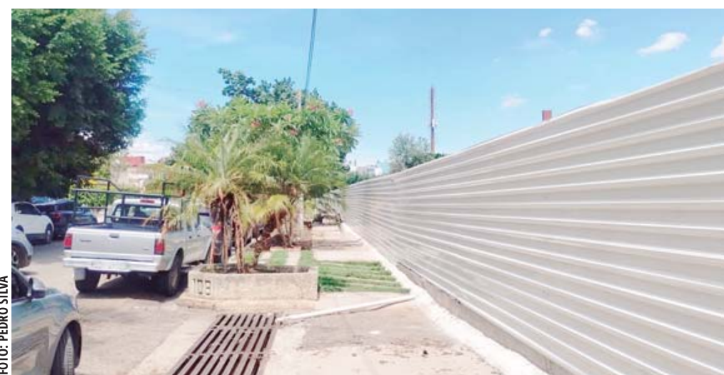
■ Sin inmutarse, Fibra Danhos mantiene tapiado el acceso de la privada de Rosas, si aún existe la vialidad.