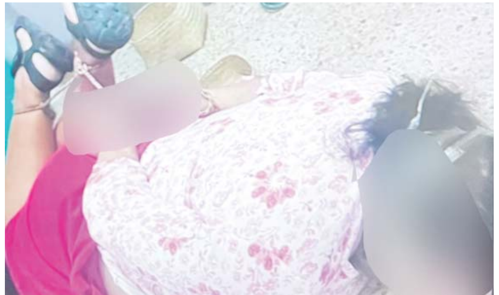
Agentes del Ministerio Público y peritos de la Fiscalía realizaron las primeras diligencias y entrevistas a testigos en el lugar del crimen.

deceso activó un código rojo en toda la cabecera municipal. Elementos de la Policía Municipal procedieron a desalojar el área y colocaron un estricto cerco perimetral con cinta plástica para preservar la escena del crimen, mientras patrullas de diversas corporaciones implementaron un operativo de búsqueda en las salidas de la población para tratar de ubicar a los responsables, sin éxito hasta el momento.