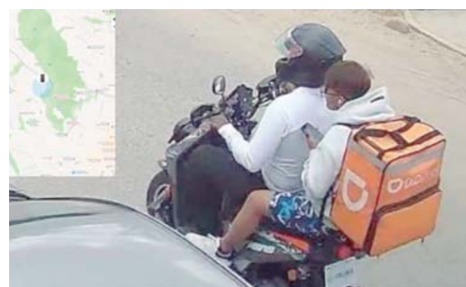
■ Motocicleta, principal medio de transporte para huir después de cometer un robo.

México con 4 mil 257, seguido de la Ciudad de México con 2 mil 190; Baja California con mil 253; Puebla con mil 235; Jalisco con mil 184; Nuevo León con 653; Aguascalientes con 417; Veracruz con 386; Quintana Roo con 347; Querétaro con 261; San Luis Potosí con 251; Morelos con 227; Michoacán con 167; e Hidalgo con 142.