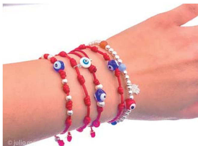
■ Hay diferentes diseños de cintas y se pueden acompañar con otros amuletos como el ojo turco.

La cinta roja, en particular, se usa para neutralizar la envidia y la negatividad ajena. "Su sola presencia nos recuerda nues-