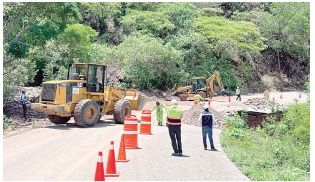
La circulación se mantiene en todas las carreteras de Oaxaca, aunque hubo caída de piedras y ramas de árboles.

Boris generó varias afectaciones en Huatul-