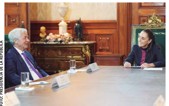
■ Claudia Sheinbaum recibió a Jamie Dimon, director ejecutivo de JP Morgan.