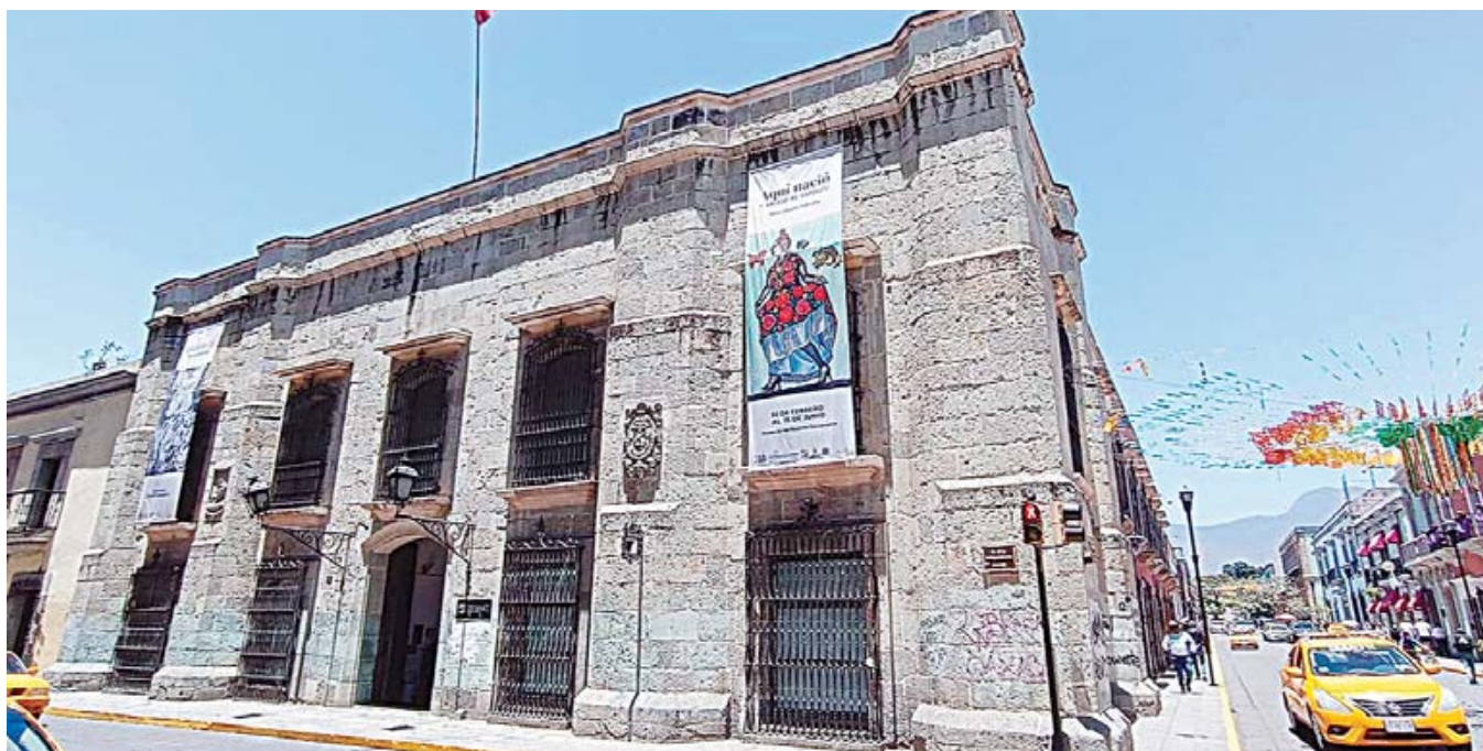
■ El MUPO es un recinto que abrió al público el 1 de octubre de 2004. Se fundó para que “albergara la plástica de grandes artistas oaxaqueños”.