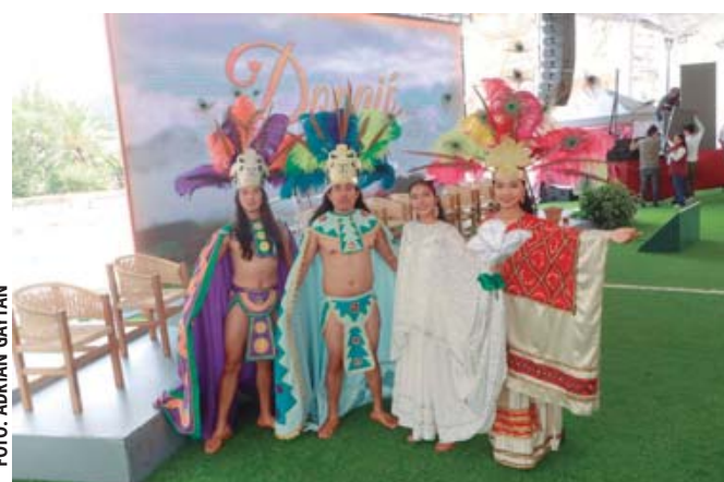
■ El elenco de Donají la Leyenda.

Como cada año, el acceso a los palcos o secciones C y D será gratuito.