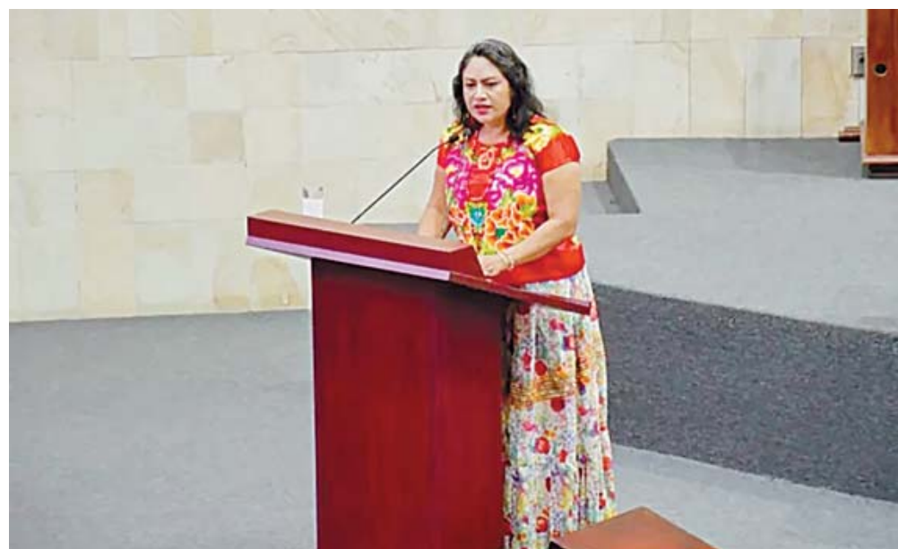
■ La diputada Irma Pineda Santiago presentó una propuesta para renombrar este museo de la ciudad de Oaxaca.

Casi un año de que la 66 Legislatura local exhortó a la Secretaría de las Culturas y Artes (Seculta) a renombrar al Museo de los Pintores Oaxaqueños (MUPO), la dependencia finalmente emitió esta semana una convocatoria pública para los foros en los que se discutirá el cambio de denominación.