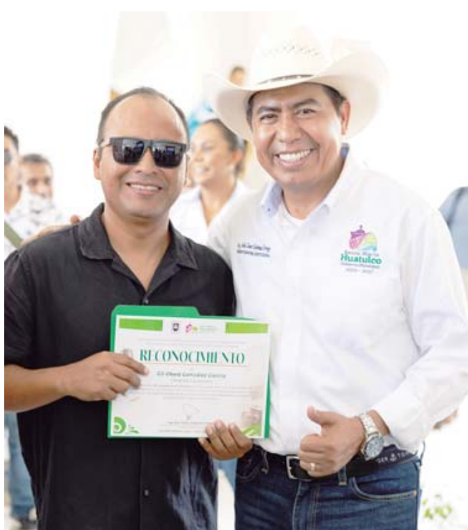
■ Fue reconocido el fotógrafo Gil Obed González García, por su trayectoria en el periodismo.

do con la sangre, la pasión, la energía y la acción. Colocada en la muñeca izquierda, protege frente a la envidia o la ira ajena respecto a nuestras oportunidades. En la derecha, fortalece nuestra capacidad de actuar, protegiendo nuestras acciones y proyectos. En los tobillos, resguarda el camino que recorremos en la vida, ofreciendo valor y protección. "Es importante considerar la mano hábil, que es la de la acción, mientras que la otra es receptiva", recomienda Correia Nobre.