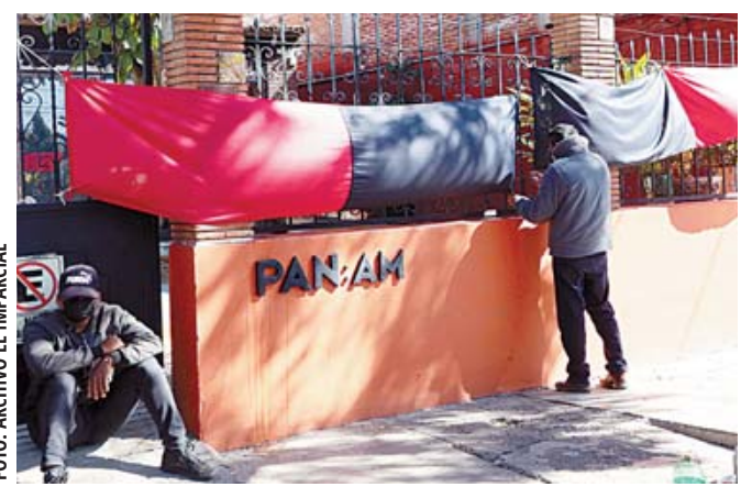
Aunque son escasas las huelgas, persiste severo rezago en la justicia laboral.

Lejos quedó la oferta oficial de una expedida resolución de conflictos laborales para los trabaja-