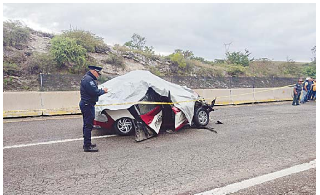
Elementos de la Policía Vial Estatal resguardaron y abanderaron el perímetro de la tragedia en jurisdicción de San Andrés Zautla para permitir las labores ministeriales.

Un fatal accidente por presunto corte de circulación sobre la vía 135-D, a la altura de San Andrés Zautla, movilizó a los cuerpos de rescate