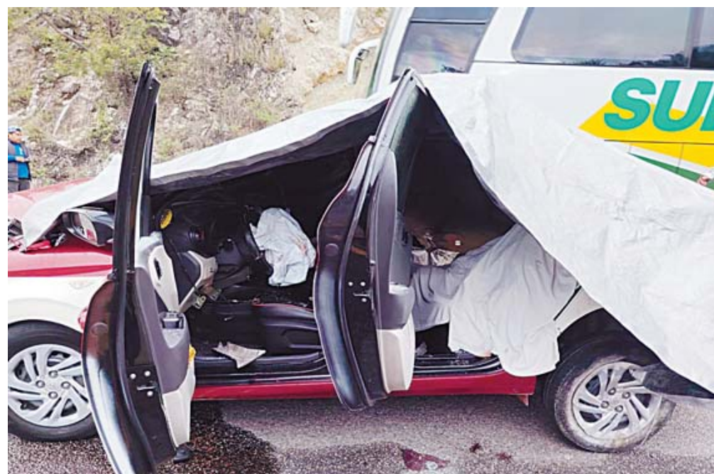
El taxi del sitio Lázaro Cárdenas de Telixtlahuaca quedó destrozado de su parte frontal tras colisionar contra la camioneta Ford sobre la pista 135-D.

El fatídico percance vehicular ocurrió alrededor de las 07:00 horas en el carril que conduce del municipio de Santiago Suchilquitongo-Huitzo hacia la ciudad de Oaxaca de Juárez. Automovilistas que transitaban por la zona alertaron de inmediato a las líneas de