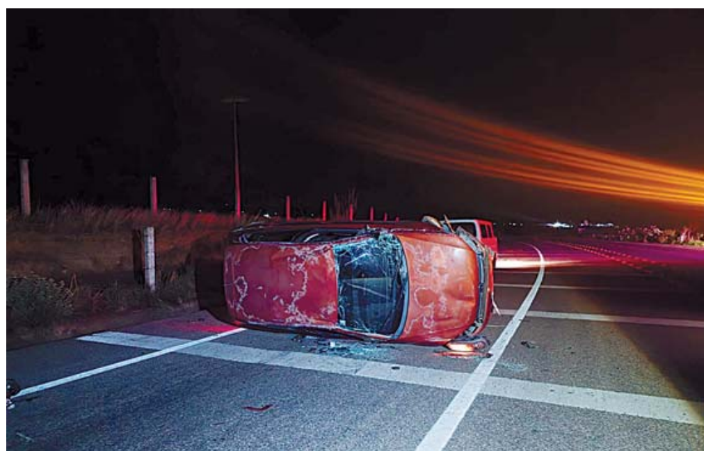
El automóvil Volkswagen Polo de color naranja quedó recostado sobre su costado izquierdo tras la aparatosa volcadura.

reporte, elementos de la Policía Vial Estatal se apersonaron en el lugar del siniestro. Los agentes activaron un operativo de abanderamiento preventivo, utilizando torretas y señalizaciones debido a