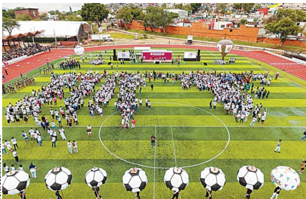
Golean a los oaxaqueños con una promoción por 15 millones de pesos.

Con motivo del Mundial de Fútbol 2026, en el que México será una de las sedes, el estado de Oaxaca gastará casi 14 millones 842 mil 446 pesos en difusión y promoción turística en aeropuertos, en pueblos mágicos, en parques y otros lugares o eventos.