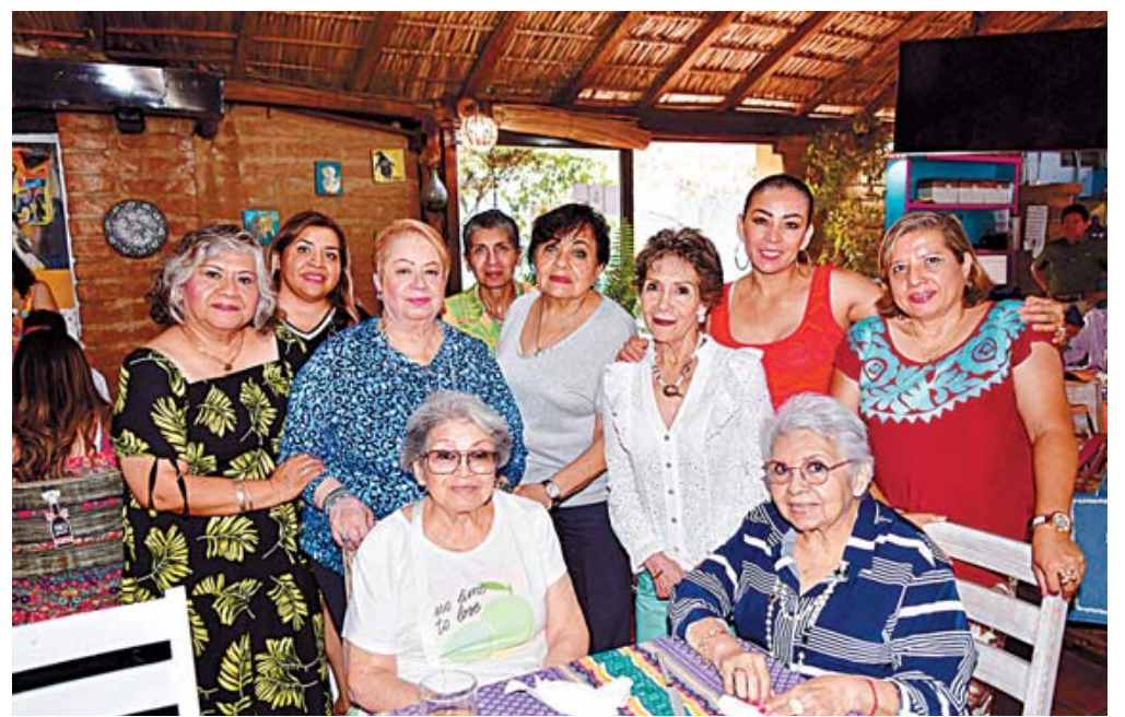
La llenaron de halagos, regalos, abrazos y mucho amor.