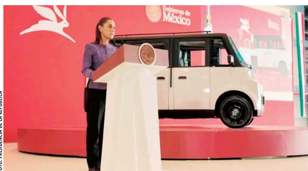
La presentación de Olinia por parte de la presidenta de la República, Claudia Sheinbaum.

Luego de conducir el primer vehículo eléctrico mexicano, la Jefa del Ejecutivo Federal señaló que, como parte del Plan México, Olinia es la visión de un país que apuesta por la inteligencia y la creatividad de las y los jóvenes mexicanos. La secretaria de Ciencia, Humanidades, Tecnología e Innovación, Rosaura Ruiz Gutiérrez, señaló que Olinia es un reto cumplido en el que el conocimiento contribuye al desarrollo nacional. Agregó que