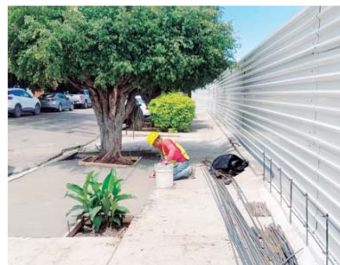
Un obrero tira cemento sobre una jardinera de donde arrancaron arbustos, prado o árboles.

“Ya no tengo cáncer, ya me lo quitaron y estoy bien. Me siento bien. Todavía no cumplo el mes, pero ya quise venir con ustedes porque eso me fortalece, me anima, me alegra, me da vida”, expresó. Durante su ausencia, desde el pasado 10 de mayo y hasta el 31 de ese mes, las misas dominicales del mediodía en la catedral fueron officiadas por el párroco Alejandro Rodrí-