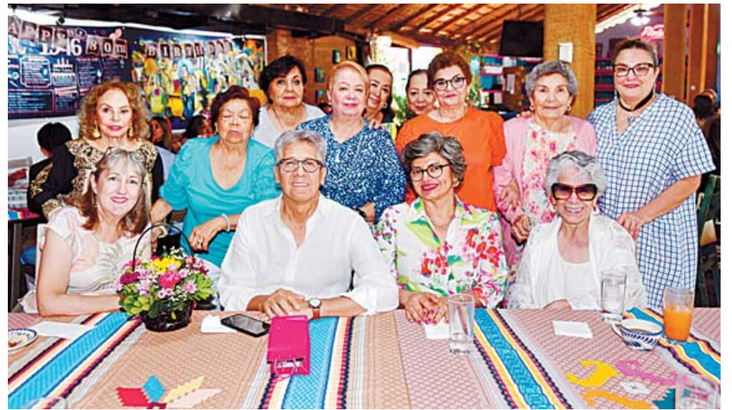
Sus amistades estuvieron presentes en tan importante evento.