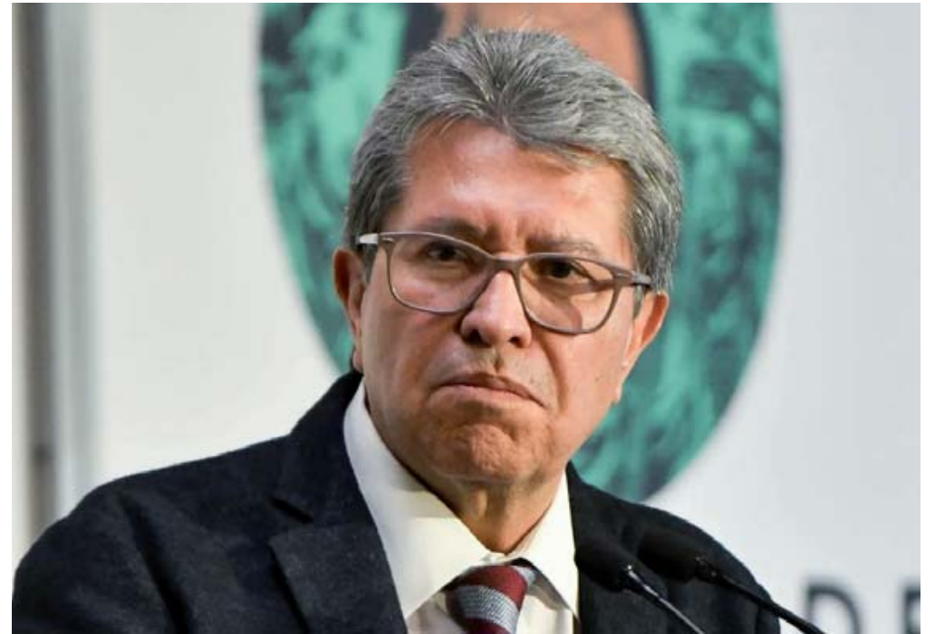
Ricardo Monreal, coordinador de Morena en la Cámara de Diputados.

rias, quede a juicio de los órganos jurisdiccionales—léase el TEPJF—emitir sentencia que beneficie a sus patrones en el poder.