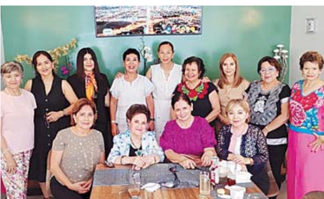
Compartieron su día especial con un grupo de amigas muy queridas.

La jornada transcurrió entre la entrega de lindos obsequios, muestras de afecto y los mejores augurios para el año que comienzan las festejadas, consolidando este desayuno como un bello recuerdo en el álbum de sus vidas.