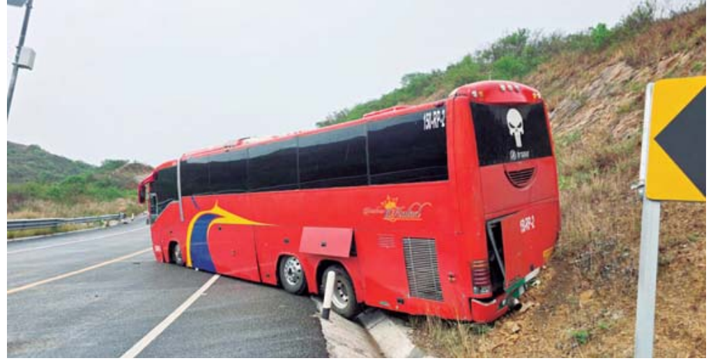
El autobús de la empresa "Turísticos Caled" quedó varado tras estrellarse contra el cerro al quedar sin frenos en la autopista a la Costa. Elementos de la Guardia Nacional y de la Policía Vial Estatal abanderaron el kilómetro 32+700.

Una oportuna maniobra del chofer evitó una tragedia de consecuencias fatales tras sufrir una falla mecánica en la vía Barranca Larga-Ventanilla