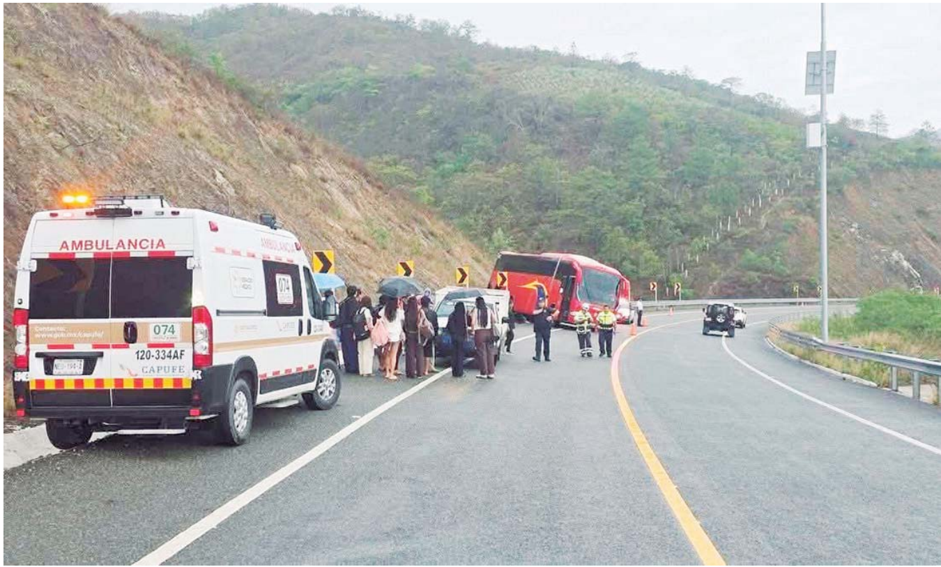
Paramédicos de CAPUFE y elementos policíacos atendieron en la zona del percance a los 40 estudiantes de Odontología de la UABJO.

sa comercial "Turísticos Caled", transportaba de regreso a los universitarios tras una jornada escolar fuera de la capital.