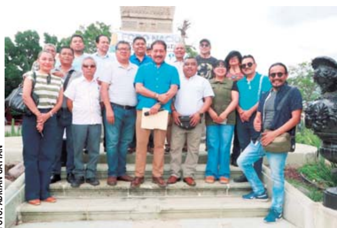
■ El foro reiteró su compromiso con la libertad de prensa.

grante del gremio periodístico y representa un atentado directo contra la libertad de expresión, el derecho a la información y las garantías fundamentales que protegen el ejercicio de la labor informativa en nuestro país”.