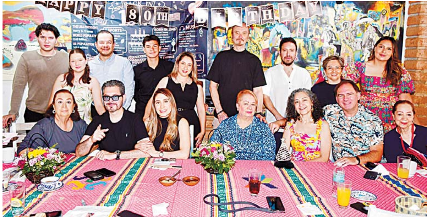
El festejo estuvo organizado y lleno de amor por sus hijos, esposo, hermanas, sobrinos, ahijada y queridas amistades.

yen aros extragrandes (estilo chunky), estructuras geométricas, cascadas de cristales, aretes colgantes estilo candelabro y siluetas orgánicas con metales y piedras de colores.