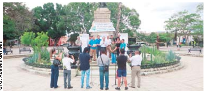
Periodistas oaxaqueños censuraron los riesgos que corren comunicadores en Oaxaca.