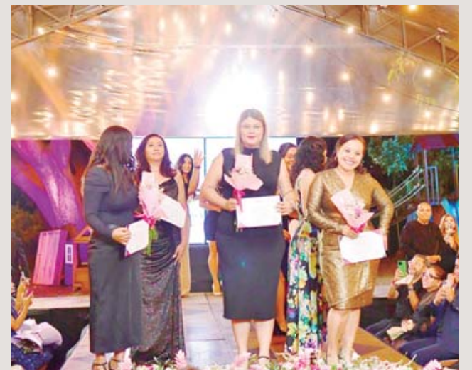
■ Rostros felices y aplausos de los empresarios, patrocinadores e invitados.