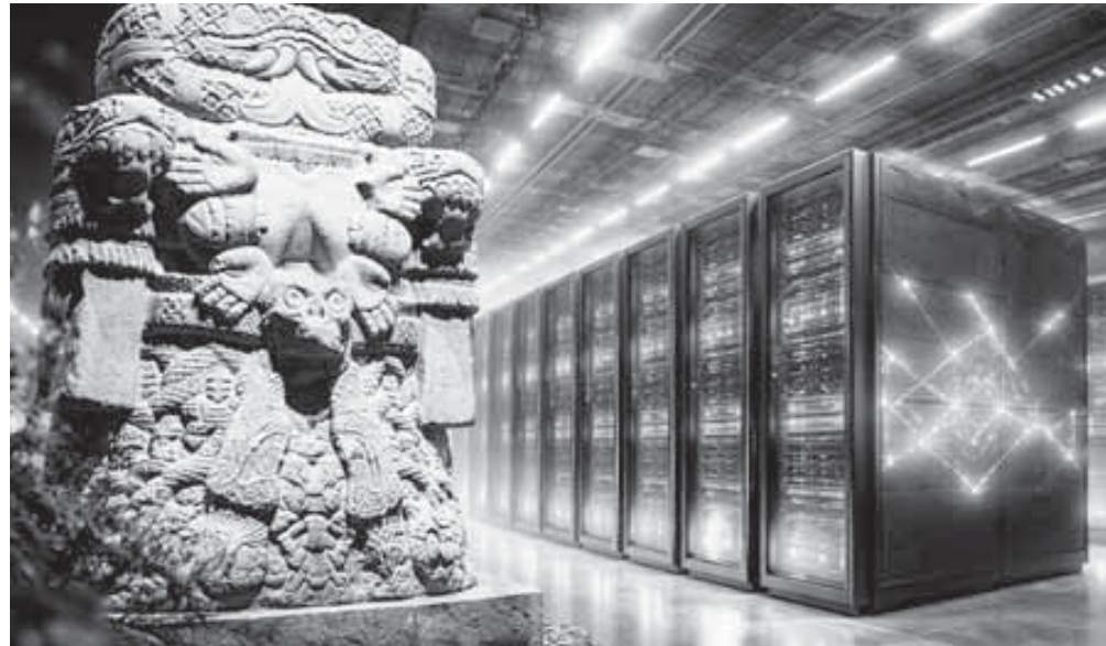
El nuevo Comité Técnico define las rutas de Coatlicue, un espacio donde la identidad milenaria y la innovación digital se encuentran en el Politécnico.

El IPN Zacatenco recibe al cerebro digital más potente de Latinoamérica, un proyecto que impulsará las tesis de nuevos investigadores y buscará soluciones urgentes al cambio climático