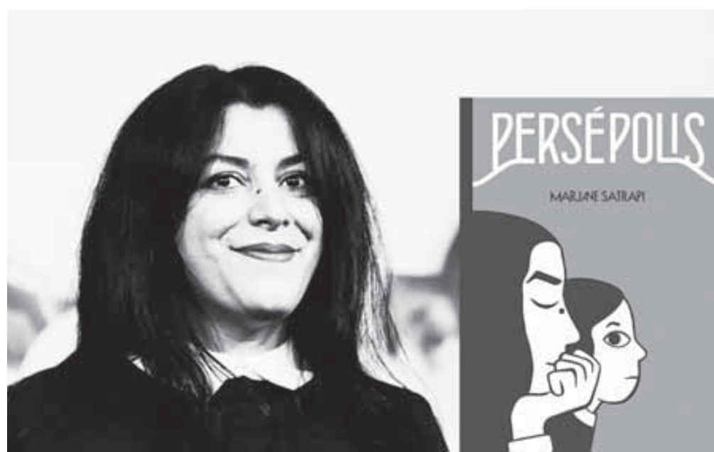
La autora de Persépolis , Marjane Satrapi, murió el jueves 04 de junio.

A través de sus obras, Marjane Satrapi retrató como nadie la extrema complejidad de la sociedad iraní y el choque político provocado por la llegada al poder del ayatolá Jomeini en 1979.