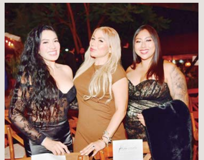
■ Los anfitriones y la directiva compartieron una mesa de honor.