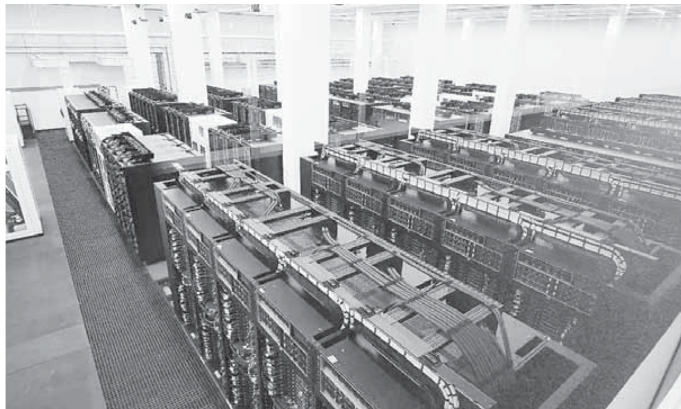
Las y los estudiantes mexicanos tendrán acceso directo al procesador más potente de la región para acelerar sus investigaciones y tesis.

Para poner en marcha esta maquinaria, la Secretaría de Ciencia, Humanidades, Tecnología e