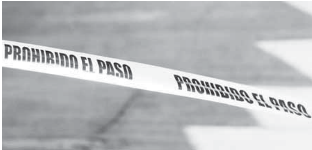
El crimen fue perpetrado por sujetos desconocidos que sorprendieron a la víctima.

Según los primeros reportes, el crimen fue perpetrado por sujetos desconocidos que sorprendieron a la víctima y