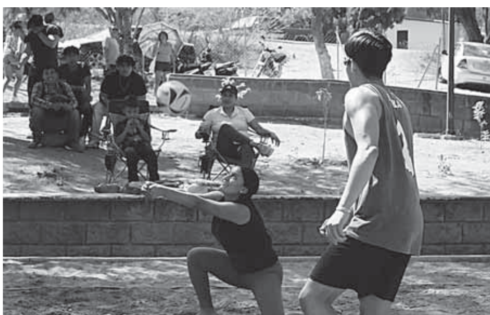
El torneo vacacional convocó a equipos mixtos y de rama libre.