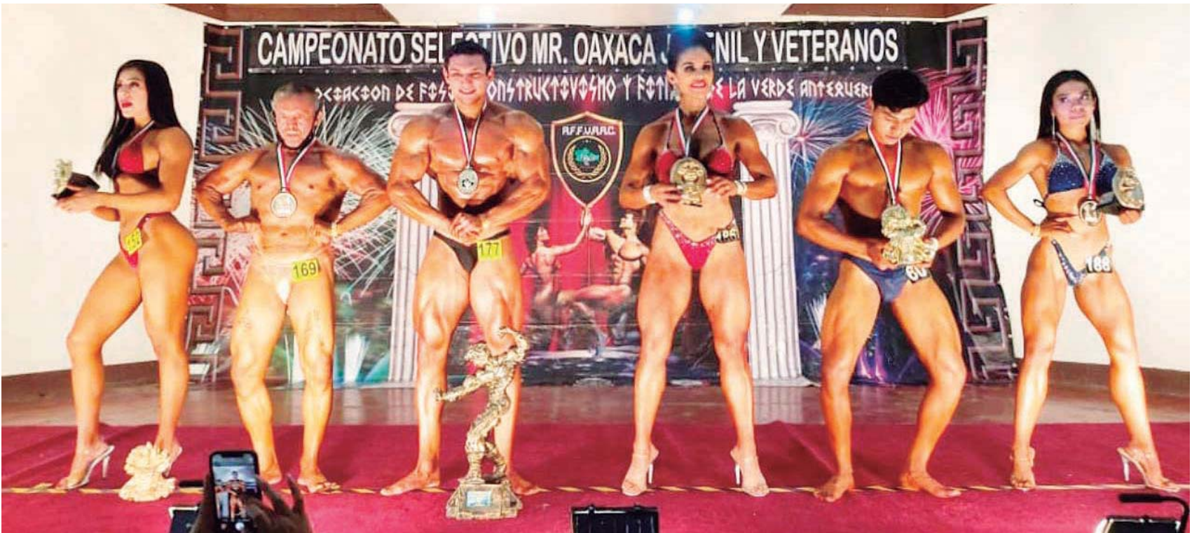
Comenzó la cuenta regresiva para uno de los eventos más atractivos del año.