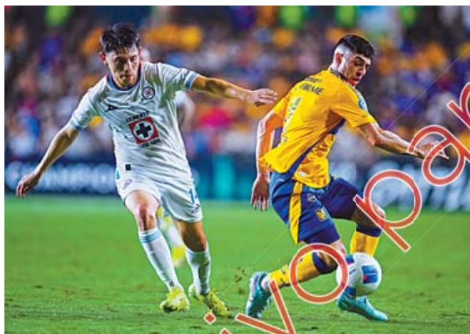
■ El partido se mostró trabado durante el primer tiempo.