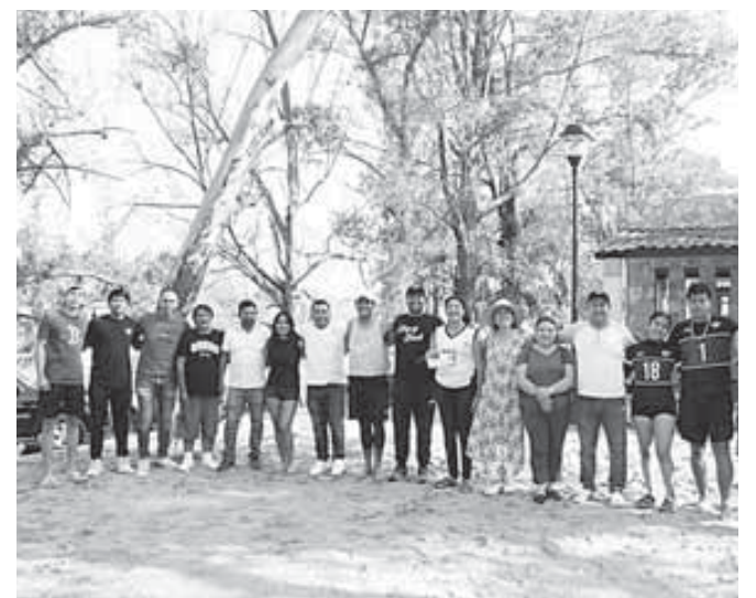
La autoridad municipal premió a los tres primeros lugares de este torneo.

Finalmente, la autoridad municipal agradeció la participación de los equipos y la disposición de los familiares y amigos que acudieron a ver el torneo, disfrutando de las instalaciones del parque "el Tinado" para la preparación de alimentos o simplemente disfrutar de un descanso, actividades que se promoverán para la visita de los ciudadanos de Huajuapan.