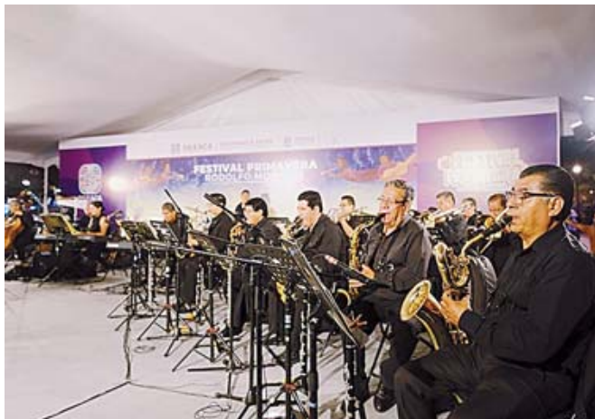
Las actividades culturales del Festival Primavera Rodolfo Morales son gratuitas y abiertas al público.