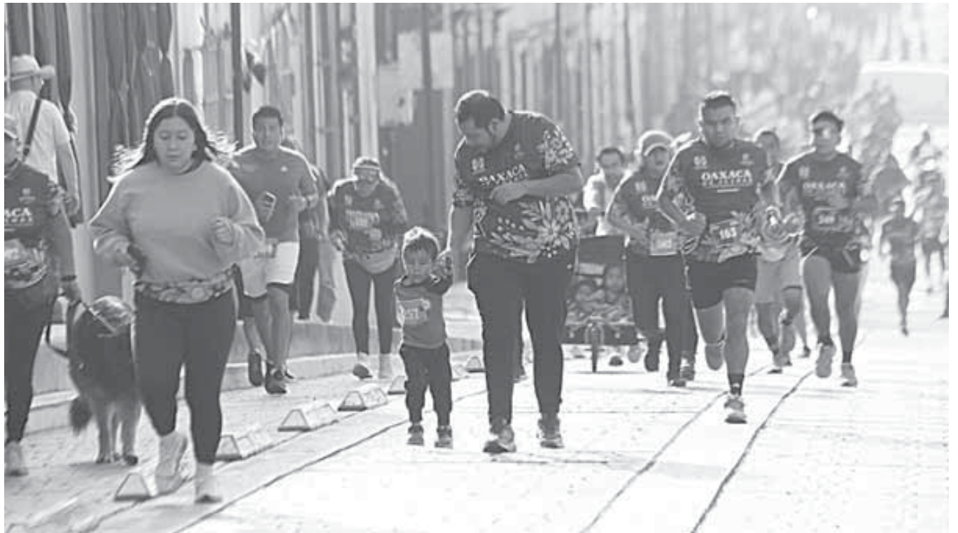
Las actividades se llevarán a cabo en la Unidad Deportiva del ITO.