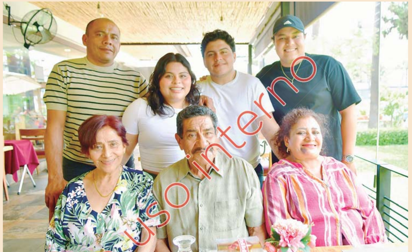
El cumpleaños lució muy contenido por esta pequeña celebración en la que estuvieron sus seres queridos.