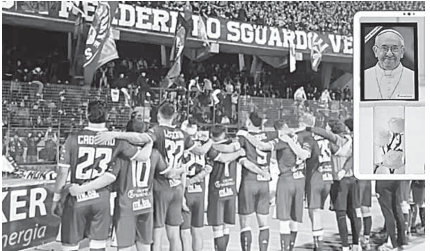
El Avellino consiguió su ascenso y curiosamente coincidió con la muerte del Papa Francisco.