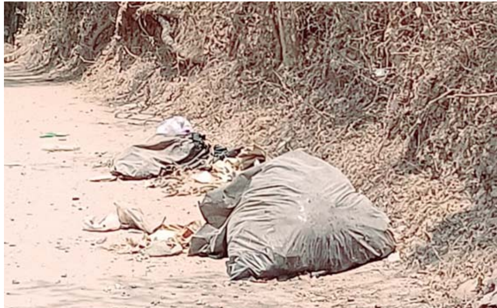
La aparición de residuos cárnicos en ríos y barrancas representa un peligro para la salud.

Señaló que por lo anterior y en el marco de la Feria Ambiental impulsada en el municipio, en donde participan instituciones como el Instituto de la Juventud (INJUVE), la Comisión Estatal y Forestal (COESFO) y la Secretaría del Medio Ambiente de Oaxaca se llevó a cabo la firma de un convenio con la empresa "Harinas de Minatitlán", quienes dispondrán de estos desechos para posteriormente transformarlos en otros