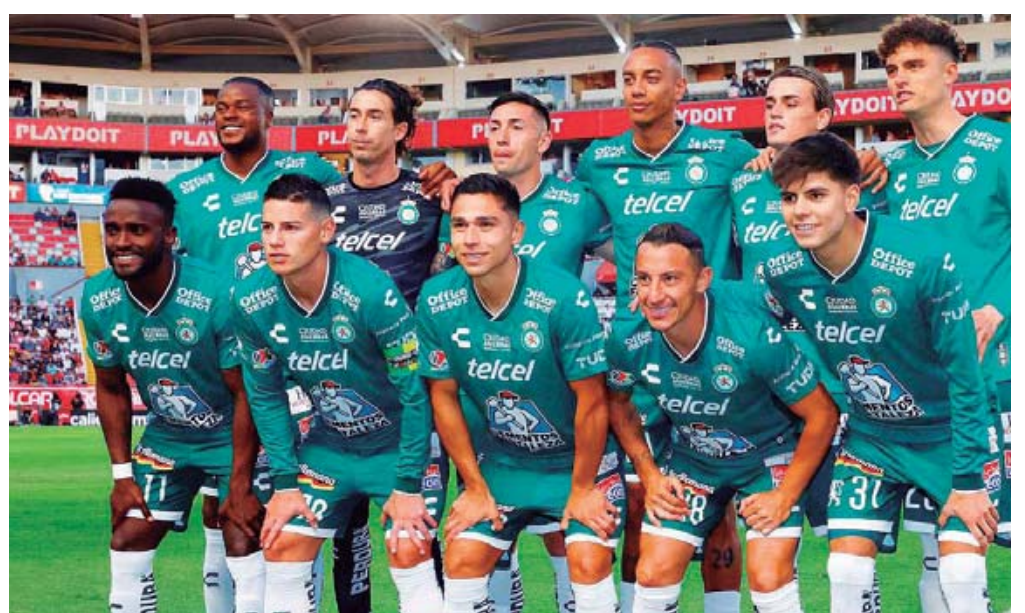
El miércoles se marcó otro capítulo en una disputa que podría cambiar el curso del Mundial de Clubes 2025.