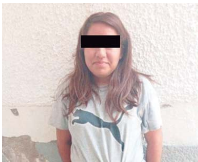
La mujer fue puesta a disposición de la FGR.

La persona, identificada por las iniciales D.P.M.M., fue trasladada junto con la motocicleta y el arma asegurada al Cuartel General de la corporación, donde se elaboró el informe correspondiente. Posteriormente, fue puesta a disposición de la Fiscalía General de la República (FGR), instancia que determinará su situación legal.