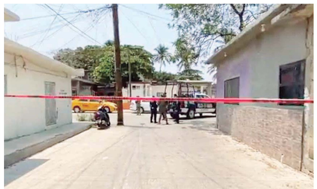
El ataque armado, perpetrado en plena tarde, desató momentos de pánico en una zona concurrida.

víctimas fueron sorprendidas por al menos un sicario armado, que abrió fuego y luego escapó con rumbo desconocido.