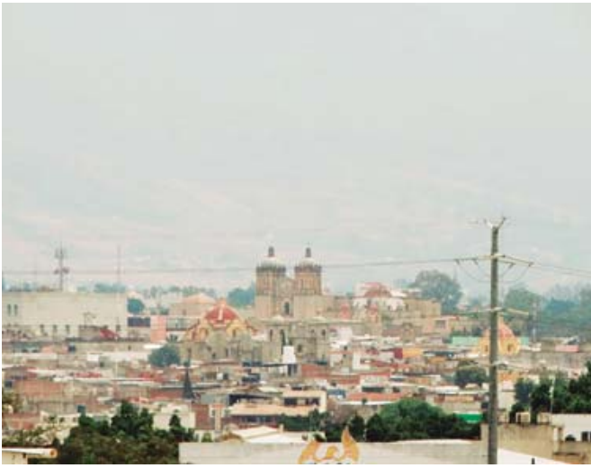
Ingenieros urbanistas proponen un proyecto con un costo estimado fue de mil 857.5 mdp en 2019.

Sobre la sede actual del ayuntamiento, una placa en el ex convento de Monjas Recoletas señala que desde el 20 de agosto de 1992 opera ahí el palacio municipal. Aunque antes fue el Hospicio de la Vega, Escuela de Artes y Oficios, Escuela Correccional, Escuela Normal Mixta y también sede de otras oficinas del gobierno estatal.