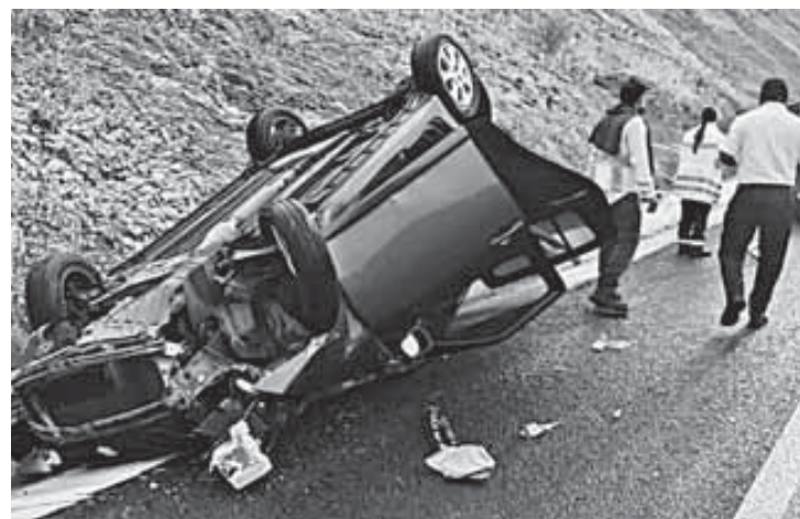
El vehículo sufrió una salida de camino y volcadura.

La Policía Vial Estatal se encargó de abanderar la zona para garantizar la seguridad vial y facilitar las labores de auxilio.