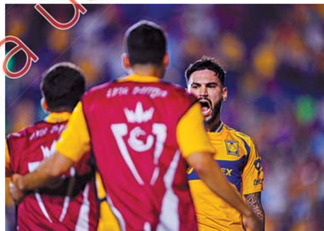
■ Purata, casi al final, le dio un respiro a Tigres.

ner de Cruz Azul, los felinos armaron un contragolpe letal con superioridad numérica. Uriel Antuña, a toda velocidad, condujo hasta el área y cedió a Nico Ibáñez, pero la defensa cementera interceptó en el momento cla-