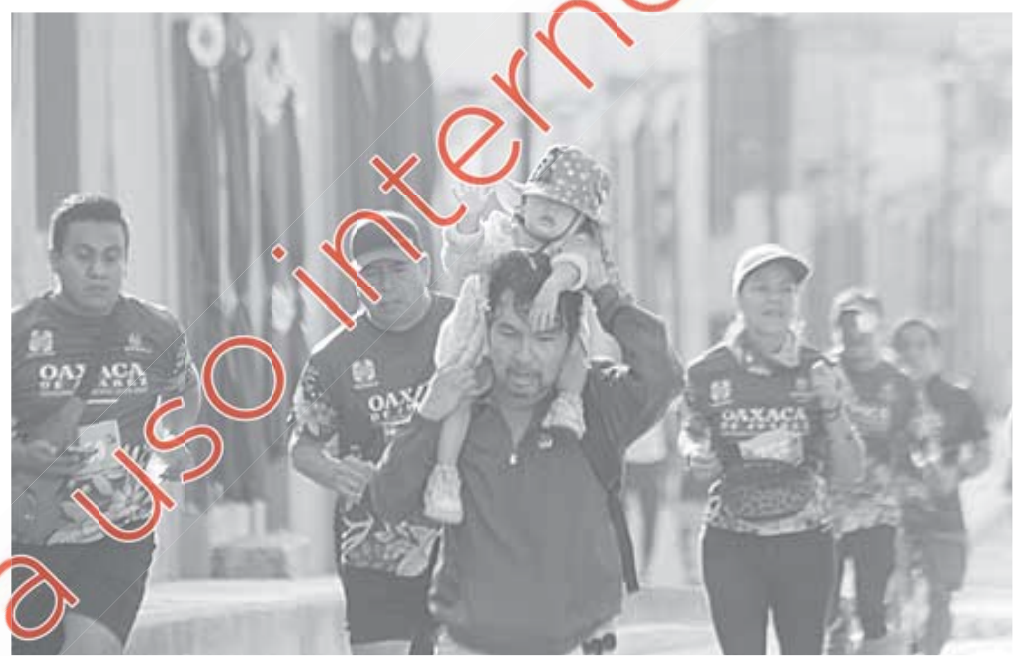
El fin de semana se desarrollará la séptima Mega Carrera Infantil.

de edad, que cubrían 2 mil 400 metros en el óvalo de dicho espacio deportivo. Se tiene programado dar inicio desde las 7:00 horas.