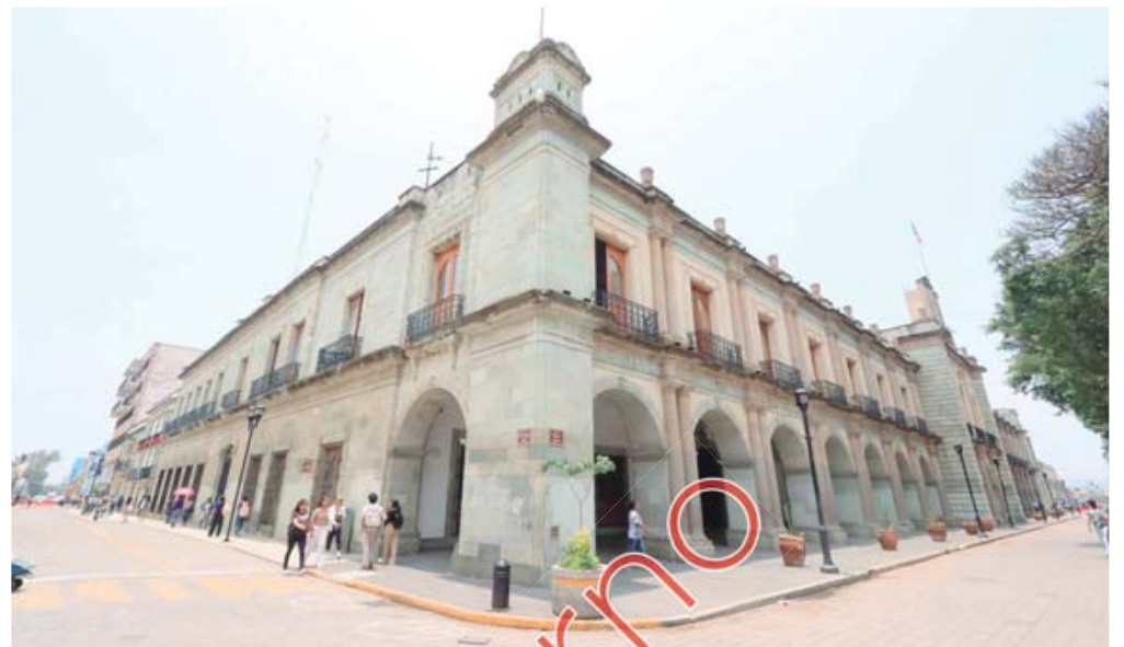
El actual Palacio de Gobierno y sede del ejecutivo estatal se construyó entre 1832 y 1884.

Según el portal Destinos México, la primera sede de la autoridad local fue la casa consistorial que se construyó en 1576 en el lugar que ahora ocupa el Palacio de Gobierno. Aunque la construc-