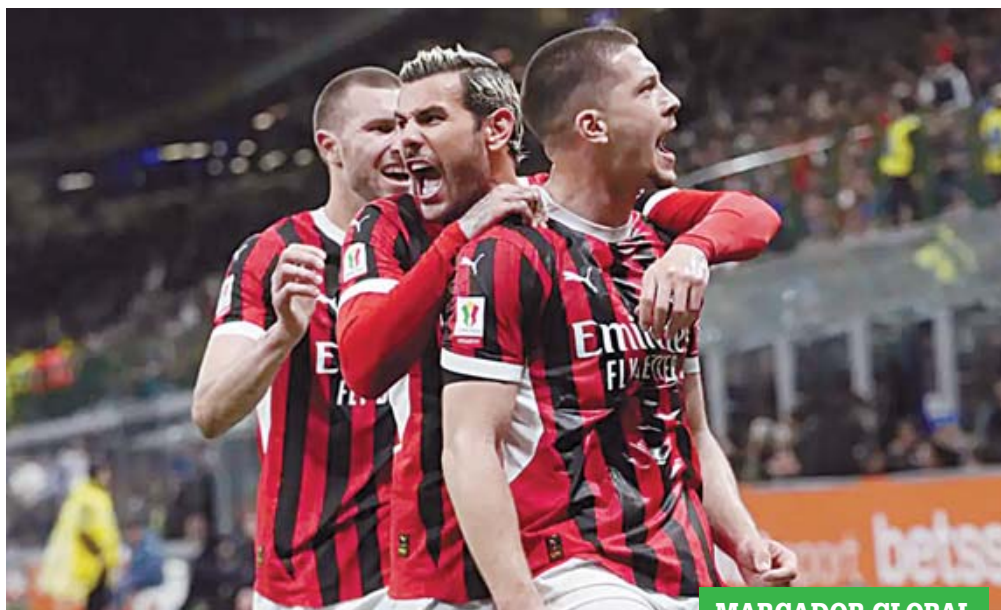
■ Milan logró el resultado sin la presencia de Santi Giménez.

cabeza que fue imposible de detener para Josep Martínez.