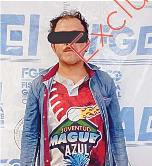
El detenido contaba con una orden de aprehensión por el delito de homicidio calificado con ventaja.

La investigación continúa su curso mientras se espera la audiencia inicial, en la que el juez determinará la situación jurídica del detenido. Familiares y colectivos de la zona han manifestado su esperanza de que este caso marque un precedente contra la impunidad.