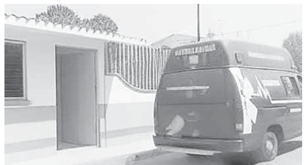
El menor de 15 años de edad sufrió un accidente en moto.

Cabe mencionar que dicho accidente había movilizó a elementos de la Policía Municipal de Santiago Huajolotitlán y al director de seguridad pública de la zona.