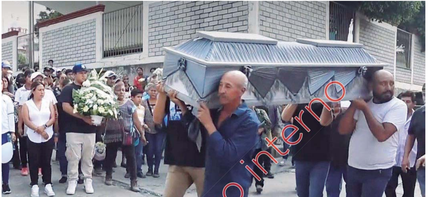
Seis féretros, seis vidas truncadas, cargados por brazos solidarios, recorrieron en procesión las calles del pueblo.

El sepelio fue el desenlace doloroso de una tragedia que aún estremece