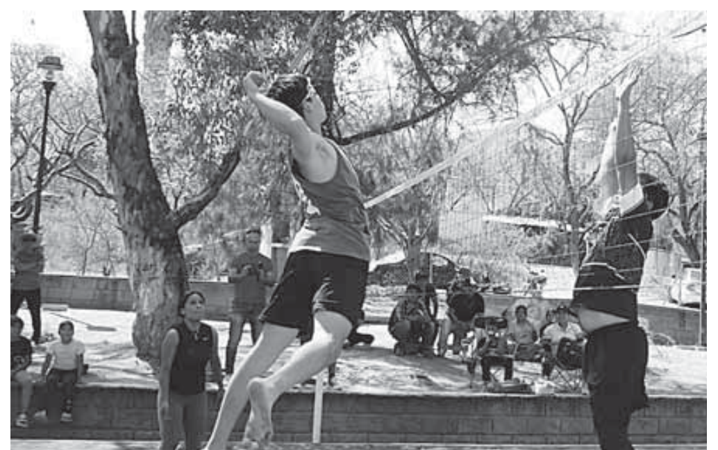
Se contó con la participación de jugadores de Huajuapan, Oaxaca y Tehuacán.