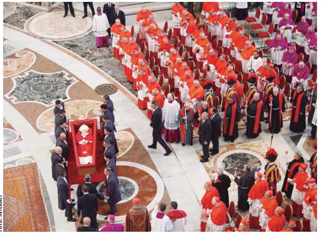
El féretro del Papa Francisco reposa en la Basílica de San Pedro, para el

En tanto que a partir del 30 de abril iniciará la construcción de los primeros cinco Centros de Educación y Cuidado Infantil (CECI) del Instituto Mexicano del Seguro Social (IMSS) en Ciudad Juárez, Chihuahua, de un total de 200 que serán beneficiados en todo el país en beneficio de las mujeres trabajadoras.