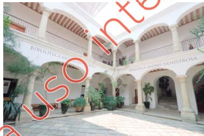
El municipio tuvo sus dependencias en edificios como la biblioteca Henestrosa.

ción fue renovada en los siglos XVII y XVIII, también resultó afectada por los sismos de 1787 y 1801. El actual Palacio de Gobierno y sede del ejecutivo estatal se construyó entre 1832 y 1884.