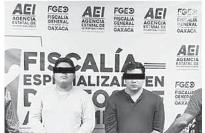
Identificaron a E.M.S. y U.G.L. como presuntos implicados en el homicidio.

Finalmente, el clima de tensión persiste en la comunidad, donde familiares y vecinos de la víctima exigen justicia y que este crimen no quede impune.