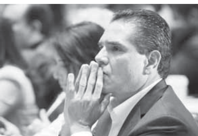
Silvano Aureoles, exgobernador de Michoacán.

De concederla, ello significaría que el exgobernador no podrá ser detenido hasta que el juzgado resuelva el fondo del amparo.