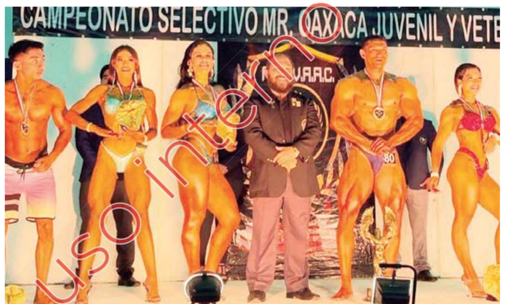
AFFVA dio a conocer las categorías en las que se competirá.

Además, comentó que este torneo es uno de los mejores en el estado, ya que intervienen muchos exponentes. Por ello, diversificaron las categorías para que estén alineadas