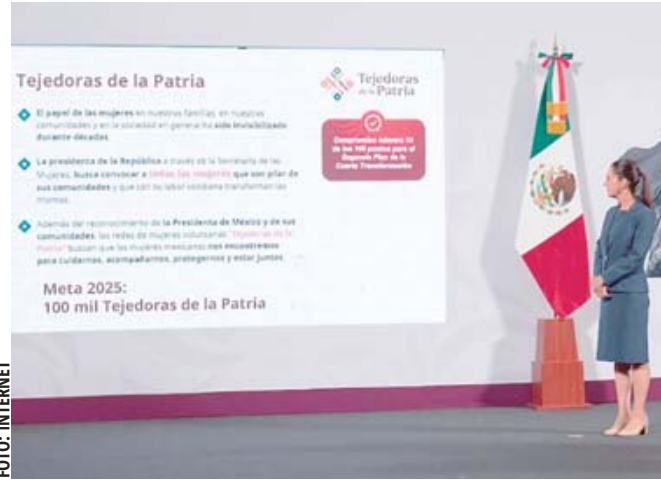
La presidenta Claudia Sheinbaum pone en marcha la Red Nacional de Tejedoras de la Patria.

"Inicia la Red de Mujeres Tejedoras de la Patria. Cualquier mujer mexicana puede inscribirse en nuestro territorio o fuera de nuestro territorio; y el objetivo de esta red, que es de voluntarias, es tener grupos de mujeres que nos protejamos entre nosotras y que podamos desarrollarnos. Ese es el primero",