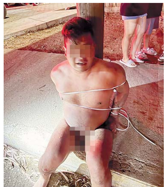
El hombre fue despojado de su ropa y amarrado a un poste.

Los vecinos señalaron que están hartos de los constantes robos en la zona, por lo que advirtieron que, ante la falta de respuesta de las autoridades, continuarán organizándose para defenderse por cuenta propia. 15