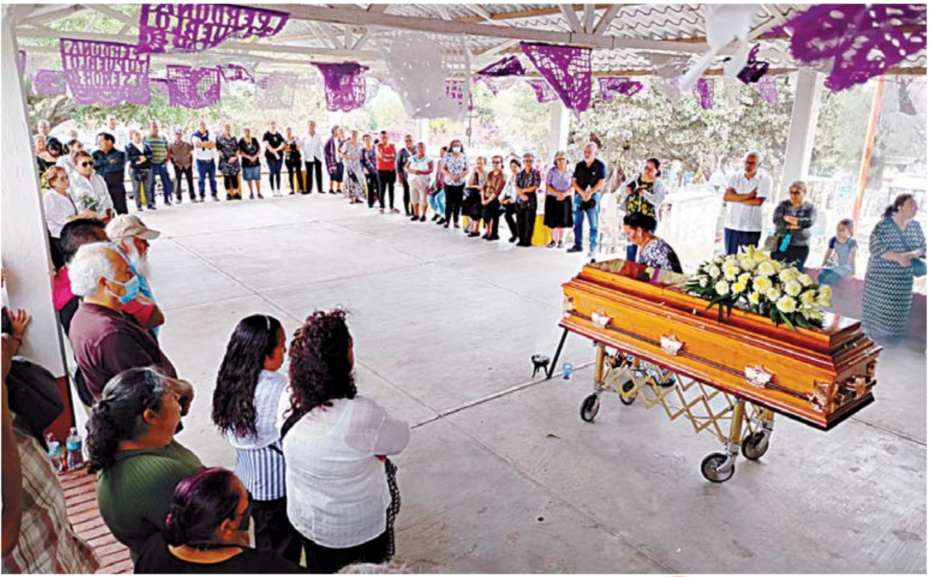
Familiares, amigos y vecinos se despidieron del joven con profundo dolor.