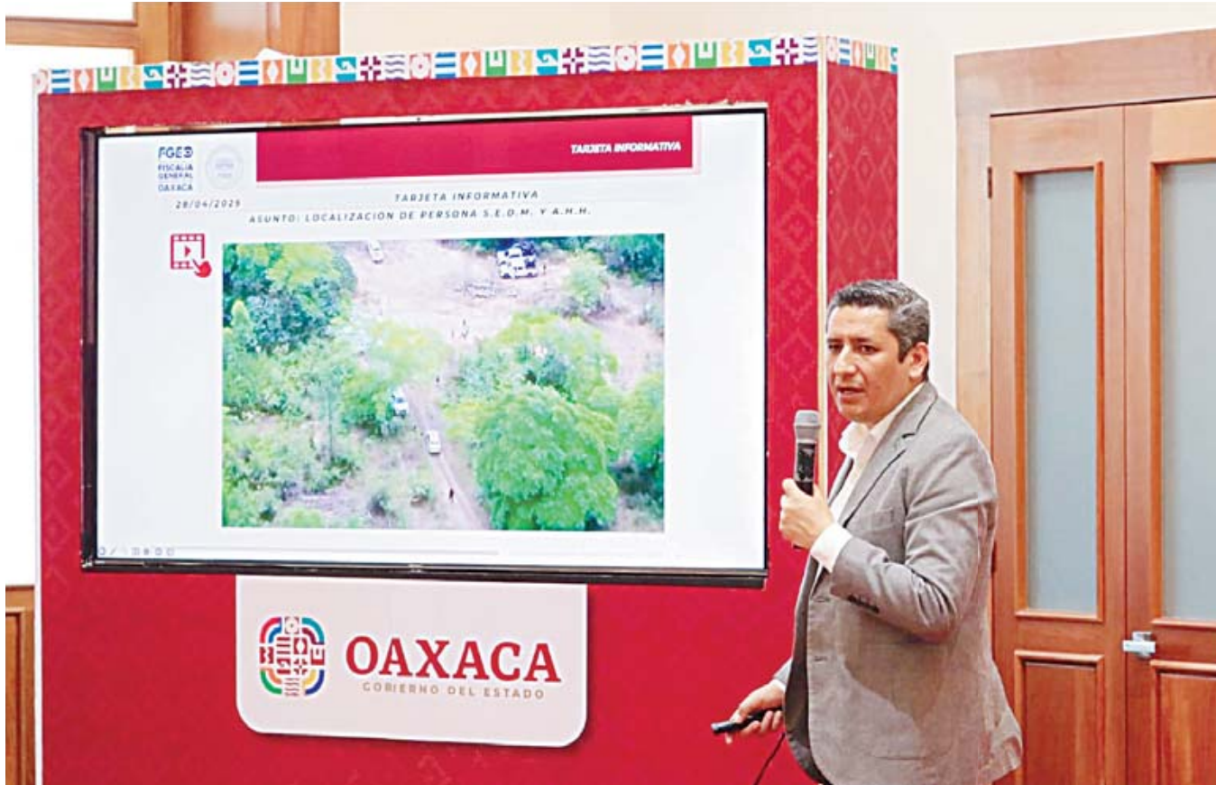
Fueron localizados el 24 de abril en un Rancho La Ceiba de Veracruz; Fiscalía vincula su asesinato con el crimen organizado.

“Solo a través de la exigencia y la presión hay esperanzas de localizar a nuestros seres queridos desaparecidos”.