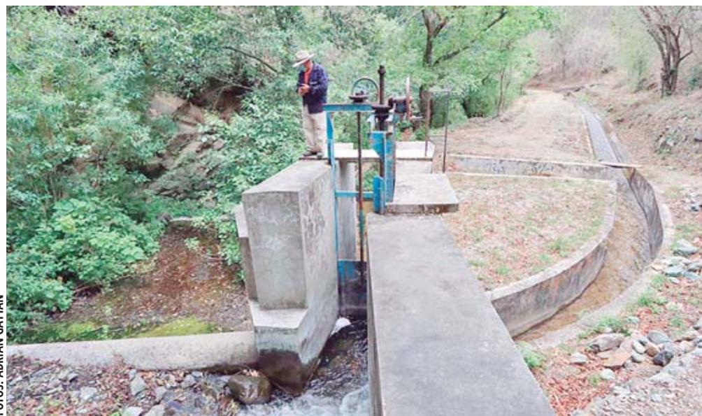
Comuneros de San Agustín Etla se deslindan del corte de suministro de agua potable a la Zona Metropolitana de Oaxaca.

Durante la conferencia semanal en Palacio de Gobierno, el funcionario remarcó que no hay desa-