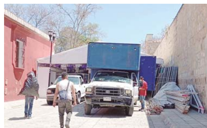
A partir de este lunes se retiraron las estructuras.

mediodía continuaba el retiro de las carpas contratadas a una empresa del Estado de México. También permanecían varios costales de arena, contenedores de agua, cartón y basura en las calles de Gurrión, Constitución y Macedonio Alcalá.