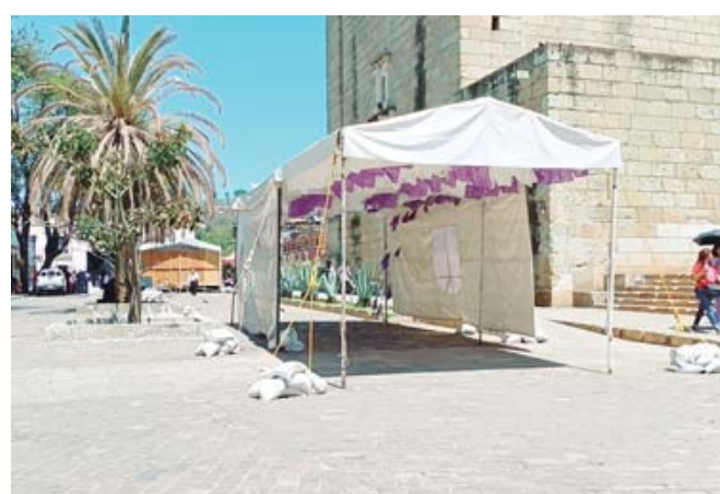
Después de las expoferias, en las calles de Gurrión, Constitución y Macedonio Alcalá dejan basura y costales de arena.

Por primera ocasión se oferta esta carrera en una universidad pública de la ciudad de Oaxaca, con un plan de estudios de modalidad escolarizada, con una duración de 4 años.