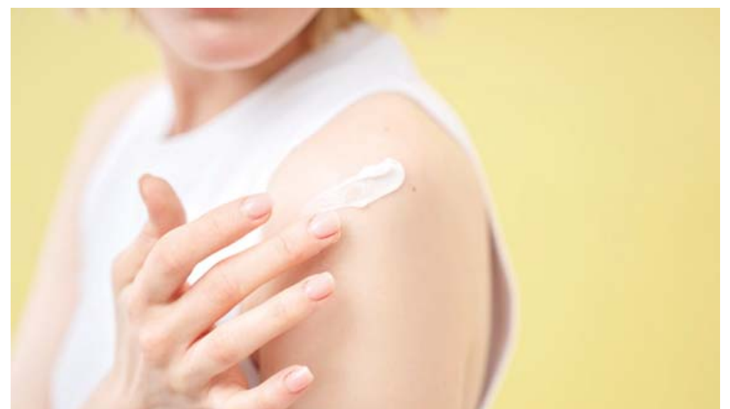
■ El protector solar es un básico de belleza y salud.

Beber suficiente agua es clave para una piel luminosa y bien hidratada. Según un estudio publicado en Clinical, Cosmetic and Investigational Dermatology, una hidratación adecuada mejora la elasticidad y reduce la sequedad cutánea. Además del agua, el consumo de alimentos ricos en líquidos como sandía, pepino y naranjas ayuda a mantener el equilibrio hídrico del cuerpo.