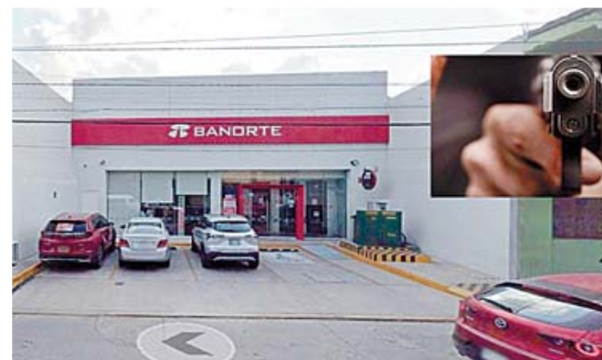
Le arrebataron aproximadamente 350 mil pesos.

A los pocos minutos, elementos policiacos arribaron al lugar, confirmaron el robo y localizaron un cargador abastecido, así como casquillos percutidos en la escena. Sin