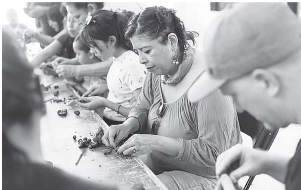
■ Las actividades gratuitas del Festival Primavera Rodolfo Morales continuarán hasta el 30 de abril.