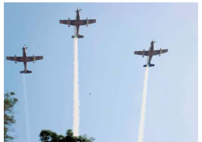
■ La Base Área Militar 15, con sede en San Juan Bautista La Raya ofreció un espectáculo aéreo por este aniversario.

La gente sigue llegando al centro de la ciudad y busca algún espacio entre el público para ser parte de la celebración. Las sillas ya han sido ocupadas por algunos asistentes y funcionarios municipales y estatales, pero no importa estar de pie