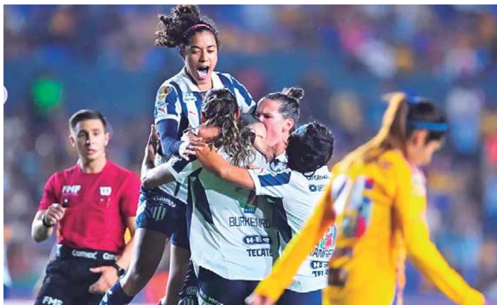
■ Rayadas igualó sobre la hora a las Tigres.