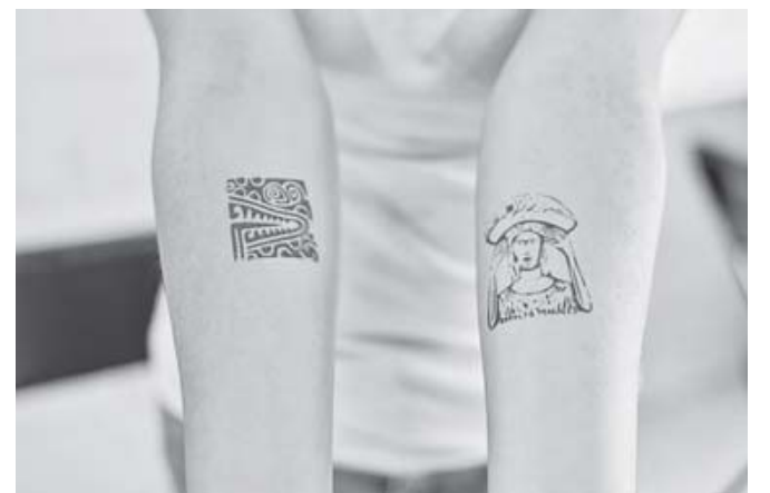
■ Se realizó el taller de impresión en forma de tatuaje sobre extremidades del cuerpo humano.