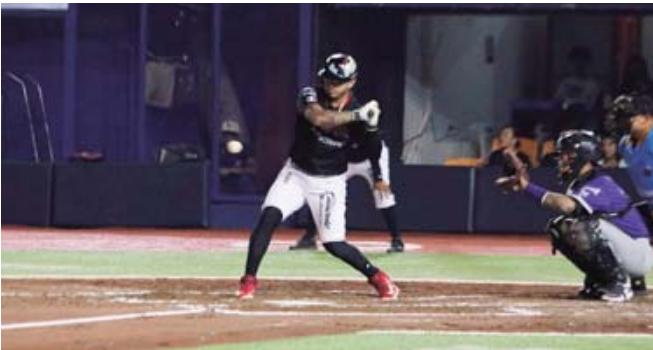
■ Se esperaba que Guerreros mantuviera el camino del triunfo.