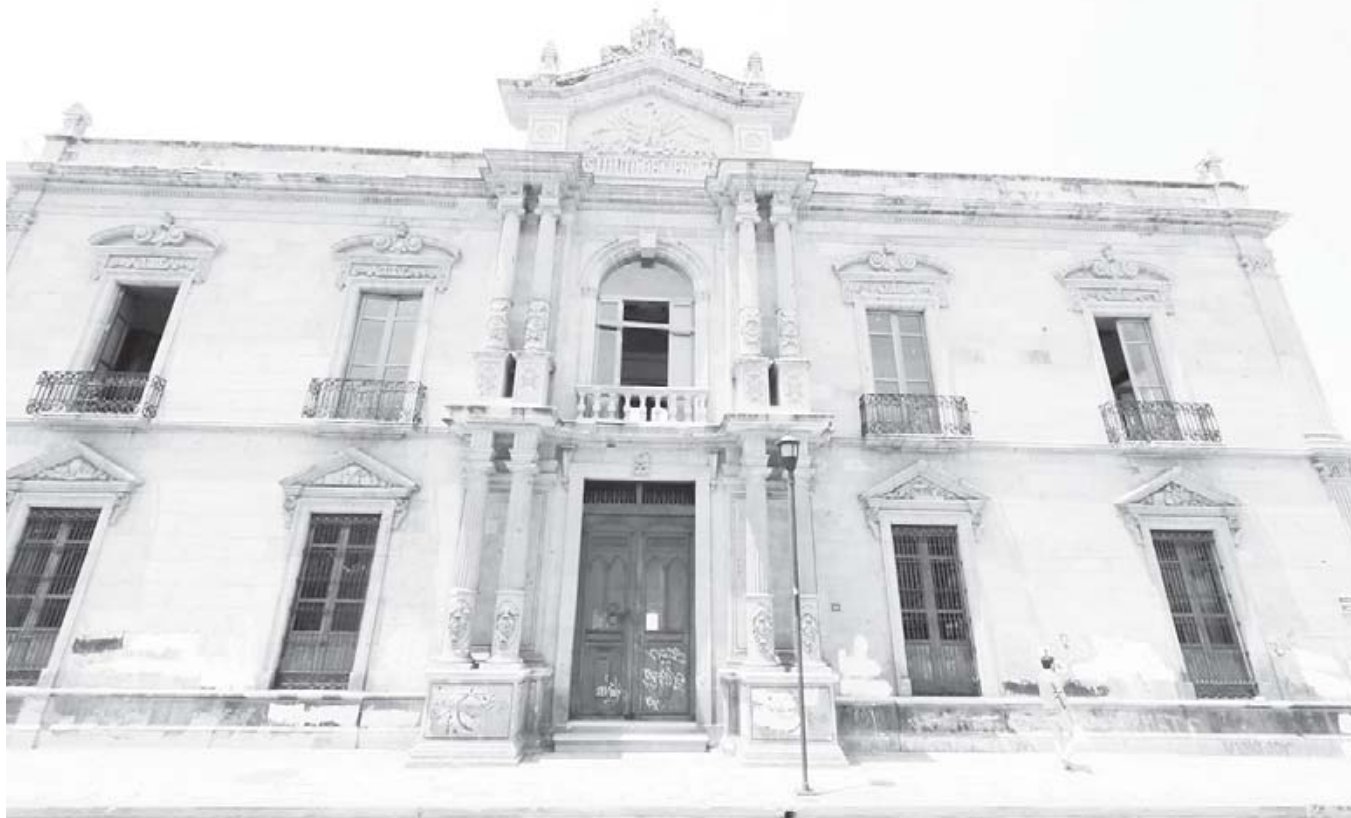
■ Actualmente el Edificio Central alberga la Facultad de Derecho y Ciencias Sociales, la Biblioteca, la oficina de Teatro Indígena y el Gimnasio Universitario.

Fundado en 1827, el Instituto de Ciencias y Artes del Estado de Oaxaca (ICAEO) ha sido cuna de destacados personajes como Benito Juárez y Porfirio Díaz. Durante el periodo de las Leyes de Reforma en 1859, los edificios conventuales de Santo Domingo, La Merced, San Agustín, El Carmen y San Francisco fueron desocupados, y el gobierno liberal oaxaqueño procedió a ocuparlos, incluyendo la sede del Obispado y el Colegio Seminario. Este último fue destinado como la nueva sede del Instituto de Ciencias y Artes del Estado.