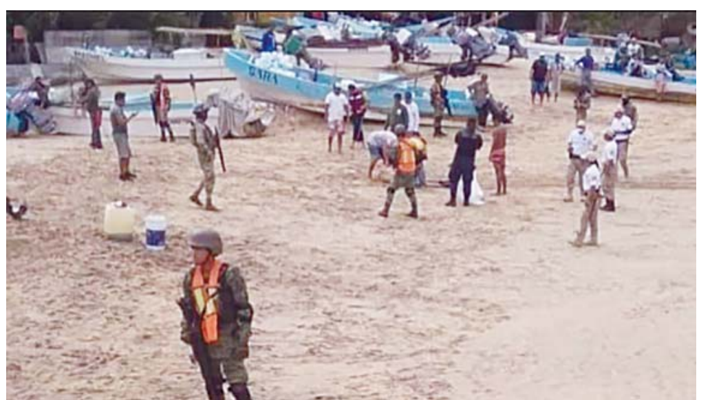
Las autoridades esperan que el hombre sea identificado legalmente en las próximas horas.

El cuerpo fue llevado al Servicio Médico Forense en San Pedro Pochutla, donde se le realizarían los estudios correspondientes y la necropsia conforme a la ley. Las autoridades ya trabajan para esclarecer lo ocurrido y establecer la identidad del hombre.