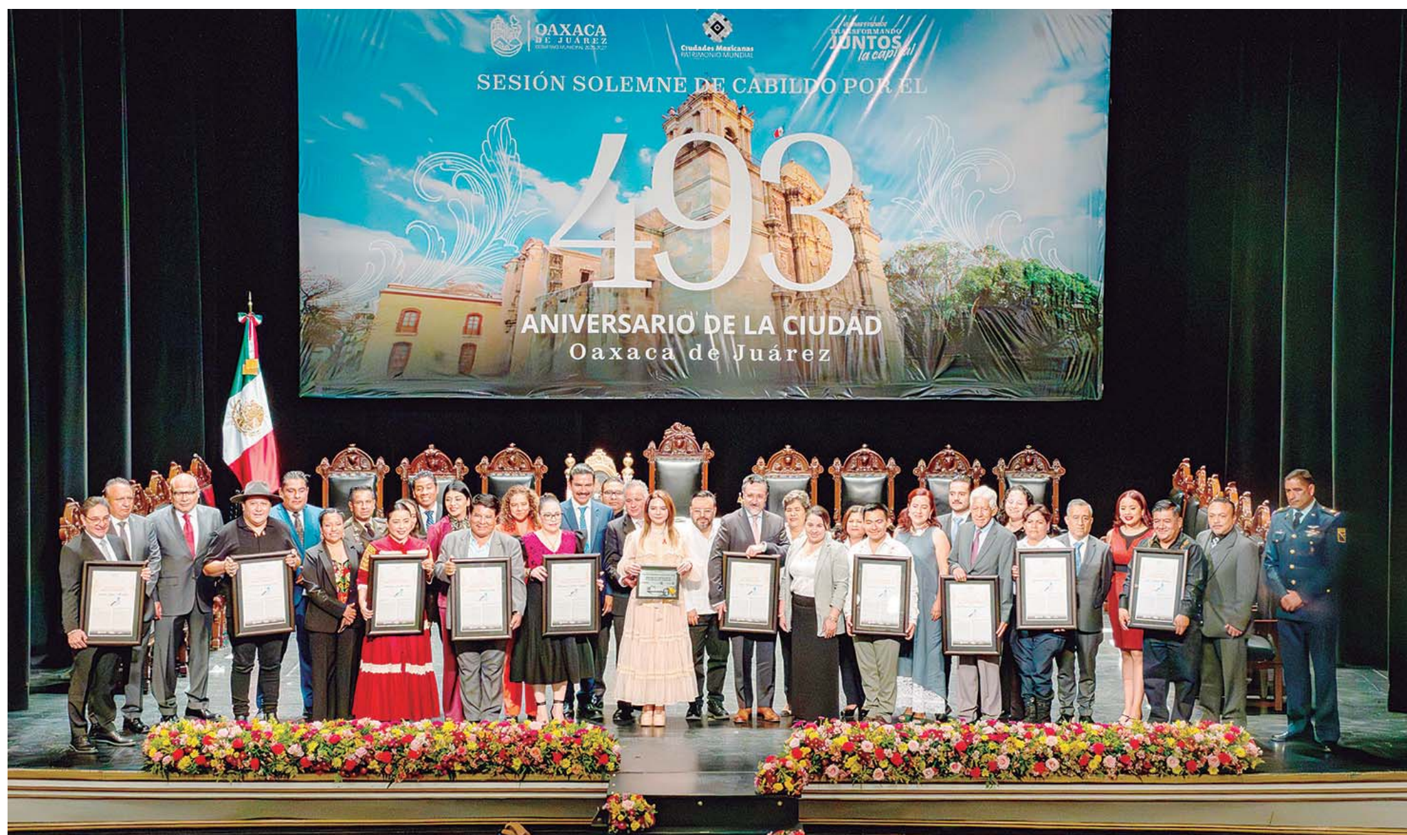
Se conmemoró este viernes el aniversario 493 de la elevación a rango de ciudad de la entonces Villa de Antequera y ahora Oaxaca de Juárez.