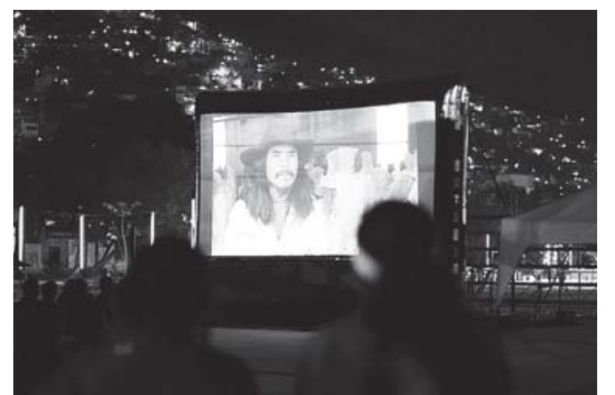
■ Oaxaca Cine presentó en el Parque Primavera la película "Reencuentros: 2501 Migrantes".

tas del Festival Primavera Rodolfo Morales continuarán hasta el 30 de abril, con más expresiones artísticas para el público