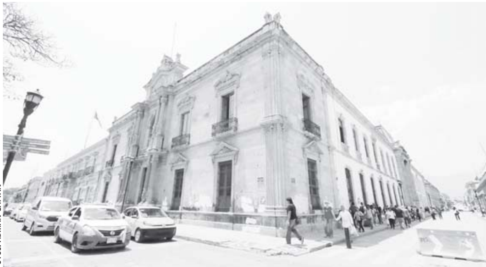
■ En 2024, se llevaron a cabo importantes trabajos de restauración y renovación en el Edificio Central.

Entre 1899 y 1901, el edificio fue reconstruido adoptando un estilo neorrenacentista con