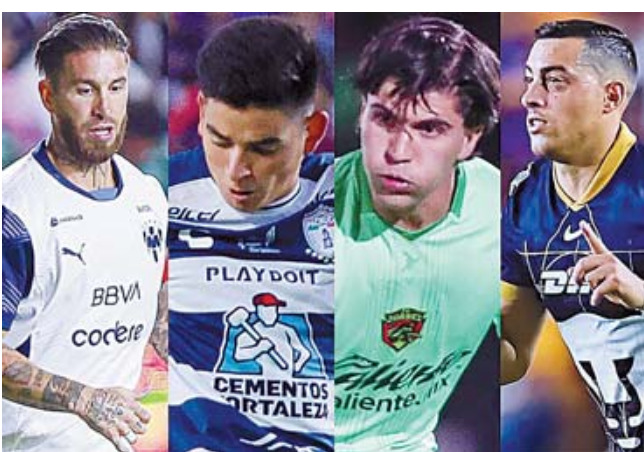
Los cuatro equipos darán lo mejor de sí para obtener un boleto a la liguilla.