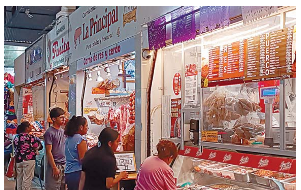
Además de los aumentos de precio, la cuaresma ha afectado al consumo de carne.

El kilogramo de tasajo se vende en 320 pesos, el de chorizo en 200 pesos y el de cecina en 260.