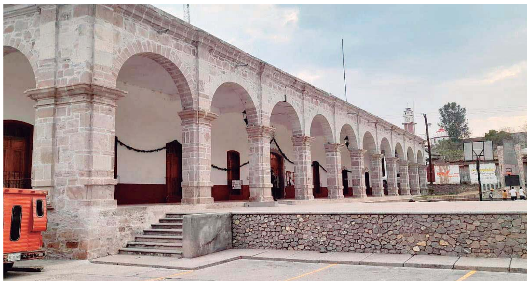
La tragedia ocurrió en el municipio de Tezoatlán de Segura y Luna, donde seis personas perdieron la vida en el interior de un pozo.

Al notar que no salía, otro agente descendió y corrió la misma suerte. Un tercero intentó hacer lo mismo y también quedó atrapado. El último policía que ingresó reportó sentirse mareado apenas tocó el fondo, por lo que fue rescatado en mal estado y trasladado a un hospital en Huajuapán de