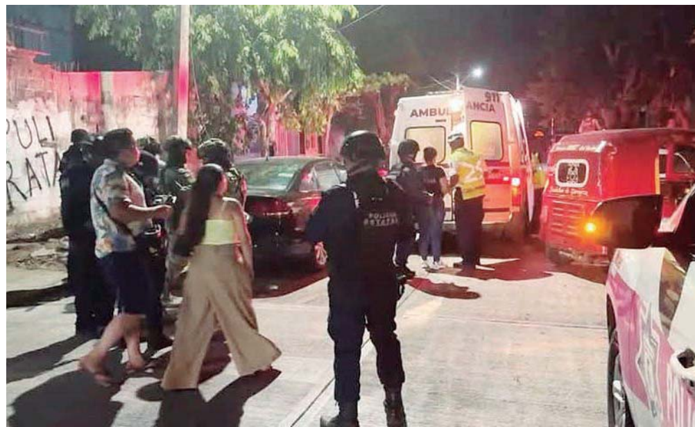
Autoridades acordonaron la zona y comenzaron con las investigaciones correspondientes.

El joven herido fue atendido por elementos del