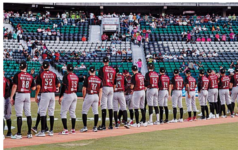
Guerreros de Oaxaca estará abriendo temporada este martes en el parque Lic. Eduardo Vasconcelos.