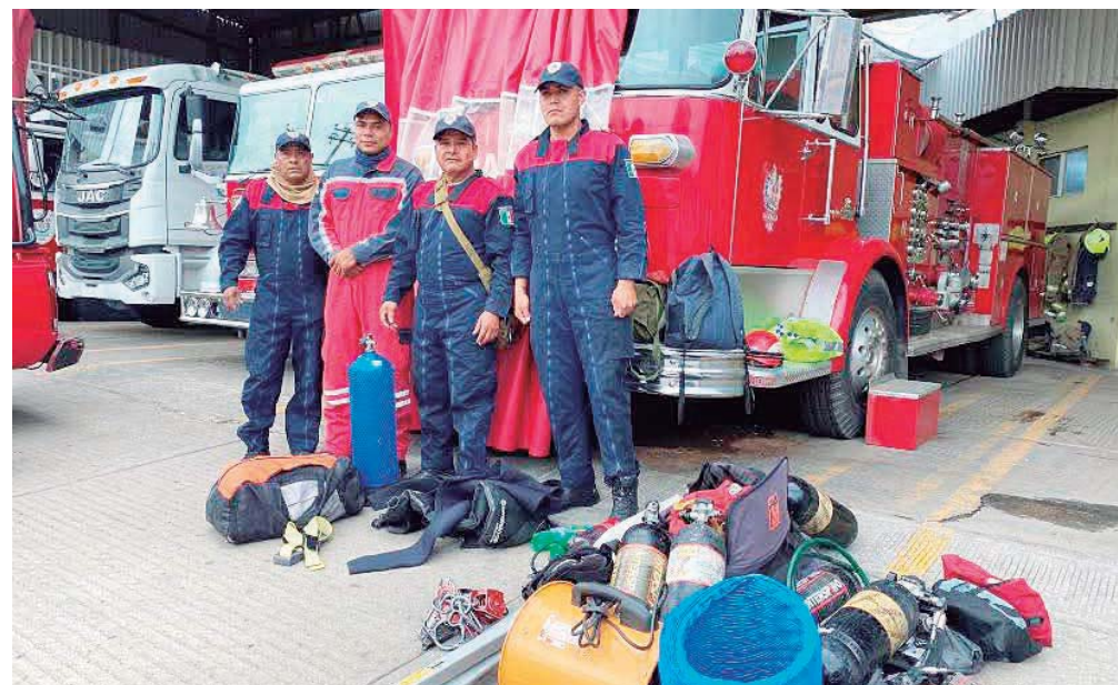
Los Bomberos de Oaxaca acudieron al llamado de auxilio para rescatar los cuerpos al interior del pozo.

León, donde su estado de salud fue reportado como grave.