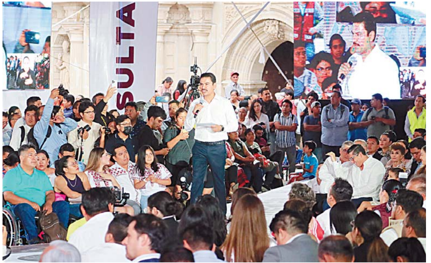
El presidente municipal de Oaxaca de Juárez presentó su informe desde la Plaza de la Danza.

El primer paso, dijo, fue poner orden en casa estableciendo los principios que guían su gobierno, planeando con responsabilidad y con profesionalis-