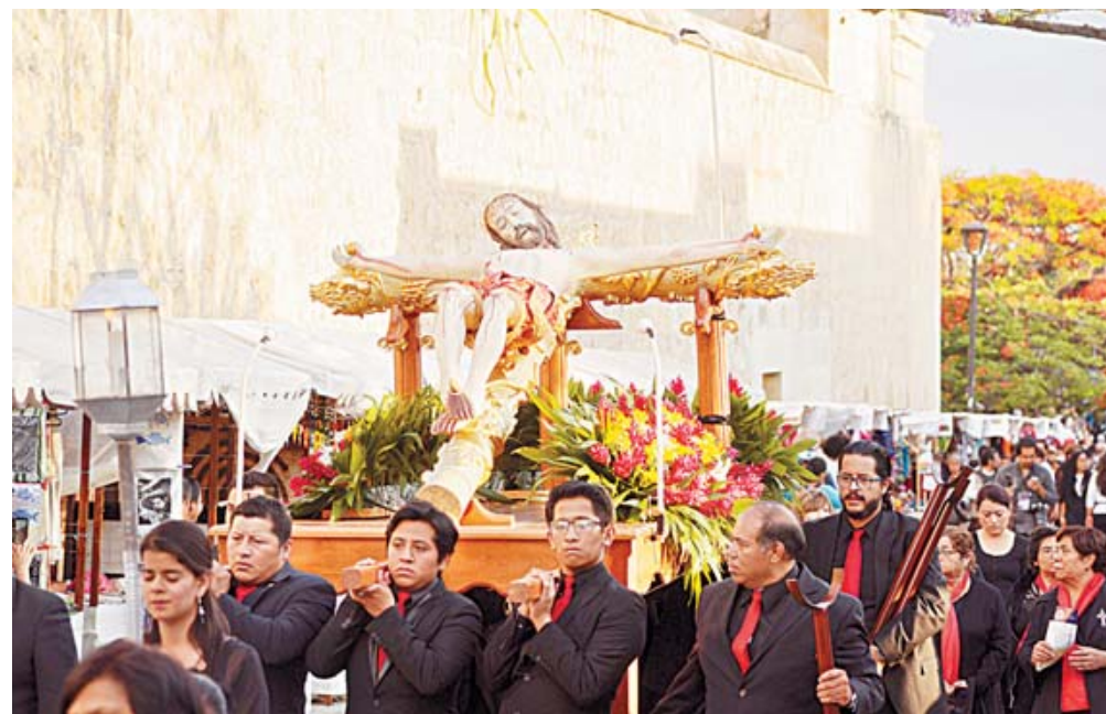
Esta actividad congrega a varios templos, a la Hermandad del Santísimo Rosario y cofradías de la Arquidiócesis de Antequera.

El contingente de feligreses e imágenes, entre estas la de la Virgen de