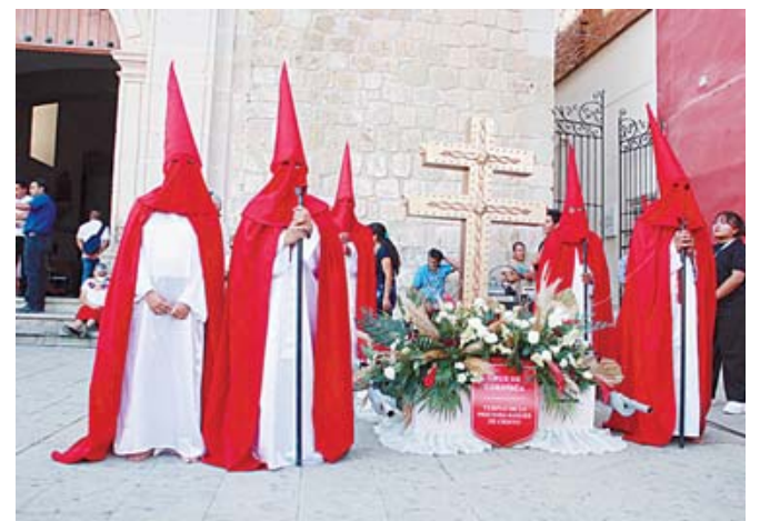
El recorrido conmemora la muerte de Jesús tras su crucifixión.

quera, entre otras personas y grupos como la Hermandad del Santísimo Rosario y cofradías de la Arquidiócesis de Antequera.