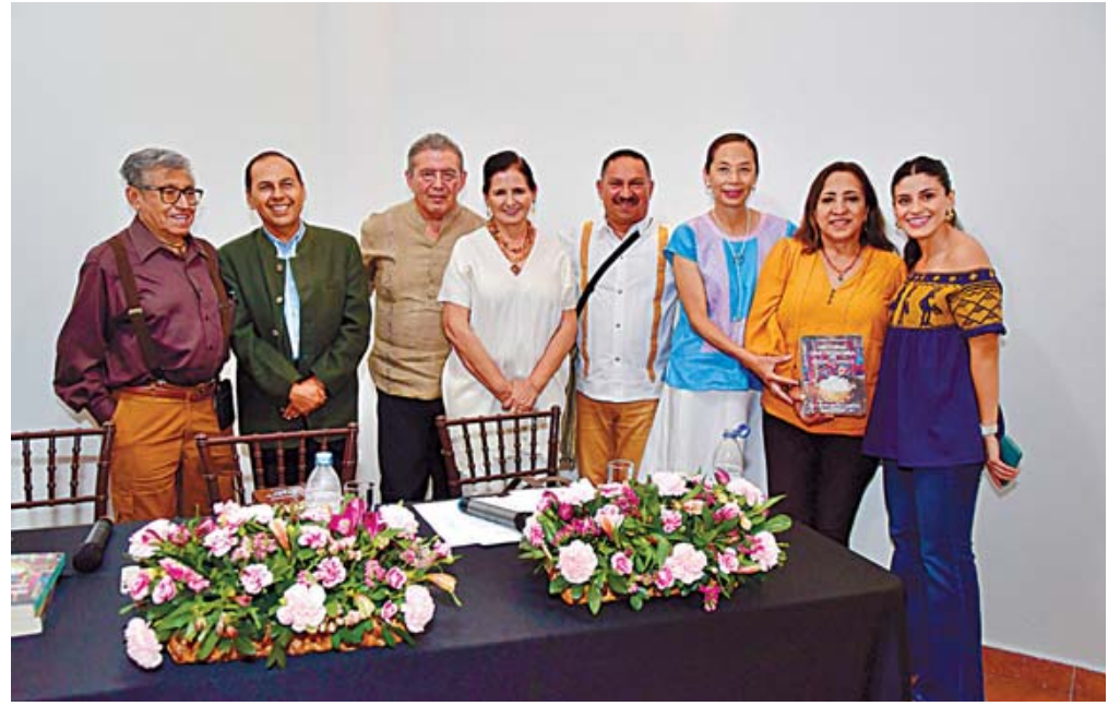
Periodistas compartieron este momento con los propietarios del restaurante.