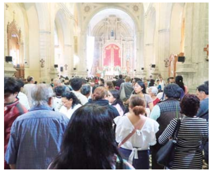
■ Al caer la noche, los templos del Centro Histórico se llenaron de feligreses.

Al agradecer la presencia de las y los feligreses, pidió vivir con fe estos Días santos de la pasión de Cristo.