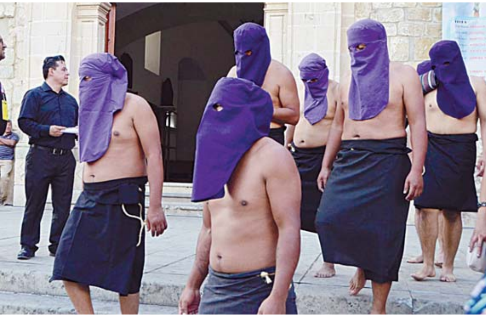
La procesión tendrá como punto de partida y llegada el templo de la Preciosa Sangre de Cristo.