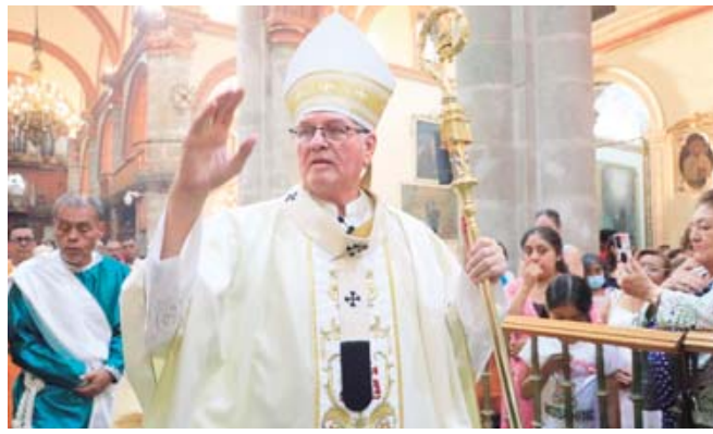
■ El Arzobispo de Antequera Oaxaca exhortó a las y los feligreses a servir a los demás con caridad y amor como un signo de amor a Dios.