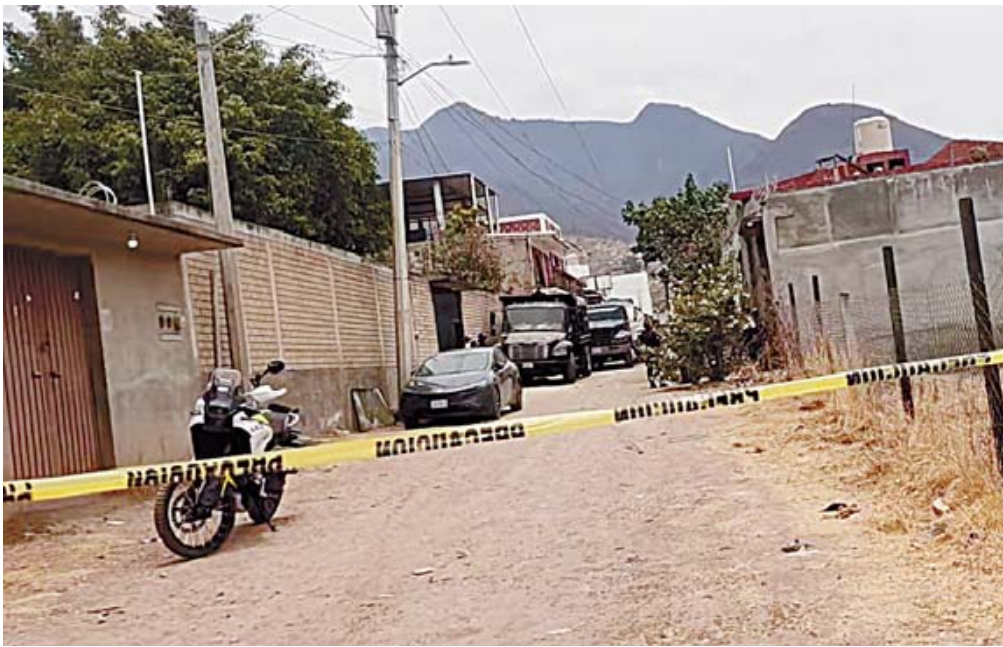
■ Corporaciones de los tres niveles de gobierno desplegaron un operativo de búsqueda.