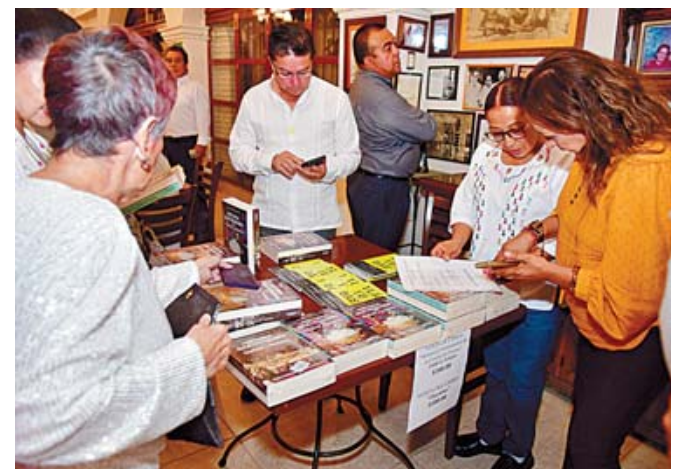
Los asistentes adquirieron sus libros que fueron autografiados.