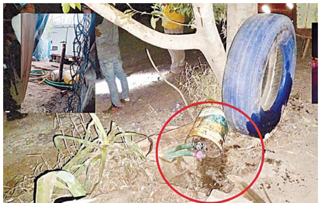
■ El área donde se localizó la toma clandestina y la pipa fueron aseguradas.

pada con dos tanques de almacenamiento, uno con capacidad para 19 mil 800 litros y otro de 35 mil 500 litros, lo que suma más de