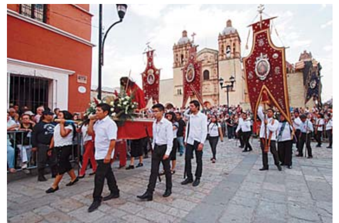
La tradición de origen español cumplirá 39 años de que se retomó en 1986.