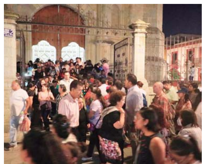
■ Oaxaca mantiene viva una de sus tradiciones religiosas más profundas.

Así, entre rezos, reflexión y símbolos sagrados, Oaxaca mantiene viva una de sus tradiciones religiosas más profundas, reviviendo cada año el camino de Jesús hacia el sacrificio y renovando el espíritu de fe en las nuevas generaciones.