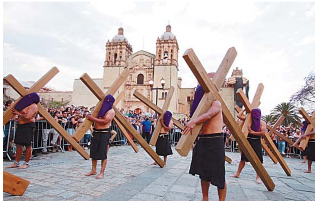
Esta tradición católica de origen español se realiza también en otras partes de México.

Esta tradición fue legada por los frailes dominicos pero con larga pausa tras la Revolución