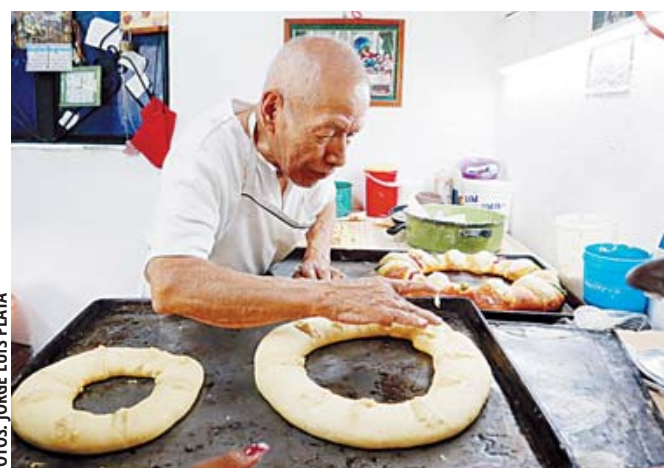
El famoso panadero compartió su trabajo con una gran alegría.

El 5 de enero llegó al domicilio de don Betito para hacerle una entrevista y compartirlo a través de EL IMPARCIAL, la Oganización