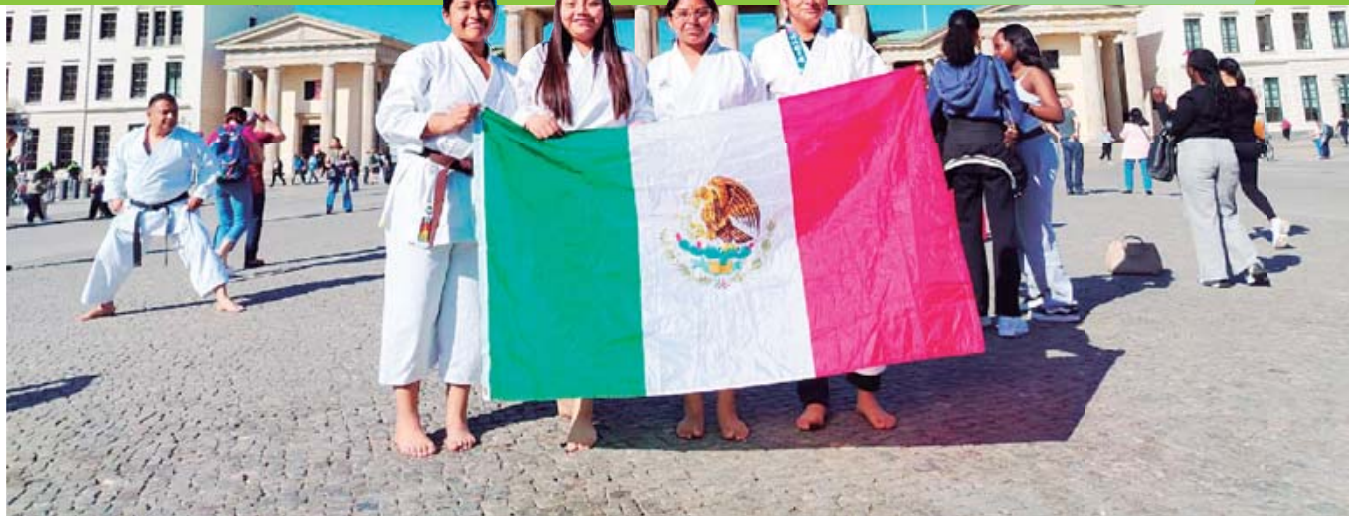
■ Demostraron su calidad y potencial en Berlín, Alemania.