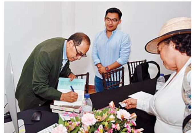
Durante el evento se llevó a cabo la firma de libros.