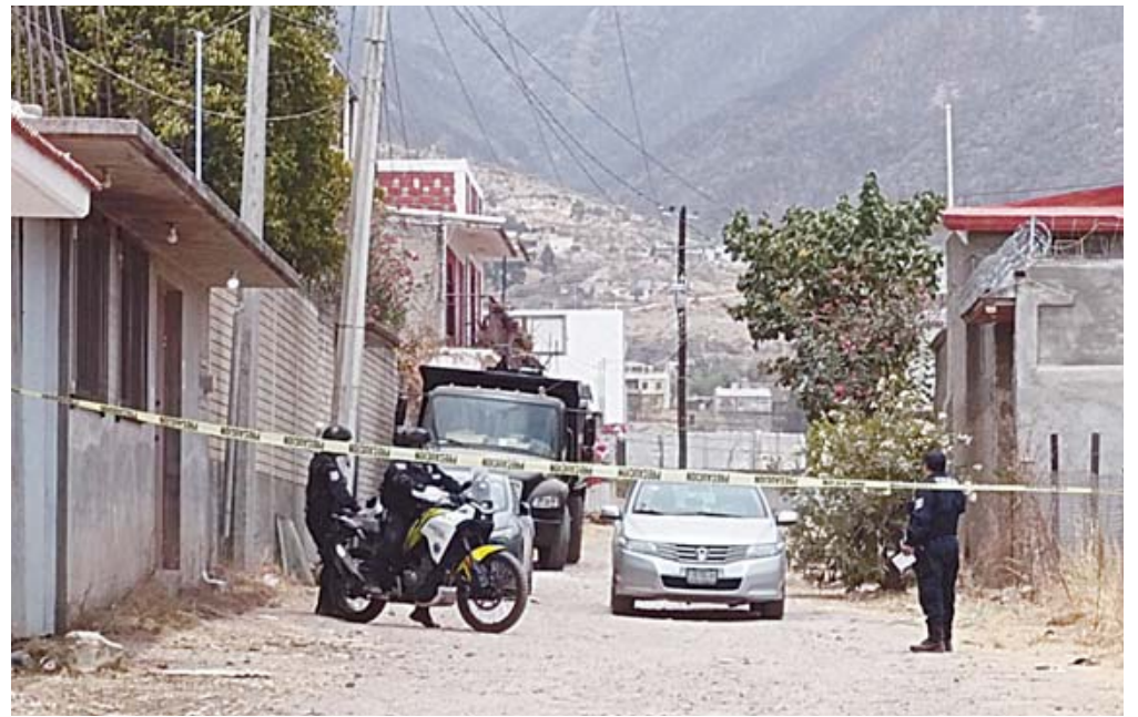
■ La zona fue acordonada por las autoridades para las primeras investigaciones.

Sujetos armados irrumpieron en un domicilio, mataron a un perro e intentaron secuestrar a dos personas; hay detenidos