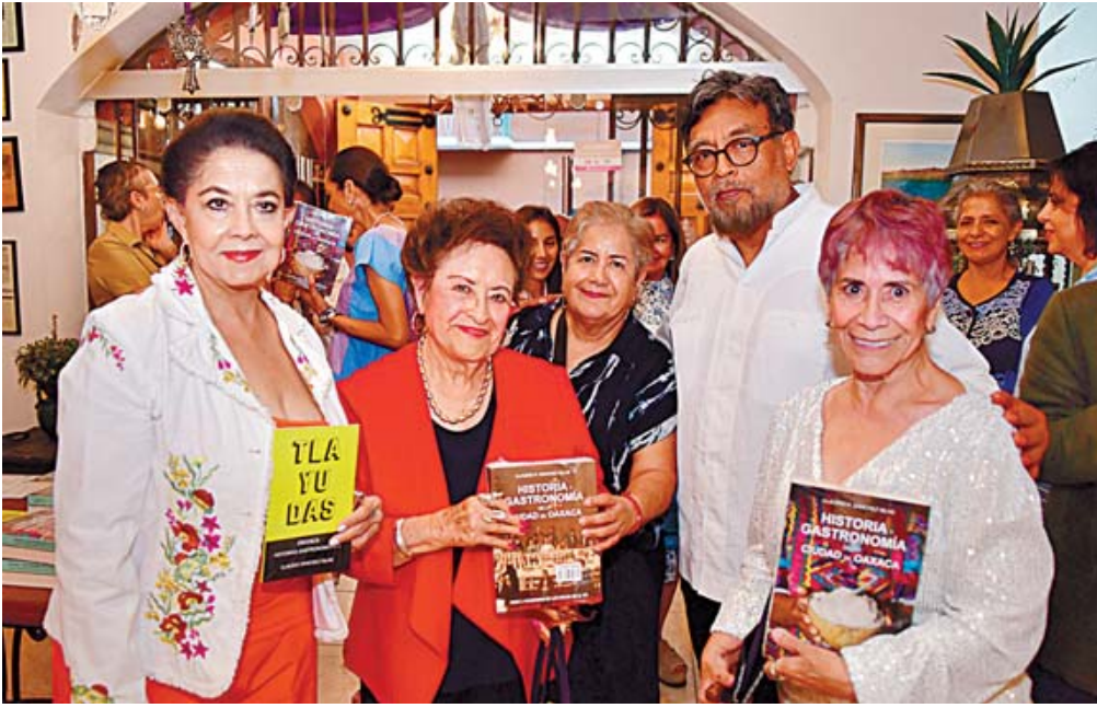
Los integrantes del Seminario de Cultura Oaxaqueña estuvieron presentes en el evento.

Para todo. Ayuda a mantener la piel hidratada, mejora la elasticidad, protege tu corazón, lubrica tus articulaciones, fortalece el cabello y hasta mejora tu estado de ánimo. Además, tiene propiedades antiinflamatorias que son buenas para combatir acné, hinchazón o rojeces en la piel.