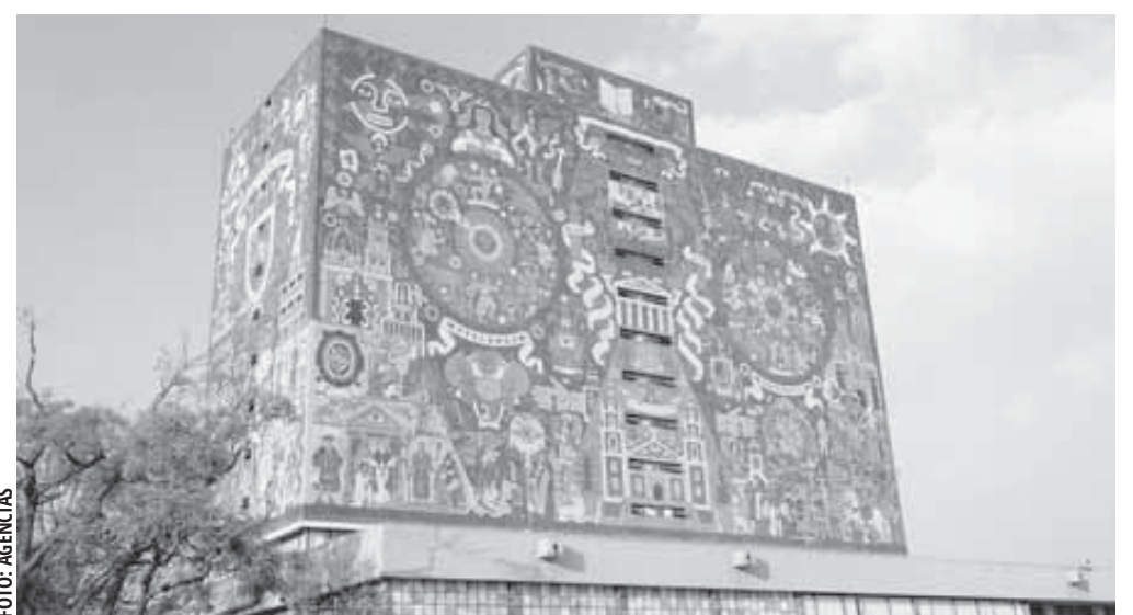
Entre las metas principales de la ENES se encuentran: ampliar la cobertura en la educación superior.

De acuerdo con la Propuesta de Creación de la Escuela, en el ciclo escolar 2023-2024 en dicha entidad federativa se atendieron a 84 mil 670 alumnas