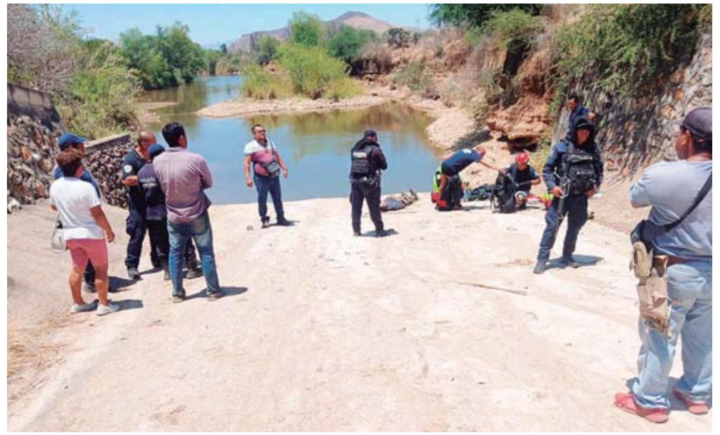
■ El cuerpo del campesino no presentaba lesiones visibles ni signos de violencia.

Elementos del Heroico Cuerpo de Bomberos asistieron al apoyo en el río Paredón Colorado