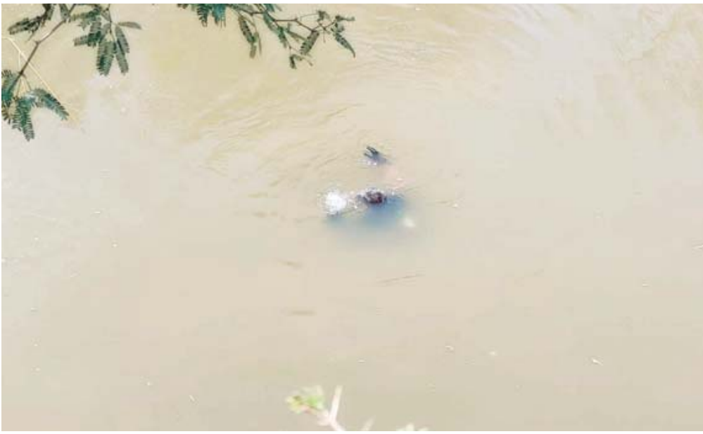
■ Pastores observaron el cuerpo flotando y avisaron a las autoridades.