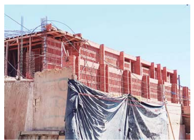
Tras numerosos retrasos, la obra continúa inconclusa con 90 por ciento de avance alcanzado.

Pero los retrasos generaron la inconformidad de las y los locatarios que se manifestaron en febrero de 2024 y a quienes entonces se les informó que los avances eran apenas de entre el 35 y el 40