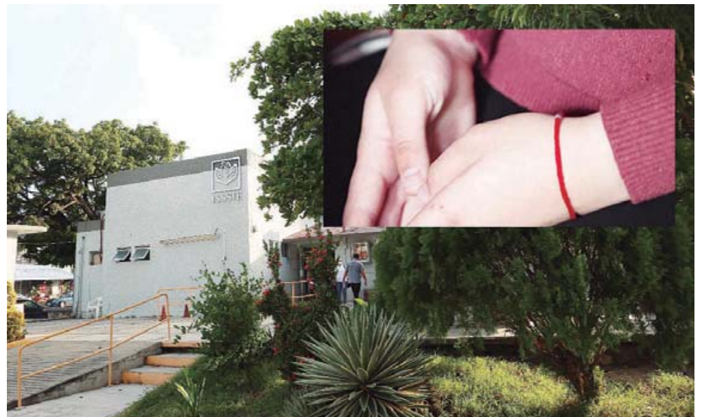
■ La denuncia pone de relieve la importancia de la intervención de las autoridades y la implementación de protocolos adecuados para proteger a los estudiantes.

La denuncia ha generado una ola de indignación entre los estudiantes del Conalep, la comunidad del hospital y la ciudadanía de Salina Cruz. Exigen que las autoridades no minimicen el caso y tomen medidas más serias, no solo para garantizar justicia para la víctima, sino también para proteger a otros estudiantes en prácticas profesionales.