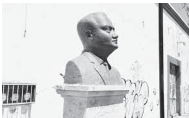
Álvaro Carrillo murió tras un percance automovilístico la noche de un 3 de abril de 1969.

Para garantizar su valor nutricional y calidad, en el laboratorio de la profesora Gómez se realizaron diversos análisis al producto final, como el recuento de bacterias probióticas para determinar cuántas se mantienen vivas tras la cocción de la tortilla. También se calculó su contenido de humedad, se hicieron estudios de textura (rolabilidad, prueba de tensión o distancia de ruptura), y se efectuó un análisis químico proximal para determinar su cantidad de proteínas, carbohidratos, grasas, vitaminas del grupo B y minerales, entre otros aspectos.