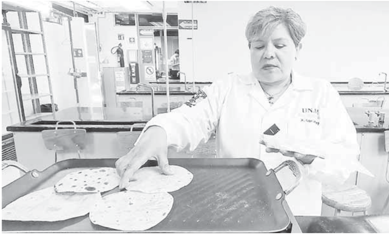
Se trata de un alimento elaborado con ingredientes naturales y beneficioso para la salud.

“Nuestra tortilla nutracéutica se caracteriza por