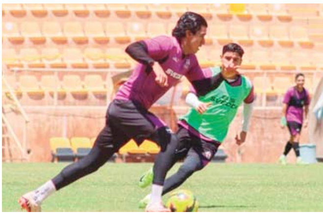
■ Alebrijes buscará regalarte los tres puntos este viernes a su afición.

Para la fecha 14, los Guardianes de la Verde Antequera visitan al Tepatlán (11 de abril), que pelea de momento por el boleto a liguilla, y cierran la fase regular en el Estadio del ITO, como anfitriones de Dorados, el 19 del mes en curso.