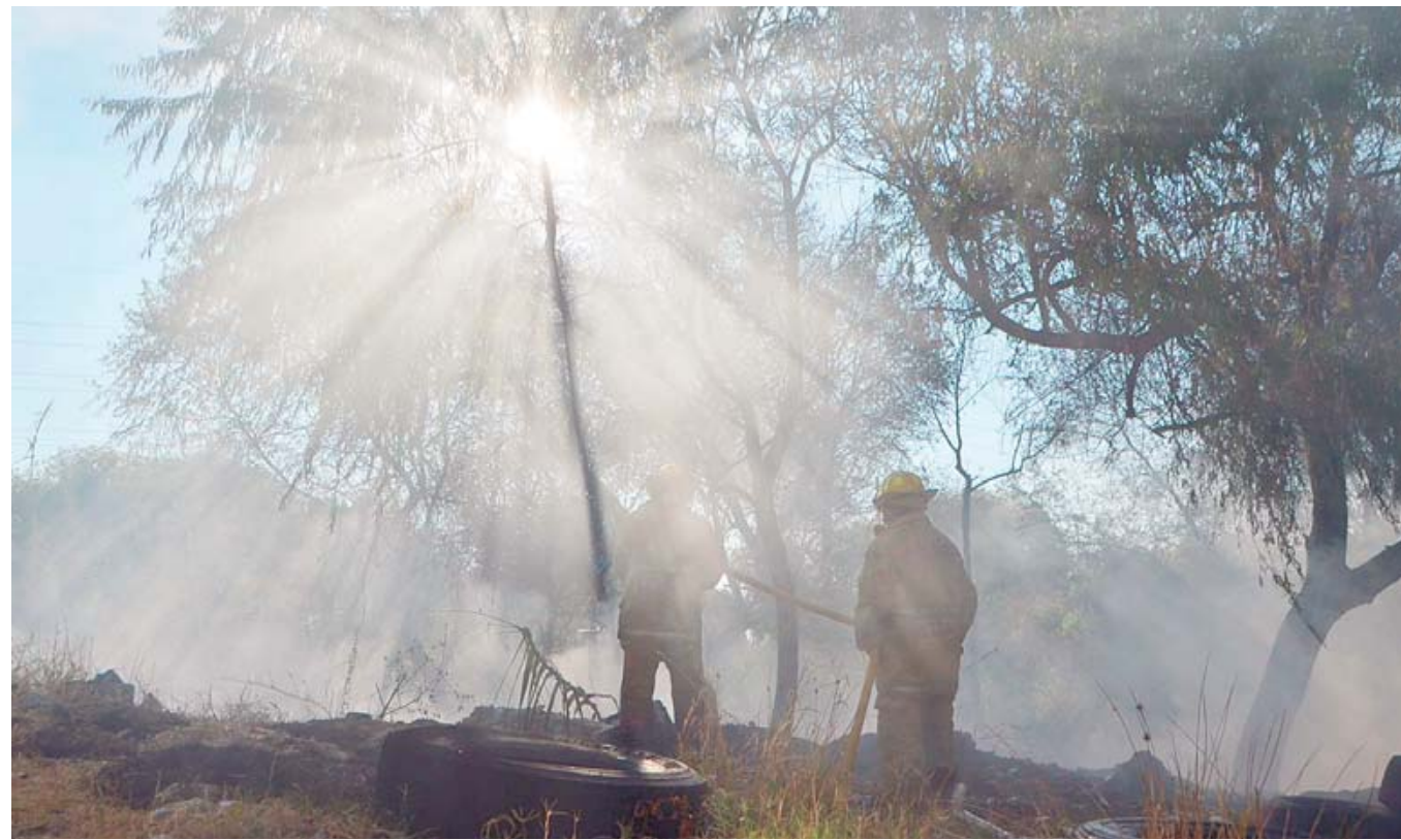
La basura acumulada, la actividad humana y el calor de esta temporada han provocado numerosas conflagraciones en los últimos 15 días.