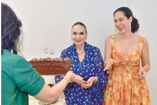
■ Sus hijas le cantaron Las Mañanitas, al tiempo que ella soplabla sus velitas.

la festejada acompañadas de alegres porras.