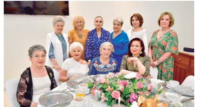
■ Estuvieron presentes sus amigas, quienes le desearon lo mejor.