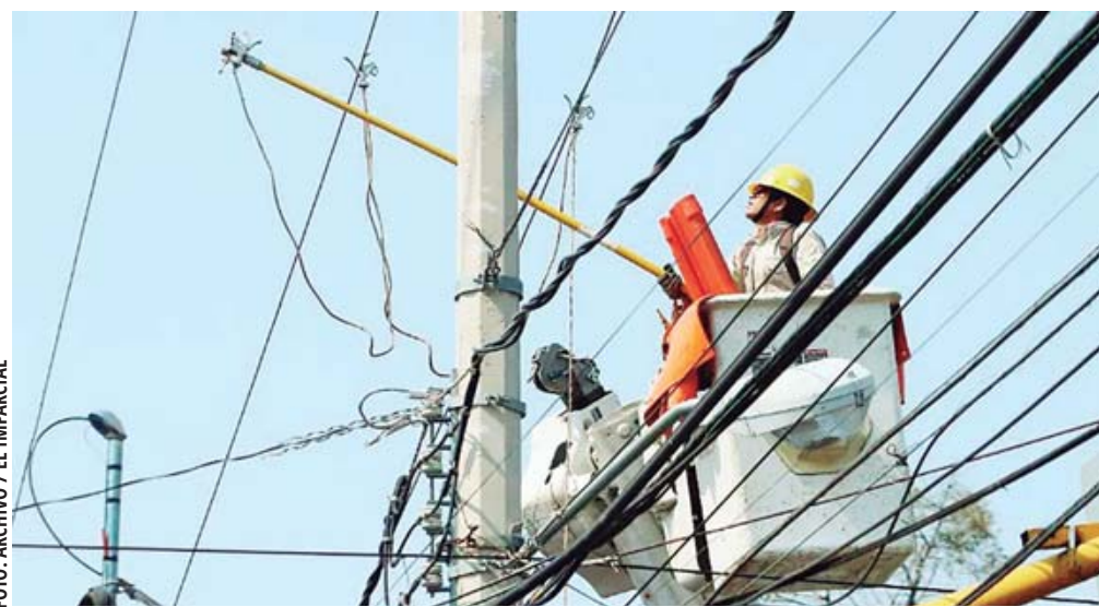
■ Oaxaca padece en promedio 10 cortes de energía o apagones al día, de acuerdo con los reportes de la CFE, de los últimos cinco años.

De acuerdo a una respuesta a una solicitud de información en poder de EL IMPARCIAL, en el último lustro, de 2019 a abril de 2024, los casi 20 mil días de ese periodo la empresa pública da cuenta de un promedio al día de 10 cortes de energía, conocidos como apagones, en algún punto de Oaxaca.