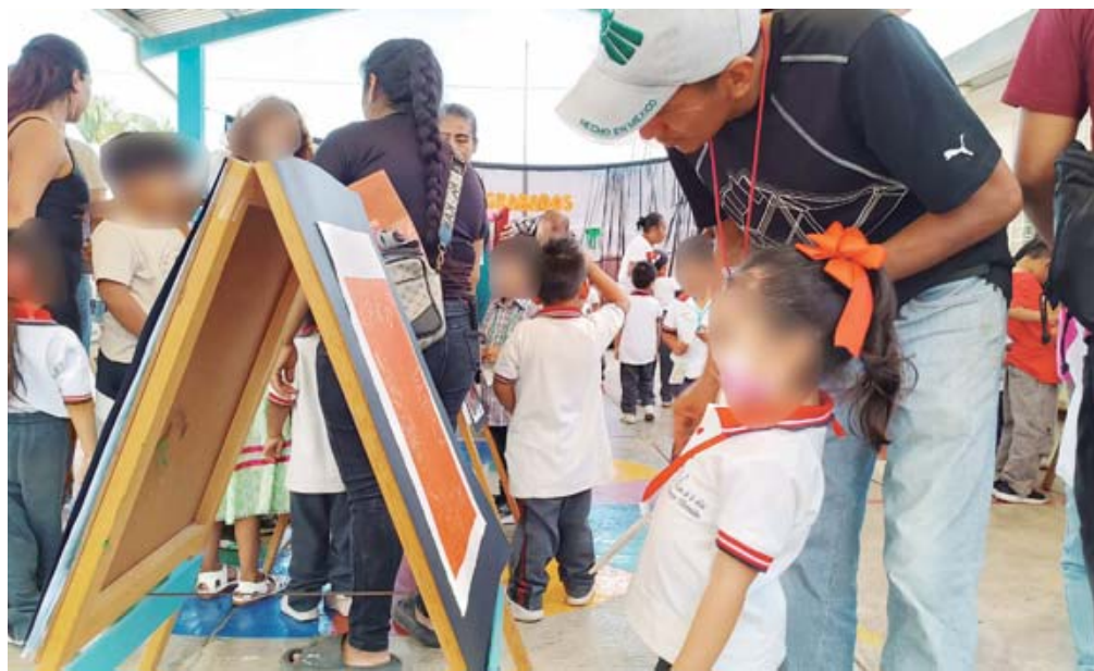
• Los grabados fueron hechos por infantes de 3 a 5 años de edad.

El taller se impartió en los primeros días de marzo en colaboración con las docentes de la escuela y padres de familia. Además de los tres grabados de cada estudiante, se hicieron piezas colectivas que tam-