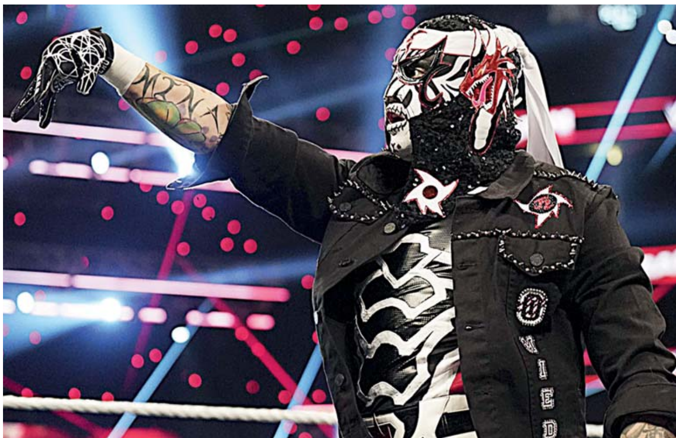
■ Penta Zero Miedo sumó su segunda derrota consecutiva en la WWE.

León comparte el Grupo D del Mundial de Clubes 2025 con Chelsea, Flamengo y Espérance de Túnez, por lo que el equipo que entre en lugar de ‘La Fiera’ estaría destinado a enfrentarse a estos rivales en la fase de grupos.