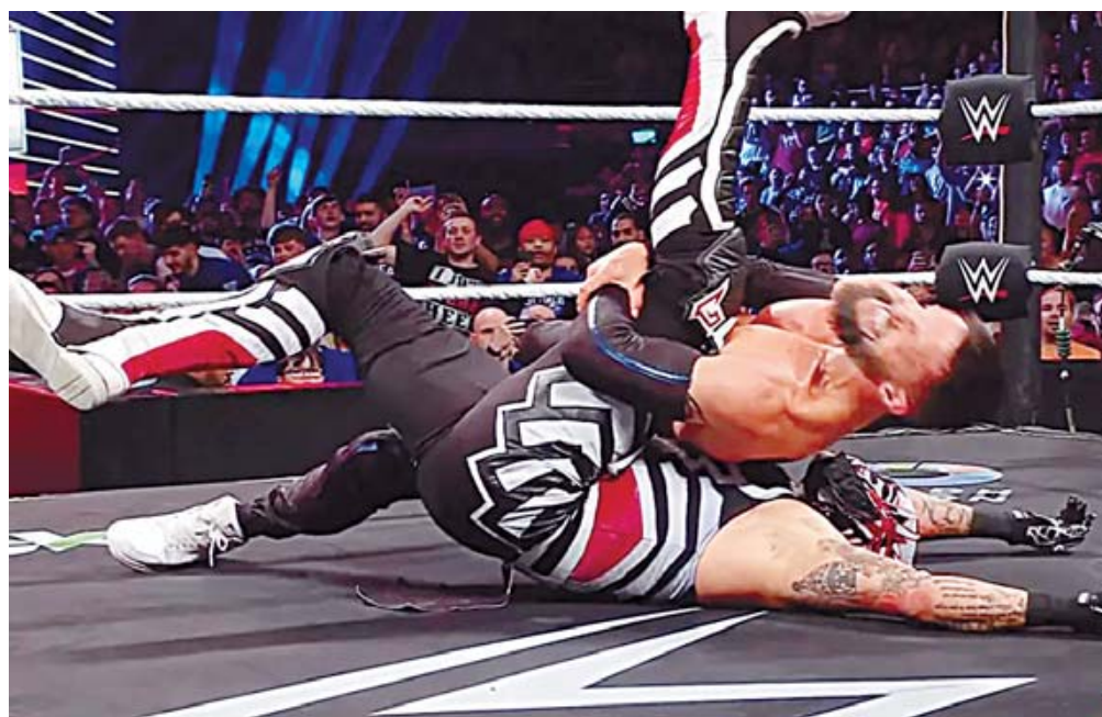
■ El mexicano dejó en claro que no se quedará tranquilo con la lanza que recibió.

El luchador mexicano recibió un ataque de su compañero de lucha, para recibir el conteo de tres por parte de Bálor