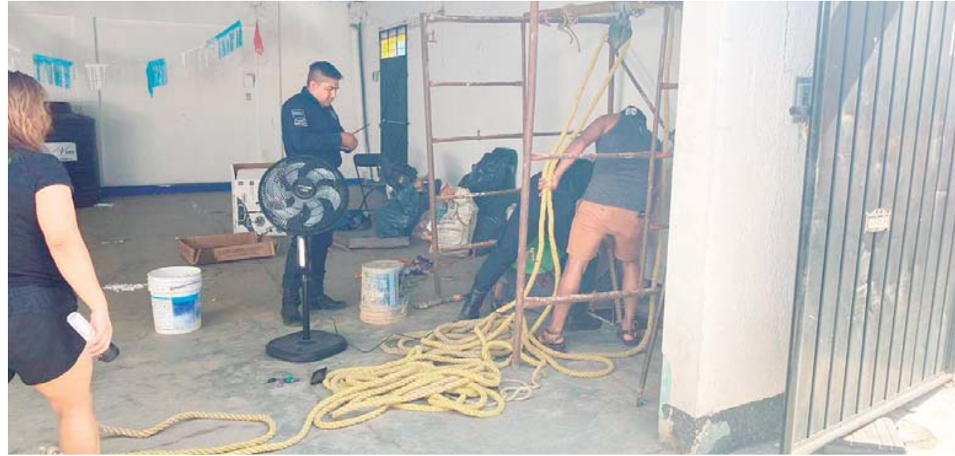
■ Los hermanos iban a realizar la limpieza de un pozo, cuando ambos tuvieron dificultades para respirar y salir.

fue recibida por el Centro de Control, Comando y Comunicación (C-4), alertando sobre la caída de los dos hombres en el pozo.