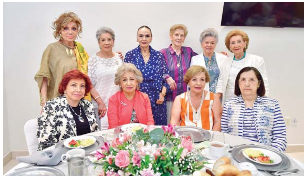
■ La festejada disfrutó la compañía de sus amigas.