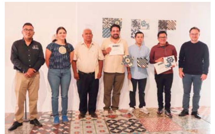
• Los ganadores recibieron como premio 20, 10 y 5 metros cuadrados de la baldosa de su autoría.