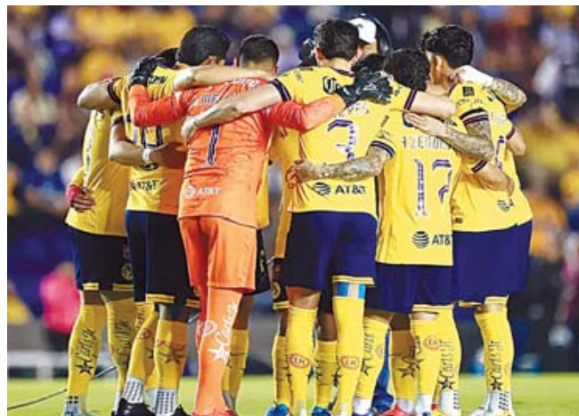
■ América rompe el silencio y aclara el rumor.

De hecho, se dice que el plan de los creativos de la WWE, es que Penta luche por el título intercontinental en una batalla de cuatro luchadores, el mexicano, Bron Breakker, que es el campeón, Dominik Mysterio y Finn Bálor.