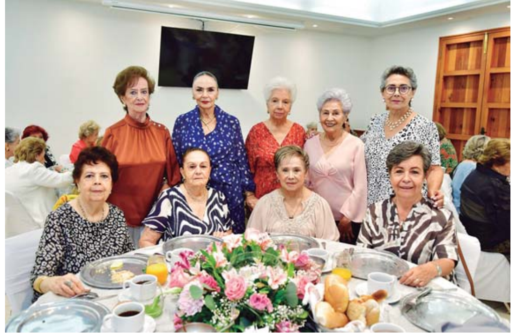
■ Disfrutó al máximo este bello momento con sus amigas.