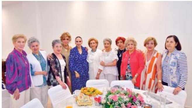
■ Este momento fue atesorado por la cumpleañera.