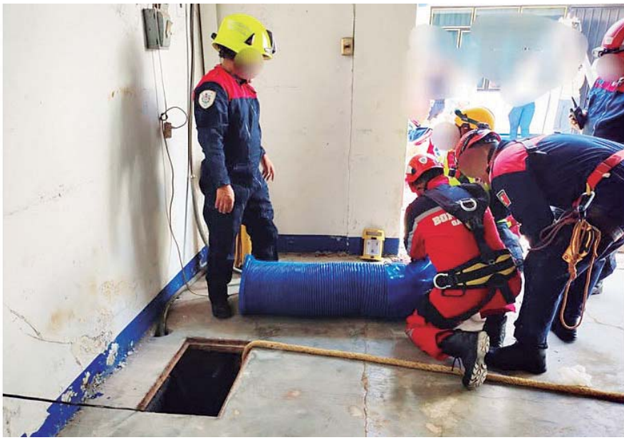
■ Un equipo especialista descendió para recuperar los cuerpos.