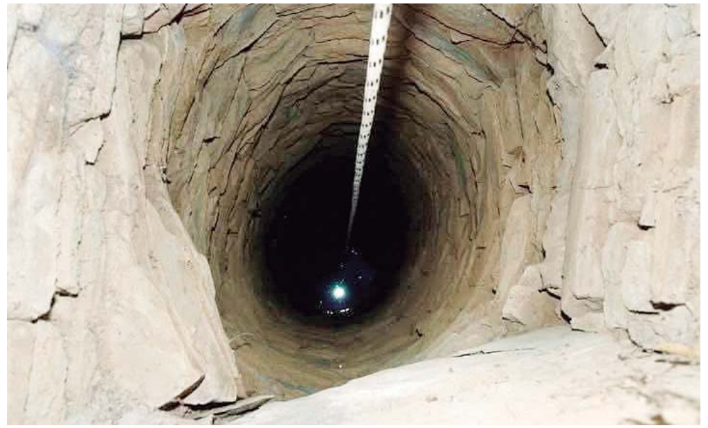
■ El pozo cuenta con una profundidad aproximada de 15 metros.