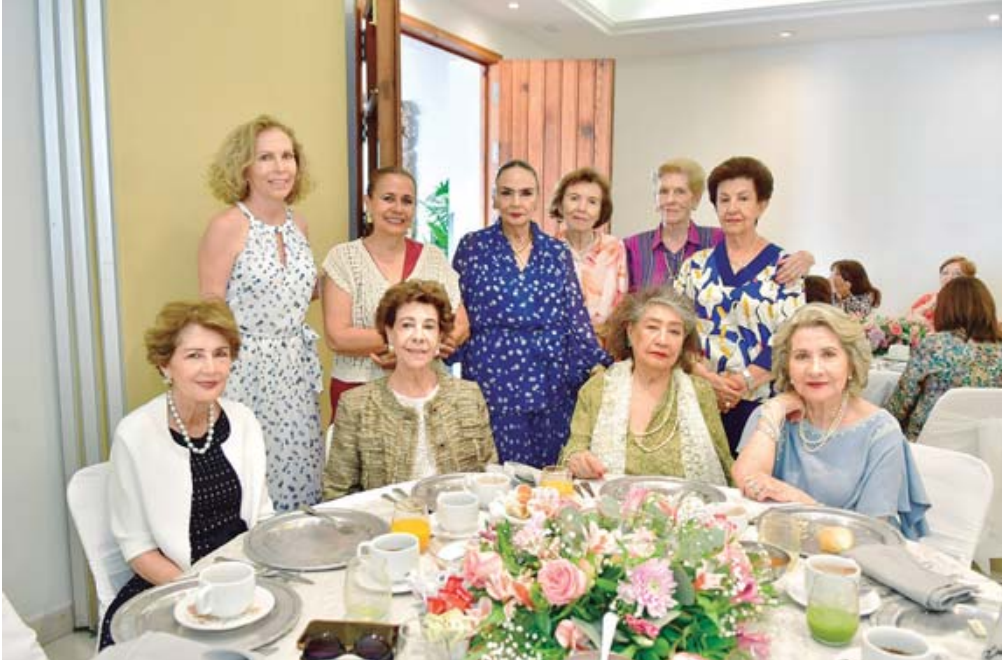
■ Bonitos detalles recibió la cumpleañera en su día.

estilo@imparcialenlinea.com Tel. 501 8300 Ext. 3174