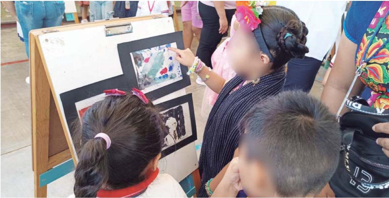
• Su entorno familiar, su contexto comunitario y sus sueños fueron los temas.

Los grabados fueron hechos por infantes de 3 a 5 años de edad, a quienes se les enseñaron las técnicas de monotipo y grabado en relieve. Aunque la también tallerista ha trabajado con mujeres e infantes, esta es la primera vez que compar-