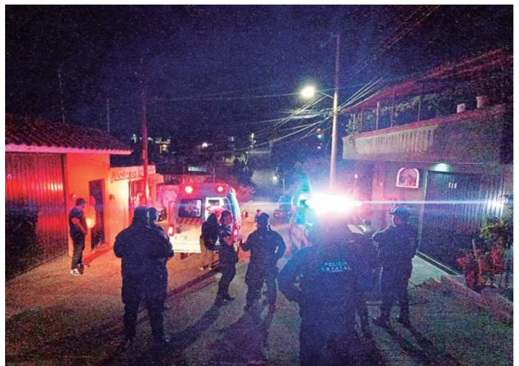
■ El hombre fue atendido por un paramédico y trasladado al Hospital Civil.

También se reportó un accidente en la avenida Gómez Morín, aunque no se cuenta con detalles específicos sobre los involucrados. No se ha confirmado si hay personas heridas o fallecidas, ni las circunstancias del incidente. Al igual que en el caso anterior, se dio intervención a las autoridades correspondientes para esclarecer lo sucedido.