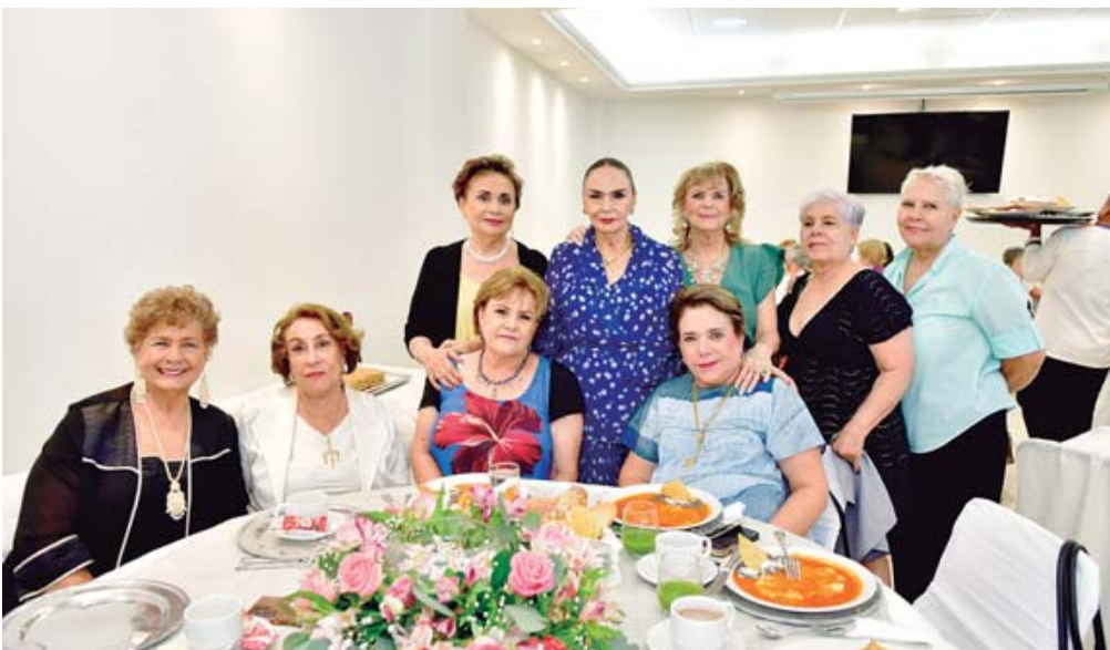
■ La cumpleañera agradeció cada muestra de cariño que recibió.