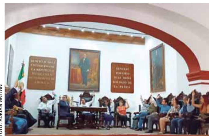
En sesión de cabildo, aprueban solicitar un adelanto de las participaciones federales.