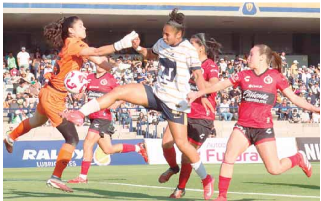
■ Las felinas siguen mostrando poca contundencia al ataque.

Pumas Femenil sumó una victoria por la mínima ante Tijuana, pero sigue exhibiendo fallas al frente