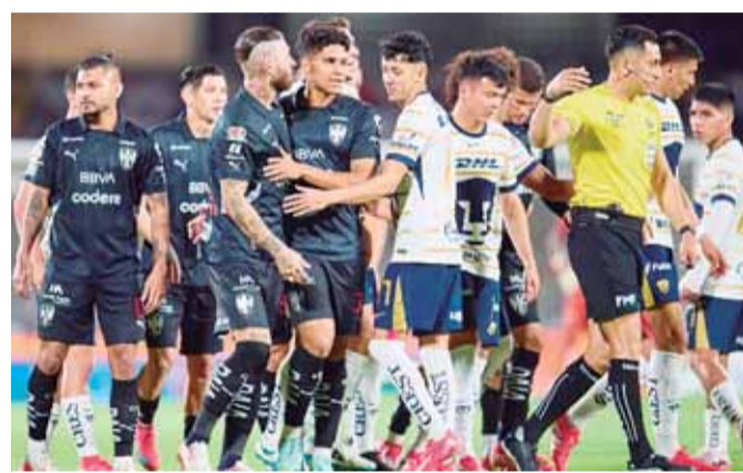
■ Pumas pidió una investigación a la Comisión de Árbitros.