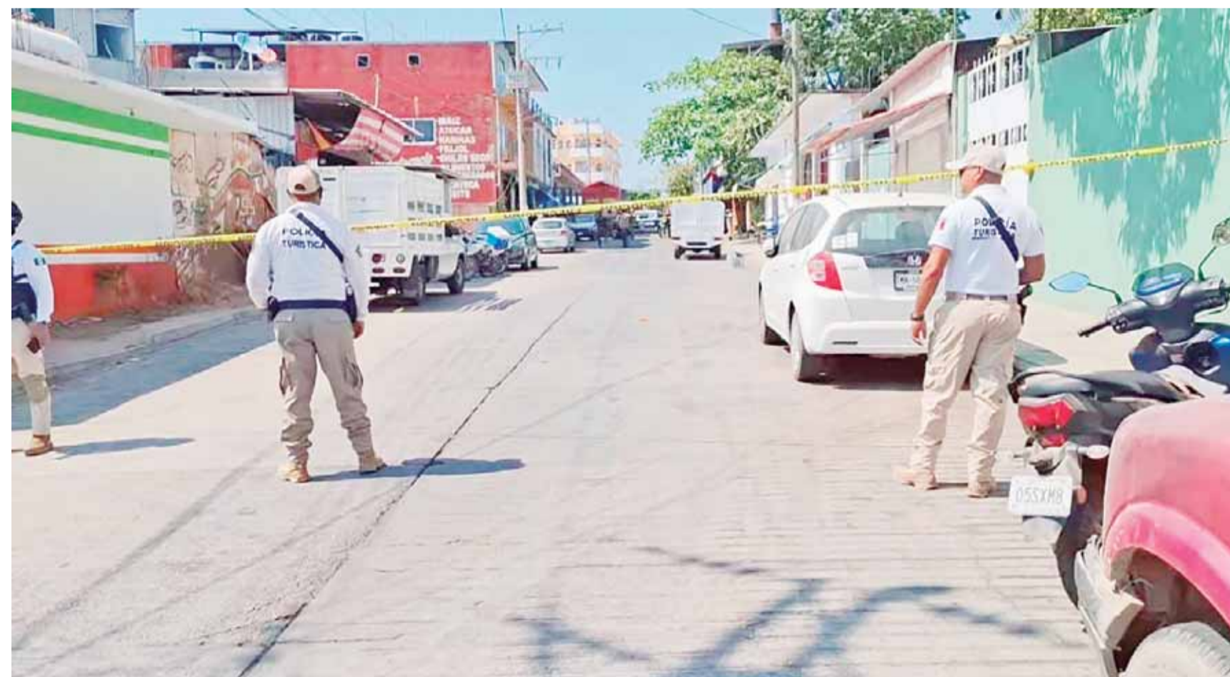
■ La zona fue resguardada por la autoridad para que no se contaminara la escena del crimen.