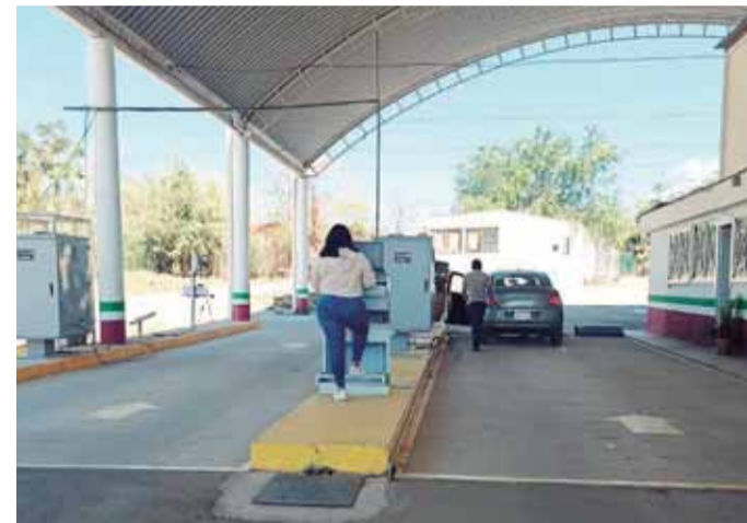
Centro de Verificación Vehicular de San Lorenzo Cacaotepec, con baja demanda.

mos suficiente capacidad para atender quienes tengan a bien de verificar sus unidades”, señalaron los trabajadores de un centro de verificación que se ubica sobre la Carretera Federal 190.