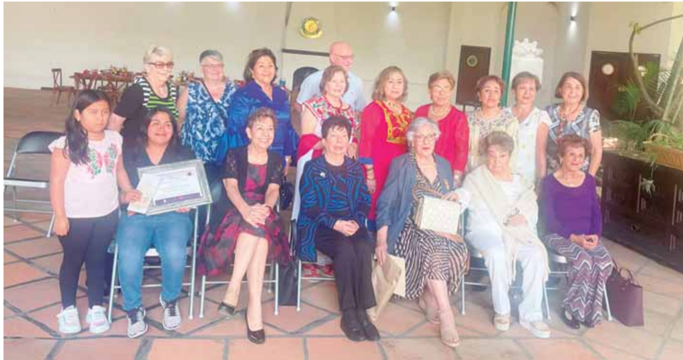
En el evento se hizo entrega del premio a la ganadora del premio "Vive tu sueño", que entregó el Club Soroptimista Internacional.