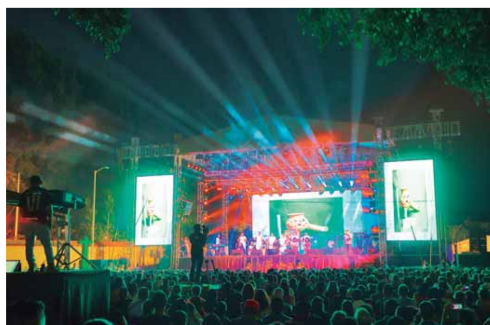
Las familias podrán disfrutar también de los deliciosos tamales y atoles que ofrecen cocineras tradicionales.