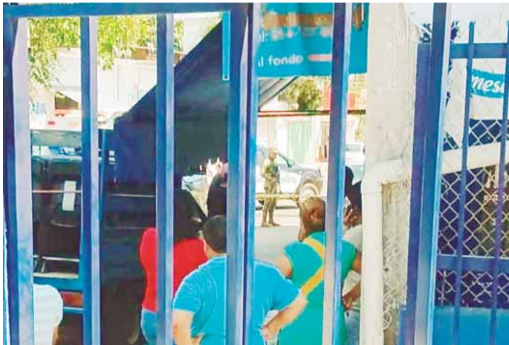
■ Vecinos curioseaban la zona, debido a que escucharon los disparos.