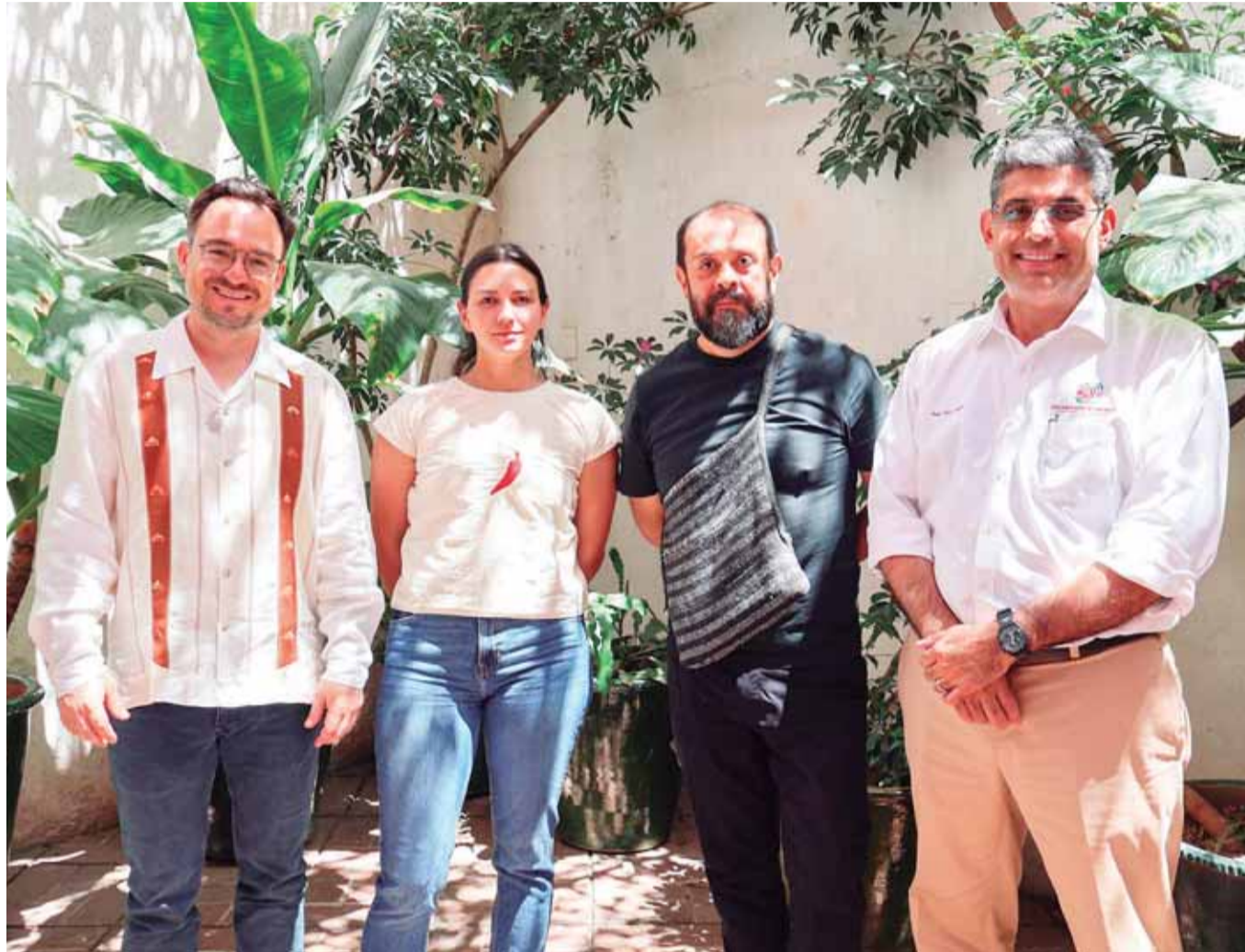
La convocatoria Primera Exposición Individual fue emitida por primera vez en el año 2022, buscando reconocer a creadoras y creadores oaxaqueños.