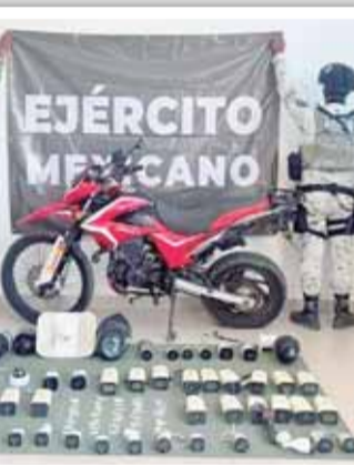
Aseguran más de 40 cámaras de circuito cerrado en Santa Cruz Huatulco.

El buque destructor de misiles guiados USS Gravelly, ya está en el Golfo de México.