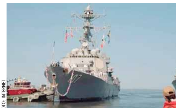
El buque destructor de misiles guiados USS Gravelly, ya está en el Golfo de México.

El general Gregory Guillot, titular del Comando Norte de Estados Unidos, informó en un comunicado que la acción forma