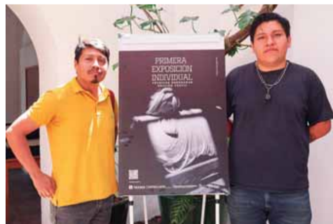
Se enfocará en identificar a creadores con alta competencia técnica en el ámbito textil.

La convocatoria Primera Exposición Individual fue emitida por pri-