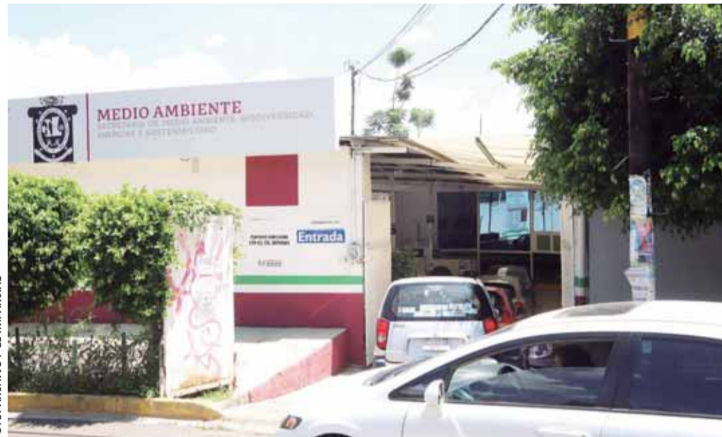
Los automovilistas vuelven a los verificentros de la Zona Metropolitana de Oaxaca.

“En comparación con años anteriores, a partir de la segunda quincena de febrero cuando se inició con el programa, hemos tenido una gran afluencia de automovilistas, tene-