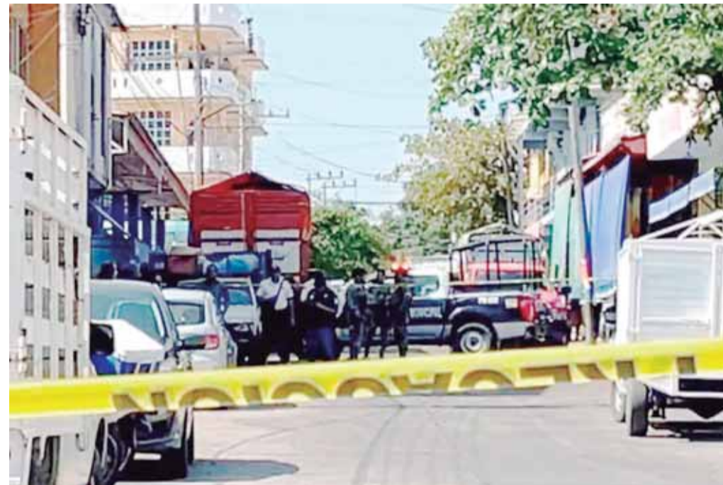
■ La policía llegó para realizar las primeras diligencias.