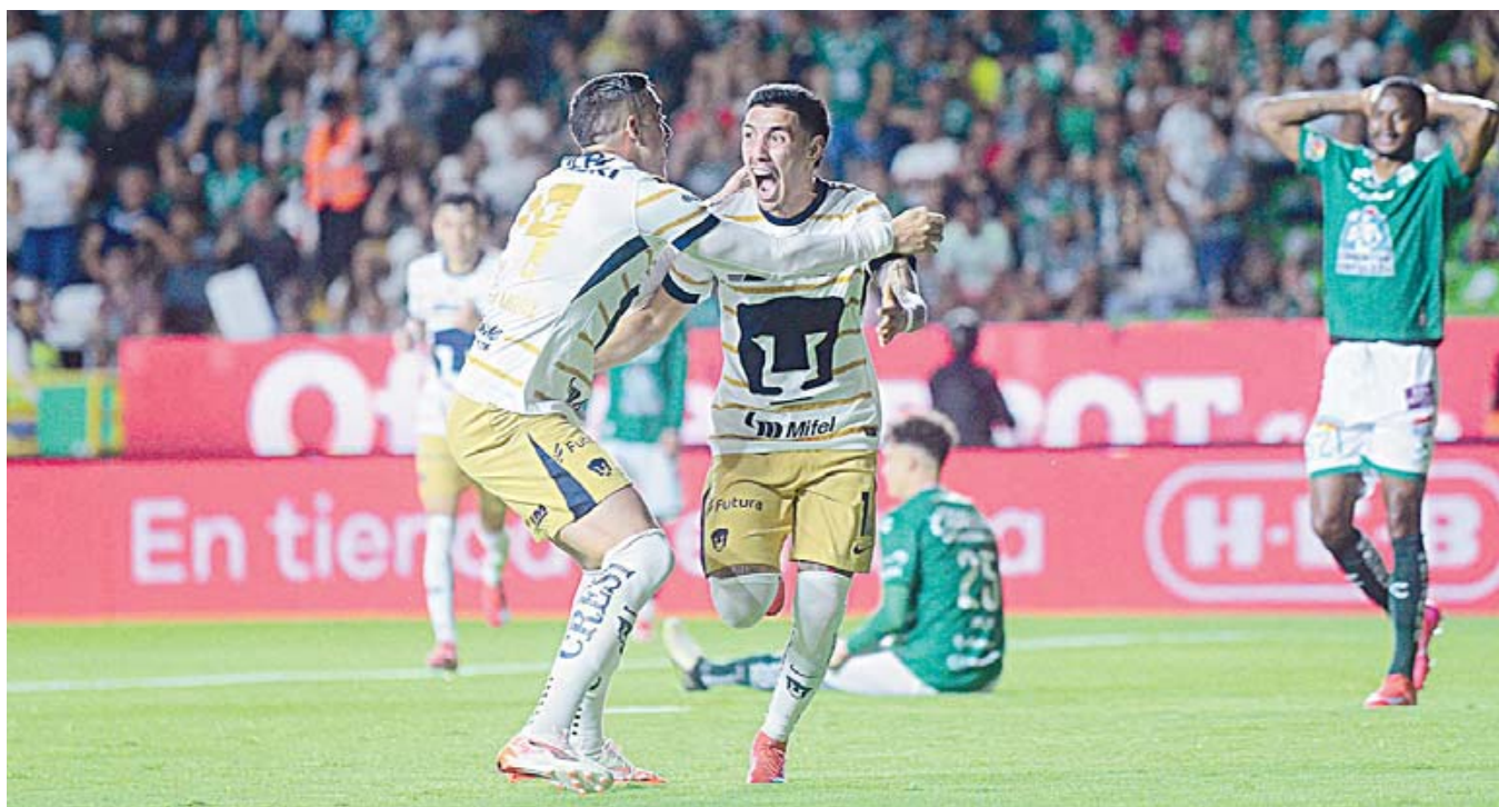
■ Pumas sacó la garra y se llevó los tres puntos como visitante.

Por otra parte, se dio a conocer que el fin de semana comenzó la historia de Dragones California. Los jugadores se reunieron para su primer entrenamiento y recibieron sus uniformes, junto con la fotografía oficial del club. Antes de iniciar, una danza azteca marcó el momento para desear buena suerte en este camino.