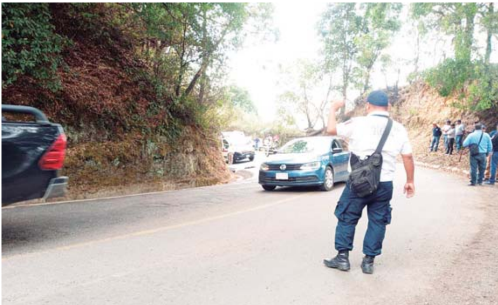
La Policía Estatal acordonó la zona para realizar las diligencias.