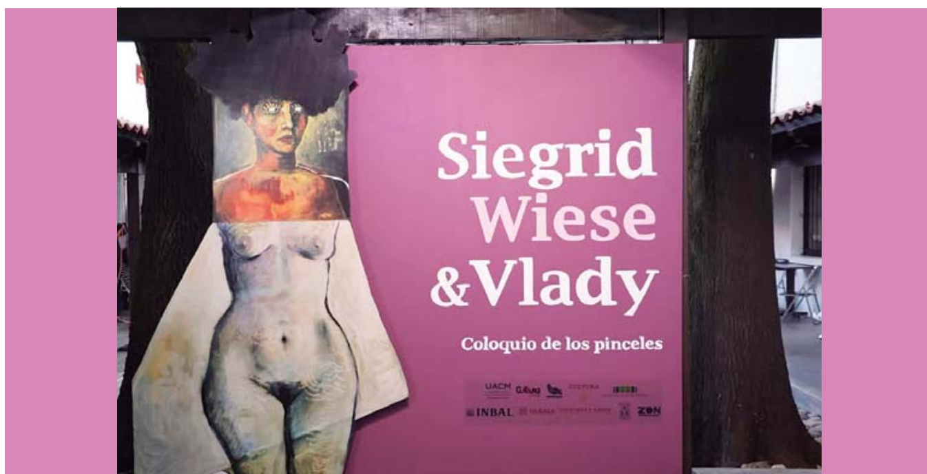
La exposición abrió al público el 27 de marzo en el Centro Vlady, de la Ciudad de México.

siglo. El hecho de llevarla a cabo en el Centro Vlady, que resguarda y propicia la investigación sobre la obra del artista ruso mexicano representa para Wiese la confirmación de que existen vasos comunicantes entre sus propias búsquedas estéticas con los hallazgos artísticos de Vlady", externó la organización de la exposición, al tiempo de señalar que este es también "un punto de partida para la exploración de nuevas rutas en la plástica".