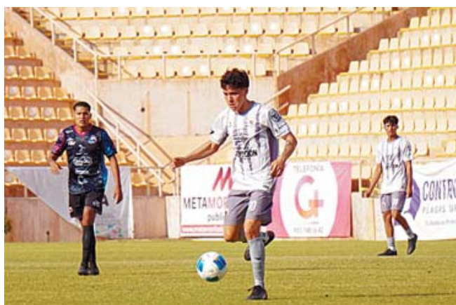
■ Dragones se impuso a Alebrijes en su juego del fin de semana.

Tras este resultado, León llegó a tres derrotas consecutivas y ya bajó al tercer lugar de la Tabla General. Por otro lado, Pumas subió a la 10ma posición y ya está en lugares de Play In, justo antes de afrontar la Ida de los Cuartos de Final de la CONCACAF Champions Cup ante Vancouver Whitecaps.