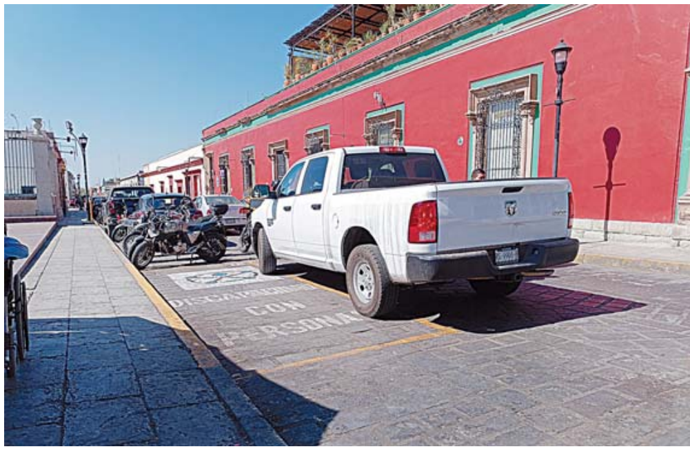
Un vehículo obstruye el acceso a un cajón exclusivo para el estacionamiento de personas con discapacidad.

Sin embargo, su uso no siempre es para las per-