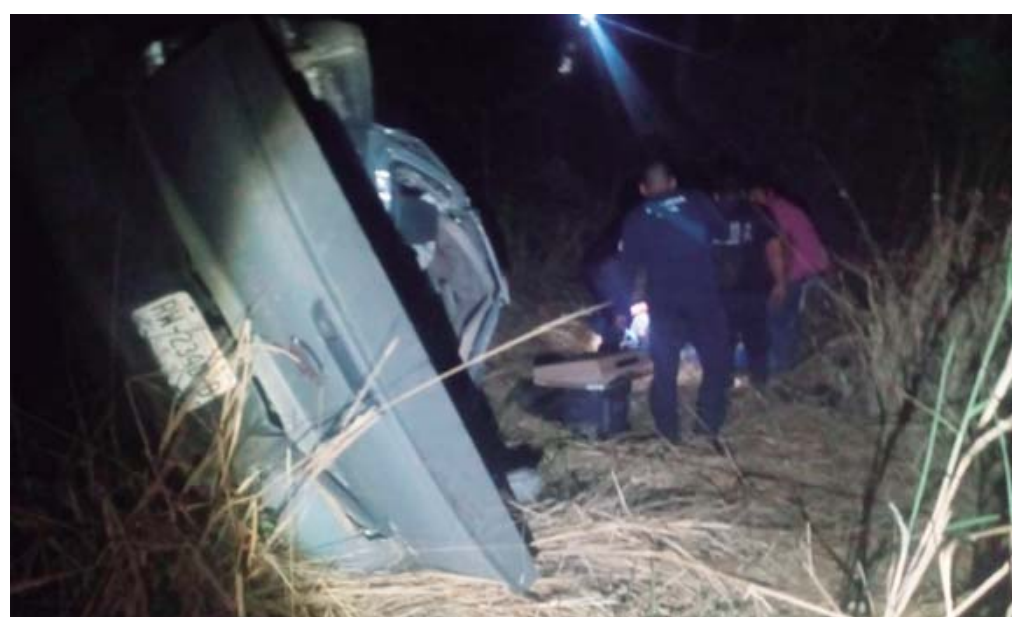
Los lesionados fueron atendidos y valorados.