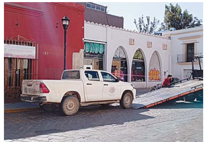
Invadir un cajón exclusivo para personas con discapacidad puede derivar en una multa de más de 5 mil pesos.

Actualmente, por estacionarse en un cajón exclusivo de estaciona-