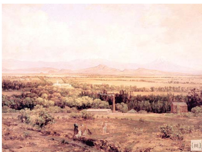
En pinturas como "El Valle de México del Molino del Rey", el pintor explora el impacto de la industrialización en el paisaje.

En sus lienzos, los inmensos cielos azules, nopales y terrenos desérticos se combinan con actividades humanas y una modernización inci-