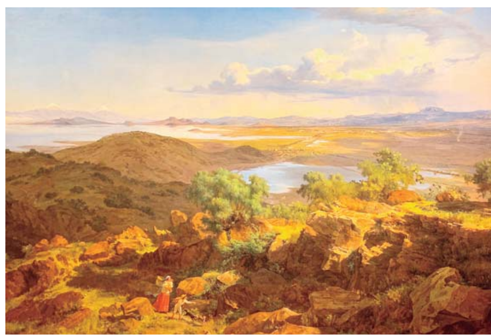
El cuadro "Vista del Valle de México desde el Cerro de Santa Isabel" (1877) es considerado su gran obra.