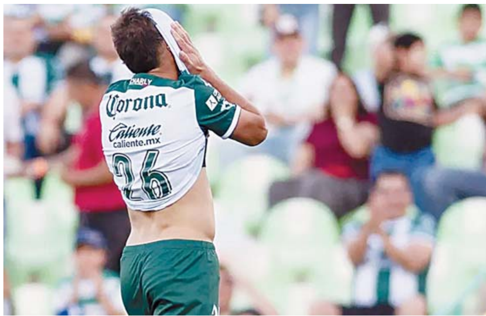
■ Matemáticamente, Santos aún cuenta con posibilidades para calificar a la fase de Play-in; debería ganar sus 4 partidos restantes.