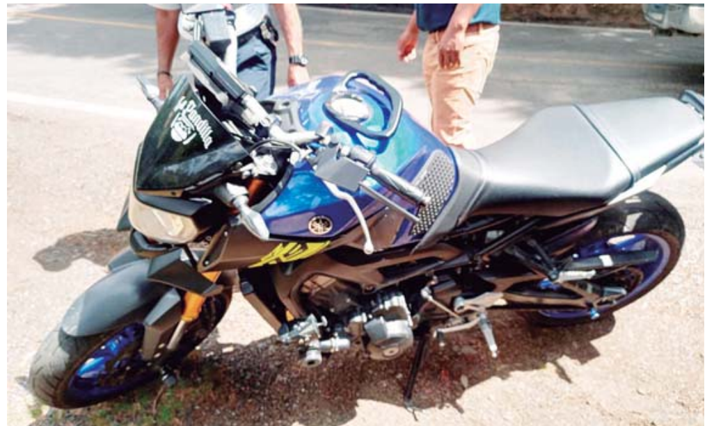
La motocicleta en la que viajaba la mujer en compañía de su esposo.

Una pareja de motociclistas derrapó en una curva en la Sierra Norte; la mujer perdió la vida casi al instante.