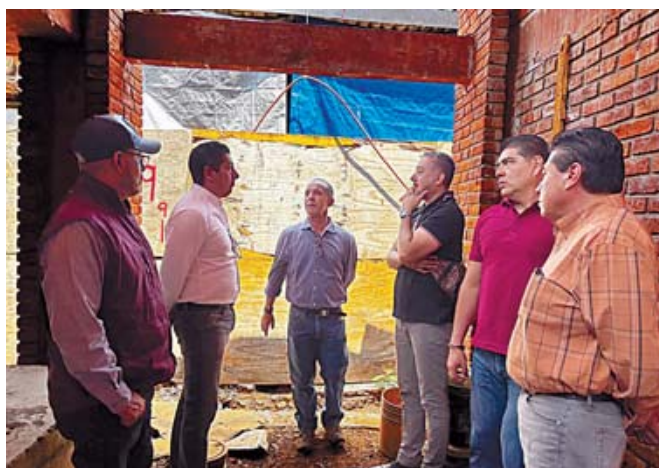
Personal del Ayuntamiento y Sedatu supervisan las obras.

A través de una publicación en Facebook, la Secretaría de Gobierno y Territorio del ayuntamiento capitalino dio a conocer que había realizado un recorrido de supervisión junto con la