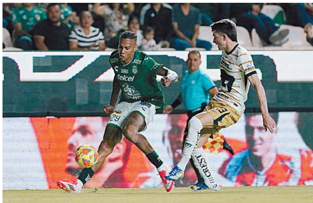
■ León sumó tres derrotas consecutivas.

El partido inició con turbulencia atrás para los visitantes. En apenas unos segundos, León generó una jugada de peligro, la cual fue anulada por fuera de lugar. Sin embargo, al minuto 2 de juego, luego de un gran trazo largo de Andrés Guardado, fue Emiliano Rigoni el que le ganó la espalda a