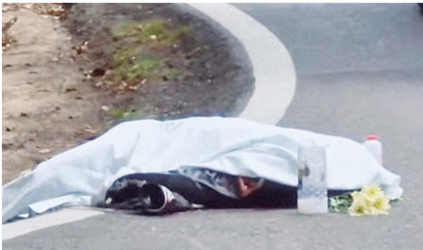
La mujer quedó tendida en el pavimento ya sin vida.

médicos del servicio de auxilio y rescate SAMU Oaxaca llegaron al lugar y brindaron atención a