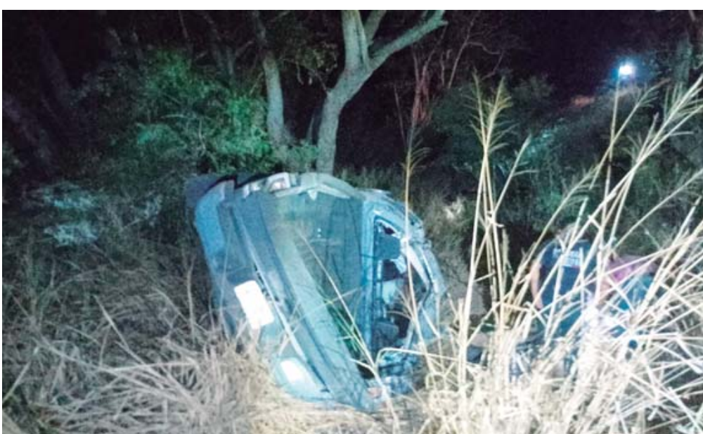
El vehículo se salió de la carretera y volcó aparatosamente.