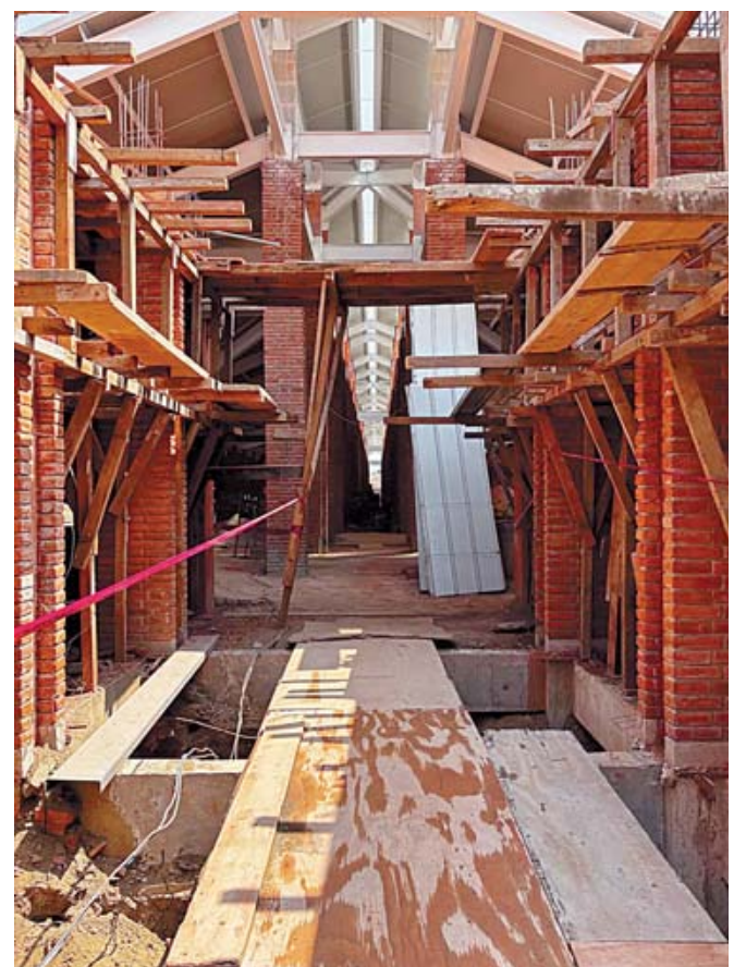
La inversión federal por más de 220 millones; el Ayuntamiento de Oaxaca de Juárez aporta otros 20 millones.