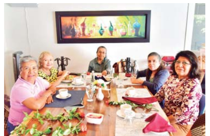
Se reunieron un grupo de maestras jubiladas para recordar sus anécdotas como docentes y reafirmar su amistad.