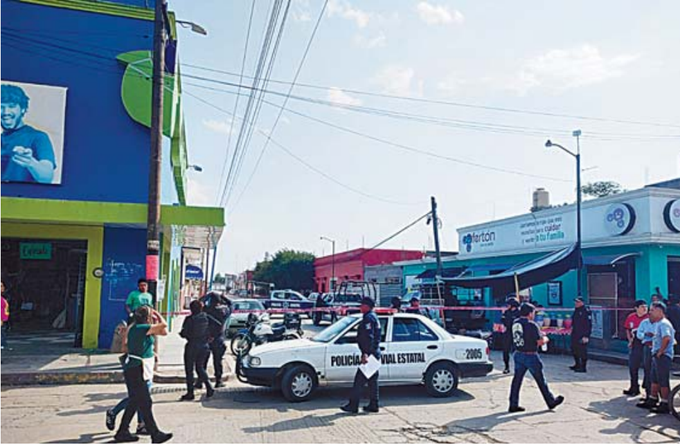
La zona fue acordonada para realizar las primeras diligencias.