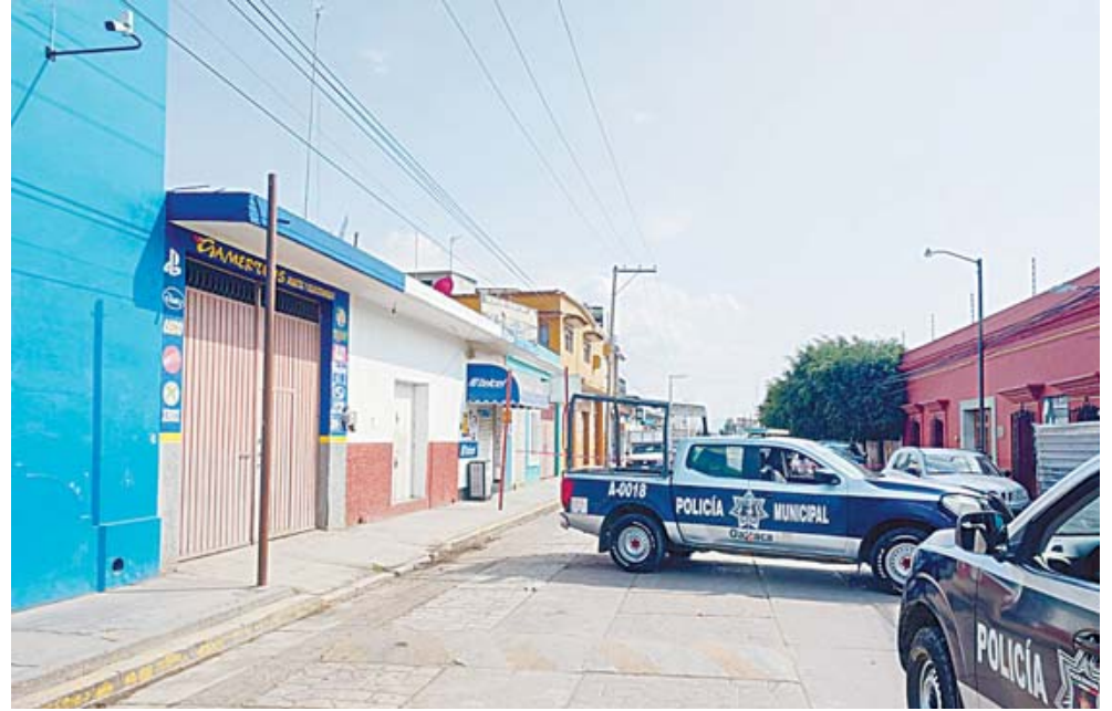
La Policía Municipal de Ocotlán fue la primera en llegar al lugar.