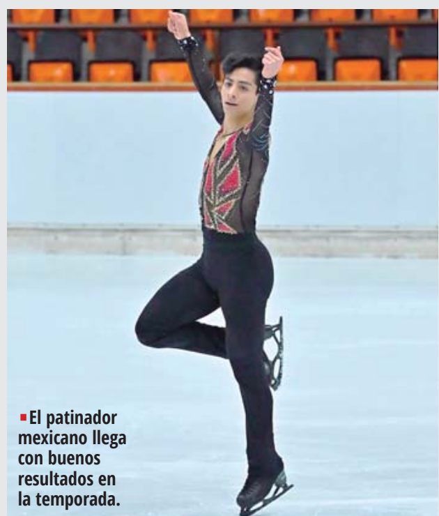
El patinador mexicano llega con buenos resultados en la temporada.