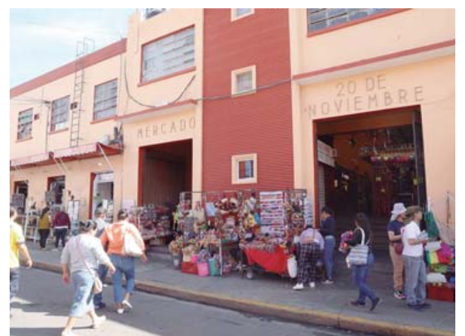
■ En lo que va del año se han capacitado en todo el estado a 3,977 personas en manejo de alimentos y bebidas.

"Si bien el establecimiento debe contar con la infraestructura adecuada para poder mane-