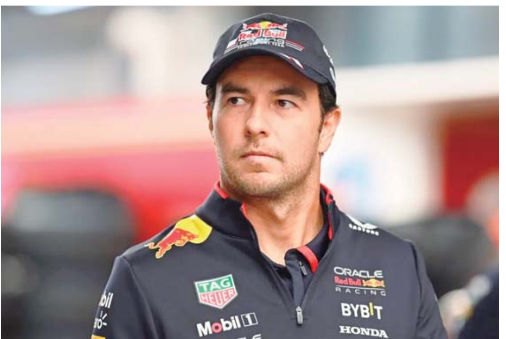
Checo Pérez podría regresar a la Fórmula 1 de la mano de Cadillac.

'Chacho' también confirmó que Cadillac ya ha establecido contacto con Pérez y que las negociaciones están en marcha para su incorporación en 2026. Sin embargo, el mexicano estaría analizando la oferta con cautela, ya que la escudería estadounidense comen-