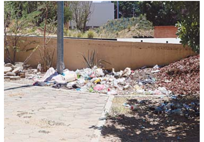
■ Un basurero a cielo abierto.

En septiembre, vecinos de las colonias cercanas se manifestaron para evitar la reubicación de la escultura; el gobierno informó que habría rehabilitación, pero no se ha concretado