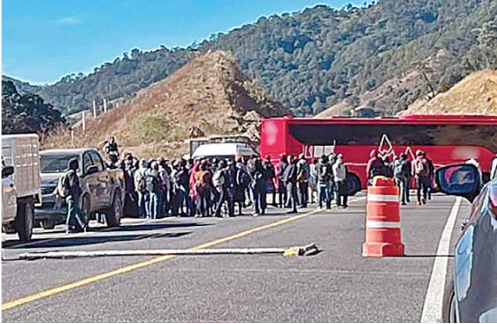
La carretera permaneció cerrada por varias horas.