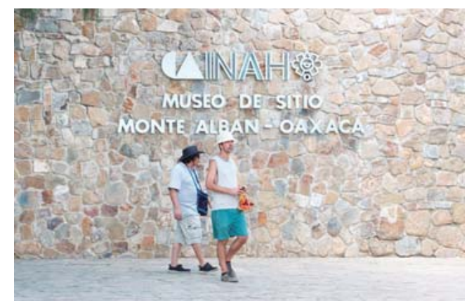
Fue en marzo de 2020 cuando la red de museos y sitios arqueológicos del INAH cerró al público.