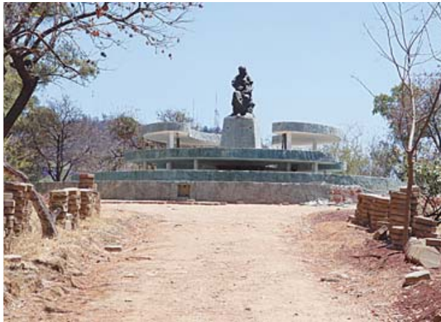
■ Se deteriora el emblemático monumento.