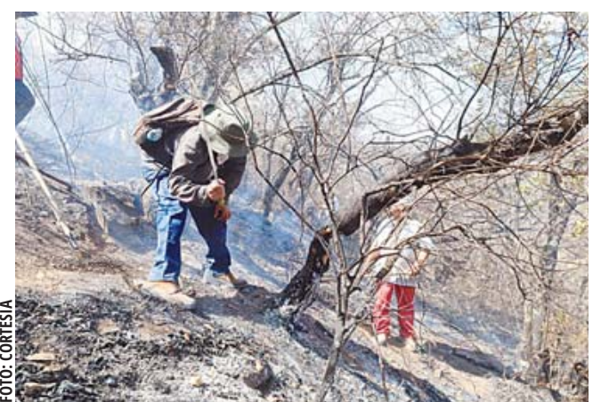
■ Controlan incendio forestal en límites de Donají y San Felipe del Agua.

UN INCENDIO forestal registrado este domingo en el municipio de Oaxaca de Juárez puso en riesgo al Parque Nacional Benito Juárez, debido a que se generó en los límites de las agencias Donají y San Felipe del Agua, cercanas a esta área.