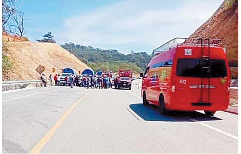
Las autoridades tardaron en llegar a la zona de conflicto.