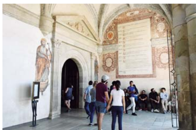
El más visitado sigue siendo el de Las Culturas de Oaxaca, que se localiza en el ex convento de Santo Domingo de Guzmán.

A la fecha, algunos carteles y medidas de acceso a estos lugares se mantienen a la vista del público, aunque no siempre se exige su cumplimiento.