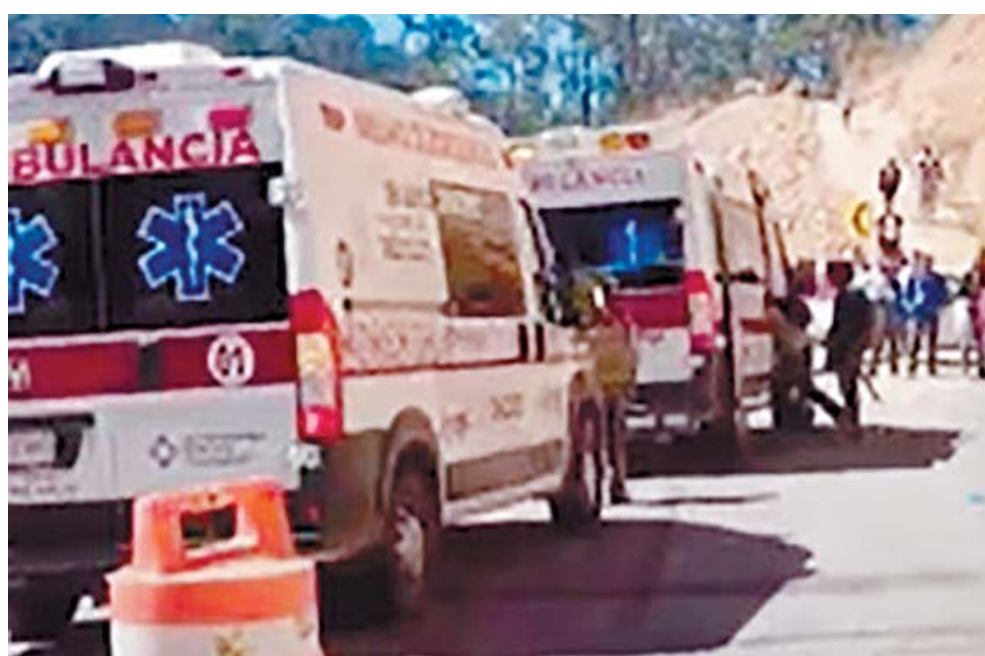
Varias ambulancias llegaron para atender a los lesionados.

El estruendo de las detonaciones se confundió con los gritos de quienes intentaban escapar. Algunos corrieron en busca de refugio, mientras otros, atrapados en el fuego cruzado, solo podían protegerse con lo que tenían a su alcance. La confusión se apoderó del lugar. La noticia del enfrentamiento se propagó rápidamente, alcanzando a quienes estaban en los alrededores e incluso a los transportistas que circulaban por la carretera. Cuando las autoridades llegaron, el saldo era desolador: cinco personas habían muerto y al menos diez más yacían heridas, algunas de gravedad. El Hospital