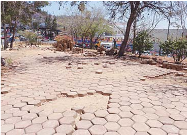
■ El retiro del adoquín, quedó a medias.

El Monumento a la Madre data de 1960, de acuerdo con los vecinos; es una de las varias construcciones que existen en torno a la figura materna, como en la Ciudad de México, Veracruz, Chihuahua, Baja California y San Luis Potosí.