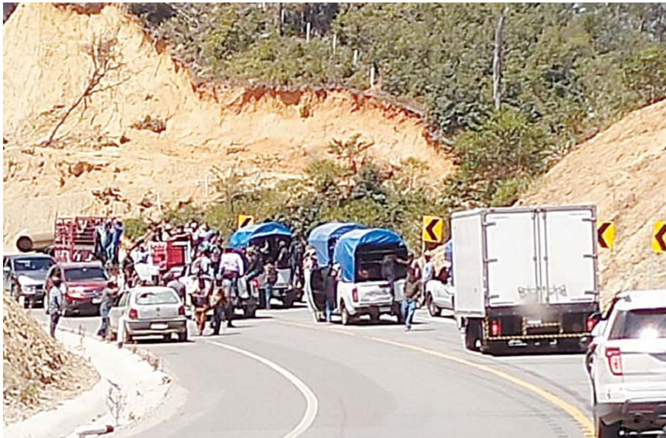
El conflicto entre ambas comunidades escaló rápidamente y la violencia se desató.

El Limar, un paraje conocido por su vegetación densa y su difícil acceso, se convirtió en un punto de encuentro forzado entre dos comunidades que han visto su