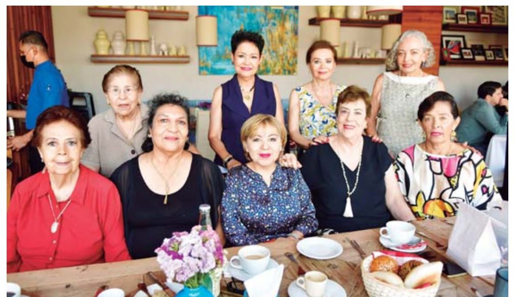
■ La festejada estuvo muy contenta por las palabras de cariño y aprecio que recibió de parte de sus amigas.