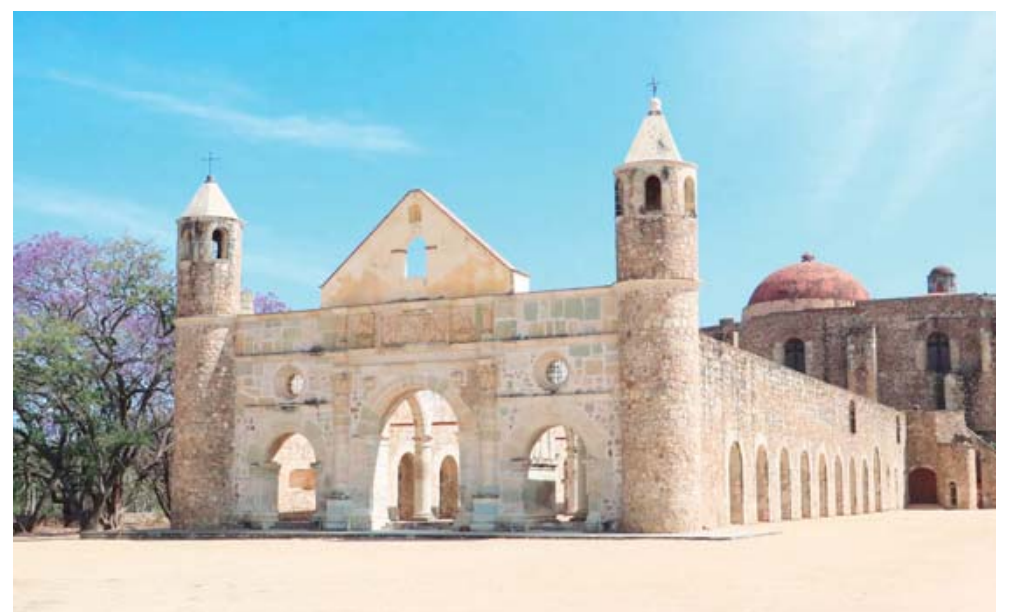
Al museo de Las Culturas de Oaxaca sigue en preferencia el ex convento de Cuilápam de Guerrero.

Las estadísticas del INAH, disponibles en su página web, muestran que el número de visitantes de las zonas arqueológicas y museos que opera en Oaxaca aumentó de 2021 a 2023 hasta alcanzar los 891 mil 143 visitantes (similar al año 2018, cuando a las 11