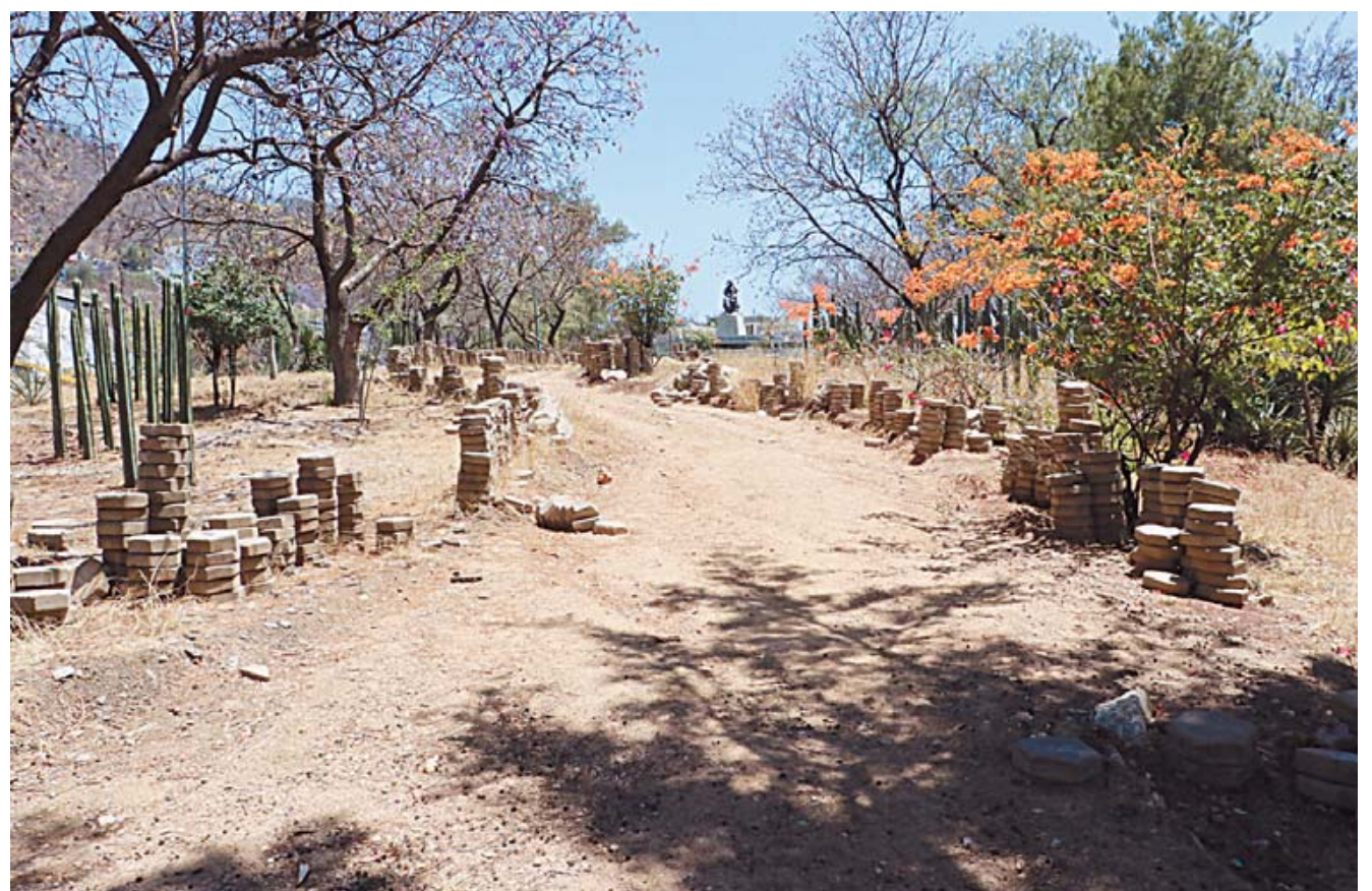
■ Desde septiembre de 2024, las obras de rehabilitación del Monumento a la Madre están en el olvido.

El monumento, según vecinos, data de la década de 1960. A nivel nacional,