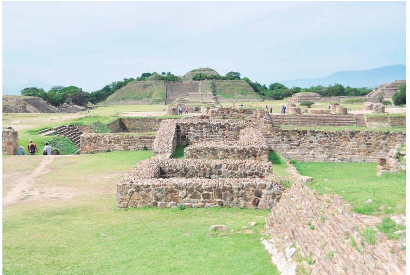
La zona arqueológica de Monte Albán, que es la más visitada de entre las 10 abiertas actualmente.