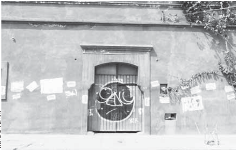
■ En la avenida Morelos se observa que los sellos colocados por el ayuntamiento y el INAH fueron violados.