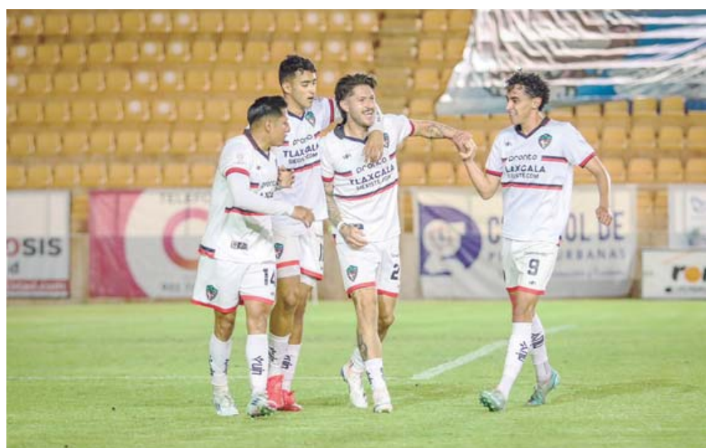
Los Coyotes de Tlaxcala remontaron y se llevan el triunfo de visitantes.

puntos del octavo sitio, la Jaiba Brava del Tambo Madero.