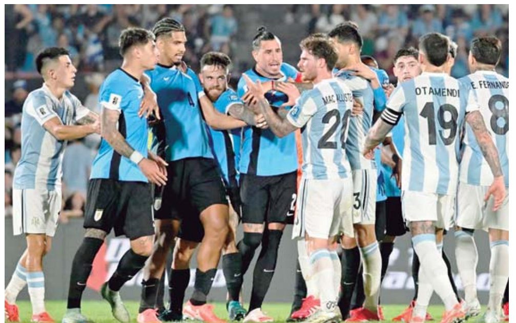
Uruguay no supo cómo frenar a Argentina.

Thiago Almada fue la figura en la visita de los de Scaloni al Estadio Centenario