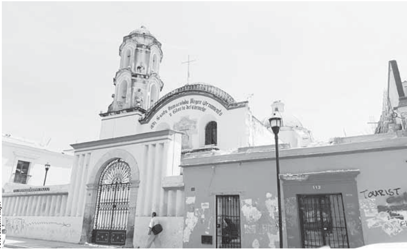
■ A la fecha y por intervenciones hechas en los últimos años hay aproximadamente 22 denuncias ante la fiscalía.

"Tanto como un cartel, no, pero sí se ha detectado la presencia de algunos grupos de personas, contratistas o que están involucrados en la construcción que hacen obra sin autorización, incluso sin contar con el respaldo de un director responsable de obra. Pero también hay, probablemente, un director responsable de obra que firma o está en apoyo a estas cir-