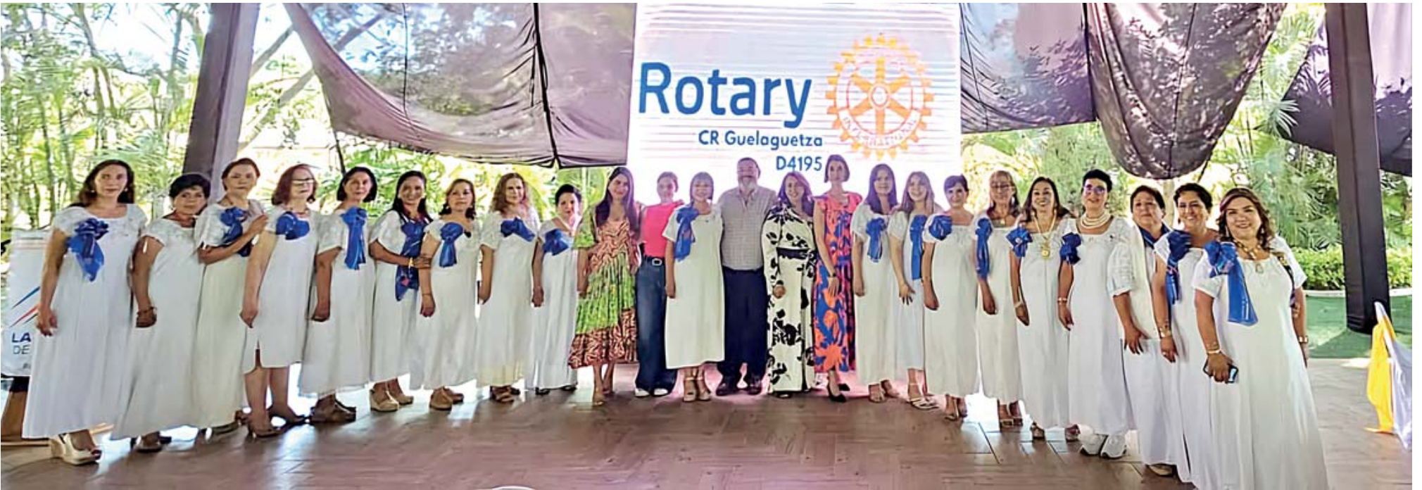
Las socias del Club al terminar el desayuno se tomaron la foto del recuerdo.