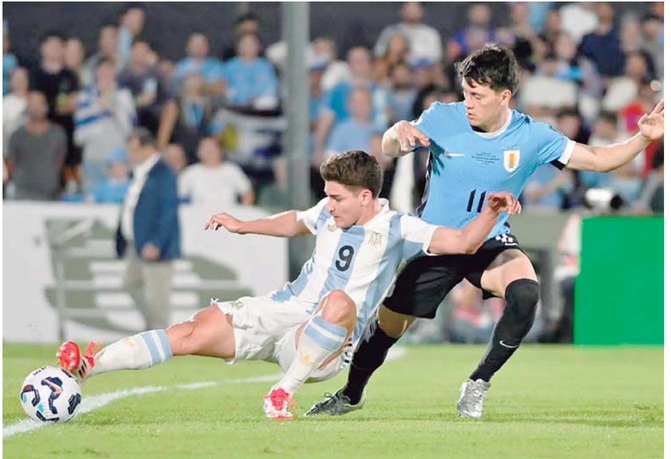
Argentina se quedó con el triunfo ante Uruguay.