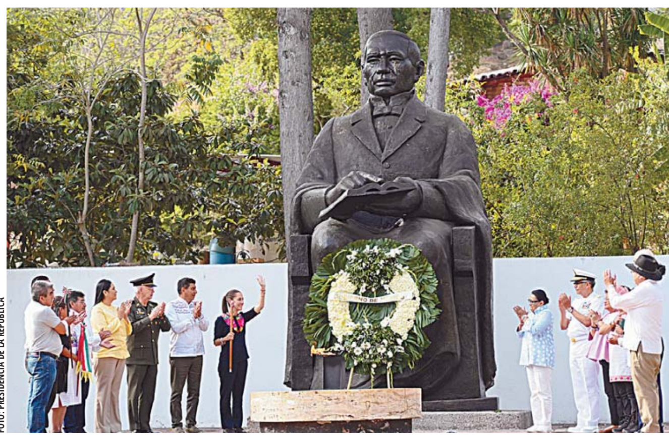
La presidenta Claudia Sheinbaum Pardo encabeza en San Pablo Guelatao la ceremonia por el 219 Aniversario del Natalicio de Don Benito Juárez García.

“El pensamiento juarista está en el corazón de las y los mexicanos cuando decimos que México es un país libre, independiente y soberano, que nos somos colonia de nadie, no somos protectorado de nadie, somos una nación independiente y que hoy más que nunca, resuena la palabra de Juárez que dice: “Entre los individuos, como entre las naciones, el res-