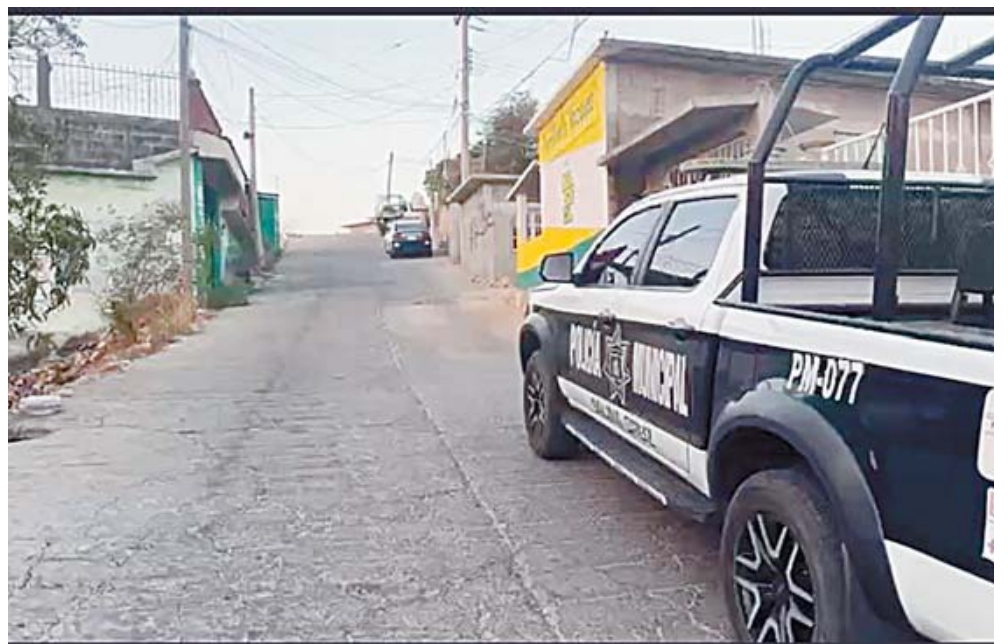
Los habitantes de la colonia Jesús Rasgado permanecen en alerta, a la espera de que las autoridades proporcionen información.

A pesar de la presencia inmediata de las fuerzas de seguridad, tanto policiales como militares, quienes acordonaron la zona para proteger la escena y garantizar el resguardo de pruebas, has-