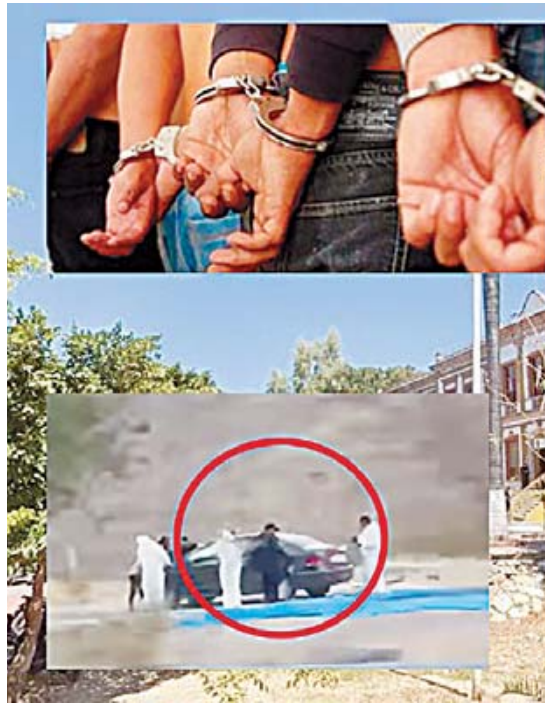
La detención de los tres agentes se dio como parte de las investigaciones relacionadas con el caso de los jóvenes tlaxcaltecas hallados sin vida en los límites de Oaxaca y Puebla.