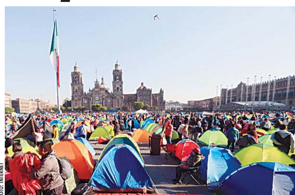
Miles de maestros de la CNTE instalaron este miércoles un plantón en el Zócalo de la Ciudad de México, frente a Palacio Nacional.

La Coordinadora Nacional de Trabajadores de la Educación (CNTE) no descartó un paro indefinido de labores, como forma de presión al Gobierno federal en la abrogación de la Ley del ISSSTE de 2007. Aunque este martes la CNTE logró frenar la iniciativa de reforma a la Ley del ISSSTE 2025, promovida el 7 de febrero por la presidenta de la