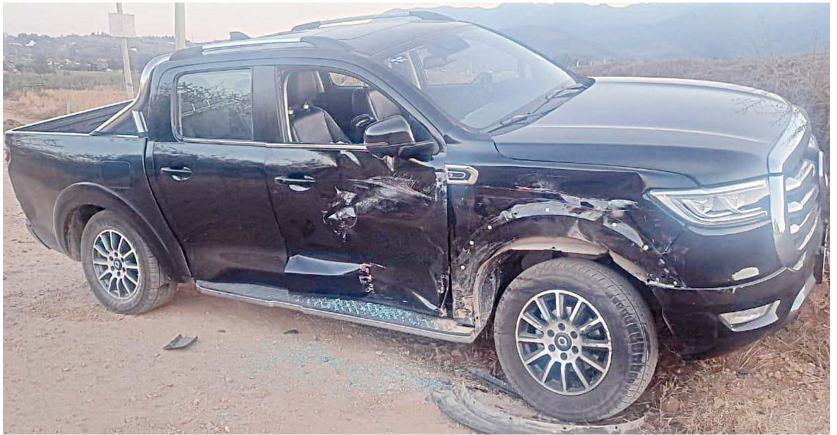
▪ La camioneta del ex candidato recibió un fuerte golpe; los sujetos huyeron del lugar.

De acuerdo con la FGEO, el conductor afectado, identificado con las iniciales B. L. L., viajaba a bordo de su camioneta cuando al momento de salir de una calle, otra camioneta de color