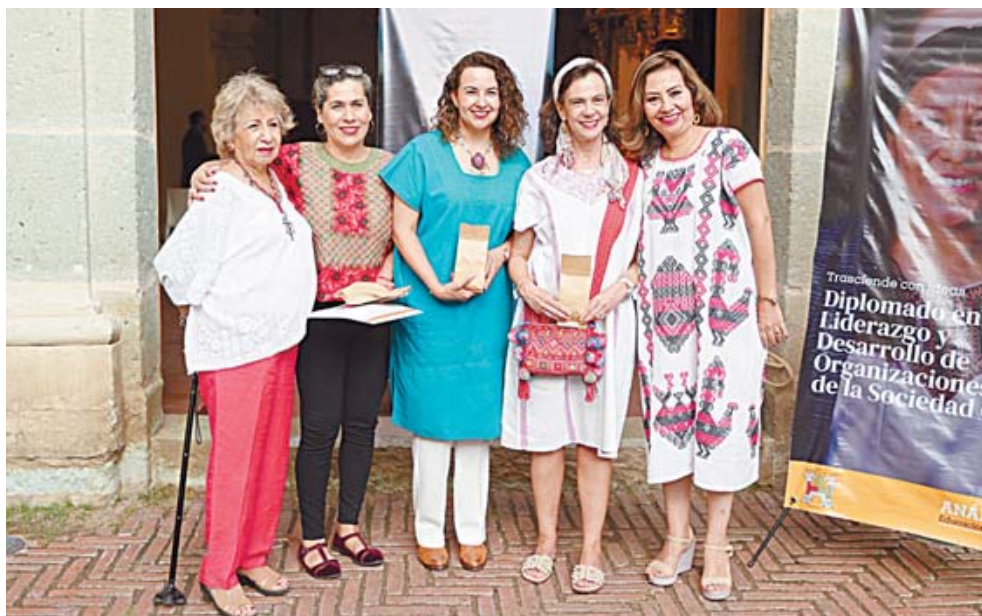
■ Se invitó a compartir los conocimientos que adquirieron en este diplomado.

Agentes de cambio social de diversas regiones de Oaxaca aprendieron a como se constituye, gestiona y se mide el impacto de una Organización Civil