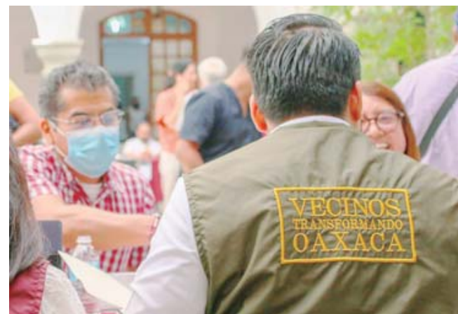
■ Próximamente, estos diálogos se realizarán con mayor cercanía con la población de la capital.

Señaló que en cada sesión de Diálogos Vecinales se atiende aproxi-