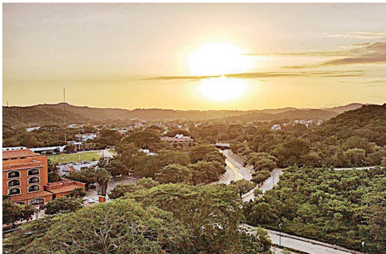
La bella Costa de Oaxaca se complementa con una gran infraestructura que la hace ser muy funcional y más atractiva.

además en la orilla de la Laguna de Manialtepec hay restaurantes familiares que ofrecen comida típica, por lo general atendidos por los oriundos.