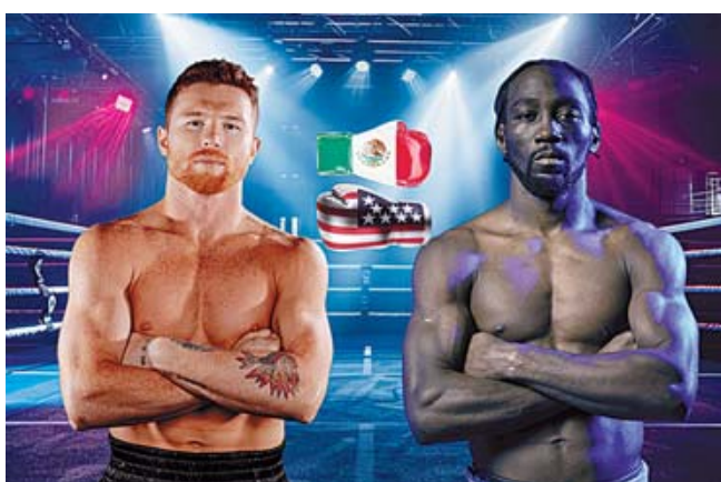
■ Canelo enfrentaría a Terence Crawford en septiembre, en Las Vegas.

go lo vi en Dubái, hace tal vez un mes. Es grande físicamente y tiene buenas habilidades, es uno de mis boxeadores favoritos. Es capaz de ganar esta pelea, pero hay muchos peros. Hay muchas cosas pequeñas que no sabemos cómo manejará. Necesitará acostumbrarse al poder y a la presión de las 168 libras, porque es una gran diferencia, para ser honesto", declaró Bivol para The Ring.