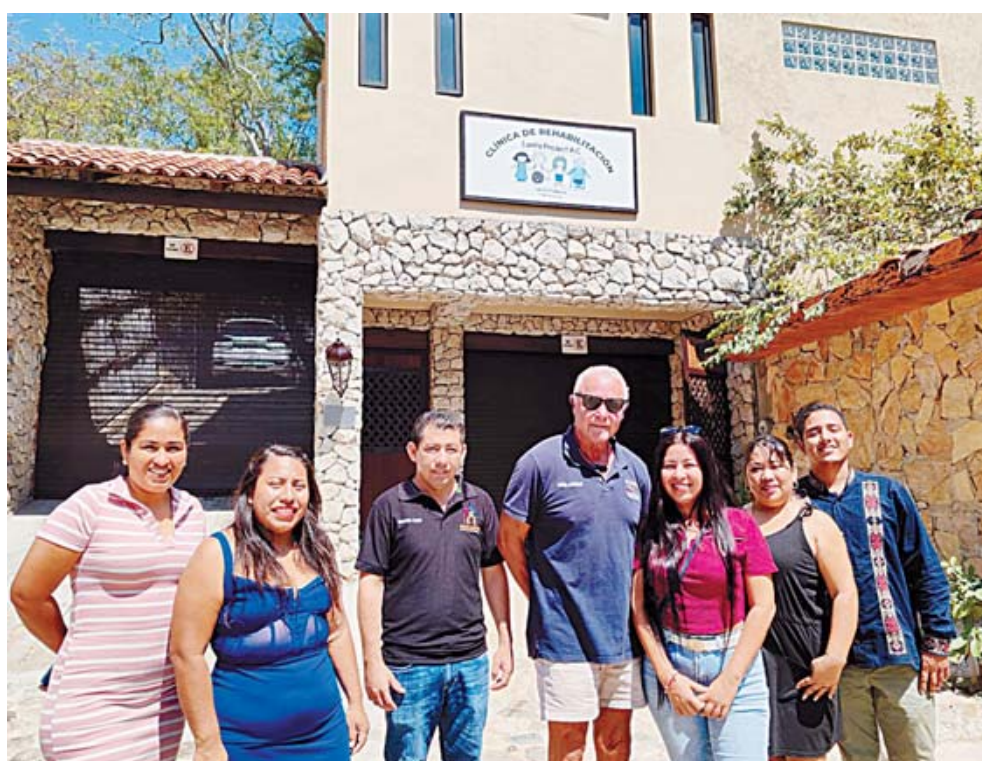
Un grupo de 10 jóvenes integraron el Proyecto “Siento 80 Grados Community”.

Posteriormente, al continuar hacia Huatul-