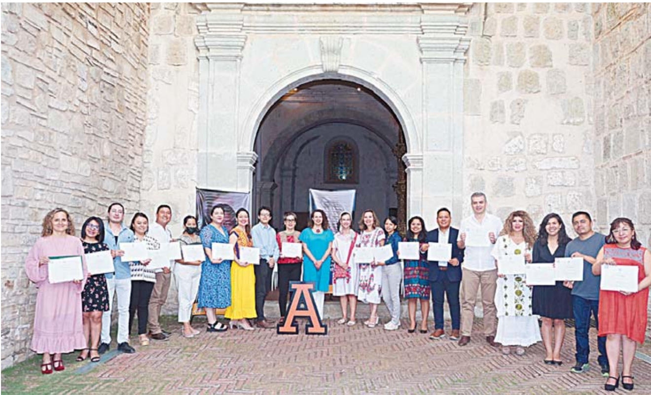
■ Hace unos días concluyó el Diplomado en Liderazgo y Desarrollo de Organizaciones de la Sociedad Civil.