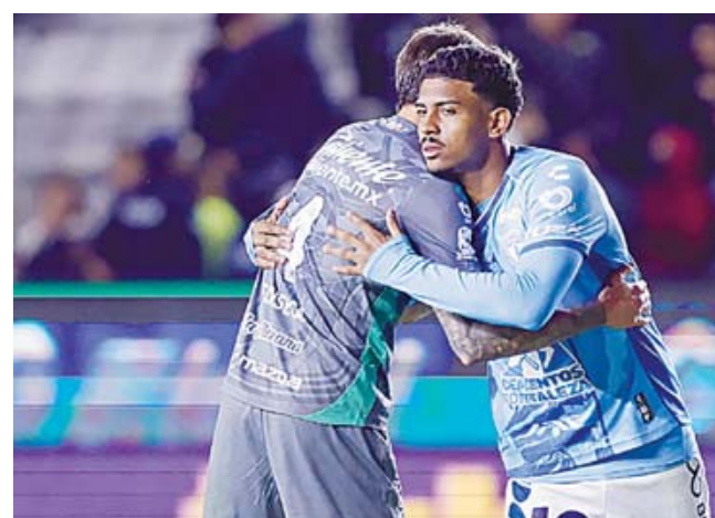
■ León y Pachuca desmienten rumores sobre notificación de FIFA.

León también señaló que no ha sido notificado por ninguna institución "continuamos nuestra preparación rumbo al Mundial