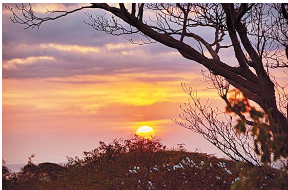
Es maravilloso poder apreciar cómo va naciendo la luna al anochecer en la Costa de Oaxaca.

Conoce más opciones a visitar en la cercanía del mar