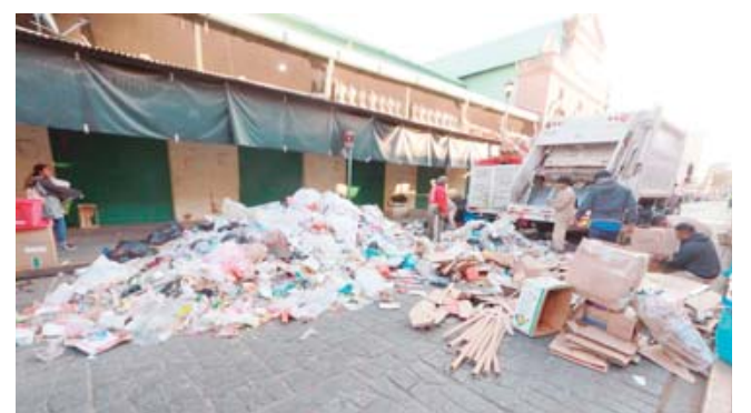
■ Llamen a actuar a autoridades y sociedad para frenar problemas de contaminación.

En los últimos años y como en los años recientes, la entidad ha registrado el aumento de temperaturas. Esto propicia mayores riesgos de incendios