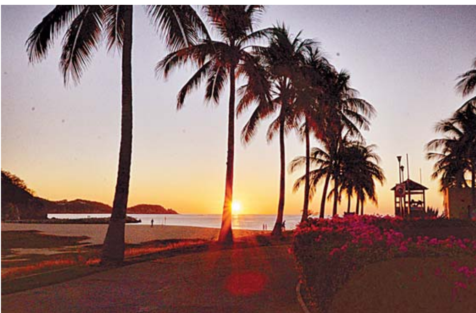
Los escenarios son bellísimos y muy variados en este patrimonio costero oaxaqueño.