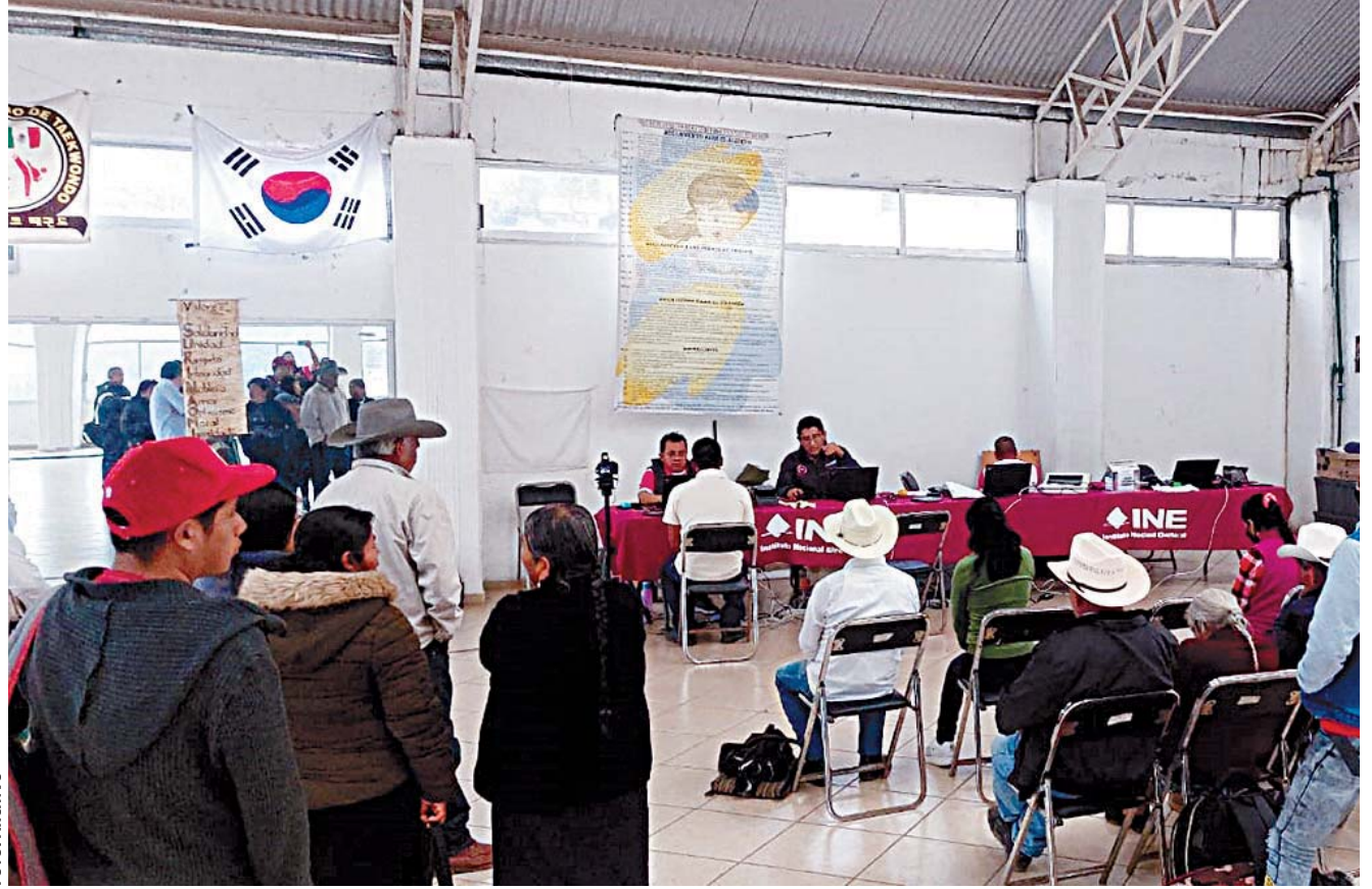
Se prevé que la instalación de casillas en las agencias de planillas sea a partir de las 8:00 horas.

En este sentido, luego de instalado el Consejo de Mejora Regulatoria, sus integrantes recibieron una capacitación por parte de la Sedeco, para revisar los lineamientos en la implementación de las acciones de esta política pública.