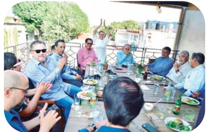
La festejada con su esposo, sus hijos y amigos.