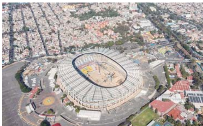
El Estadio Azteca está siendo remodelado para el Mundial de 2026.