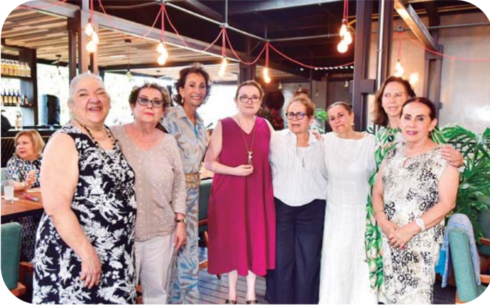
Recibió las felicitaciones de sus amigas de la primaria.