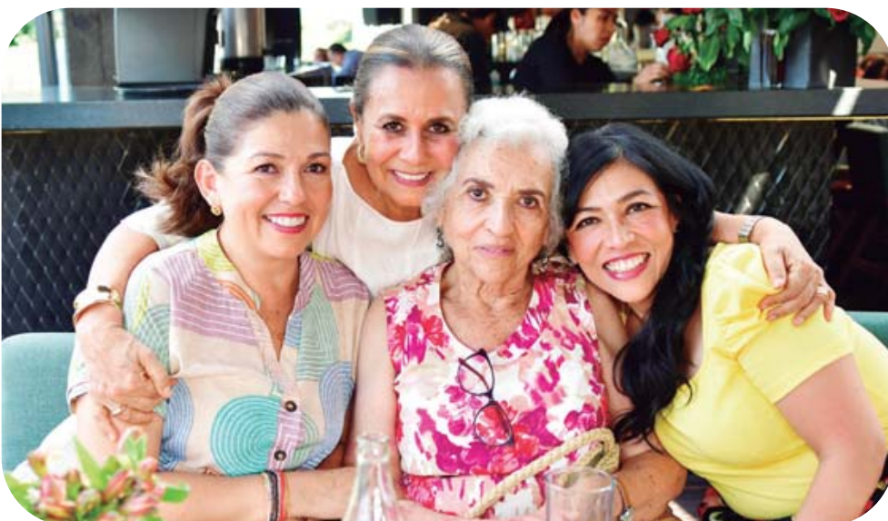
La cumpleañera agradeció a las presentes por las muestras de afecto que les brindaron en su día.