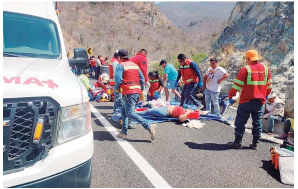
Algunos pasajeros afirmaron que pidieron cambiar de camión debido a los problemas, pero su solicitud no fue atendida.

Un trágico accidente cobró 19 vidas. Las autoridades culpan al conductor, pero testimonios sugieren fallas previas en la unidad