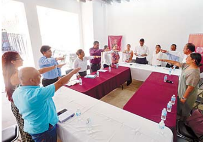
Los integrantes del Consejo recibieron una capacitación de Sedeco para la implementación de esta política pública.

Editor: Diego MEJÍA ORTEGA / Diseñador: Humberto GUERRERO GARCÍA