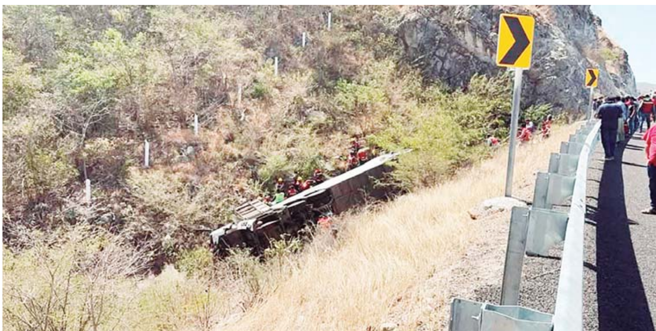
El conductor también perdió la vida en el accidente, lo que impide que su versión del accidente sea conocida.

de Santo Domingo Narro, San Juan Juquila Mixe, involucró a un autobús con placas de circulación 59RB-9G, el cual, según los peritajes de la Fiscalía, sufrió una pérdida de adherencia en el neumático derecho, lo que habría causado que el vehículo se saliera de su camino y volcara. De las 19 víctimas fatales, 9 eran hombres y 10 mujeres, incluidas dos niñas.