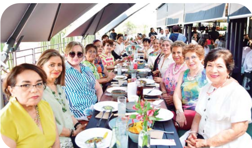
La celebración por esta fecha se realizó en un restaurante de esta ciudad.