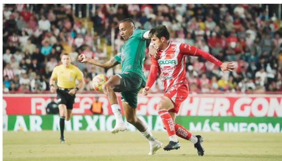
León perdió su segundo partido al hilo y podría perder el liderato.

Ambos equipos tomaron la iniciativa en los primeros minutos del partido más llamativo del viernes 14 de mar-