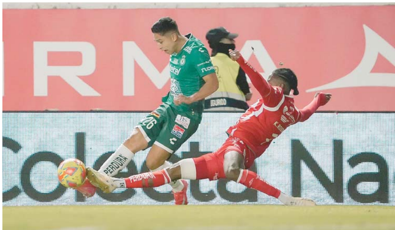
Necaxa supo adueñarse del partido, a pesar de contar con un jugador menos en el campo.