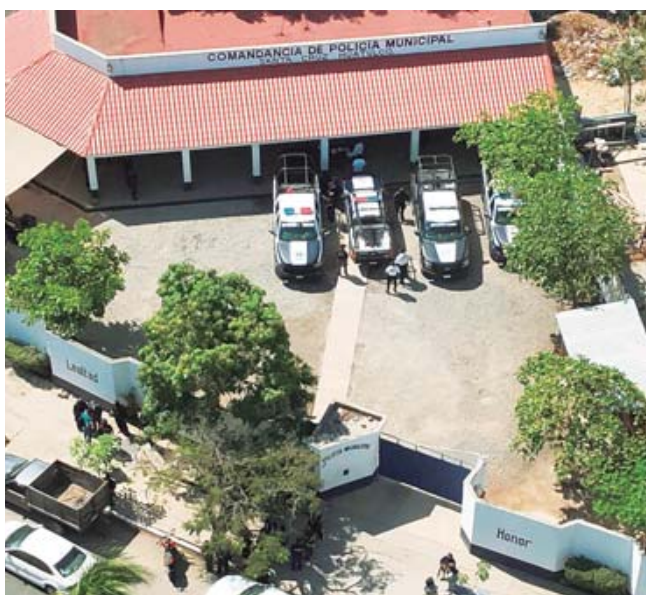
La FGEO realizó un operativo en la Costa: asegura documentos, desarma policías y confirma el hallazgo de cinco personas de Tlaxcala.

El operativo se realizó en diversos puntos de Santa Cruz Huatulco, siendo uno de los principales en las insta-