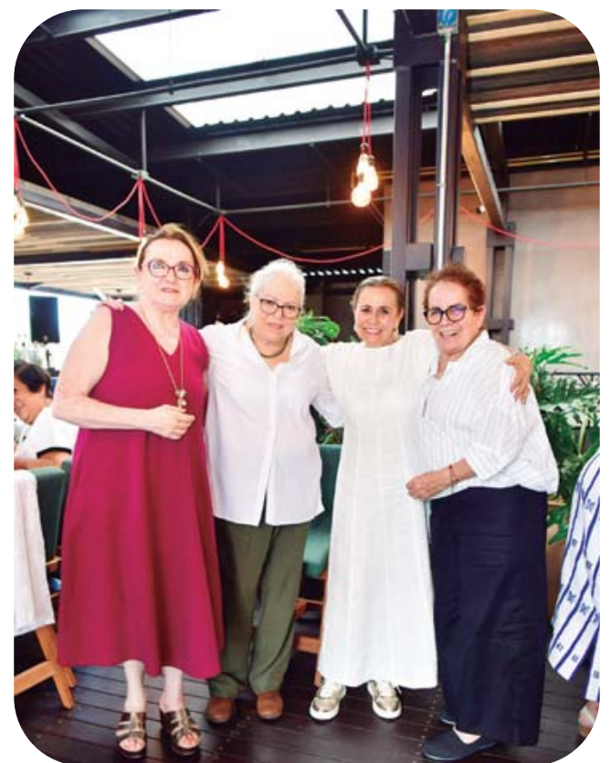
Sus amigas del kínder disfrutaron de esta celebración

Antes de concluir tan grata celebración, la festejada agradeció a las presentes por las muestras de afecto que les brindaron en su día, no sin antes disfrutar de una tarde al ritmo del rock and roll. ¡Enhorabuena!