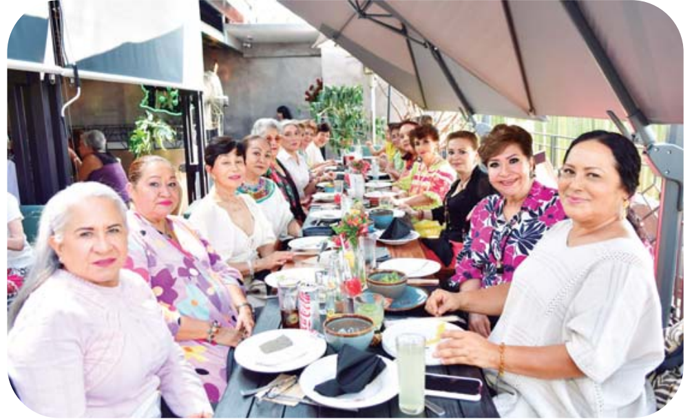
Fue consentida con tiernos apapachos y los mejores deseos.