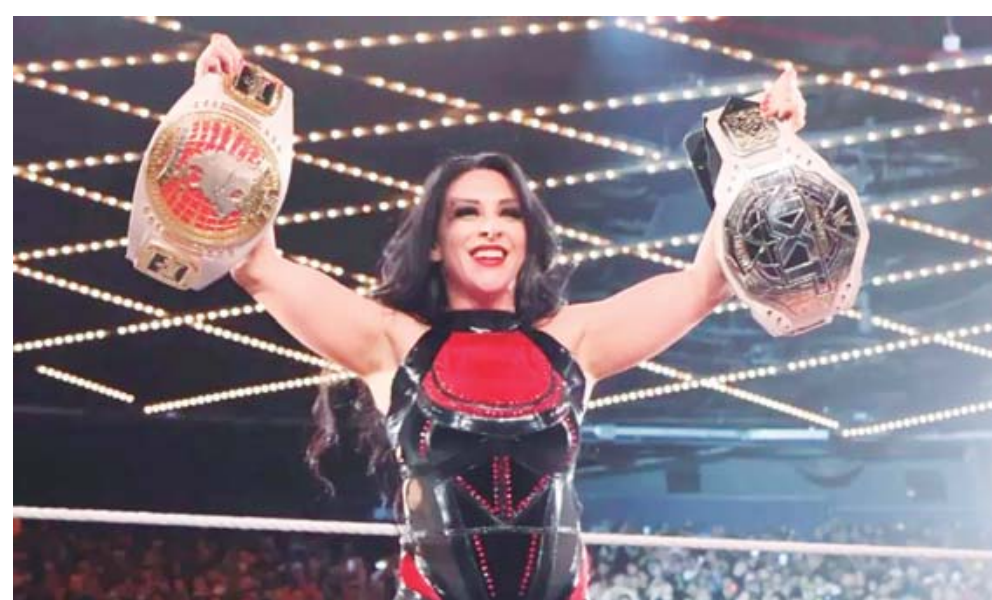
■ Stephanie Vaquer es doble campeona.

Giulia hizo un superplex sobre su rival y sigue con un fuerte castigo, sin embargo, Vaquer logró rehacerse y aplicar su Dragon Screw. Llevó a la rival al conteo, pero tampoco llegaron las tres palmadas. Stephanie Vaquer blo-