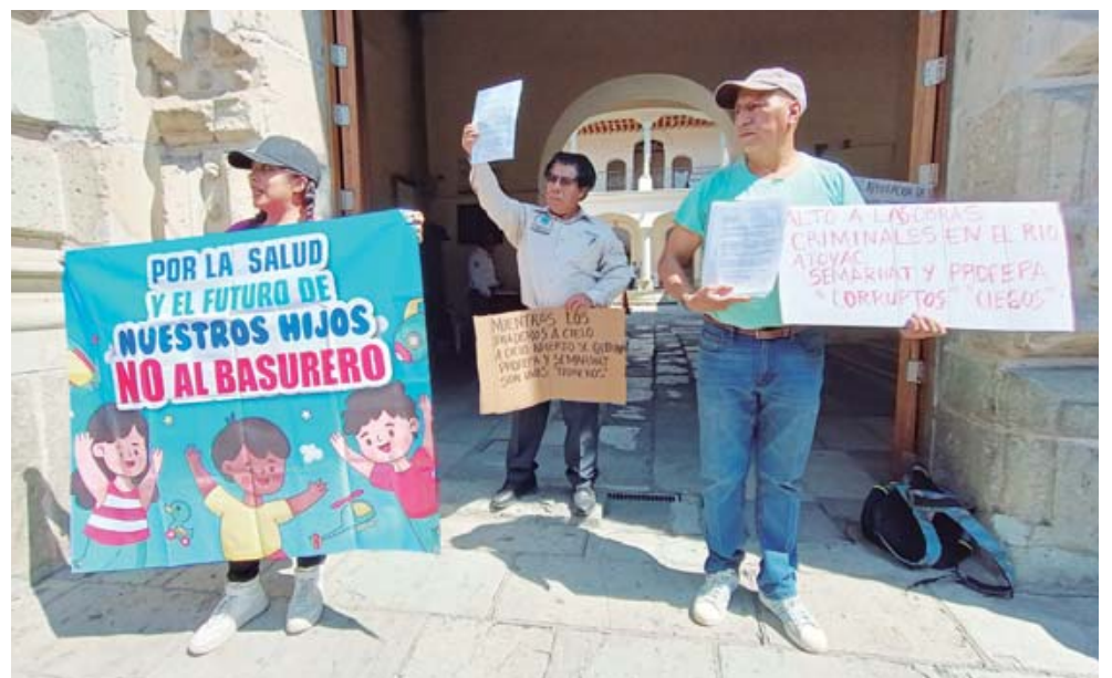
Protestan activistas en Profepa por considerarla omisa frente a los problemas ambientales en el estado.

"Estábamos luchando para echar costales de arena, amarrados de tres en tres con palas y se los llevaba el río, entonces así de fuerte estuvo la corriente, por eso no se puede quedar la tierra suelta", narró.