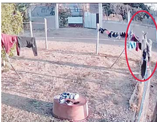
Video viral muestra a un sujeto robando calzones de un tendero.

Por lo tanto, las autoridades locales y los habitantes del área han sido exhortados a mantener la vigilancia y reportar cualquier actividad sospechosa en la zona. Aunque el robo de ropa pueda parecer trivial, es importante no subestimar este tipo de incidentes. Ya que podría ser un indicio de conductas más preocupantes.