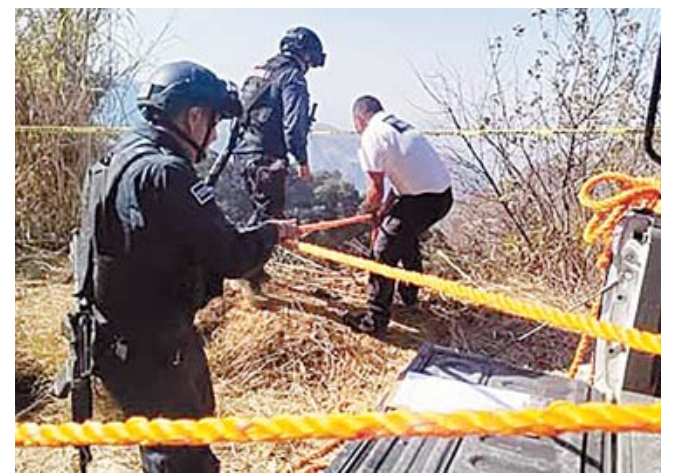
Las labores de rescate fueron complicadas debido a lo sinuoso de la zona.