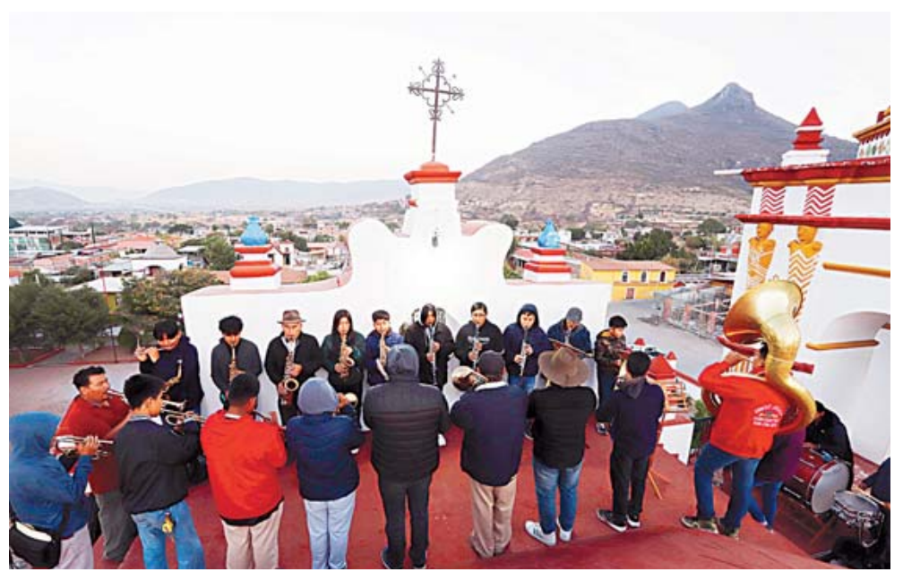
■ Una de las ocho bandas de música de la comunidad anuncia con una serenata el inicio de la Cuaresma.

"La fe que tenemos en la iglesia católica es la principal razón de esta tradición única en los Valles Centrales y lo que recogemos de la tierra lo ofre-