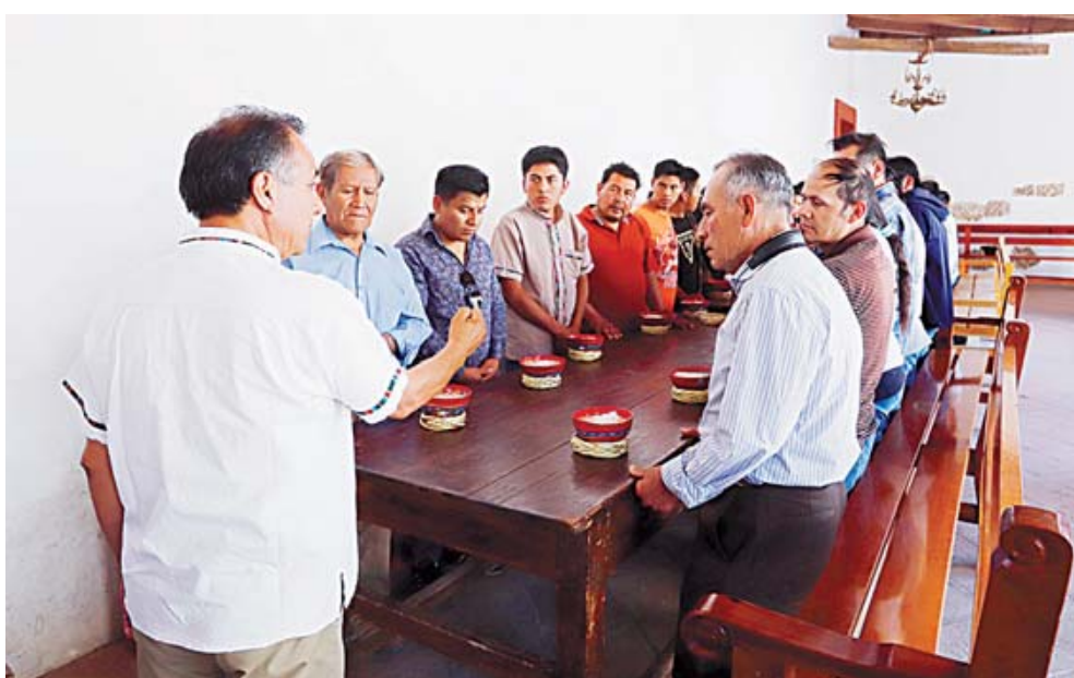
■ A los invitados se les ofrece un delicioso tejate hecho por las manos mágicas de las mujeres de la población.

a las nuevas generaciones que vienen. Que sea esta bella comunidad la que continúe dando al mundo mucho material para que siempre se tenga algo de qué hablar en el aspecto cultural y tradicional.