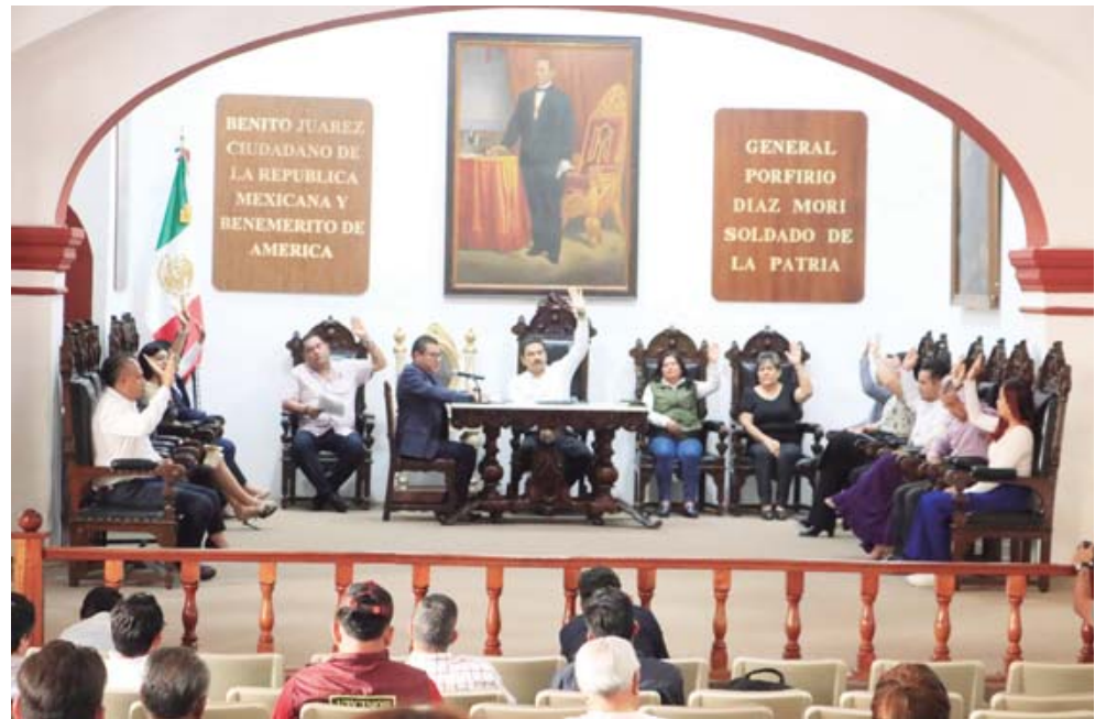
En sesión extraordinaria, el Cabildo aprobó los ajustes en las elecciones de agencias tras la resolución de la Sala Xalapa del TEPJF.

En otra sesión extraordinaria de este jueves, el cabildo de Oaxaca de Juárez también aprobó las modificaciones al proceso de elección en las agencias municipales que tendrán su jornada este 15 de marzo. Esto a raíz de la resolución de la Sala Xalapa del Tribunal Electoral del Poder Judicial de