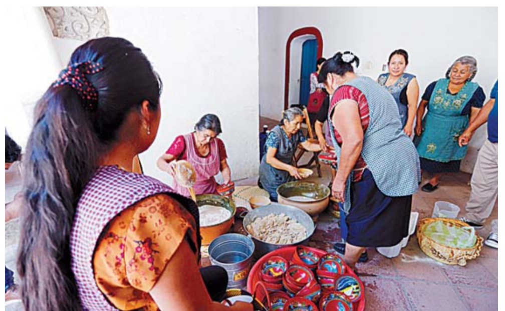
■ En el atrio de la iglesia las mujeres preparan esta bebida que los ayuda a refrescarse del calor que se siente en el lugar.