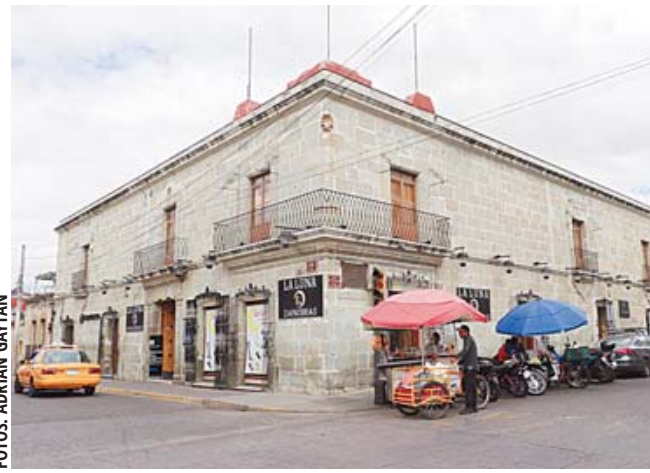
■ Otro inmueble en el que vivió Juárez es el conocido como Casa de la Tesorería y Aduana del Estado.

Una placa afuera del inmueble, ubicado en la