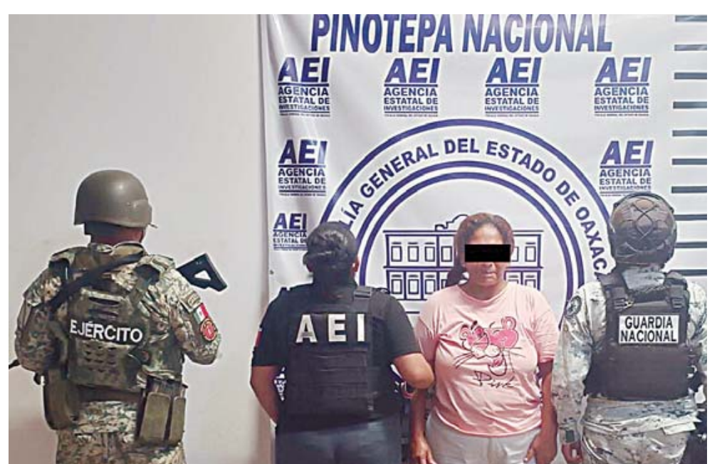
El juez otorgó un plazo de un mes para el cierre de la investigación.

Tras la detención, la Fiscalía General del Estado de Oaxaca presentó las pruebas recolectadas, que fueron evalua-