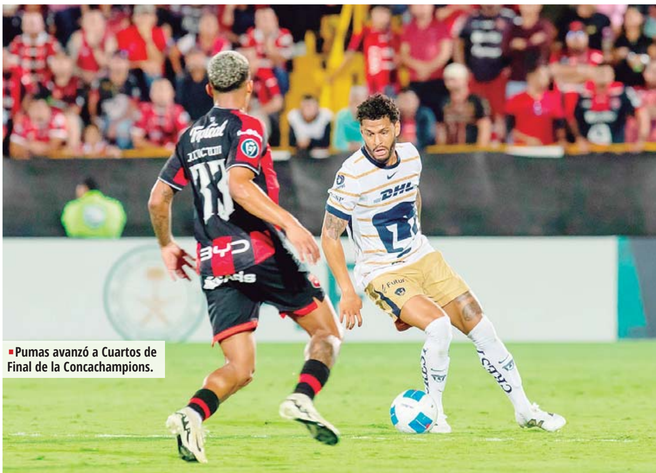
■ Pumas avanzó a Cuartos de Final de la Concachampions.