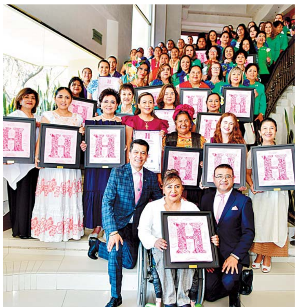
■ Mujeres sobresalientes en diferentes ámbitos de nuestra sociedad fueron reconocidas con la distinción de la H Rosa.

Al término del evento, se tomaron la foto del recuerdo. El lente de Estilo Oaxaca estuvo en el evento.