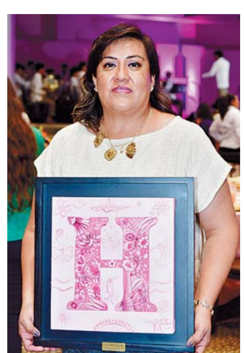
■ Aguas Casilda recibió la H Rosa.