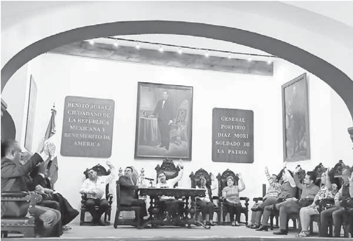
El cabildo envió a comisión la propuesta para realizar este diagnóstico.