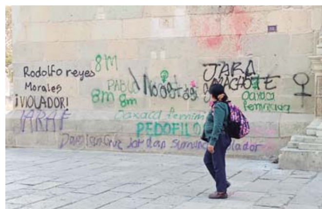
En la catedral aún se observan las consignas de las mujeres contra el Estado y diversos hombres.

bién adelantó que probablemente sea dentro de dos semanas cuando la compañía de seguros venga a la ciudad para hacer el recorrido y evaluación junto con el personal del instituto. Asimismo, que aún es incierto cuándo se tendrán los resultados.