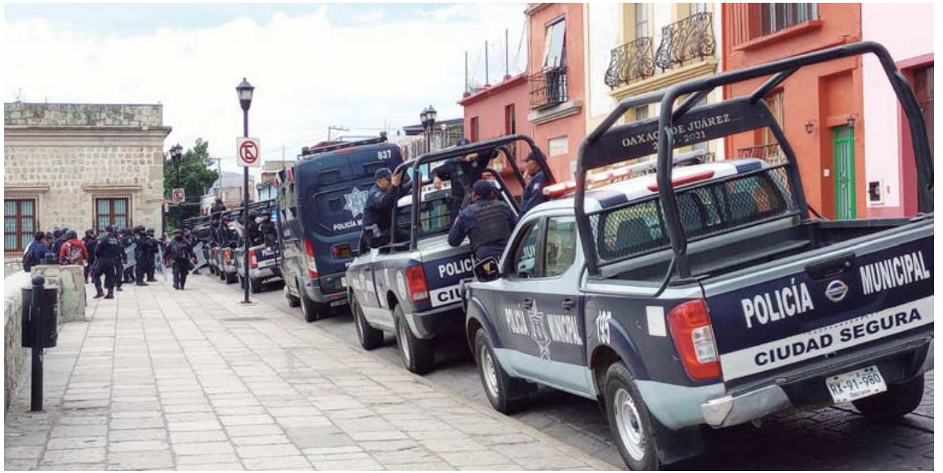
Se prevé nutrir a la corporación que surgió en el año 1990 como policía metropolitana.

Con poco más de mil elementos en la corporación y poco más de 700 de ellos en el área de