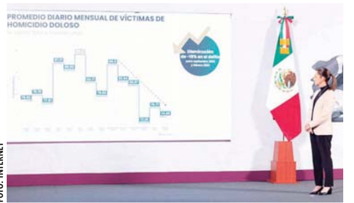
La Presidenta Claudia Sheinbaum informa sobre los resultados de la Estrategia Nacional de Seguridad.

A esto se agrega otro acto de brutalidad policiaca, protagonizado por la Policía Estatal en contra de un menor de edad. Todo se suscitó debido a que el chico siguió patinando en el Parque Primavera durante la visita e inspección del Gobernador Salomón Jara al área de esparcimiento.