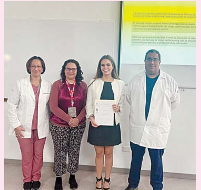
Los sinodales aprobaron el examen profesional de la joven talentosa.