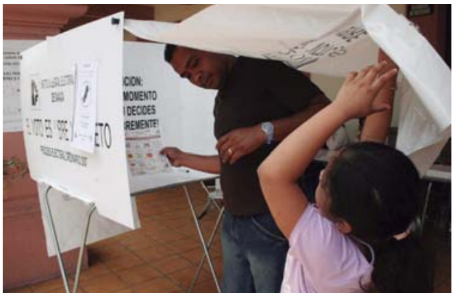
La Sala Xalapa determinó que la elección en Santa Rosa tendrá que ser con base en la primera convocatoria.

cias de la ciudad que se rigen por Sistemas Normativos Internos. Al calificar como hechos aislados lo sucedido en Guadalupe Victoria, el presidente municipal explicó que en las demás sí se logró concluir la elección.