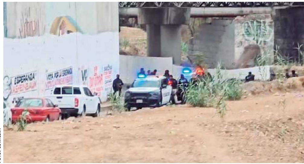
La inseguridad y violencia alcanza niveles alarmantes en Oaxaca, con la desaparición y asesinato de al menos 9 jóvenes de Tlaxcala en Bahías de Huatulco, y la ejecución de dos personas en el Parque del Amor.

Ante tales condiciones, representantes del sector empresarial coincidieron que la inseguridad en Oaxaca ha alcanzado niveles alarmantes en los últimos años. A pesar de los esfuerzos de las autoridades, los índices de violencia y delincuencia continúan en ascenso, afectan