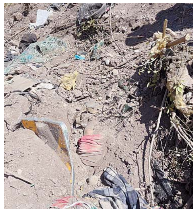
■ El cuerpo del hombre fue hallado semienterrado entre los escombros y la tierra.

Las investigaciones continúan para esclarecer