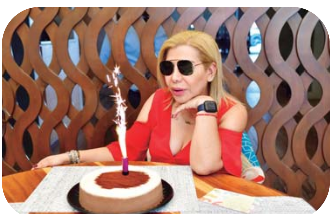
■ La feliz cumpleañera pasó un momento inolvidable con sus amigos.