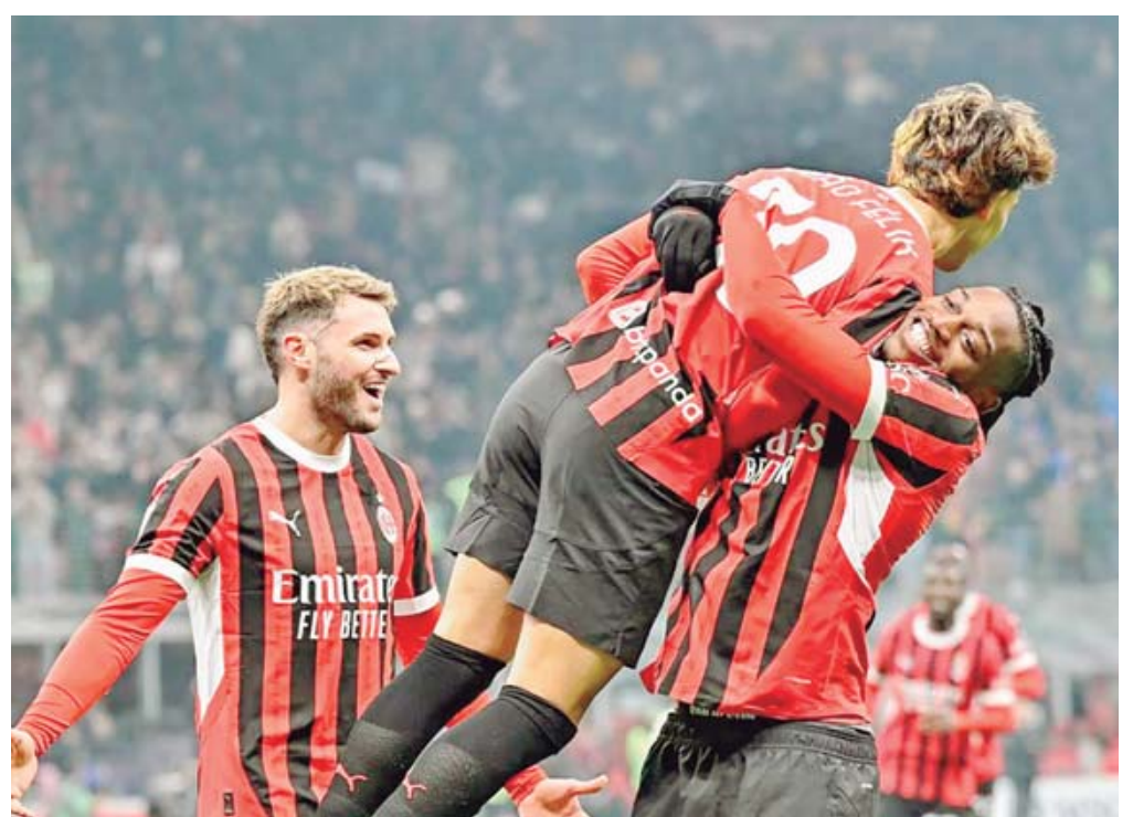
Gran debut de Santiago Giménez, con el AC Milan.