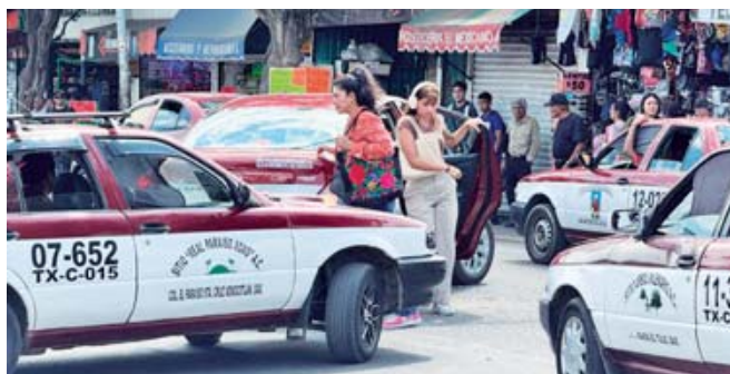
■ Fomentan o causan el caos e inseguridad en inmediaciones del Mercado de Abasto.

lan maniobras peligrosas en las que estos taxis circulan sobre banquetas, se desplazan en sentido contrario o se estacionan en zonas prohibidas para "levantar pasaje". Un ejemplo reciente se observó en la Central de Abasto, donde taxistas han impuesto su propia "ley", ocupando espacios destinados al estacionamiento y formando hasta triple fila para captar clientes, sin que hasta el momento la autoridad competente intervenga.