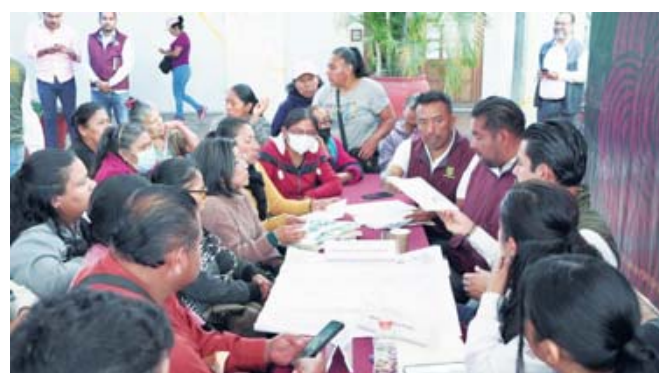
■ Mesas de los Diálogos vecinales llevados a cabo ayer en Palacio Municipal.

Por la mañana en el marco de los Diálogos Vecinales, el presidente municipal de Oaxaca de Juárez, Ray Chagoya, sostuvo un encuentro con integrantes del Sindicato Libre, luego de la irrupción de los empleados con gritos y protestas al interior del Palacio Municipal; ahí se reiteró el compromiso