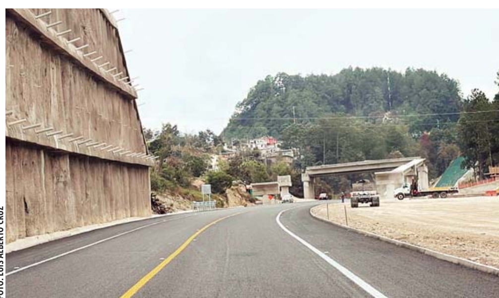
Después de su apertura el pasado 24 de enero, continúan trabajos de mantenimiento en la autopista Mitla-Tehuantepec.

A medida que los primeros vehículos comienzan a transitar por la nueva vía, queda pendiente evaluar su impacto real en el desarrollo regional y