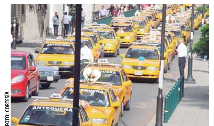
Busca Gobierno de Oaxaca poner orden en el servicio de transporte público.

Entre los municipios beneficiados se encuentran San Pablo Villa de Mitla, San Lorenzo Albarradas, San Pedro y San Pablo Ayutla, Santo Domingo Tepuxtepec, San Pedro Quiatoni, San Juan Juquila Mixes, Nejapa de Madero, Santiago Lachiguiri, Santa María Jalapa del Marqués y Santa María Mixtequilla.