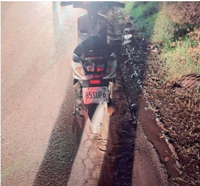
En el lugar fue encontrada una motocicleta, que posiblemente era la que viajaba la víctima.

Aún no se ha dado a conocer si la Fiscalía ya tomó conocimiento del caso, qué vehículos estuvieron involucrados ni el estado de salud actual de la víctima.