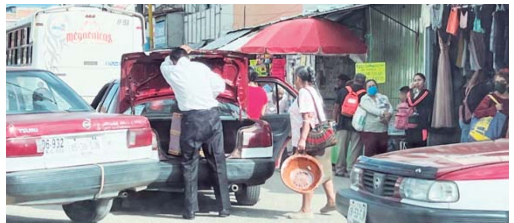
■ Suben pasaje en medio del arroyo vehicular, sin precaución e interrumpiendo el tránsito.

Las irregularidades identificadas vulneran el derecho de la ciudadanía a un tránsito seguro y afectan gravemente el orden vial y la imagen de Oaxaca de Juárez. De acuerdo con la Semovi, estos operadores han incurrido en faltas que contravienen preceptos de la Ley de Movilidad para el Estado de Oaxaca. En particular, se ha señalado que la actualización de tarifas sin contar con el dictamen correspondiente viola lo dispuesto en los artículos 187, 220 y 223, que establecen las causas de revocación, las limitaciones para modificar el pasaje y las sanciones para quienes alteren el servicio sin autorización.