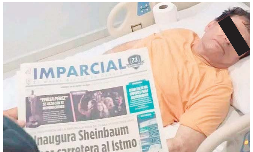
Hace unos días circuló una foto con un periódico como prueba de que se encuentra "internado".