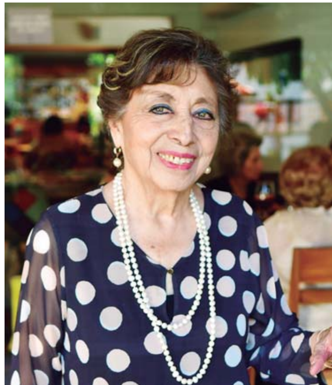
■ La carismática cumpleañera recibió todos los detalles preparados por sus grandes amigas.