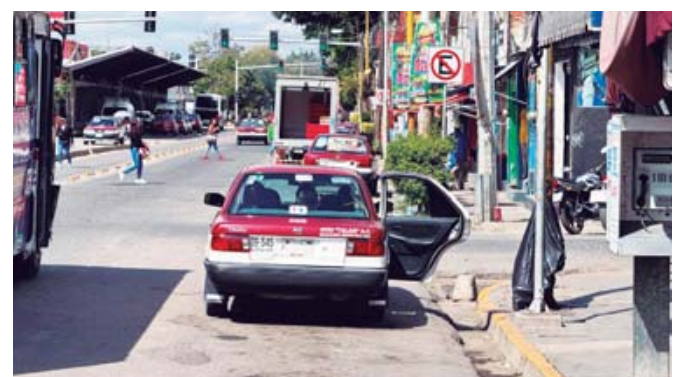
■ Paran y "hacen base" sin respeto al reglamento de tránsito, imponen tarifas con la complicidad de Semovi.

La inseguridad de los usuarios se agrava aún más ante el creciente número de robos en los que se han visto involucrados estos vehículos, en algunos casos hasta con armas de fuego.