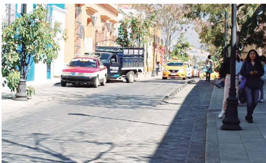
El ciclo carril de García Vigil, se encuentra deteriorado y sin atención de las autoridades.

Ante estas condiciones, diversos ciclistas han exigido atención para la rehabilitación de la infraestructura ciclista, pues el daño y abandono implican riesgos para su integridad.