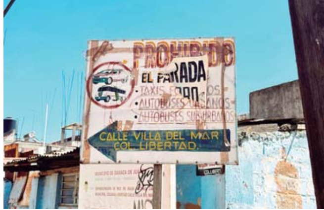
Prohíben la parada de taxis y autobuses.