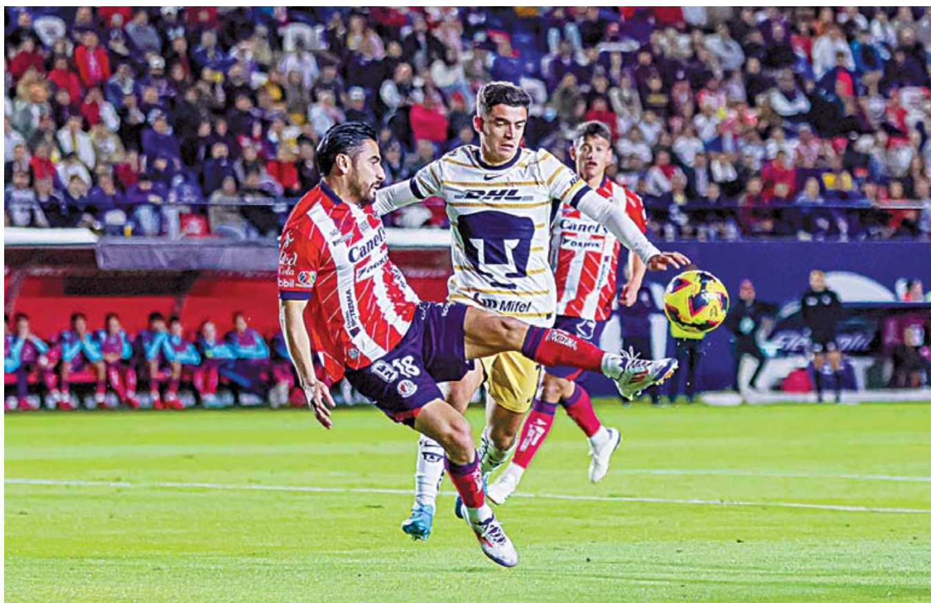
Pumas volvió al triunfo luego de haber derrotado a Necaxa en la Jornada 1 del Clausura 2025.