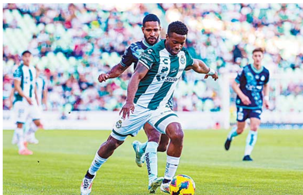
Santos es el único equipo en el Clausura 2025 que, tras cinco jornadas, se mantiene con cero puntos.

Justo cuando el equipo local tenía el control del juego, La Franja aprovechó