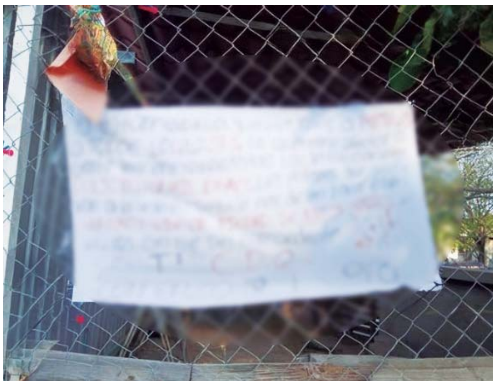
La narcomanta fue colocada en una malla ciclón; ya se investiga su contenido.

Las autoridades locales, al ser alertadas de la situación, acudieron de inmediato al lugar y procedieron a retirar el mensaje. La Vicefiscalía Regional del Istmo inició las indagatorias correspondientes para dar con los responsables de la colocación de la manta y esclarecer el contenido de la amenaza.