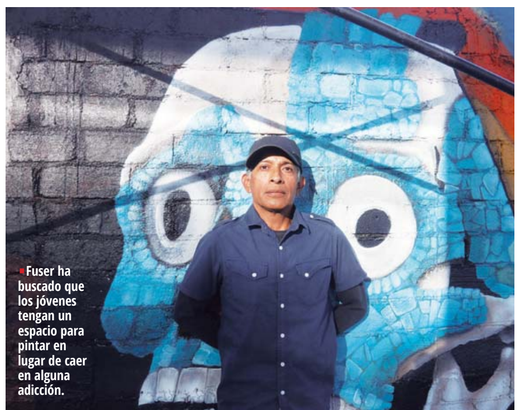
Fuser ha buscado que los jóvenes tengan un espacio para pintar en lugar de caer en alguna adicción.

Actualmente es el sector privado quien confió en Fuser para crear en este espacio una línea de tiempo y contar la historia de Oaxaca donde combina lo tradicional y esa visión que él tie-