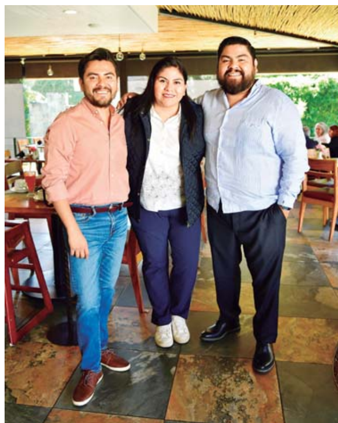
Los hermanos disfrutaron de ricos platillos a la carta mientras charlaban sobre sus planes y proyectos.