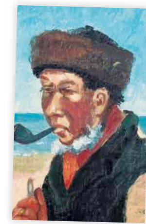
La investigación data el cuadro en 1889.

La investigación data el cuadro en 1889, es decir un año antes de la muerte de Van Gogh, y concluye que el famoso pintor neerlandés se inspiró “claramente” en una obra del danés Michael Ancher (1849-1927), el