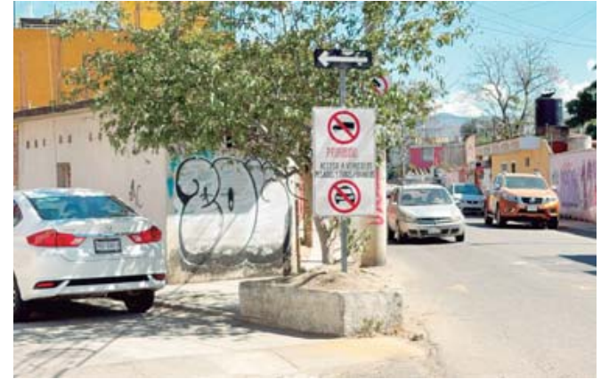
Vehículos pesados y taxis foráneos no pueden circular.

Vecinos de la colonia Libertad han impuesto restricciones para la circulación de unidades del transporte público, colocando postes, cadenas y candados