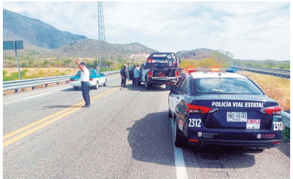
La policía continúa con la investigación para esclarecer los hechos.

Cinco integrantes de la familia resultaron heridos y el conductor falleció a la altura de la desviación a Lachiguiri