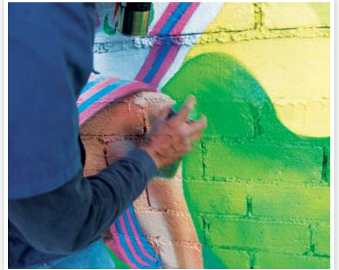
El grafiti lo hace ver la problemática de nuestro estado.