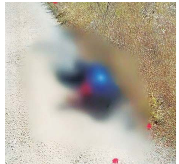
Un hombre fue localizado sin vida por impactos de bala; podría tener relación.

que los familiares de la víctima retiraron el cuerpo antes de la llegada de las autoridades, por lo que, si bien las autoridades