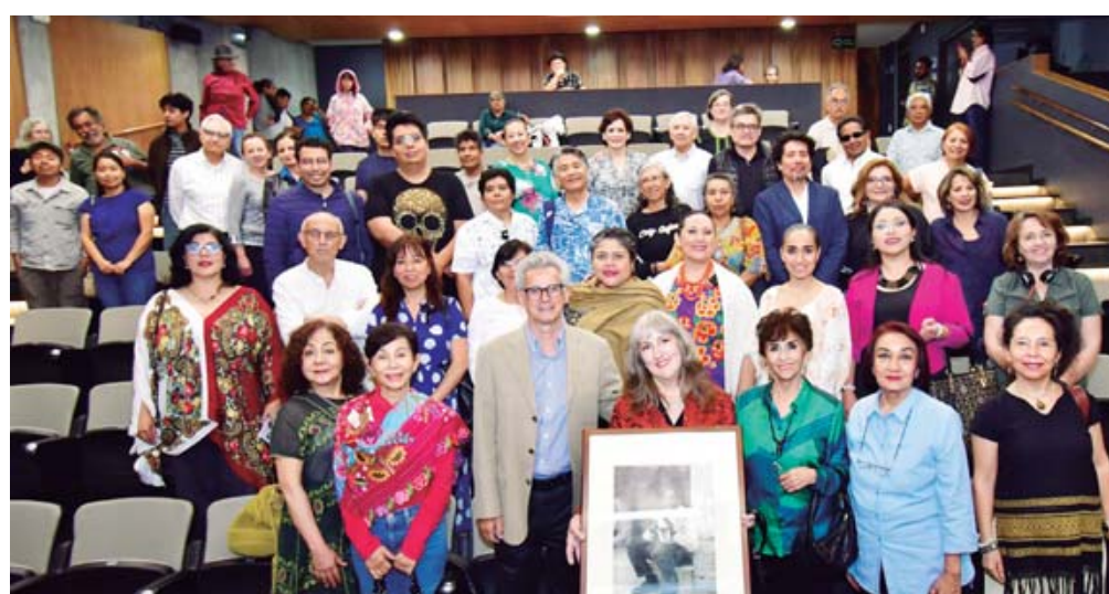
En el auditorio de la Unidad de Extensión Universitaria de la UNAM, se realizó la presentación del documental "Un Camino al Cielo".