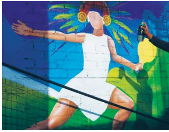
Inicia con una línea de tiempo haciendo un homenaje a los muertos y después a la vida.