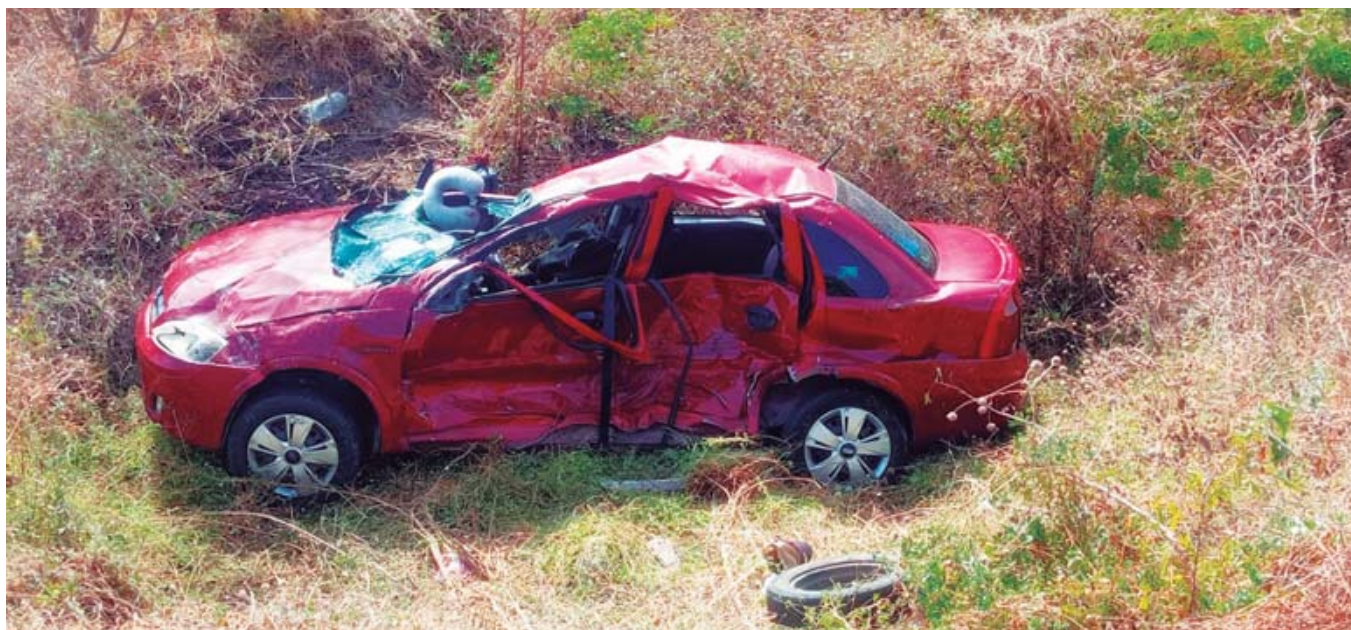
El auto de la familia cayó a un barranco de tres metros de profundidad.

De acuerdo con fuentes extraoficiales, el accidente involucró a una familia originaria de Ciudad Ixtepec, que se encontraba de visita en la ciudad de Oaxaca. Durante su trayecto, la familia decidió conocer la nueva Súper Carretera, pero al llegar al entronque del tramo Ixtepec-Salina Cruz, intentaron dar una vuelta en "U"