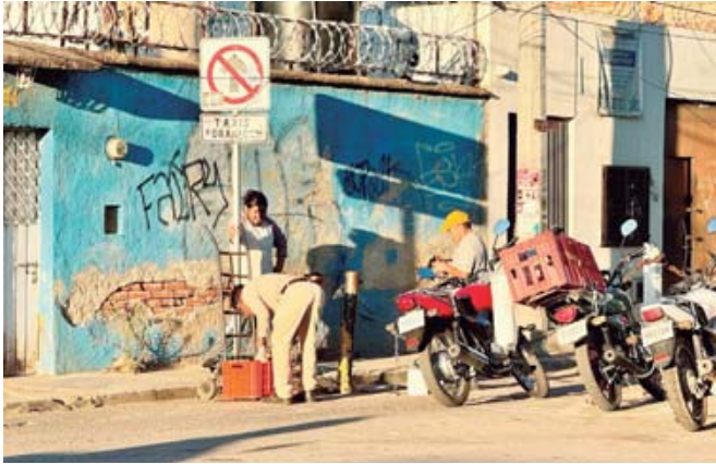
Colocan postes, cadenas y candados.