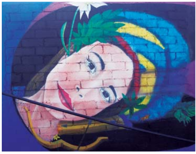
Este artista urbano es admirado por muchos y es referencia para otros.