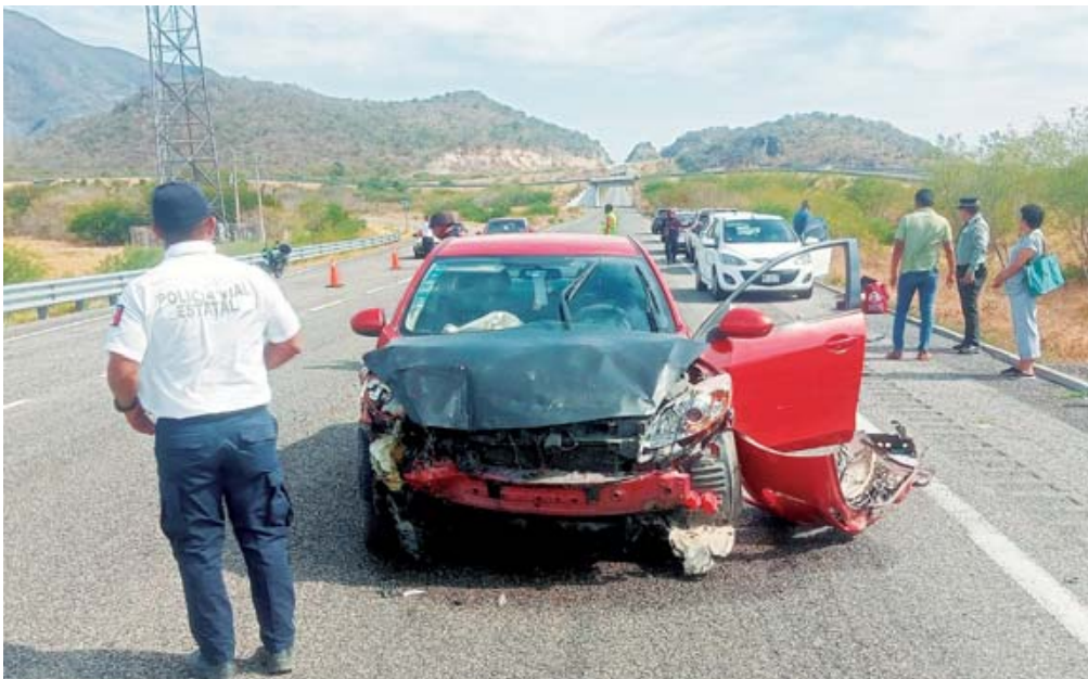
El conductor del Mazda quedó lesionado y fue trasladado al hospital.