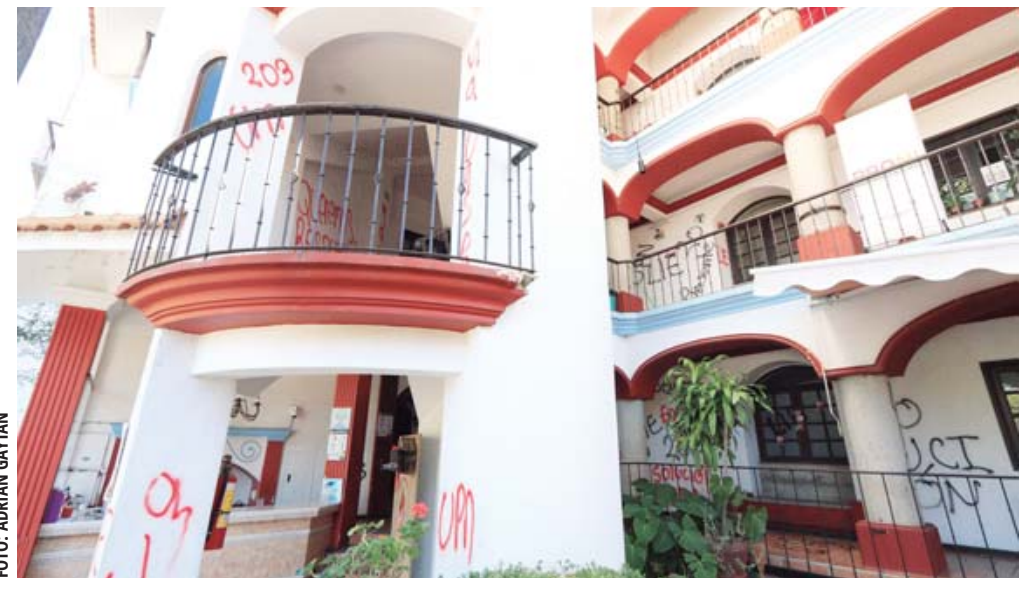
Un edificio ubicado en San Felipe del Agua, donde funcionan oficinas del IEEPO, fue vandalizado por estudiantes normalistas el pasado 9 de enero.

Arrenda 230 inmuebles ubicados en 51 municipios; el gasto se incrementó en 14.3% de 2021 a 2024