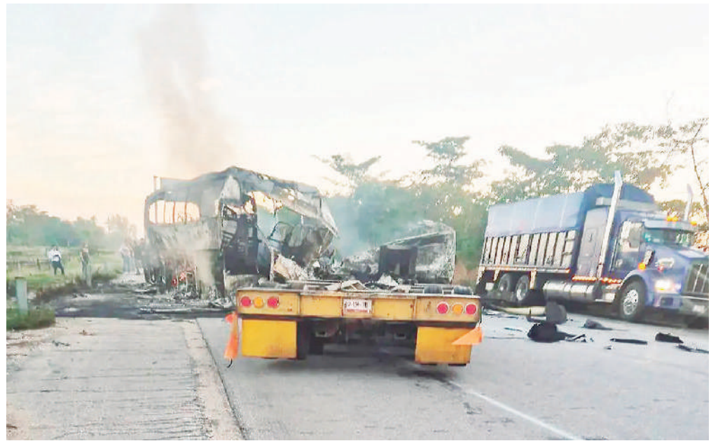
■ Tours Acosta responsabiliza a tráiler del choque.

La colisión fue tan violenta que el autobús y el tráiler quedaron completamente envueltos en llamas