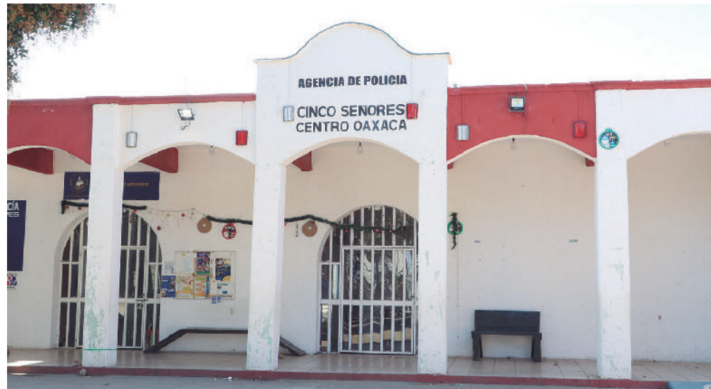
Los días 2 y 9 marzo, 12 de las 13 agencias municipales y de policía del municipio renovarán a sus agentes.

Únicamente señala que corresponde a la Dirección de Agencias, Barrios y Colonias «organizar y vigilar el desarrollo de la elección de los agentes municipales y de policía para el periodo 2025-2027, garantizando en todo momento el principio de paridad de género en su conformación y en su caso, las tradiciones, usos, costumbres y prácticas democráticas de las propias localidades,