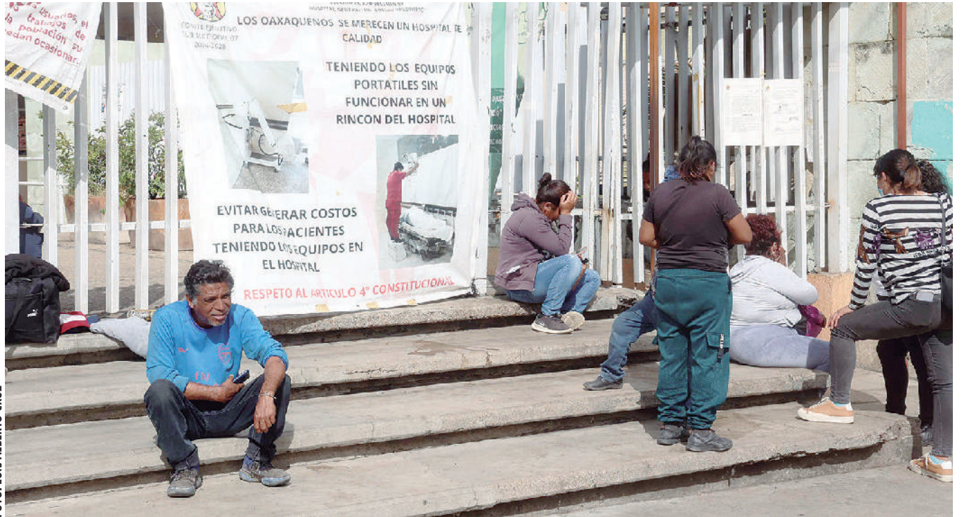
La infraestructura de salud de Oaxaca atraviesa uno de sus peores momentos.

*Magistrado Presidente de la Sala Constitucional y Cuarta Sala Penal del Tribunal Superior de Justicia de Oaxaca