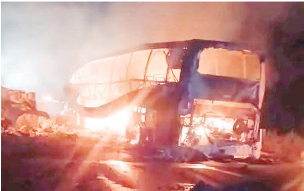
■ Fatal saldo arrojó el trágico accidente.