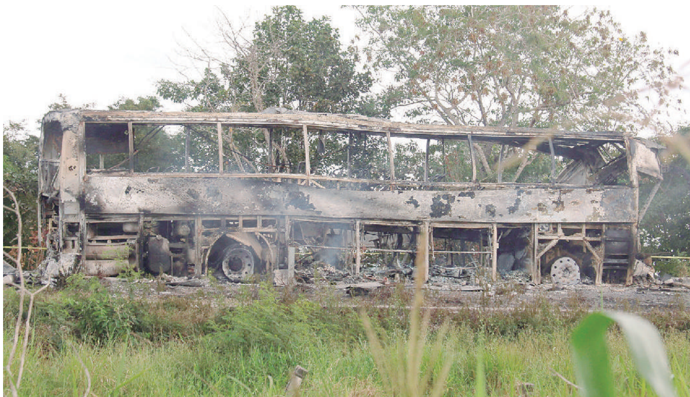
■ Más de 40 muertos en choque entre autobús y tráiler en Escárcega-Villahermosa.

de Cancún, Quintana Roo a la ciudad de Tabasco, transportaba varios pasajeros, y según medios locales, la desgracia dejó un saldo preliminar de al menos 8 sobrevivientes que lograron salir de las llamas.