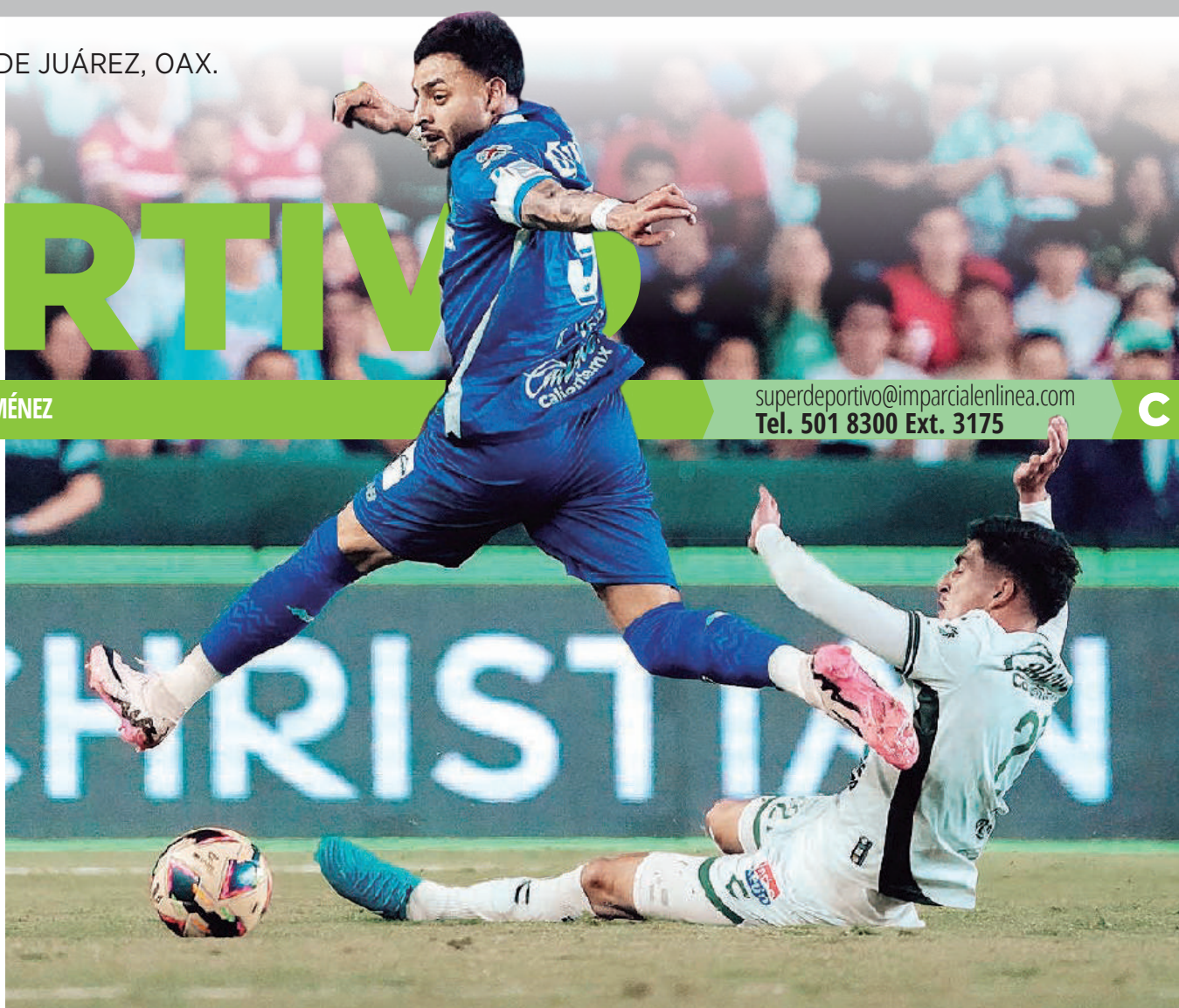
■ Toluca se levantó de una desventaja de dos goles y logra rescatar un punto.

A pesar de que terminaron pidiendo la hora, FC Juárez dio la campanada de la jornada y le pegó 2-1 a Rayados, que con el agónico gol de Sergio Canales le puso sabor a los últimos minutos.