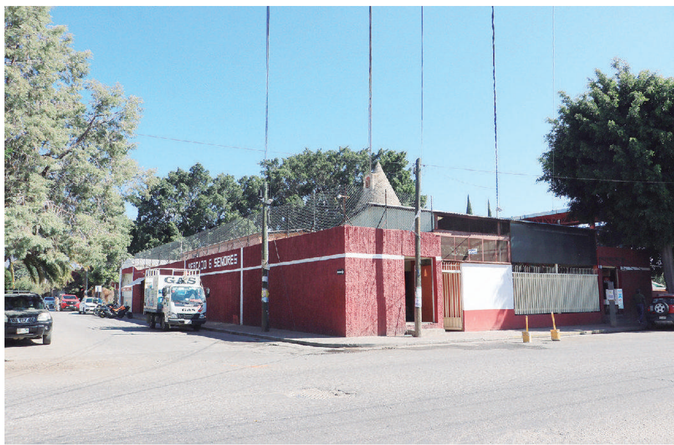
La agencia de Cinco Señores enfrenta carencias o varios problemas que espera resolver o disminuir.

En medio de la urbanización, la agencia mantiene rezagos en cuanto a servicios básicos, pero también la inseguridad.