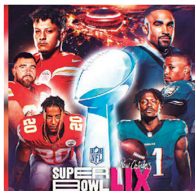
■ No te pierdas este domingo la final de la NFL.

La gran cita es este domingo 9 de febrero de 2025, a las 17:30 horas (Centro de México). A partir de esa hora los fanáticos podrán disfrutar de la acción en vivo a través de diversas plataformas: