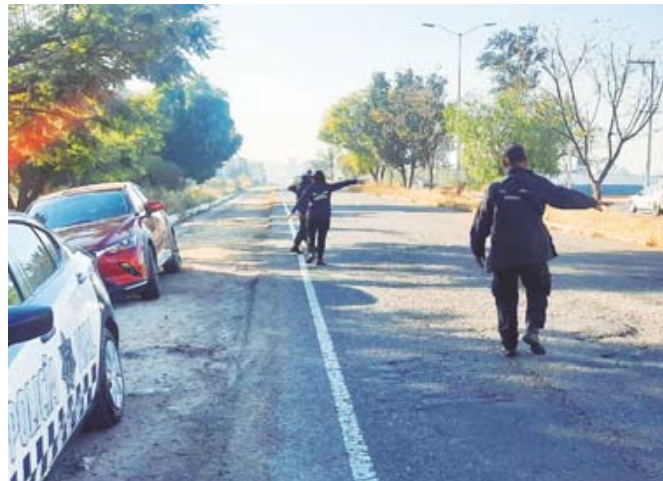
El olor fétido no venía de la cajuela del vehículo, sino de un perro muerto cerca del lugar.

Elementos de la Policía Vial Municipal, tomaron conocimiento del percance.