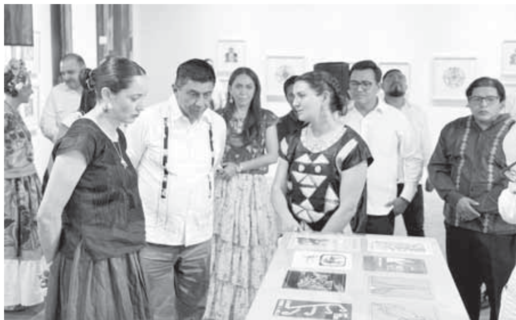
El gobernador Salomón Jara estuvo durante la reapertura de la Casa de Cultura.