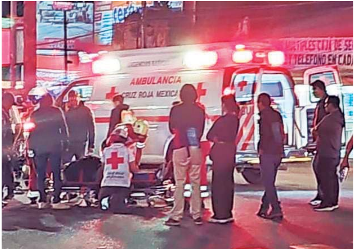
El motociclista salió proyectado, quedando tendido con lesiones de consideración.

Al final, la situación se resolvió sin mayores complicaciones, y aunque el aroma a misterio fue solo una falsa alarma, la Policía Vial Estatal se aseguró de que el vehículo fuera resguardado hasta su reclamo formal.