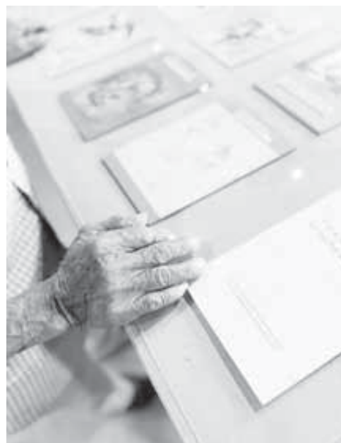
El objetivo es mostrar a las nuevas generaciones el trabajo del maestro Toledo.