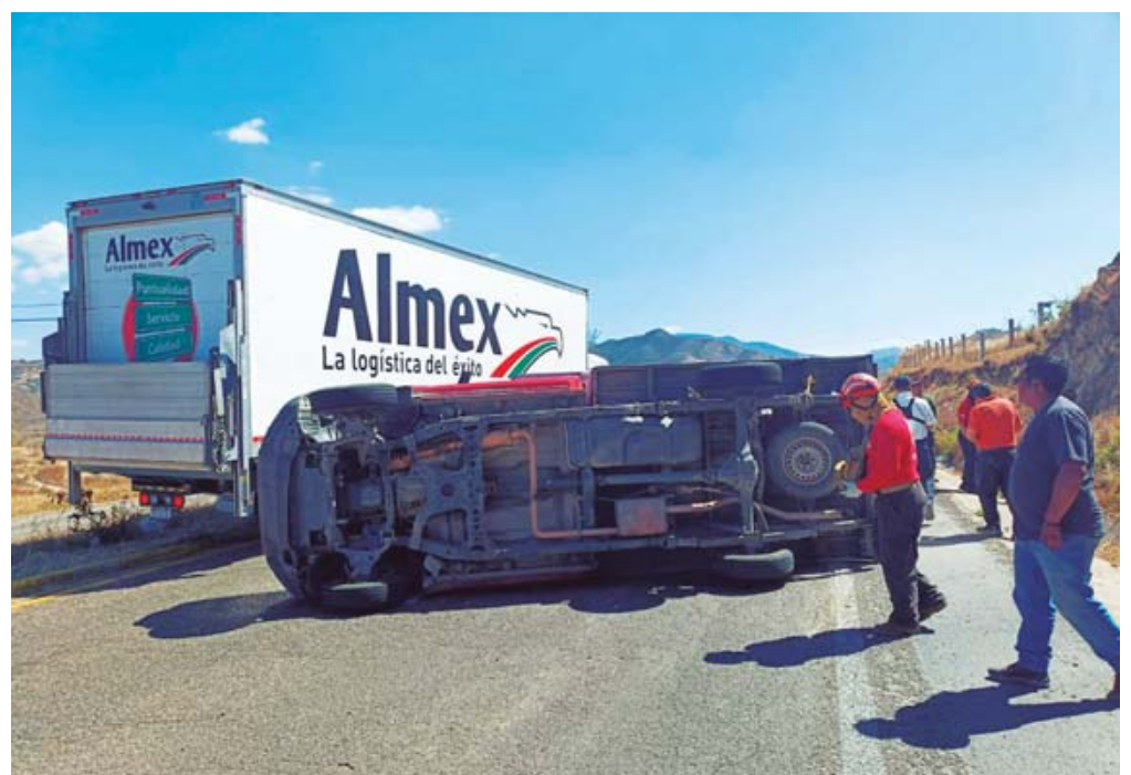
Luis P.H., perdió el control y terminó volcada a un costado de la vía.