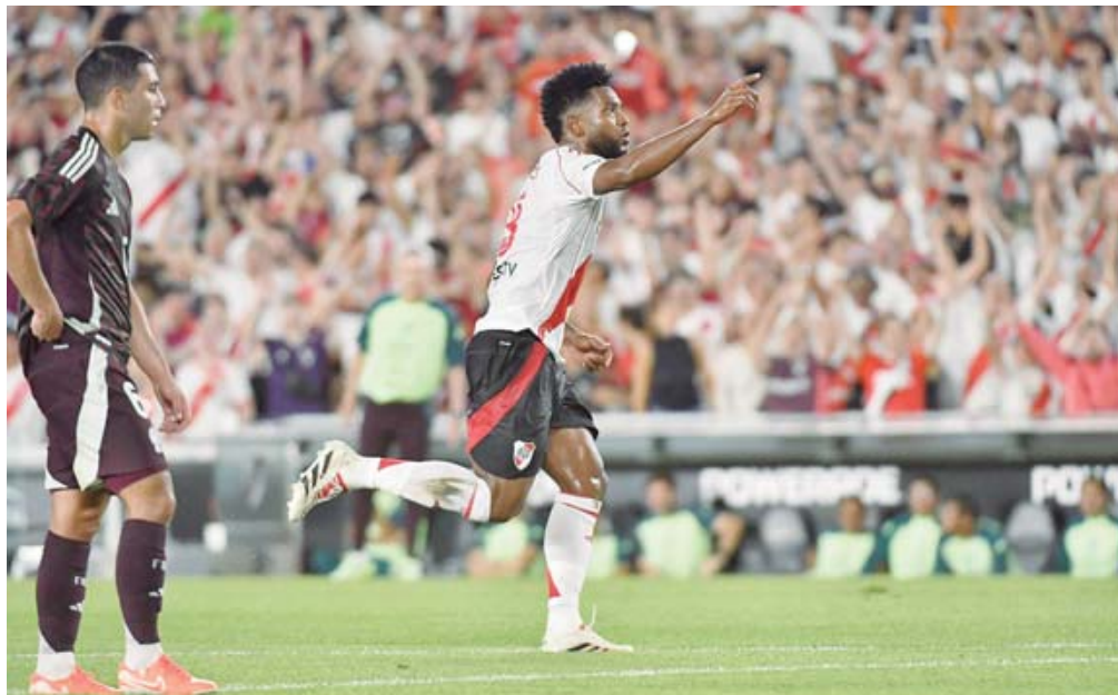
Los argentinos dominaron el juego desde el arranque del primer tiempo.

La primera jugada fue justamente para River, Colidio encontró un hueco y disparó al arco pero Andrés Sánchez estuvo atento, mientras que el Tri del 'Vasco' aguantaba atrás esperando un con-