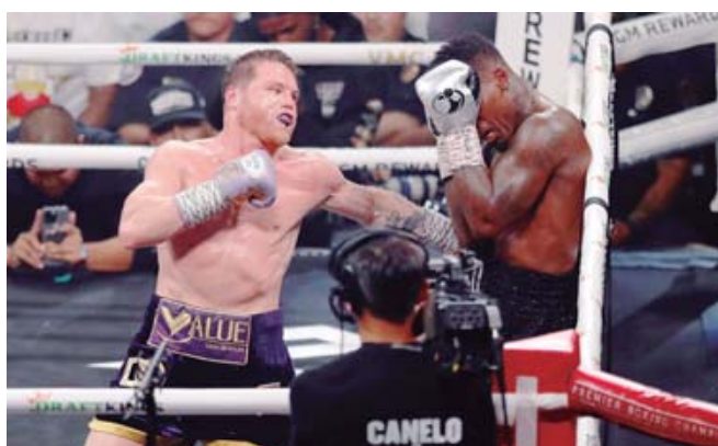
En entrevista, Canelo minimizó los logros del estadounidense.

La respuesta de Crawford no se hizo esperar. A través de su cuenta oficial en X, el estadounidense lanzó una advertencia directa: "¿Entonces de todos los peleadores que he enfrentado sólo uno ha sido bueno? Tomo nota de eso. Solo recuerden lo que dije, porque siempre he tenido el placer de hacer que un peleador que es alguien termine luciendo como un don nadie".