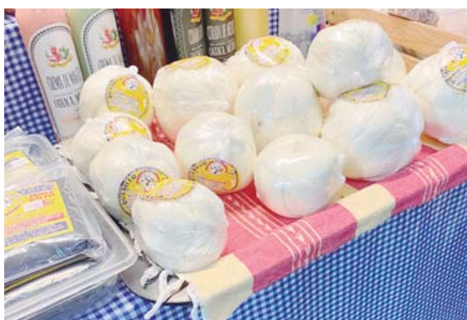
El precio del queso registra nuevo aumento.