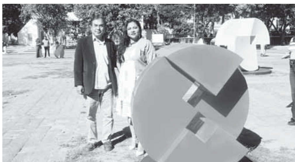
Cuatro piezas de acero esmaltado se exhiben en la explanada de rectoría.

Artes Plásticas y Visuales, maestro Moisés García Nava; el creador de la obra, maestro García Agustín, así como del funcionariado y docentes de esta máxima casa de estudios.