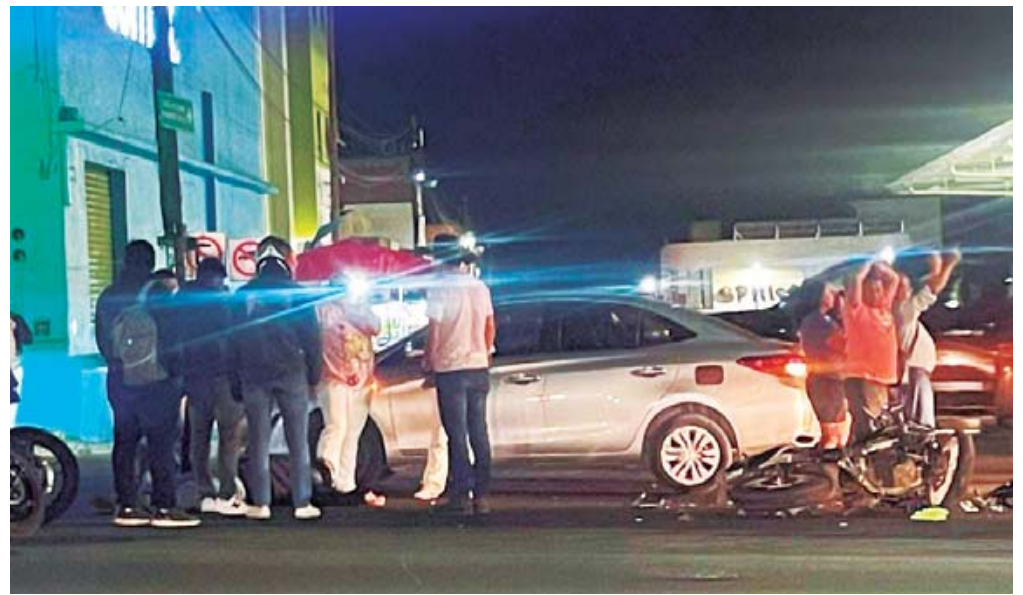
Fue arrollado la noche de ayer en la calzada Héroes de Chapultepec.

El accidente sucedió alrededor de las 22:30 horas cuando un hombre de aproximadamente 38 años de edad, conducía su motocicleta con placas de circulación del estado de Oaxaca, se diri-