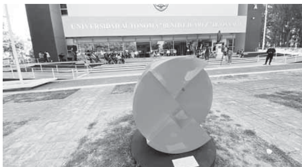
La exposición "La rueda del tiempo" es del escultor García Agustín.