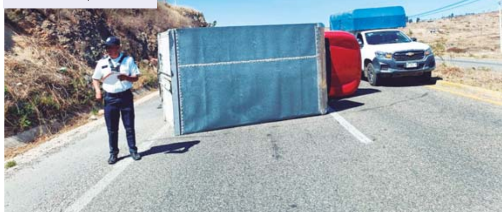
Las autoridades se hicieron cargo de restablecer la circulación.

Afortunadamente, no se reportaron personas lesionadas en el percance, aunque la camioneta sufrió daños materiales importantes.