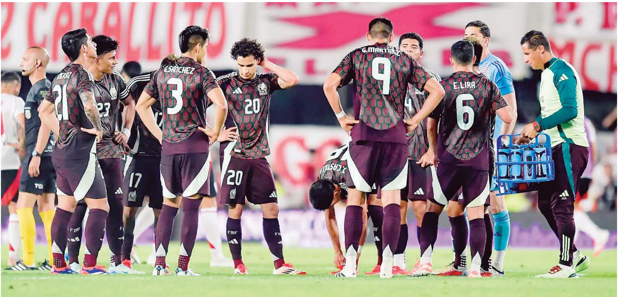
El Vasco fue crítico al señalar que a algunos de sus jugadores no les alcanza para competir.