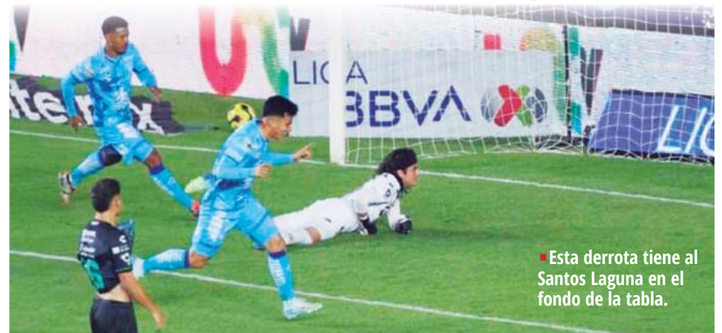
Esta derrota tiene al Santos Laguna en el fondo de la tabla.