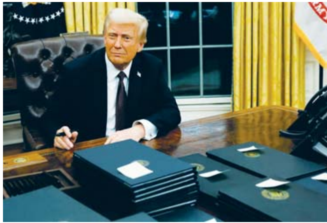
■ En la Oficina Oval de la Casa Blanca, Donald Trump firmó sus primeras órdenes ejecutivas como Presidente.

En referencia a su promesa y amenaza de imponer aranceles del 25% a las exportaciones de México y Canadá si no evitan el flujo de inmigrantes indocumentados