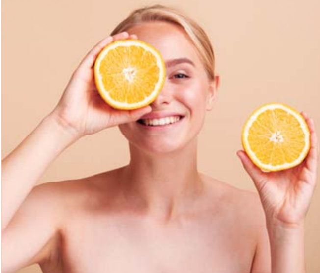
▪ Sin importar si es invierno o verano, usar vitamina C de forma constante es clave para mantener un cutis envidiable.

La experta nos sugiere comenzar a utilizar vitamina C alrededor de los 25 años, ya que es en esta etapa cuando la producción de colágeno comienza a disminuir. “A partir de esta edad, la piel requiere un poco de ayuda extra para mantenerse firme, luminosa y protegida.