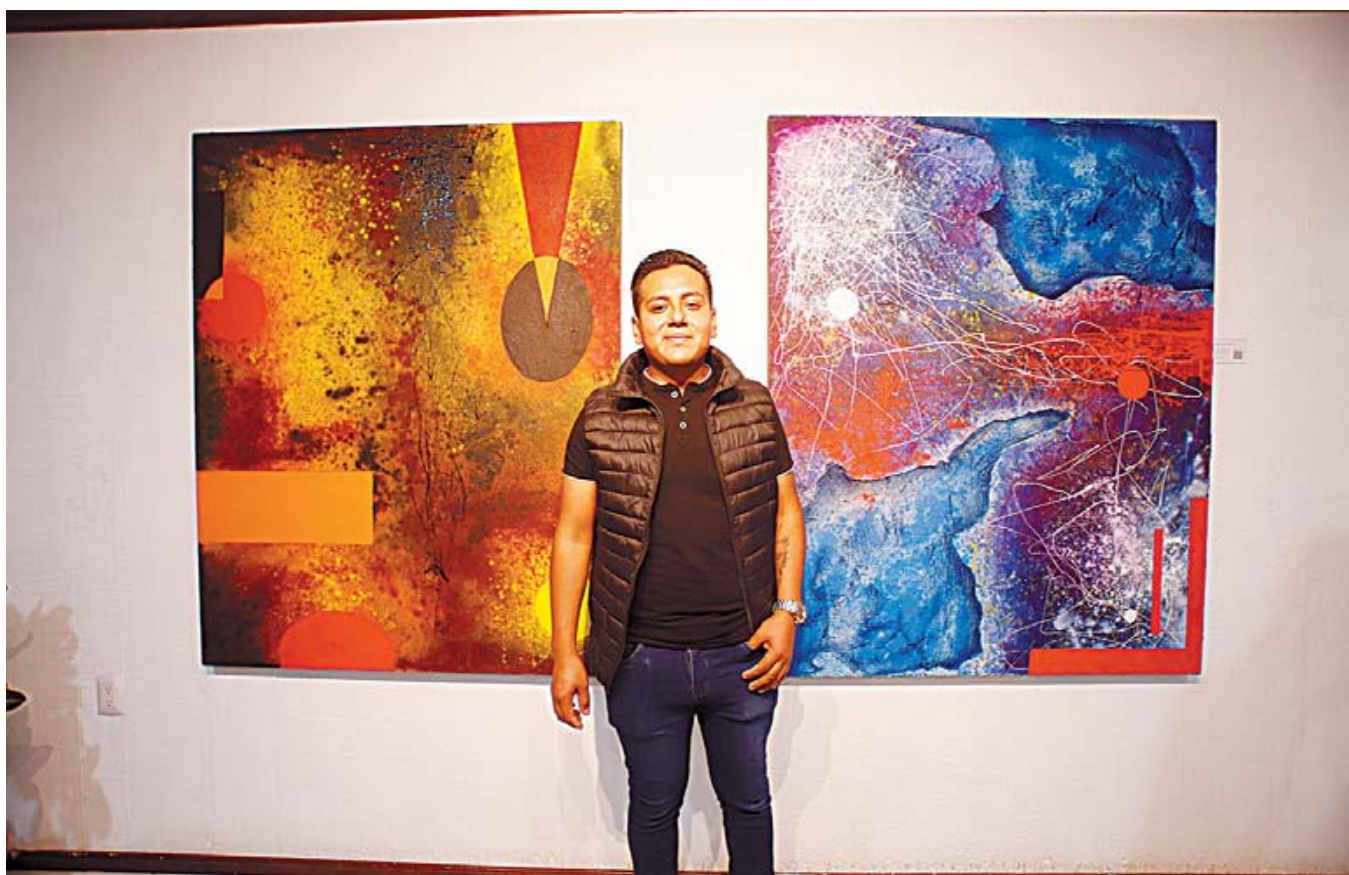
Reska no dejó de recorrer cada uno de los muros donde se postraban sus 18 obras.

y de la mano con el proyecto artístico de Dimitrova Gallery inaugura la primera exposición de pintura abstracta del año en Oaxaca.