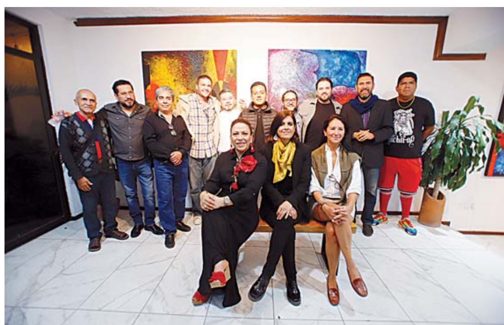
Maestros e invitados especiales estuvieron presentes en la presentación.

El joven artista oaxaqueño realiza su primera exposición de pintura abstracta del año en Oaxaca