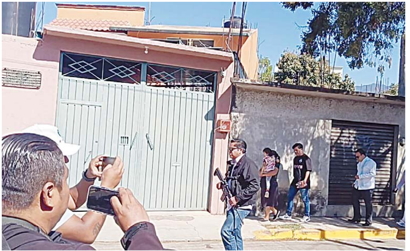
El padrastro de las jóvenes, presunto responsable del doble feminicidio, se encuentra prófugo.

sepultura según sus costumbres, la madre de las víctimas aún se encon-