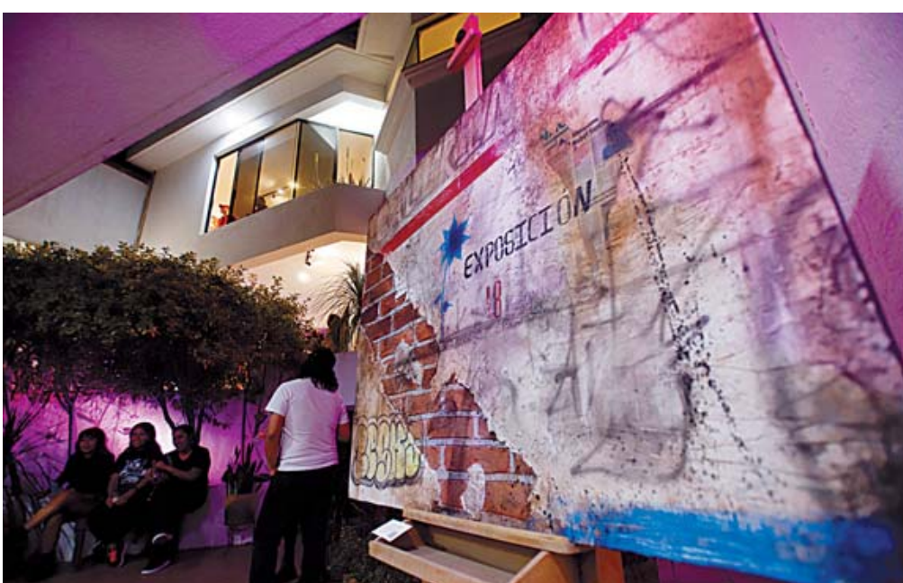
El artista oaxaqueño ha experimentando varios años sobre la marcha.