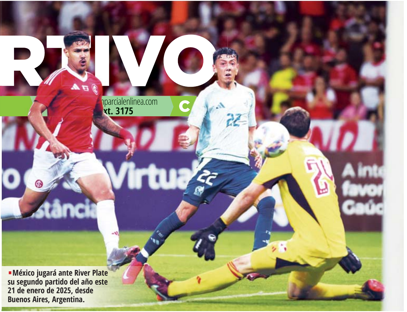
México jugará ante River Plate su segundo partido del año este 21 de enero de 2025, desde Buenos Aires, Argentina.