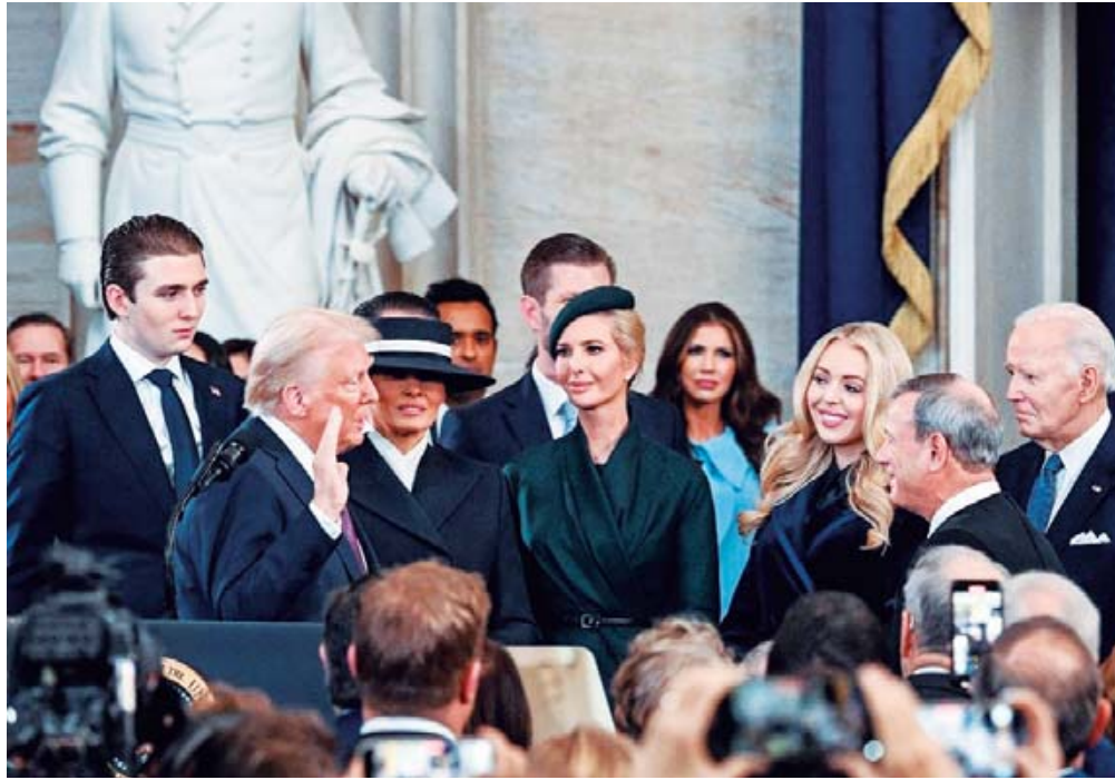
■ Donald Trump, de 78 años, se convirtió en el 47° presidente de Estados Unidos, al jurar el cargo en el Capitolio, este lunes.

En los primeros minutos de su regreso a la Casa Blanca y la Oficina Oval para arrancar su segundo mandato presidencial, Trump firmó la orden para declarar estado de emergencia en la frontera con México, lo que le permitirá usar a elementos de las fuerzas armadas para ubicar, detener y deportar a inmigrantes indocumentados.