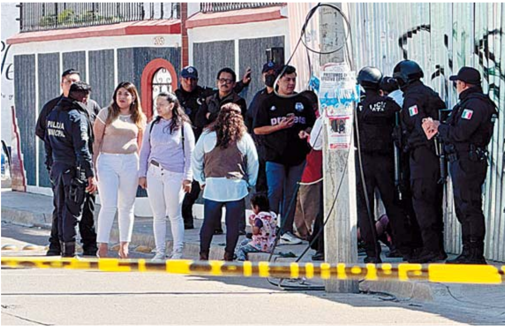
La madre de las víctimas fue puesta bajo custodia de las autoridades.