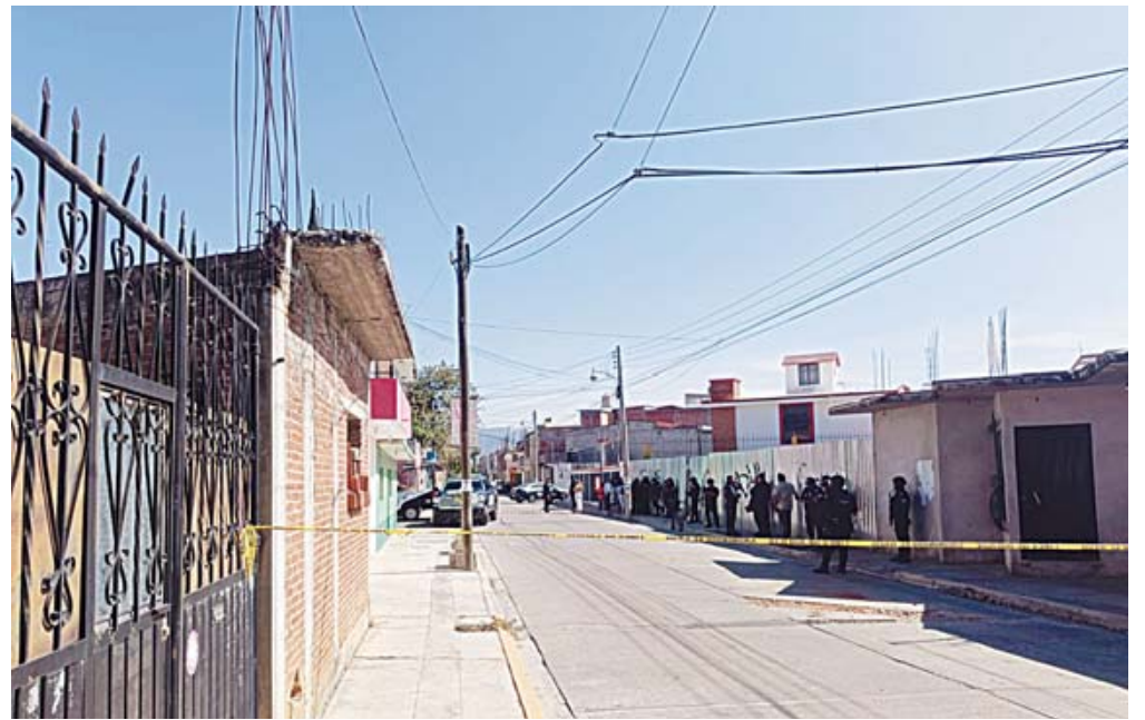
El hecho ocurrió en un domicilio de la calle San José de la colonia Santa Cecilia.

Dos jóvenes de 22 y 14 años de edad fueron asesinadas presuntamente por su padrastro en un domicilio de la colonia Santa Cecilia