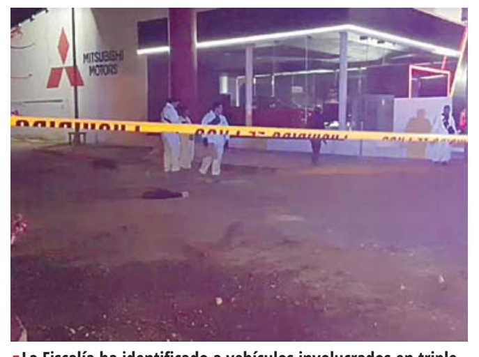
La Fiscalía ha identificado a vehículos involucrados en triple homicidio.