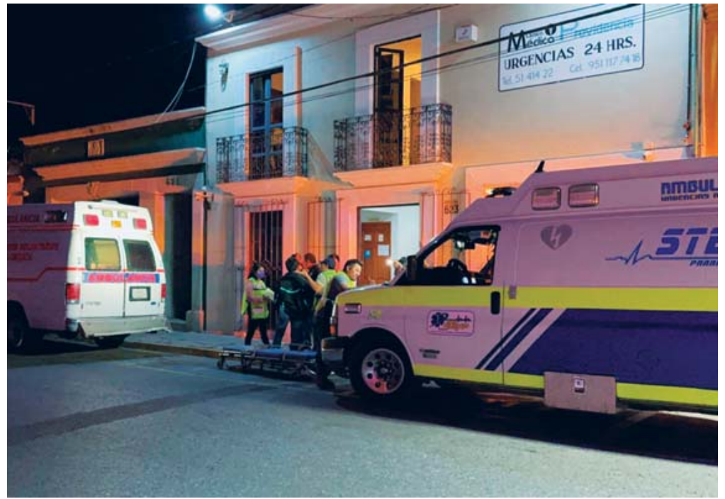
Una persona perdió la vida en la clínica a la que fue trasladada tras el accidente.