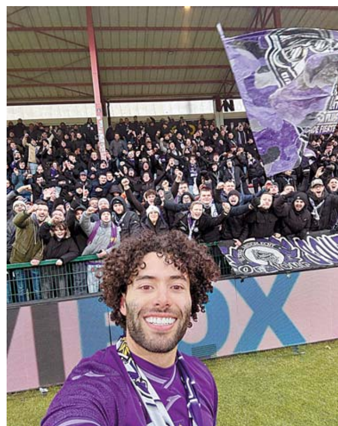
Tras anotar, el mexicano fue coreado por los aficionados de los púrpuras.

Las acciones del partido llevaron a ambos equipos a irse al vestidor sin hacerse daño, pero en el minuto 62, Thorgan Hazard tomó