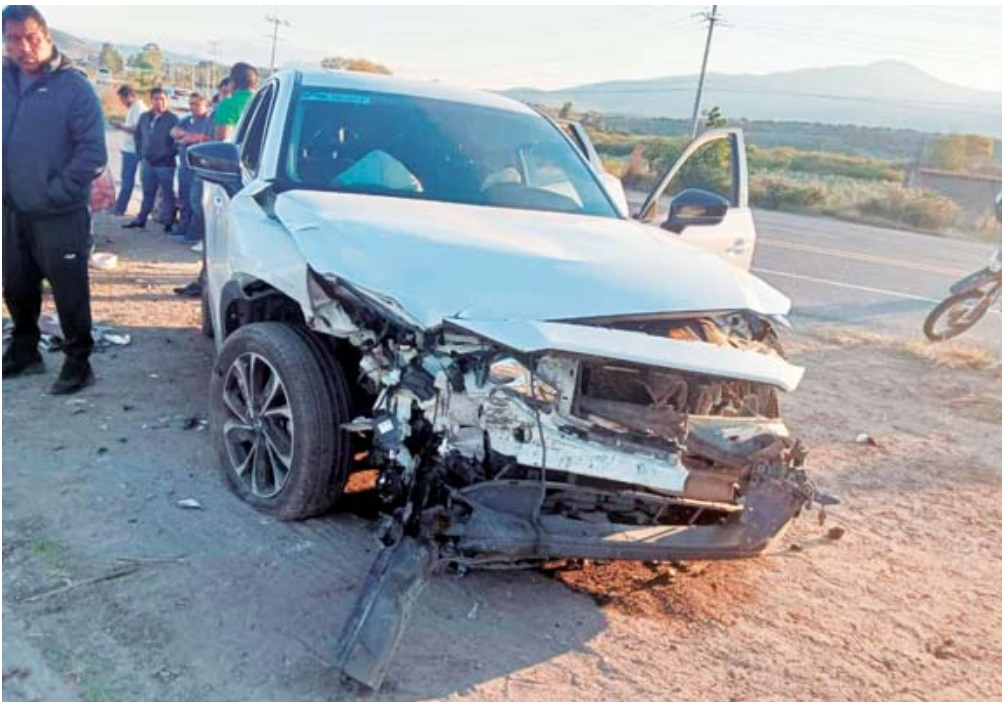
Los lesionados fueron atendidos por paramédicos de bomberos, Protección Civil y el grupo STEAP.