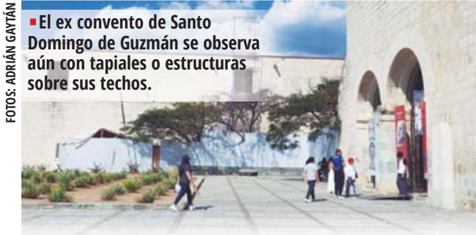
El ex convento de Santo Domingo de Guzmán se observa aún con tapias o estructuras sobre sus techos.