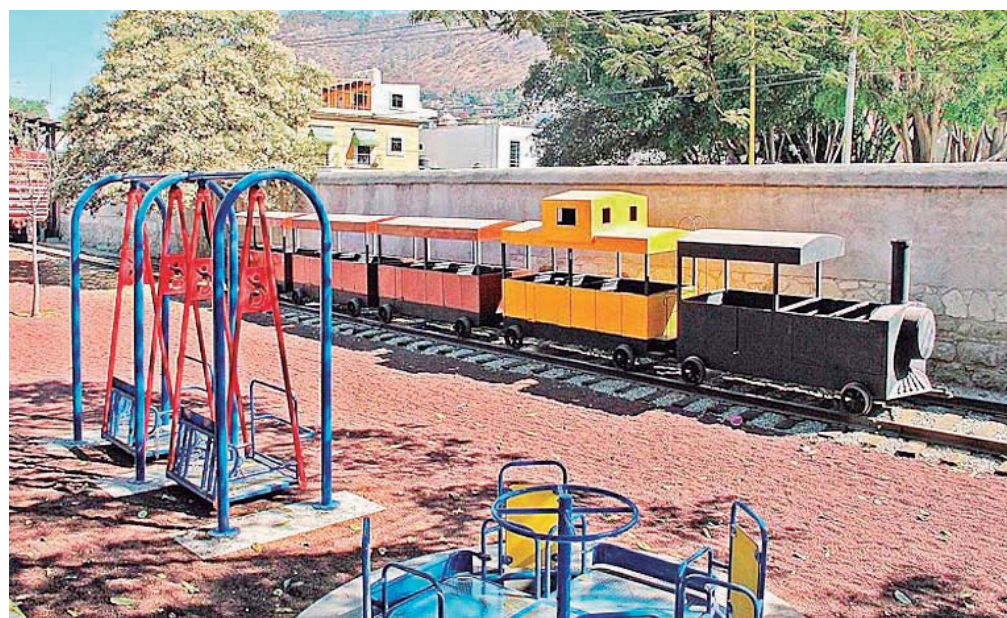
El Museo Infantil de Oaxaca opera ahí desde el 3 de marzo de 2017.

Fue el 30 de diciembre de 2011 cuando se formalizó ante notario público la compra-venta mediante la cual el municipio de Oaxaca de Juárez adquirió una gran parte del terreno de la antigua estación, tras la terminación del servicio del ferrocarril.