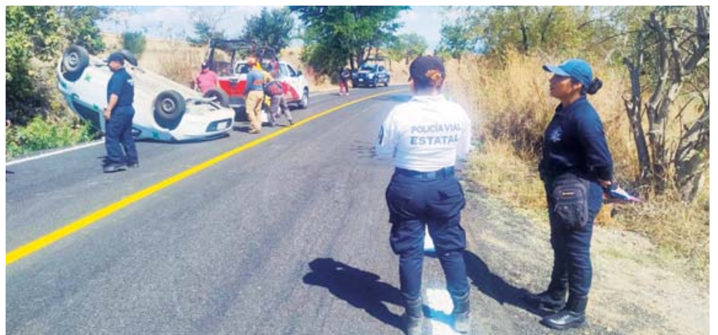
No se tienen datos sobre la identidad del conductor ni su estado de salud.