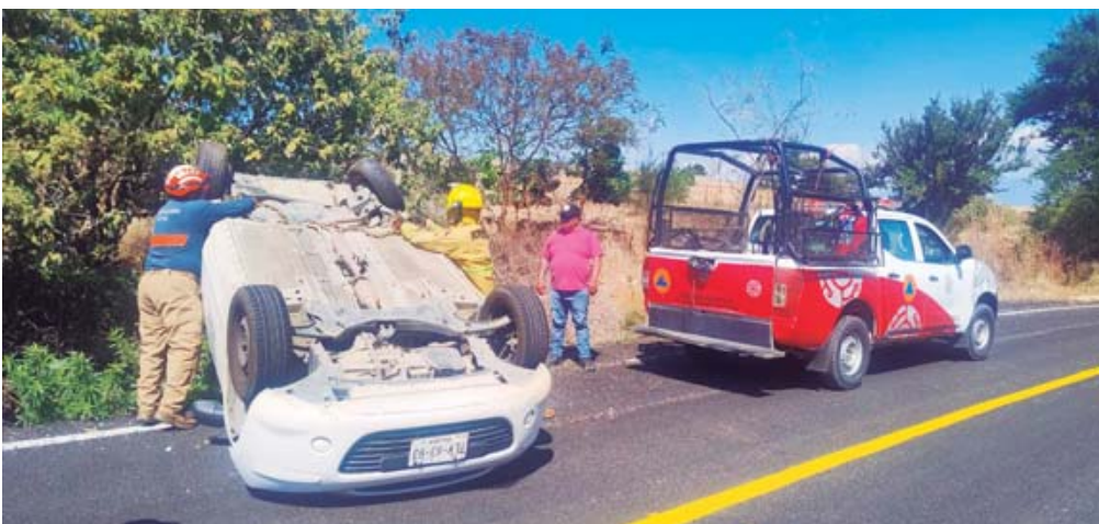
Un automóvil terminó volcado el domingo en jurisdicción de la Villa de Zaachila.

Las autoridades municipales y estatales reiteran el llamado a la población para conducir con precaución, especialmente en carreteras secundarias como la de La Lobera, donde el estado del camino y las curvas pueden representar un riesgo adicional.