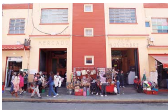
Uno de los accesos del Mercado 20 de Noviembre.