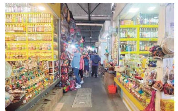
Locatarios afirman que las ventas bajaron en la cuesta de enero.