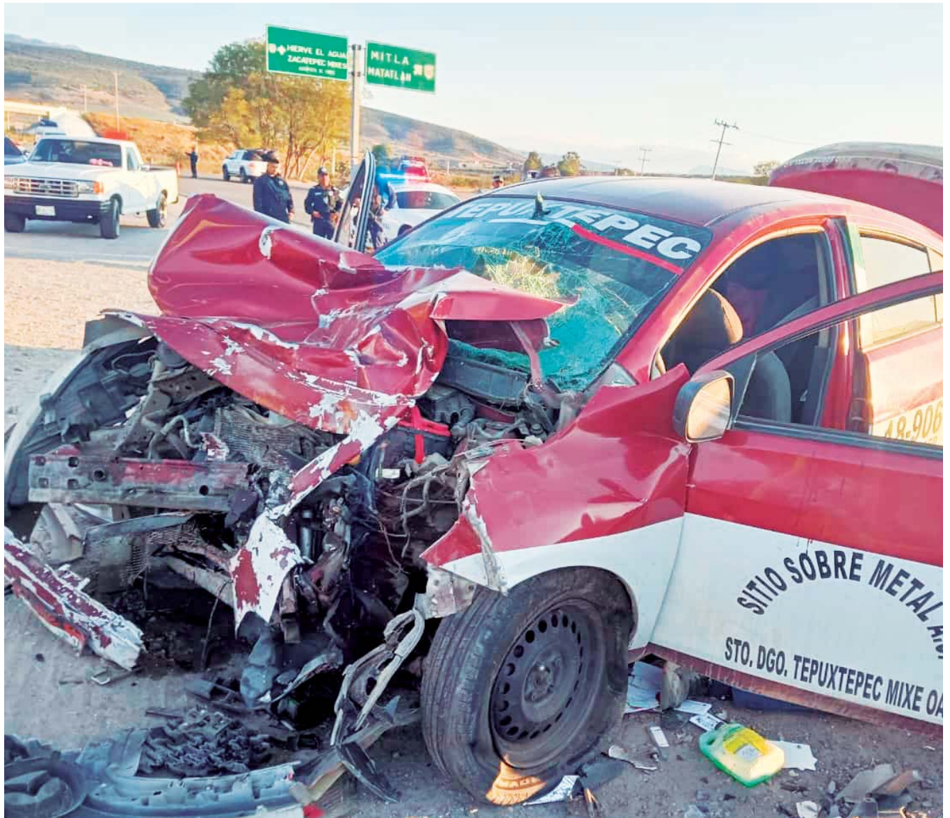
Un choque frontal entre un taxi y una camioneta sobre la Carretera Federal 190 dejó dos personas muertas y cuatro más lesionadas.

Las autoridades han manifestado su preocupación ante el incremento de accidentes en los