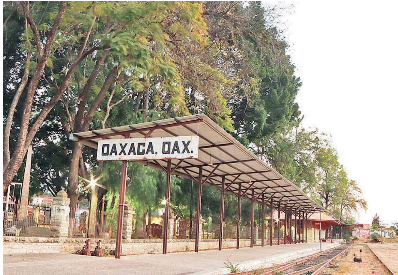
El comodato o préstamo de la antigua Estación del Ferrocarril Mexicano del Sur concluyó el pasado 31 de diciembre.

Sin embargo, hasta ahora el ayuntamiento no ha informado si ya se renovó el contrato o si se celebró otro tipo de relación para la continuidad de su uso. Además de que la aprobación de un nuevo comodato o su renovación no se ha presentado ante el cabildo, como sucedió en la gestión de Martínez Neri, en la que se tuvo que some-