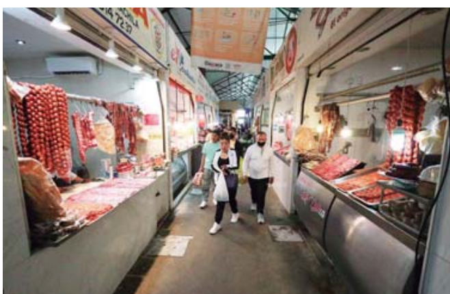
La afluencia en los mercados del centro ha disminuido.

Pero poco a poco, y aun con la baja afluencia de visitantes que se da después de las temporadas vacacionales, los pasillos de este mercado y el contiguo, el Benito Juárez, recibían a familias, grupos de amigos y otros visitantes locales o nacionales. Incluso algunos extranjeros que prefieren conocer la ciudad en otras fechas de menor afluencia.