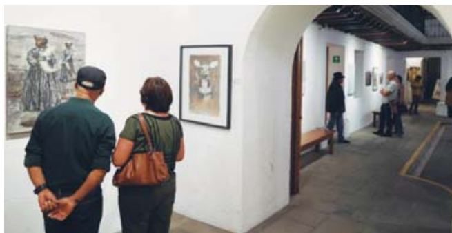
Mariés Mediola realiza un registro gráfico de la realidad de un mundo caótico, globalizado, de alta velocidad en la información.

“Ellos son referentes y amorosa compañía, guías y maestros involuntarios, pero también muy lamentablemente y muy a menudo son objetos de nuestra crueldad y abuso, no solo porque los asesinamos para comerlos, sino también por esa obsesiva intensidad de ‘humanizarlos’ distorsionando la necesaria concepción respetuosa de su naturaleza”.