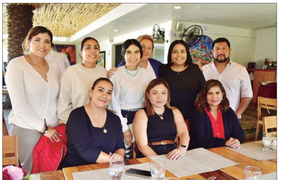
Los padres orgullosos compartieron sus experiencias mientras disfrutaban un rico desayuno.