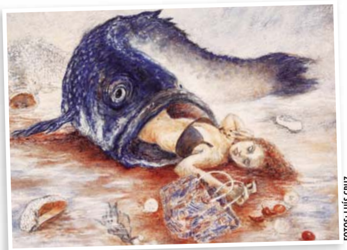
La artista describe también la relación de los seres humanos con los animales.

Con esta idea describió su intención de que el espectador guarde en su memoria estas imá-