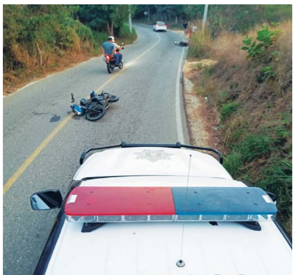
Los lesionados fueron trasladados a bordo de la ambulancia de Bomberos de San Isidro al hospital de Pochutla.

En cuanto a los detalles del accidente, las autoridades siguen recabando información. Se espera que en las próximas horas se dé un parte oficial con los resultados de la investigación y el estado de los lesionados.