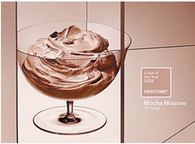
El tono PANTONE 17-1230 Mocha Mousse es el color de este 2025.

Una de las mayores ventajas de la cangurera mujer es su capacidad para brindar comodidad sin sacrificar el estilo. La gama de diseños disponibles permite a cada mujer encontrar la cangurera que se adapte perfectamente