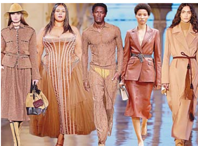
También se verá en las pasarelas de moda y maquillaje.

un nivel de indulgencia reflexiva. Sofisticado y exuberante, pero al mismo tiempo un clásico sin pretensiones, el PANTONE 17-1230 Mocha Mousse amplía nuestra percepción de los marrones como tonos humildes y conectados a la tierra para inspirar motivación y lujo. Impregnado de sutil elegancia y refinamiento terrenal, PANTONE 17-1230 Mocha Mousse presenta un toque de glamour discreto y de buen gusto". Además, es un tono versátil infundido con sofisticación inherente y refinamiento terroso, crea una base cromática fuerte, complementando diversas aplicaciones, a través del diseño. Este color nos inspira para crear experiencias que aumenten el confort y el bienestar personal. Desde caprichos dulces hasta paseos por la naturaleza, la indulgencia de los placeres sencillos que también podemos regalar y compartir con los demás.