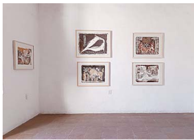
La gráfica fue una técnica que el artista y activista exploró constantemente.

tantemente y que "su formación comenzó cuando llegó a vivir a la ciudad de Oaxaca, en la década de los 50 del siglo pasado". Además de que "su interés por esta técnica lo llevó a fundar, en 1988, el Instituto de Artes Gráficas de Oaxaca (IAGO)".