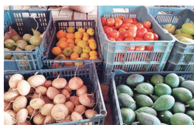
El "Mercadito de frescos", una iniciativa para promover la agricultura libre de tóxicos.

Al llegar a Oaxaca, cuenta que se percató que los principales cultivos en los valles centrales son de maíz y alfalfa para consumo de los animales y una mínima parte para consumo humano. A través del préstamo de un terreno en San Agustín Etla, empezaron sus pruebas logran-