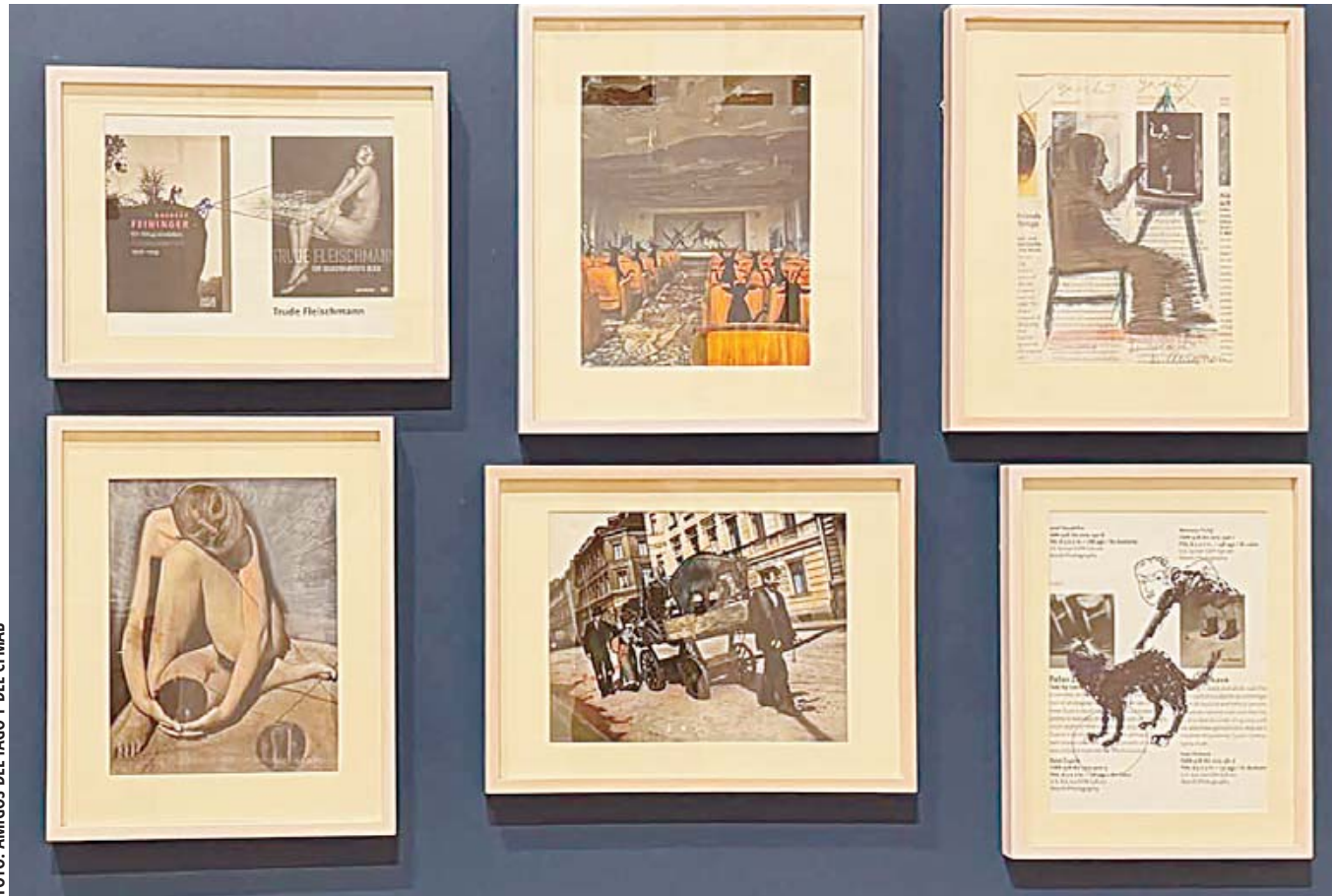
La exposición "Lu'biaani: Francisco Toledo y la fotografía" están en la galería Polivalente de la Universidad de Guanajuato.

Sobre tales exposiciones, la asociación civil Amigos del Instituto de Artes Gráficas de Oaxaca y del Centro Fotográfico Manuel Álvarez Bravo señala que la gráfica fue una técnica que el artista y activista exploró cons-