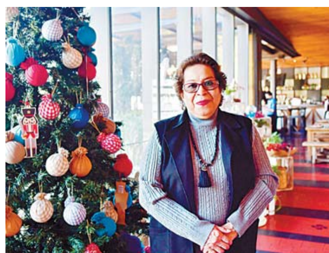
La festejada lució radiante en su día especial.

Las bellas damas pasaron un momento muy agradable al compartir anécdotas y recuerdos que han fortalecido su amistad por años, a la