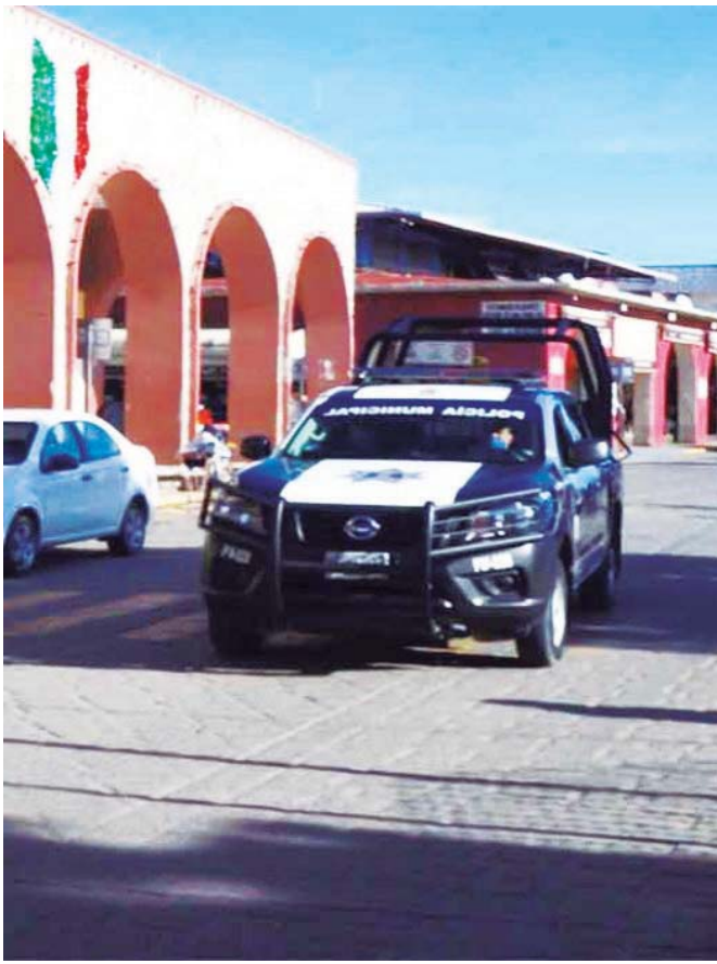
La patrulla afectada recibió un golpe a la altura de los tubulares traseros del lado izquierdo.