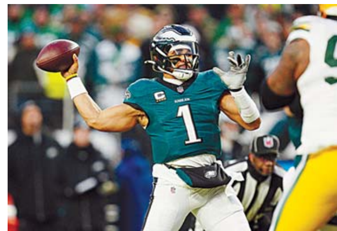
Hurts lanzó sin problemas en su regreso después de tres semanas de ausencia por una conmoción cerebral.

so después de tres semanas de ausencia por una conmoción cerebral en diciembre. Comenzó fuerte, seis pases completos consecutivos para abrir el juego, y mantuvo a raya a los Packers con un pase de anotación de 24 yardas a Goedert en el tercer cuarto que que-