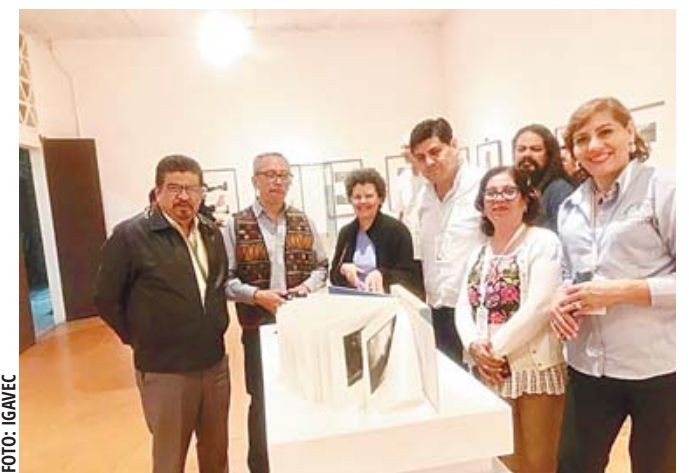
Este mes, el MureH cumple casi tres décadas de su creación.

El jueves 23 de enero, se llevará a cabo la conferencia "Continuidad cultural en los códices del Nuu Savi" y proyección del documental Nii Nuu'u: Pieles Sagradas. El viernes 24 de enero inauguración de la exposición gráfica colectiva "Las mil 1 estampas" con la participación de 109 artistas de 12 países ibe-