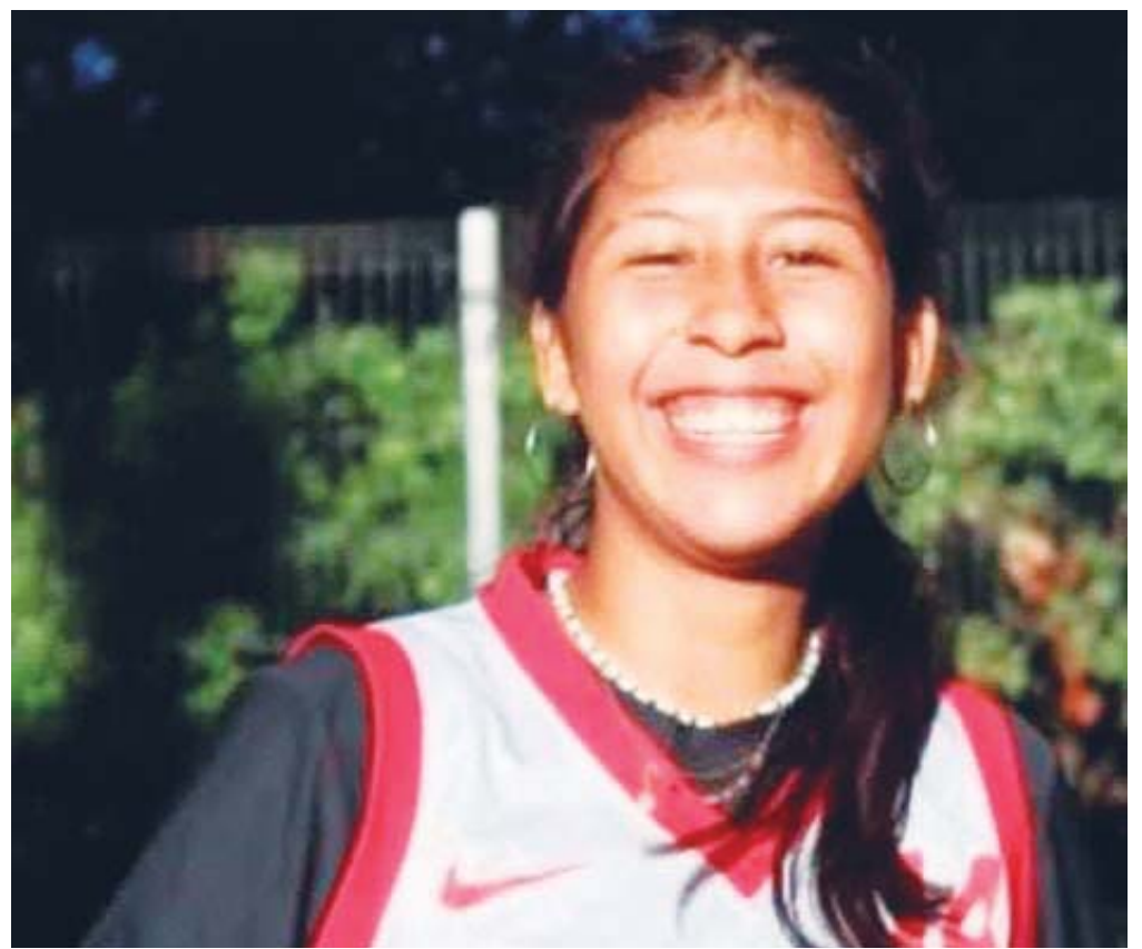
La fuga del responsable causó indignación entre los habitantes de Mixtequilla, pueblo natal de la víctima.