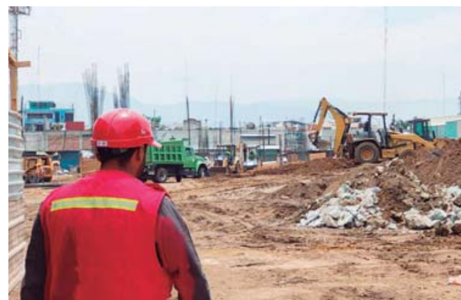
En algunas obras de la administración anterior, se mantienen los rezagos.

En todos los casos se trata de recursos federales y que corresponden al ramo general 33, con el que la Federación apoya a los municipios para este tipo de trabajos.