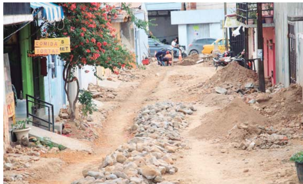
La administración del presidente municipal, Raymundo Chagoya Villanueva, planea para este año una inversión de 196 millones 662 mil 872.83 pesos en obra pública para la capital.

Sin embargo, al final el presupuesto para la obra