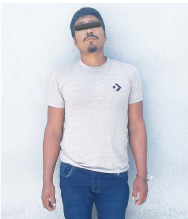
■ Tenían 19 bolsitas de plástico que contenían cristal.

Al respecto, la SSPC publicó que reafirma su compromiso con la seguridad y el combate al crimen en la región.