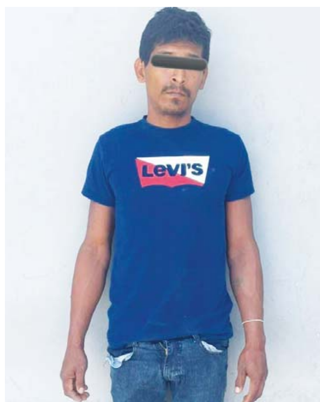
■ J.J.P.Q., de 28 años, y R.P.Q., de 36 años.