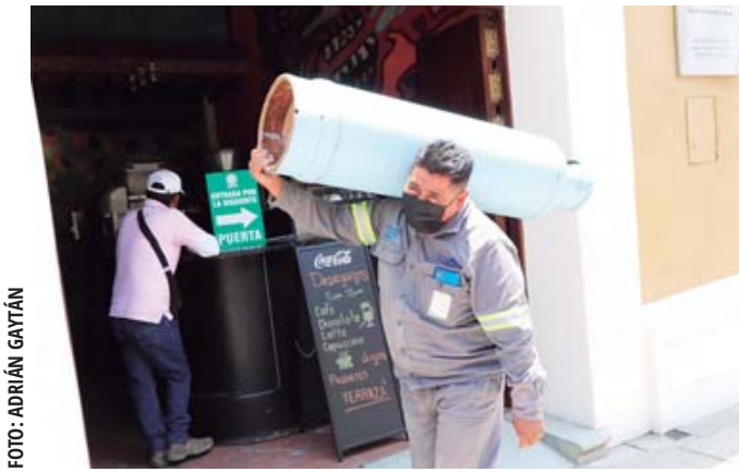
Se agudiza desabasto de Gas LP en comercios del Centro Histórico de Oaxaca.

Estiman entre 600 y 700 los negocios afectados en el Centro Histórico de Oaxaca; estiman de 10 a 25 días la normalización