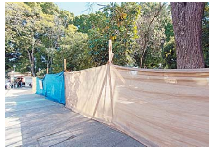
Obra en el Jardín Morelos

mente están en proceso la obra de rehabilitación del jardín Morelos y la repavimentación de la avenida Quinta Las Águilas, mismas que iniciaron en los últimos días de noviembre y se prevé que sigan en enero. Para estas obras, el concejal señaló en entrevista que la inversión es de casi 4 millones en el caso de la vialidad y de aproximadamente 2 millones para el jardín. La atención a la calle en los