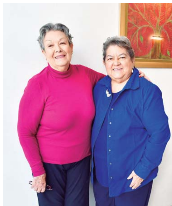
Sacaron el mejor provecho de esta amena reunión.

El lente de ESTILO Oaxaca captó este momento en donde rei-