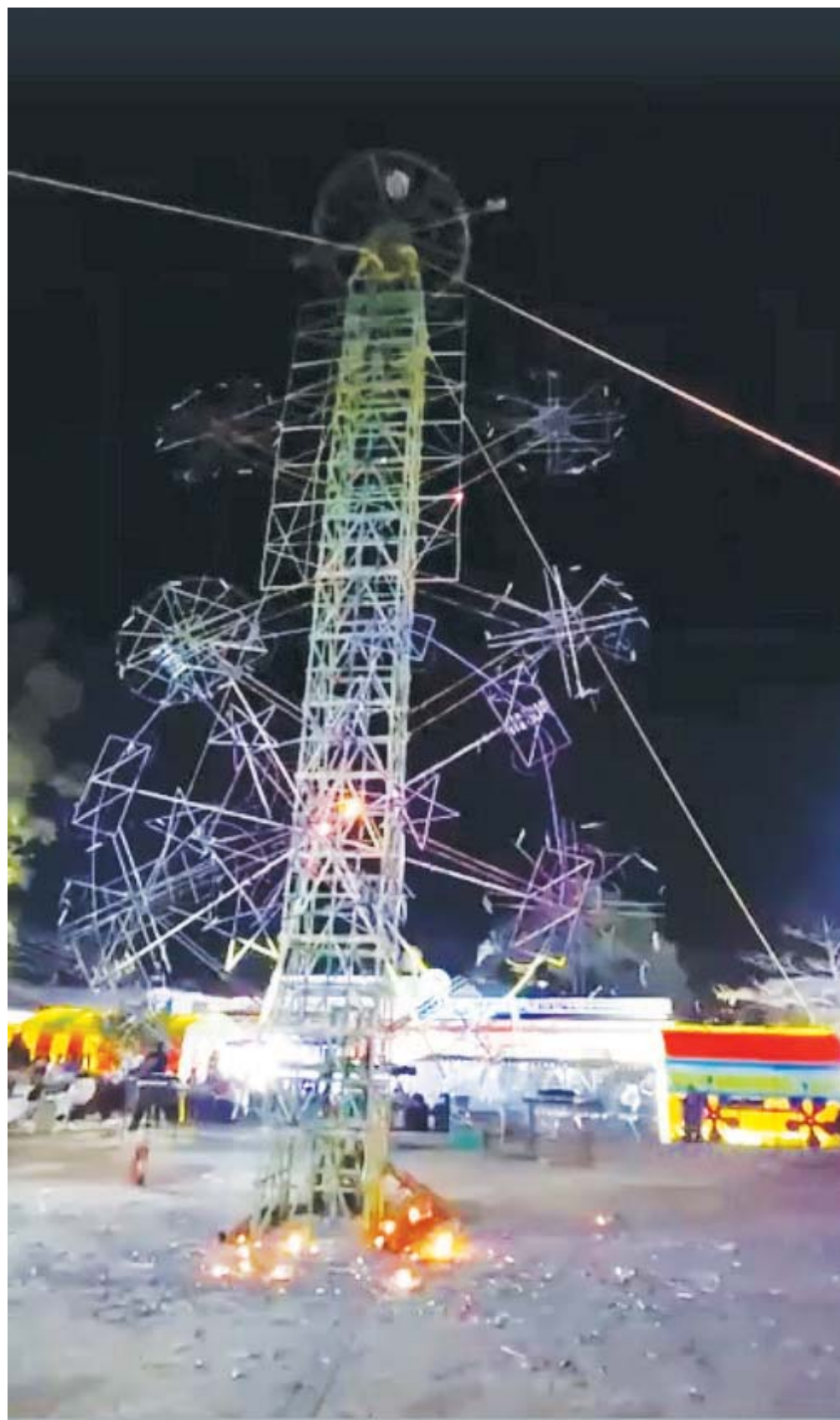
■ Afortunadamente, el incidente no dejó personas lesionadas ni daños materiales.

Ante esta situación, los ciudadanos pidieron que