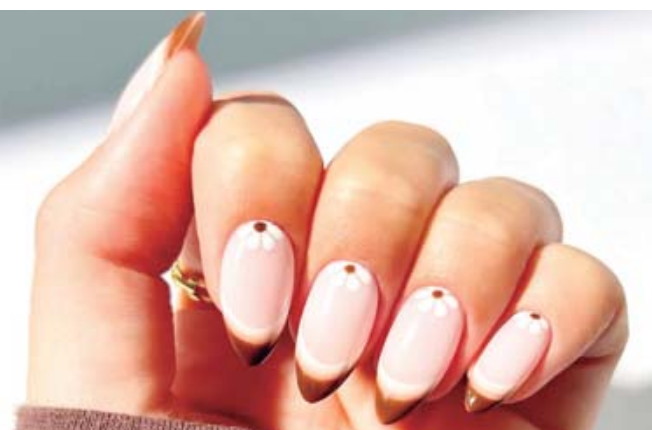
El éxito de unas uñas postizas duraderas comienza mucho antes de pegarlas.