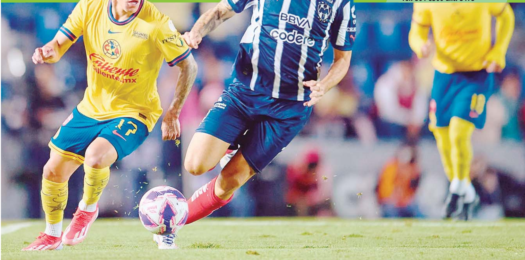
• Durante el Apertura 2024, América y Monterrey se encontraron en el Estadio Ciudad de los Deportes en octubre.

Este jueves, Rayados y Águilas disputarán el primer encuentro por el título del Torneo Apertura 2024