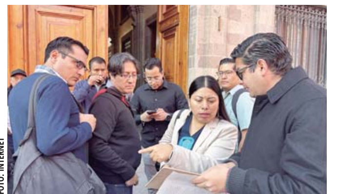
Dirigentes de la Sección 22, informan sobre los acuerdos que lograron con la Presidenta Claudia Sheinbaum.

El encuentro estuvo centrado en tres temas: dotación de uniformes, que la S-22 demanda que sea mediante depósito en efectivo en la Tarjeta Bienestar y el gobierno propone que sea en especie, el pago de prima de antigüedad a jubilados y el equipamiento tecnológico e inmobiliario a escuelas de educación básica de Oaxaca.