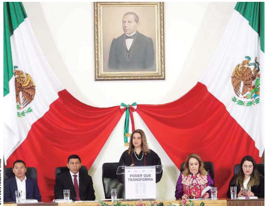
La magistrada presidenta del Poder Judicial del Estado, Berenice Ramírez Jiménez, rindió su Primer Informe de Resultados 2024.