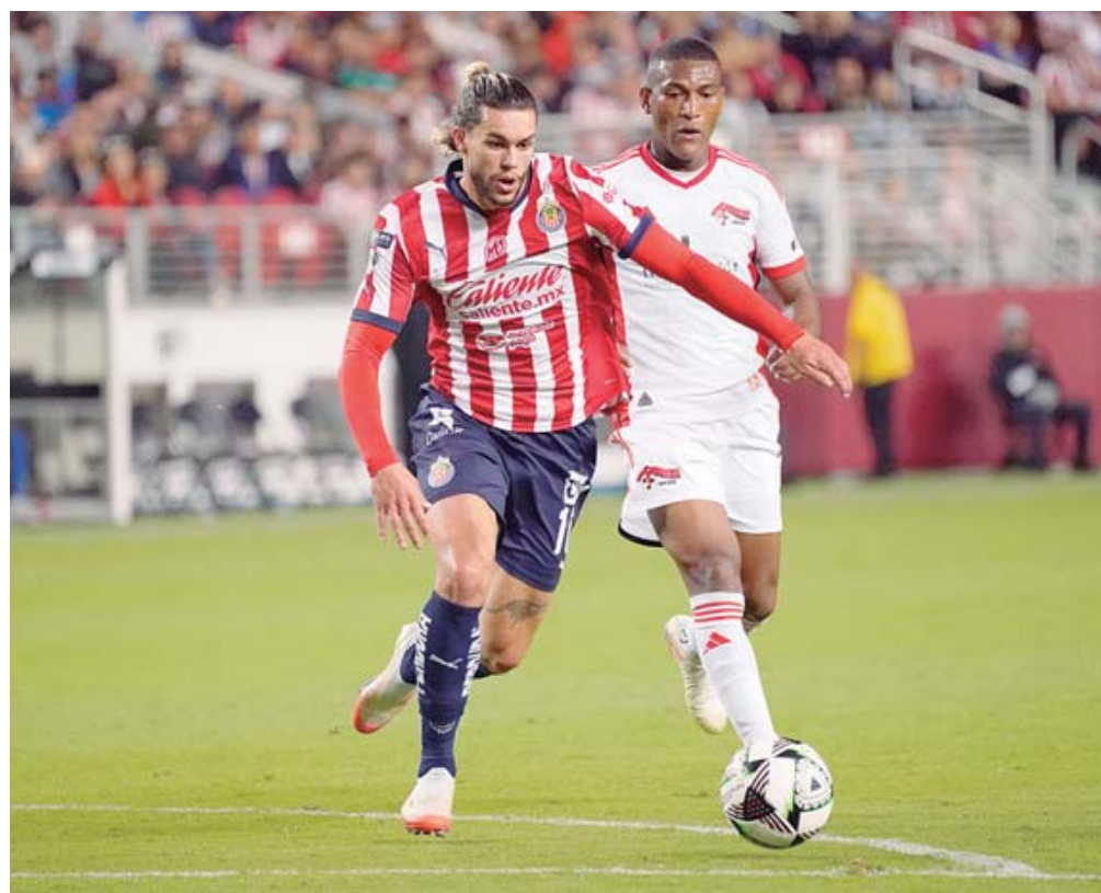
• El Guadalajara concentrará en la Ciudad Deportiva Tierra Adentro del Club Mineros, del 12 al 22 de diciembre.

El primer encuentro que sostendrá Chivas será ante Mineros de Zacate-