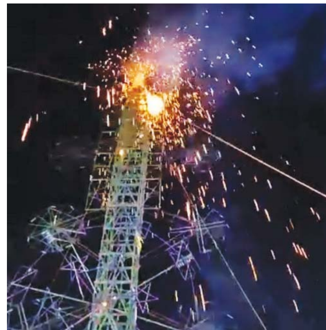
■ Los organizadores revisarán las medidas de seguridad para los próximos eventos.

Por su parte, los organizadores informaron que revisarán las medidas de seguridad para los próximos eventos, con el fin de evitar que se repitan incidentes similares y salvaguardar la integridad de quienes participan en estas festividades tradicionales.