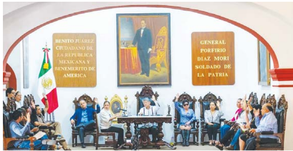
En sesión extraordinaria de cabildo del municipio de Oaxaca de Juárez, se aprobó el proyecto de iniciativa de Ley de Ingresos municipal para 2025.