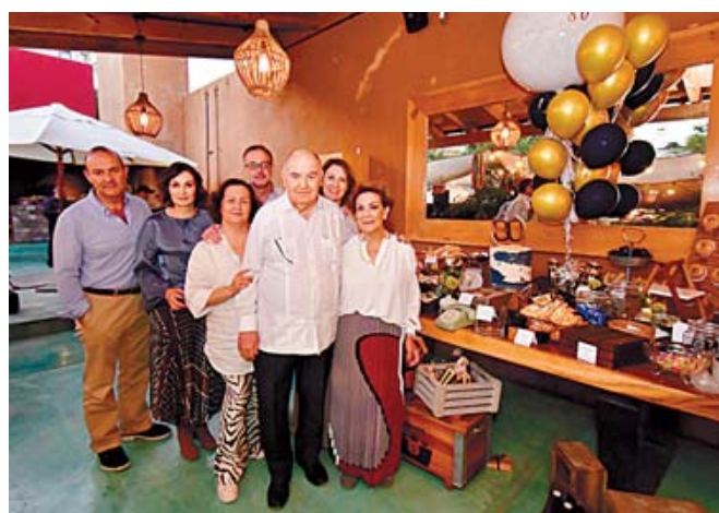
Sus seres queridos convirtieron esta celebración en una muy especial.