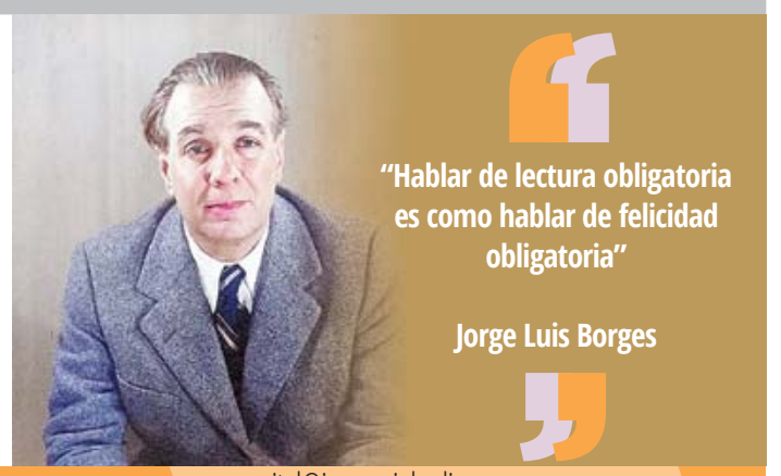
Jorge Luis Borges