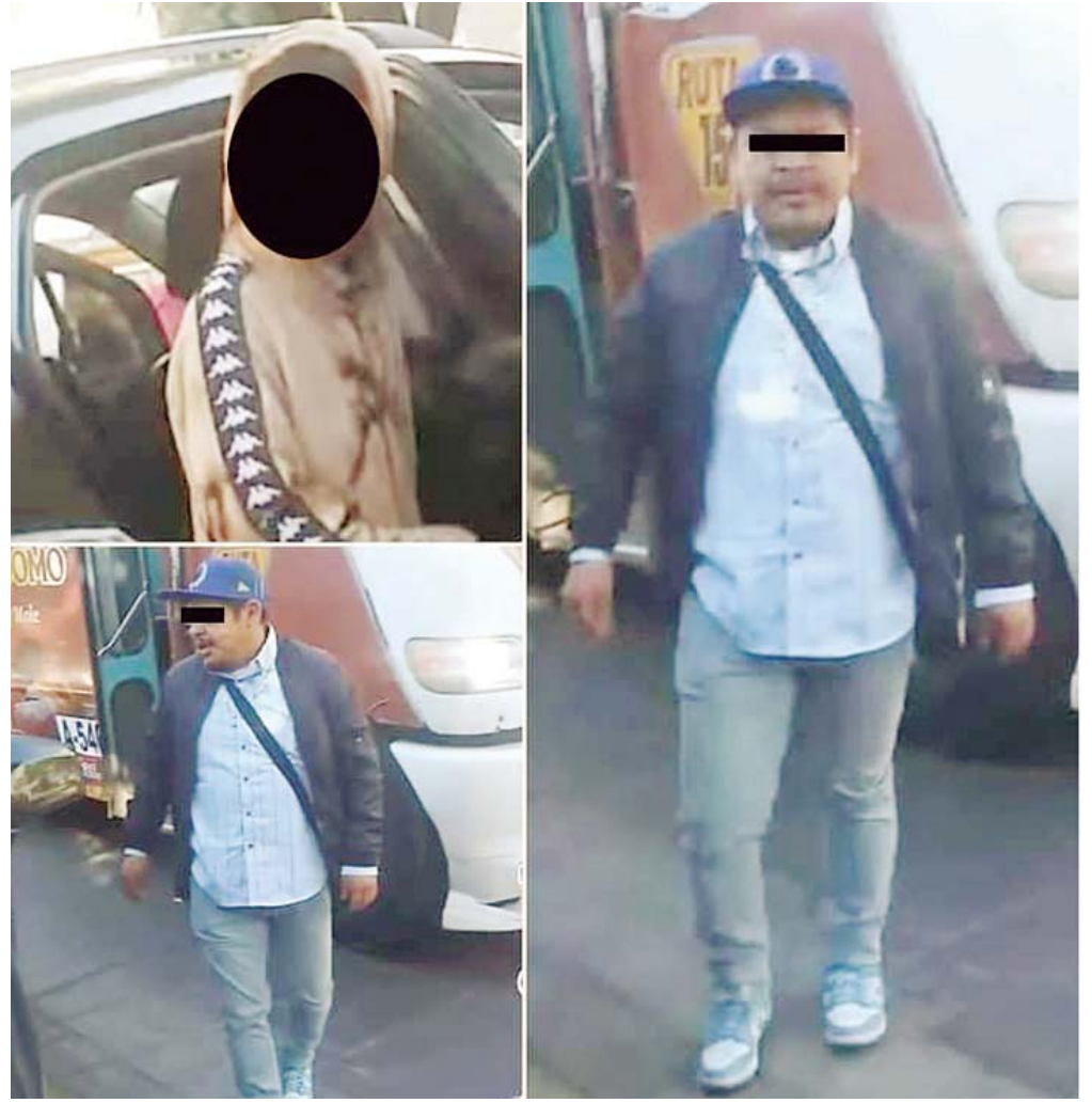
Tres sujetos, entre ellos un menor de edad, arremeten contra el hombre, golpeándolo de manera despiadada.

En un video que circula en redes sociales, se puede observar cómo los