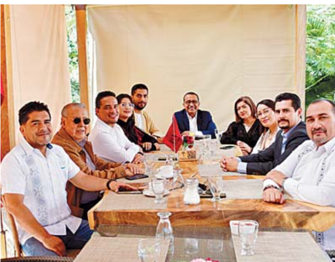
Los abogados disfrutaron de una amena mañana.