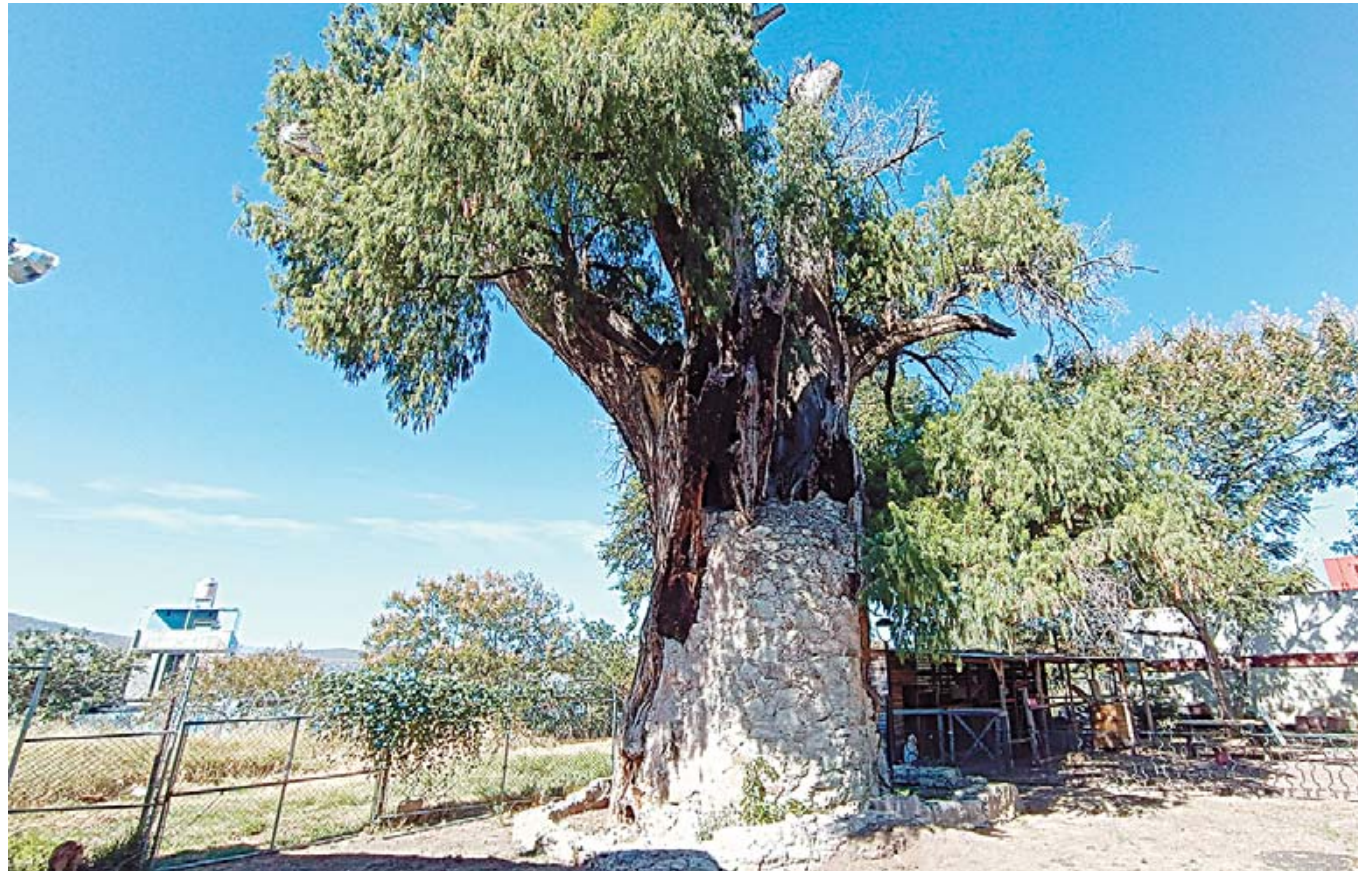
■ El árbol ha sido testigo de una estación que se convirtió en el Museo del Ferrocarril y donde funciona el Museo Infantil de Oaxaca.

“El cuidado de este árbol siempre ha representado un reto. Fue un árbol muy dañado por los años. Antes de que se construyera la estación del Ferrocarril llegaba el río y era un ambiente muy húmedo donde pudieron crecer árboles de este tipo que necesitan mucha agua”, detalla Saavedra. Sin embargo, tras desviar-