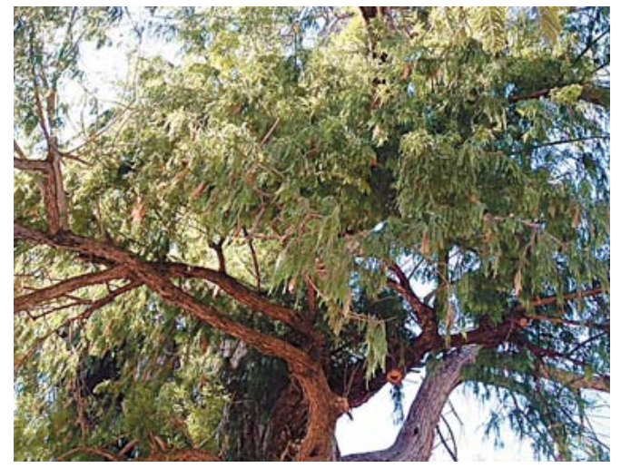
■ El ahuehuete donde opera el MIO es el segundo árbol más longevo del estado y el primero de la ciudad.

árboles notables y emblemáticos del estado de Oaxaca, publicado en el (2019), en la entidad existían 33 árboles clasificados como notables. De ellos, siete se localizaban en la capital, donde actualmente sobreviven seis: el ahuehuete y el higo