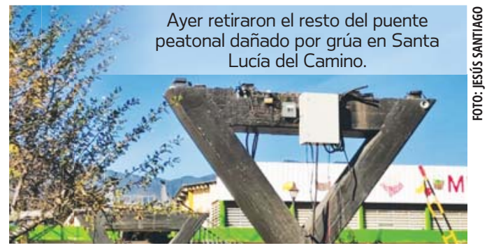
Ayer retiraron el resto del puente peatonal dañado por grúa en Santa Lucía del Camino.