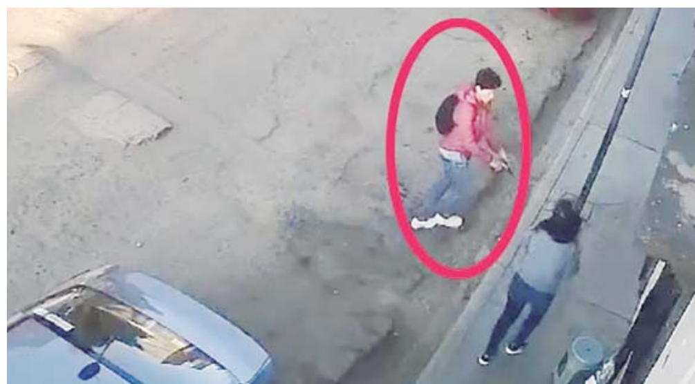
El hombre desenfundó una pistola, corta cartucho y amenaza a la víctima.

El hombre, que viste un pantalón de mezclilla y una chamarr roja, de forma repentina desenfundó una pistola, corta cartucho y amenaza a la víctima. En un par de segundos, despoja a la mujer de lo que parece ser un teléfono celular, y tras consumar el robo, huye rápidamente con rumbo desconocido. La mujer, visiblemente en shock, queda inmóvil, temerosa de ser agredida por el asaltante.