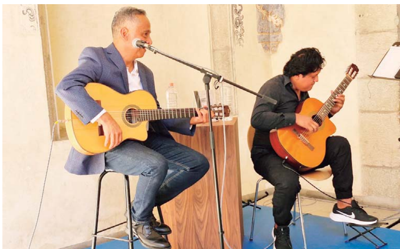
■ "Cáncer", "Luz de Luna", "Amuleto", "Seguiré mi viaje", "Alingo lingo", "Cancionero" y "Pinotepe" fueron algunos de los temas interpretados en el concierto.

Los 24 caprichos para violín son una de sus obras más conocidas y han servido de inspiración a numerosos compositores. Además del violín compuso música para mandolina, guitarra, viola y fagot. Destacan sus duetos para violín y guitarra y sus composiciones para cuarteto de cuerdas. Disfruta estos caprichos, son una auténtica joya musical, una caricia para el oído. ( https://youtu.be/3iTumyhuJd8 ).