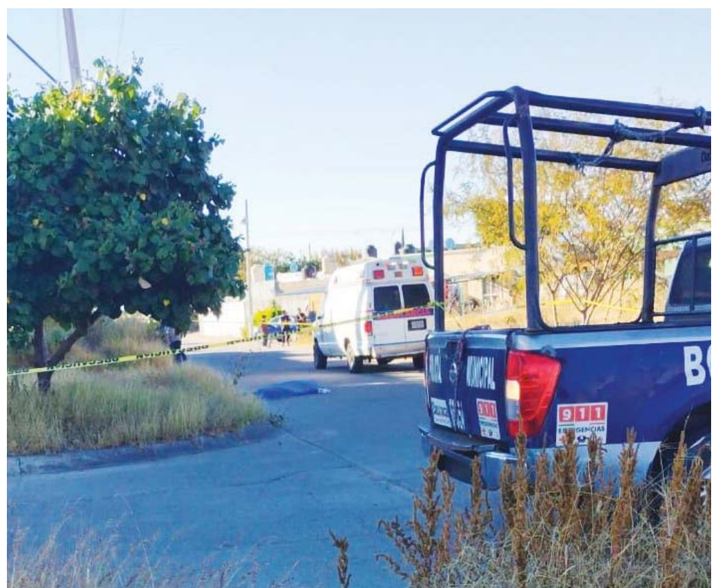
Personal médico intentó reanimar al afectado, pero ya no fue posible.

Hasta el momento se desconocen los generales del fallecido, así como la identidad del o los agresores, quienes escaparon del lugar.