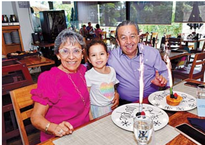
■ Celebraron su cumpleaños con su nieta.