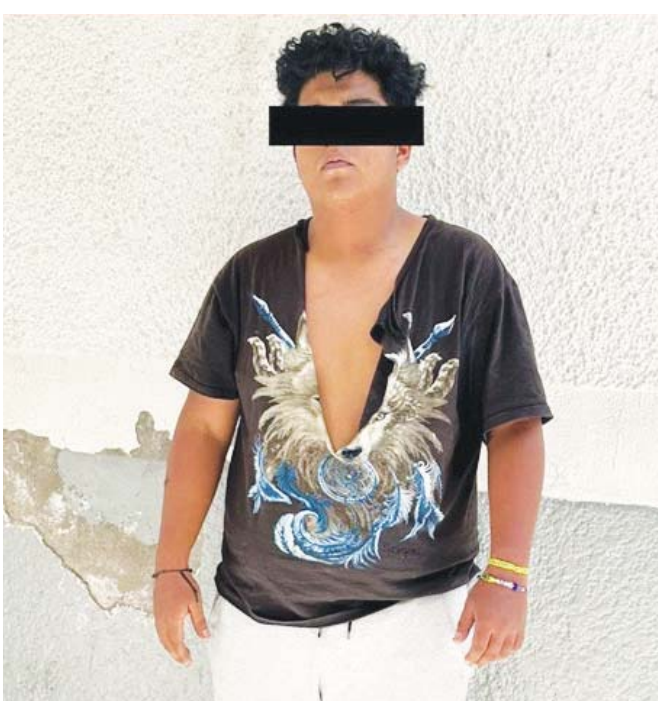
Portaban un arma de fuego calibre .22 sin el permiso correspondiente.