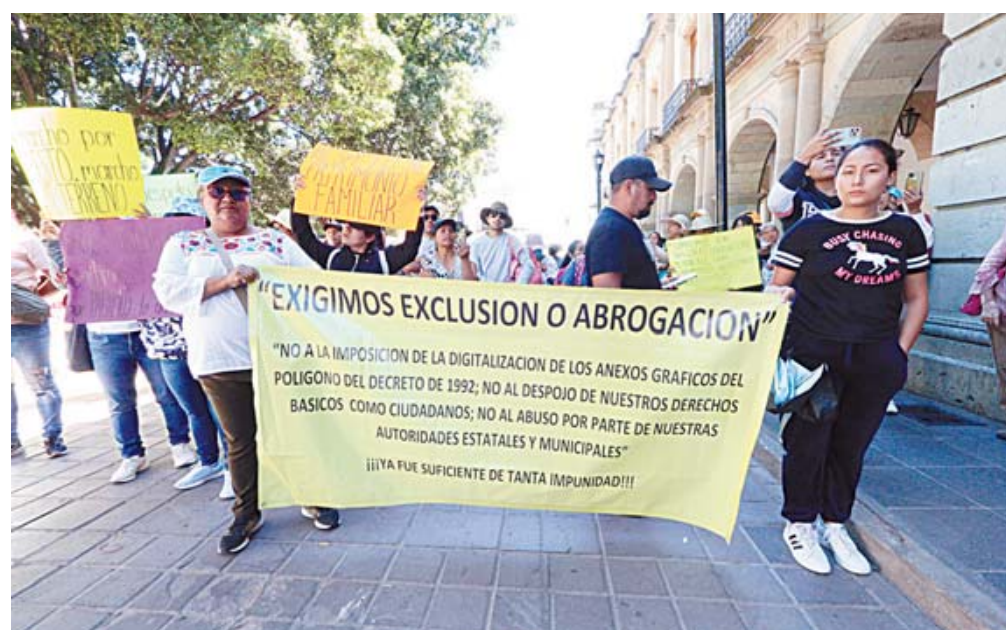
■ Colonos marchan para exigir la abrogación del decreto por el que se estableció como zona de reserva ecológica el Cerro del Crestón.

Asimismo, que dé marcha atrás a la ratificación de este decreto hecha en septiembre pasado con la