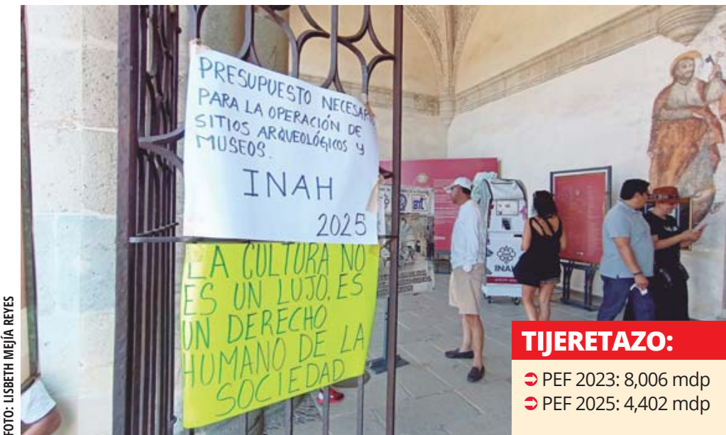
■ Con lonas y carteles en el Museo de las Culturas, integrantes del Sindicato Nacional de Trabajadores de la Secretaría de Cultura protestan en Oaxaca.

Luego de las últimas movilizaciones en la capital del país y de las protestas en el estado de Oaxaca en las que han denunciado el déficit presupuestal de los últimos años, sindicalizados de la Secretaría de Cultura federal, sector INAH Oaxaca, volvieron a manifestar su rechazo por la disminución del presupuesto.