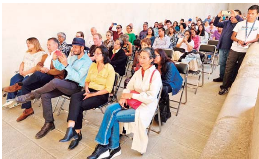
■ Los aplausos y los coros por parte del público marcaron la actividad.