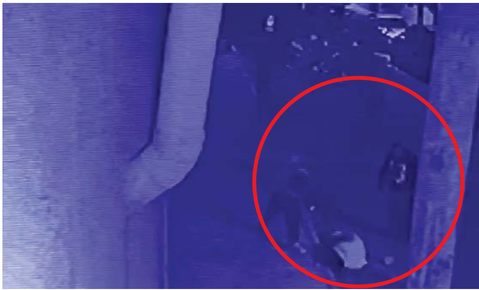
Una cámara de vigilancia captó el momento que le propinaron la golpiza al hombre.

Minutos después, al lugar arribaron, paramédicos voluntarios quienes lo trasladaron al Hospital Civil, donde quedó internado y su estado de salud se reportó como de gravedad.