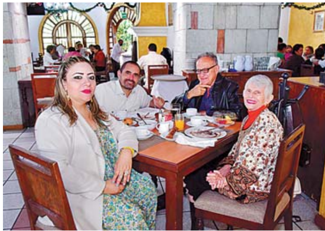
■ Un rico desayuno entre amigos.