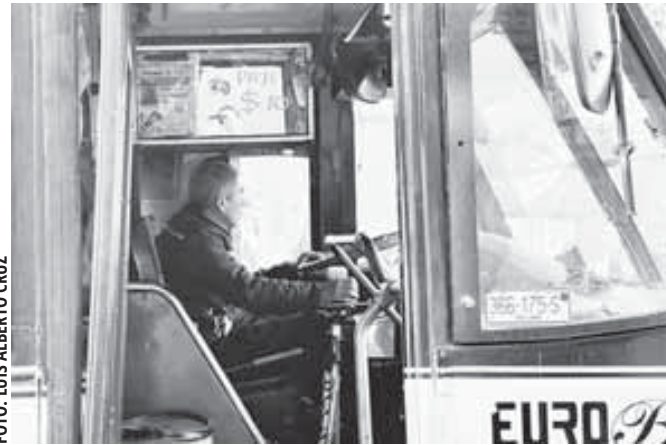
Al pulpo camionero no le alcanzó al menos para enviar imprimir cartulinas con la nueva tarifa; los choferes debieron colocar letreros hechos a mano.

“Ni modo, a pagar los 10 pesos”, fue el último lamento de una usuaria antes de subirse a un camión de la ruta Vigue-