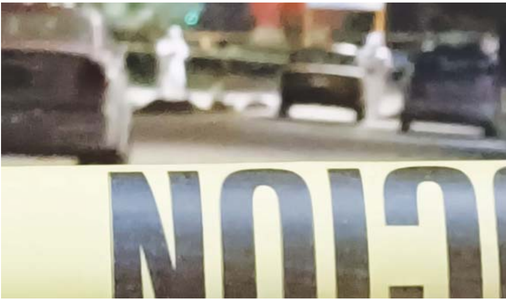
Personal de la Cruz Roja confirmó el fallecimiento de las víctimas, en el lugar se hallaron casquillos 9 milímetros.