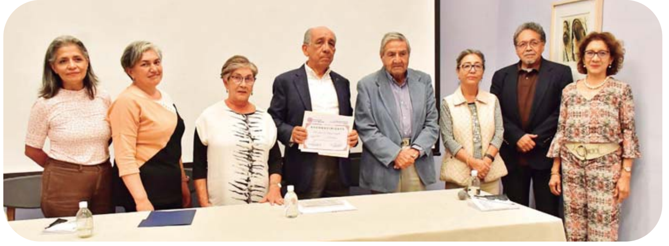
■ Integrantes del Seminario de Cultura Mexicana, le entregaron un reconocimiento.