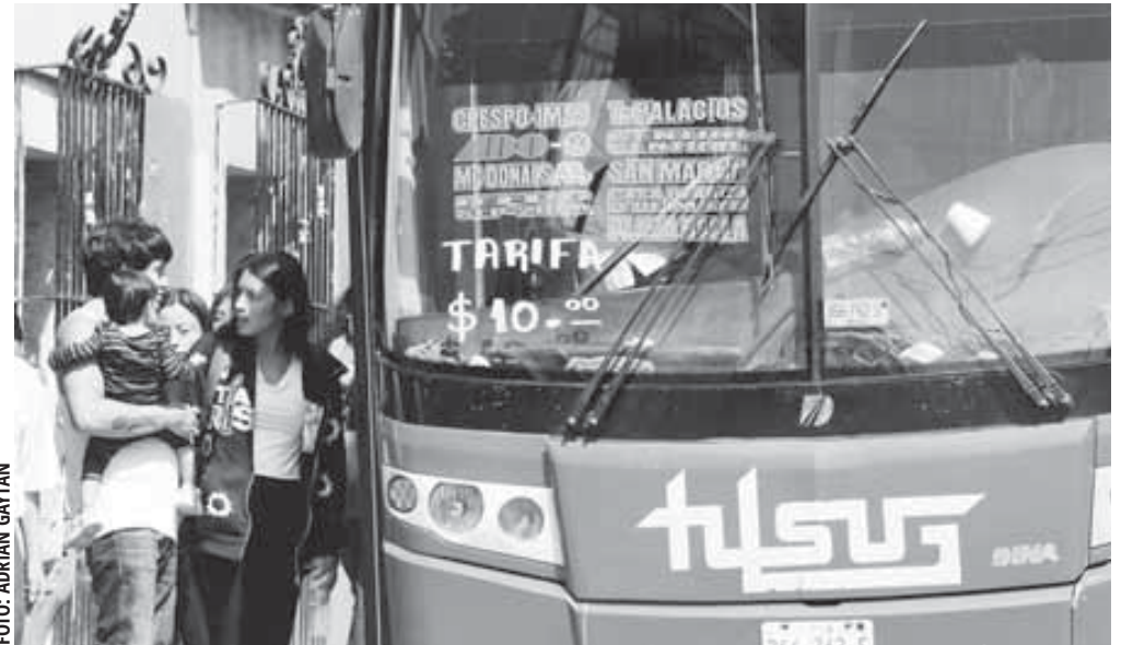
La única diferencia entre ayer y hoy es que se pagan 2 pesos más.

tó su compañera de viaje. Ya en pleno trayecto, el chisme entre las y los usuarios se enfocó en este tema del aumento del pasaje y de los últimos hechos de violencia que se han registrado en la Zona Metropolitana de Oaxaca (ZMO) como el asesinato de dos mujeres indígenas triquis y el asalto ocurrido en fechas recientes en una famosa pastelería.