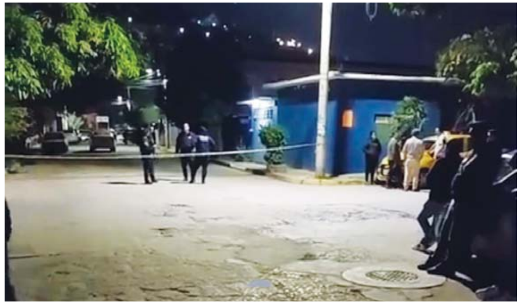
Personas que viajaban en motocicleta balearon a las mujeres al descender del taxi que las llevó a su hogar.