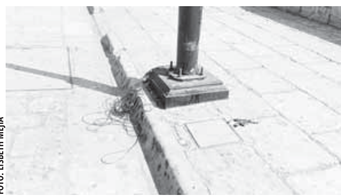
Cables de donde se tomaba energía eléctrica; los desperfectos dejados por los “ferieros”.

que decenas de pintacaritas ofrecieron sus servicios de caracterización y vendieron diademas entre el 30 de octubre y el 3 de noviembre. Además de que en la calle Gurrion permanecían un tapete de arena y tiras de plástico picado que instaló una organización para recordar a sus difuntos.