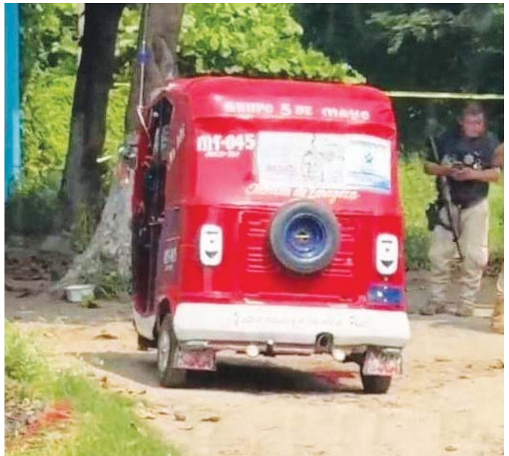
También se desempeñaba como guardia de seguridad privada de una tienda de la cadena Coppel.

Sin dale posibilidades de intervención a las autoridades ministeriales.