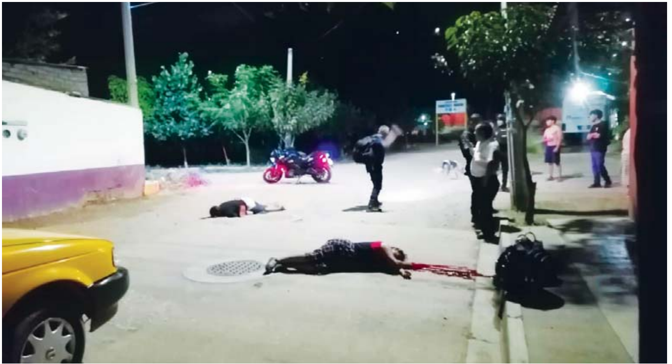
Fueron asesinadas cuando se dirigían a su domicilio en la colonia Unión de la capital oaxaqueña.

Las víctimas, de 48 y 38 años, no tenían vínculos con las disputas que afectan a los grupos en la región triqui.