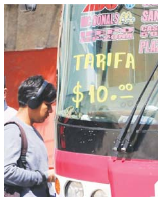
El tarifazo, estocada al bolsillo.