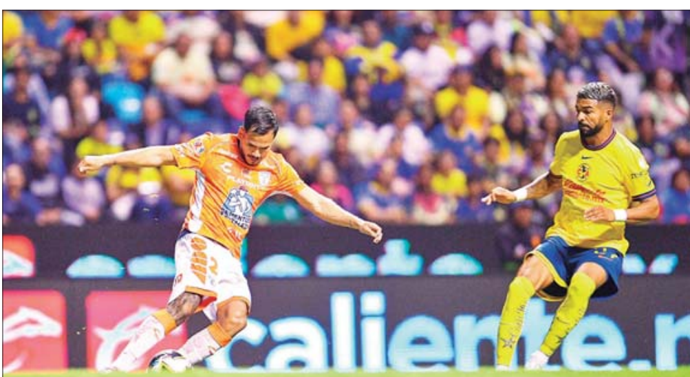
• La posición del América dependerá de su encuentro ante el Toluca en la próxima jornada.