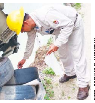
Fallida estrategia contra el dengue.

El Gobernador urgió la certificación de policías para abatir la problemática de inseguridad, por la cual también se inaugurará en breve la Universidad de seguridad y se fortalecerán los programas correspondientes. INFORMACIÓN 4A