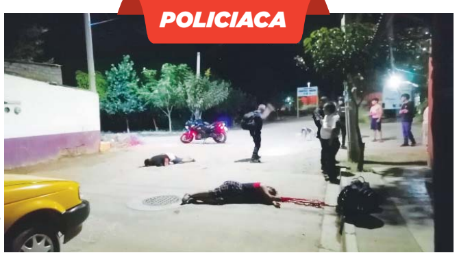
Los dos cuerpos de las mujeres quedaron en una de las calles de la colonia Unión.

En suma: la última administración demócrata deportó 59.3% más menores de edad oaxaqueños de su país que la temible administración comandada por el magante republicano. INFORMACIÓN 12A