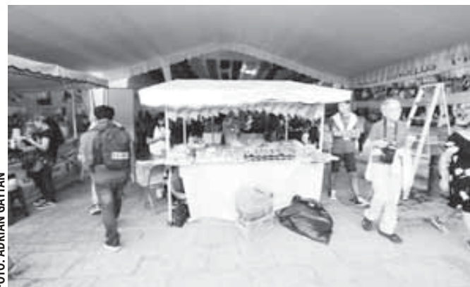
Expoferia durante la temporada de Día de Muertos.

Cables colgando de una luminaria fueron otros de los daños en la calle Macedonio Alcalá, en la