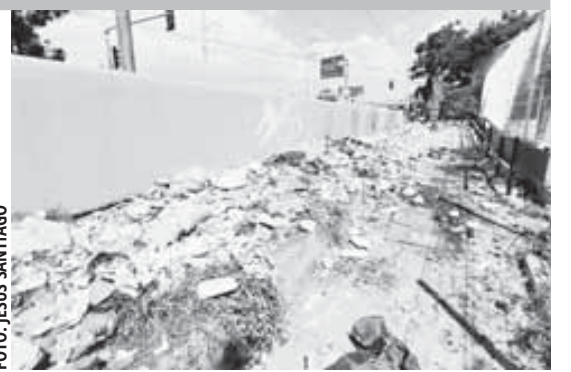
Basurero en inmediaciones del Parque del Amor.

Diseñador: Juan Manuel RODRÍGUEZ SÁNCHEZ