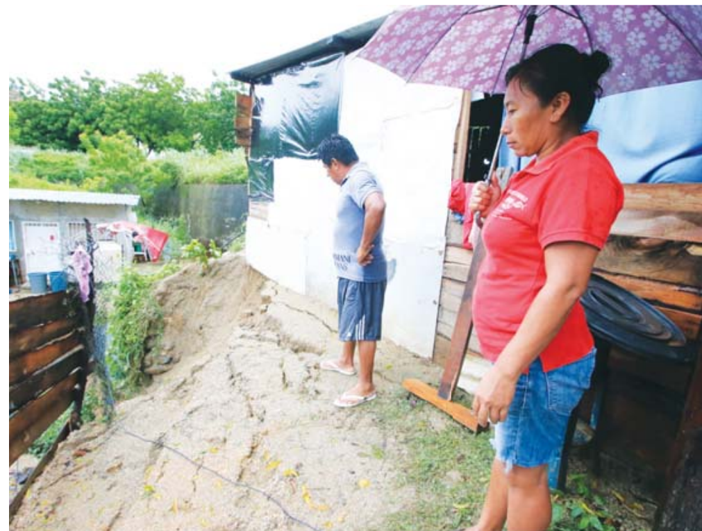
El gobierno federal entregará un primer apoyo por 8 mil pesos a cada familia damnificada por el huracán John, en la región de la Costa.

Luego de las lluvias intensas que dejó el huracán John en el estado de Oaxaca, al menos 174 municipios ubicados en las regiones de la Costa, Sierra Sur y la Mixteca, tramitaron su Declaratoria de Desastre Natural para acceder a los apoyos del Gobierno Federal. Asimismo, Oaxaca estará en el censo que realizará el gobierno federal a través de la Secretaría de Bienestar, casa por casa, para apoyar a los damnificados por las inundaciones que dejó el huracán John. A partir de este censo, darán un apoyo de 8 mil pesos y después, una