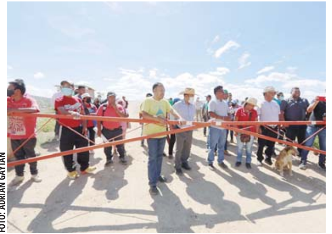
El cierre definitivo del basurero de Zaachila el 8 de octubre de 2022.

“Habíamos calculado una partida por el orden de 600 millones de pesos, inversión grandísima que hemos dicho siempre que si hubiéramos tenido ese dinero a la mano se habrían hecho muchísimas cosas más. Pero nos tocó eso,