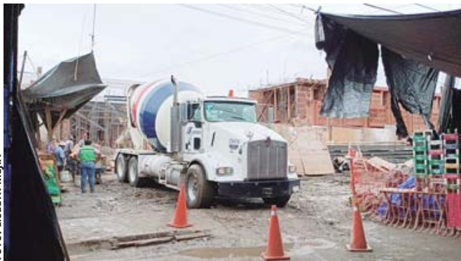
Las obras en la Central de Abasto.

dependencia se comprometieron a que en los últimos días de este mes ya se concluya los trabajos, mismos que hasta septiembre se estimaba con un avance del 80 por ciento.