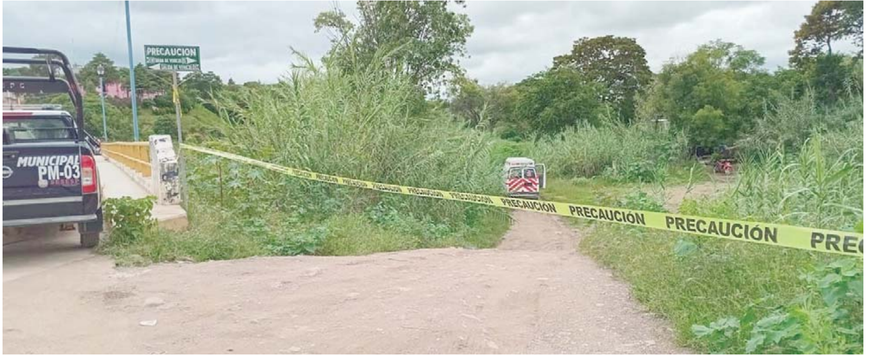
Equipos de peritos comenzaron a recabar evidencias en el área, con el fin de esclarecer lo sucedido.

La mañana de ayer, viernes, la tranquilidad de la comunidad de Miahuatlán de Porfirio Díaz se vio interrumpida por un hallazgo trágico: el cuerpo de una mujer, de aproximadamente 25 años de edad, fue encontrado en el "Puente de La Juquilita". Este suceso ha generado preocupación y conmoción entre los habitantes de la zona, quienes buscan respuestas sobre las circunstancias de este hecho.