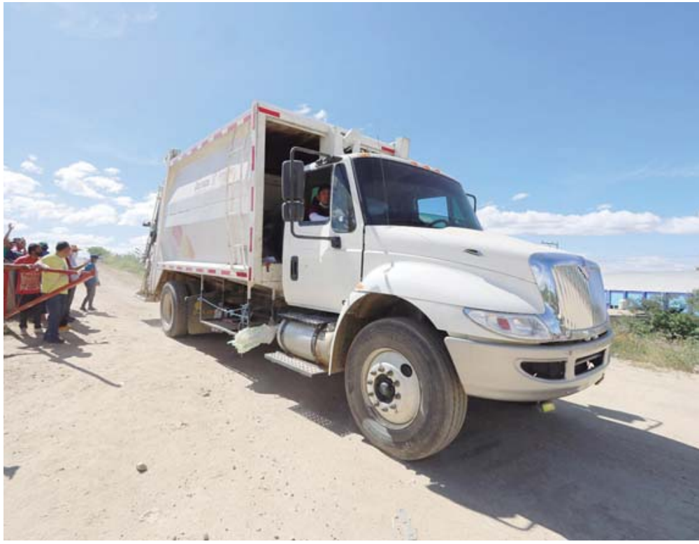
El último camión que llegó al tiradero municipal.

La crisis estalló tras el cierre definitivo del basurero municipal de Oaxaca que operó en la Villa de Zaachila y por la falta de rellenos sanitarios