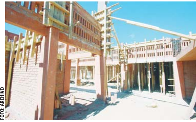
Así lucía la rehabilitación un año después de iniciados los trabajos.

En la zona del mercado, más conocido como Central de Abasto, la dependencia federal ha desarrollado otras obras como el Centro de Desarrollo Comunitario (CDC) y el Centro de Atención para el Desarrollo Infantil (CADI), en la administración municipal 2019-2021. Aunque en esos casos la actual administración que