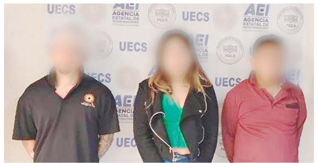
Los lamentables sucesos acontecieron el pasado 24 de septiembre en Tlacolula.