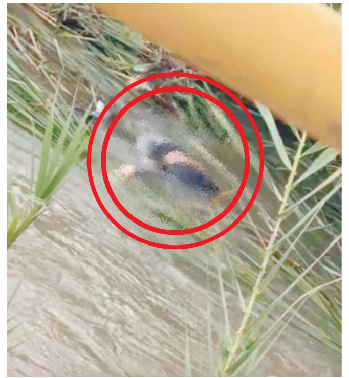
El cuerpo de una mujer, de aproximadamente 25 años de edad, fue encontrado.

Finalmente, la investigación avanza, y se espera que pronto se brinden más detalles que ayuden a arrojar luz sobre este trágico acontecimiento. La comunidad de Miahuatlán de Porfirio Díaz se mantiene atenta ante el desarrollo de los hechos, esperando que la verdad salga a la luz y que se haga justicia por la víctima.