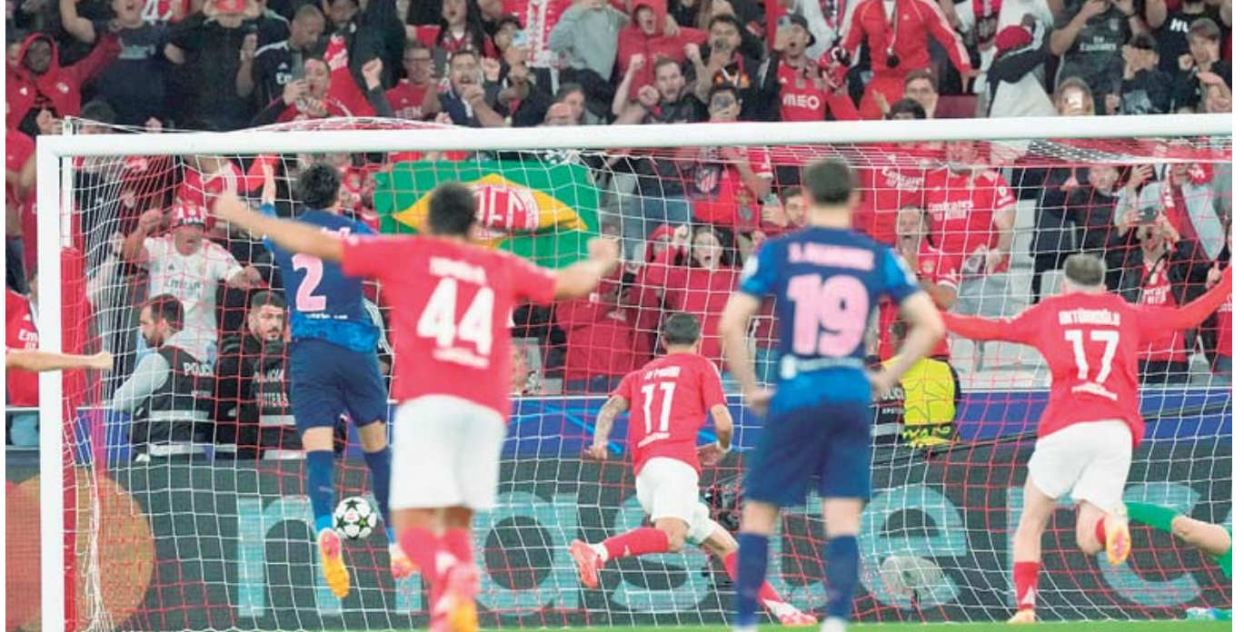
■ Ángel Di María marcó por la vía penal al minuto 52, el segundo tanto del Benfica.