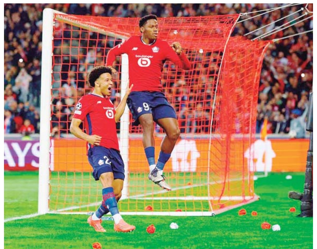
■ Lille hizo valer su localía y sorprendió al Real Madrid.

Pero con Modric y Mbappé poco cambió la situación del gigante blanco, hasta que llegó el arreón final. Entonces apareció el guardameta Lucas Chevalier, salvando un doble remate de Bellingham (85), un cabezazo de Antonio Rudiger (86) y otro de Arda Guler (90).