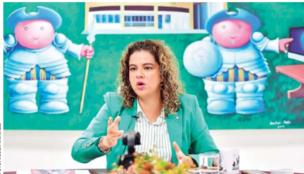
En entrevista, la magistrada presidenta del Tribunal Superior de Justicia del Estado, Berenice Ramírez Jiménez, se pronunció por un Poder Judicial más sensible e incluyente.

La magistrada presidenta del Tribunal Superior de Justicia del Estado (TSJE), Berenice Ramírez Jiménez, se pronunció por un Poder Judicial más sensible, humano, incluyente y con responsabilidad social, donde todas las voces sean escuchadas.