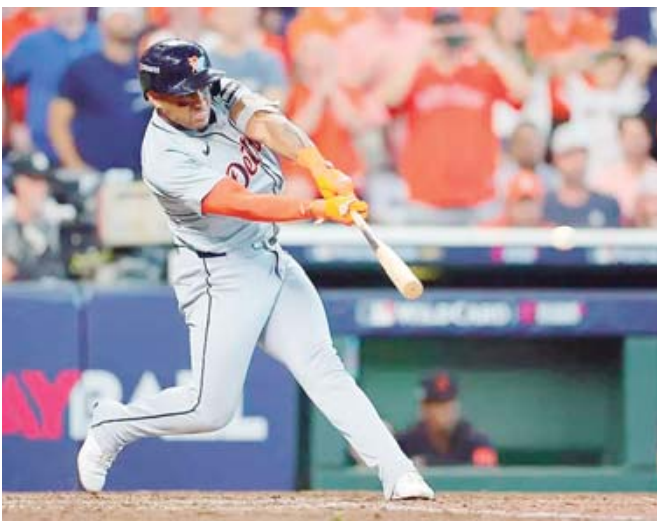
■ Los Tigres de Detroit regresaron a lo grande a playoffs.