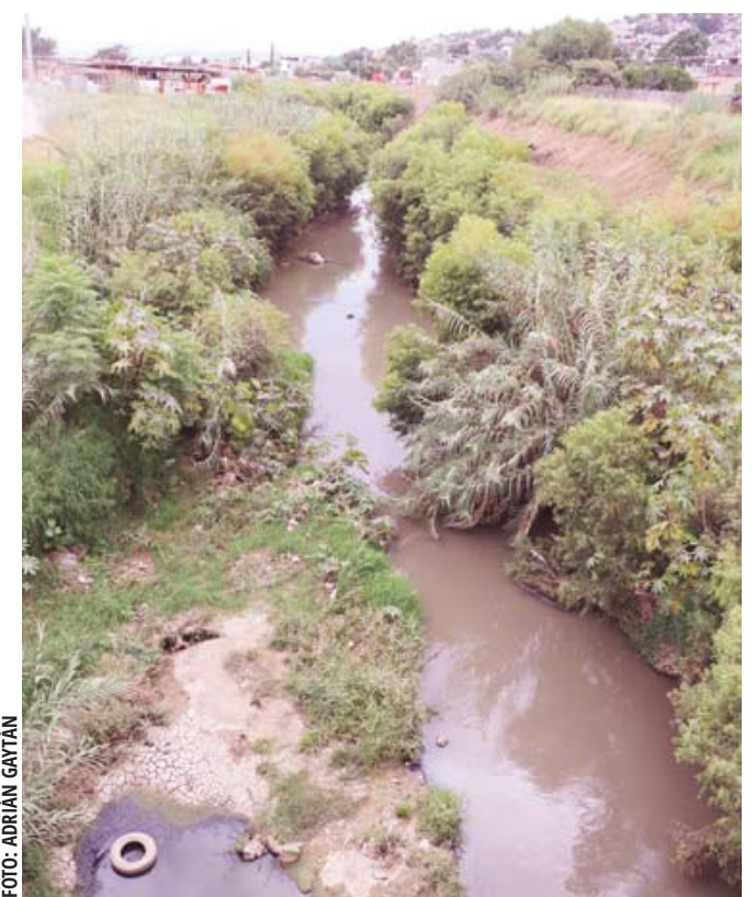
Confían en la palabra de la Presidenta Claudia Sheinbaum para el rescate del río Atoyac.