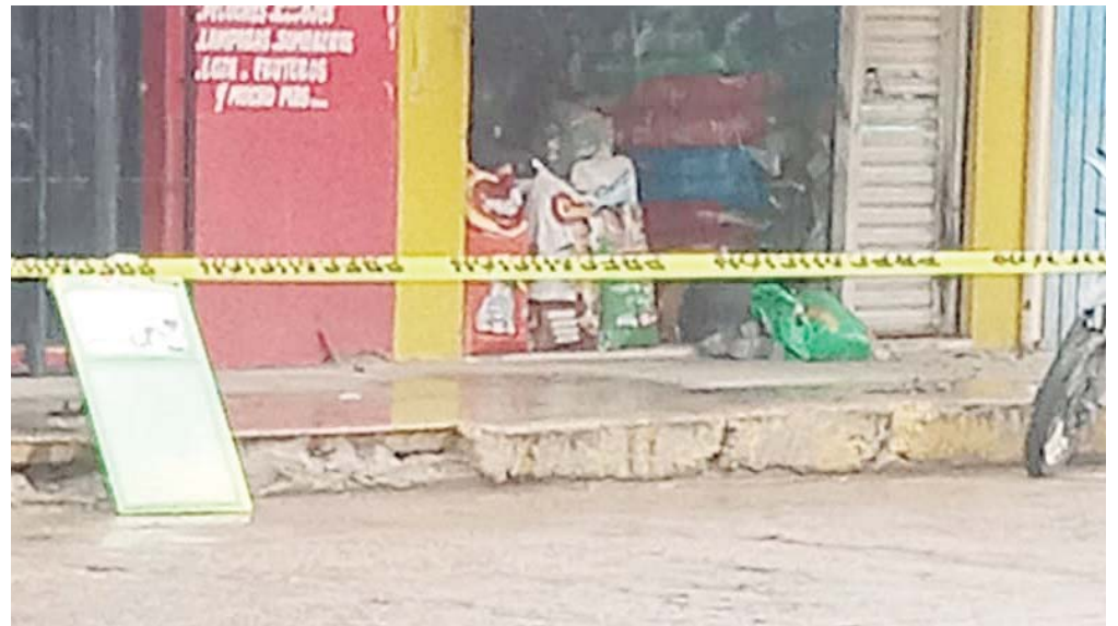
El establecimiento se ubica sobre la calle de Morelos esquina 16 de septiembre y Venustiano Carranza.

Por otra parte, a través de redes sociales y grupos de WhatsApp circuló un video en el que tripulantes de un vehículo estacionado, aproximadamente a 100 metros de donde ocurrieron los