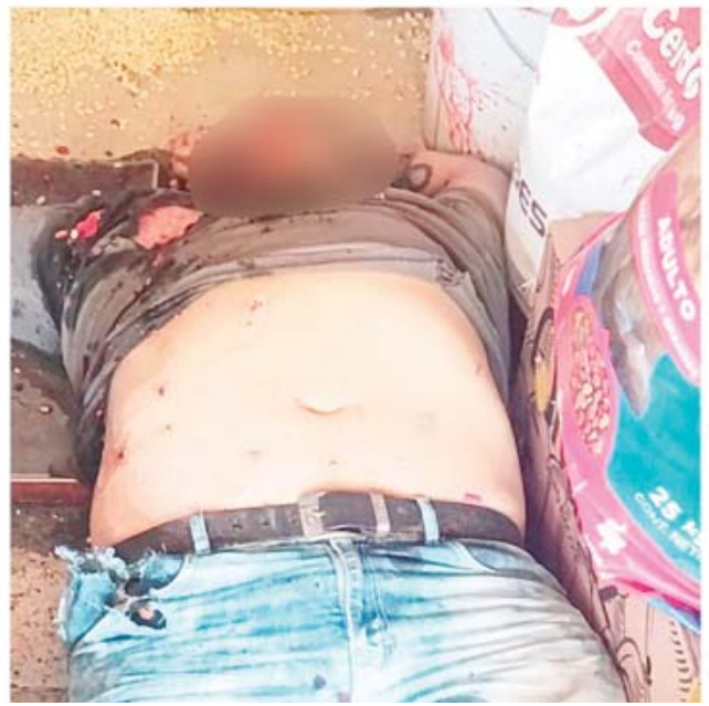
Los cuerpos de los dos hombres quedaron al interior de la bodega con evidentes lesiones por armas de fuego.

La Fiscalía de Oaxaca se hizo cargo del caso. Y elementos de la Agencia Estatal de Investigaciones (AEI) acudieron al lugar para realizar una inspección ocular, recolectar evidencias y entrevistar a posibles testigos. Los cuerpos fueron trasladados al anfiteatro para rea-