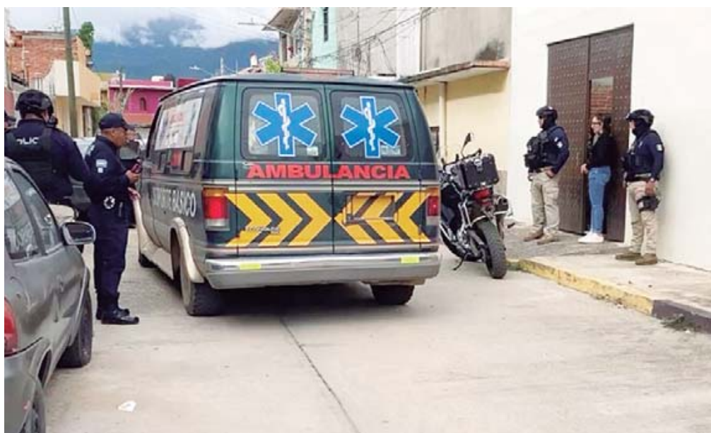
Vecinos llamaron al número de emergencia para que auxilian al hombre herido.

Policías municipales reiteraron su compromiso de trabajar en la seguridad y la protección de los vecinos, aunque los recientes incidentes reflejan la creciente inseguridad que se enfrenta en la capital oaxaqueña.