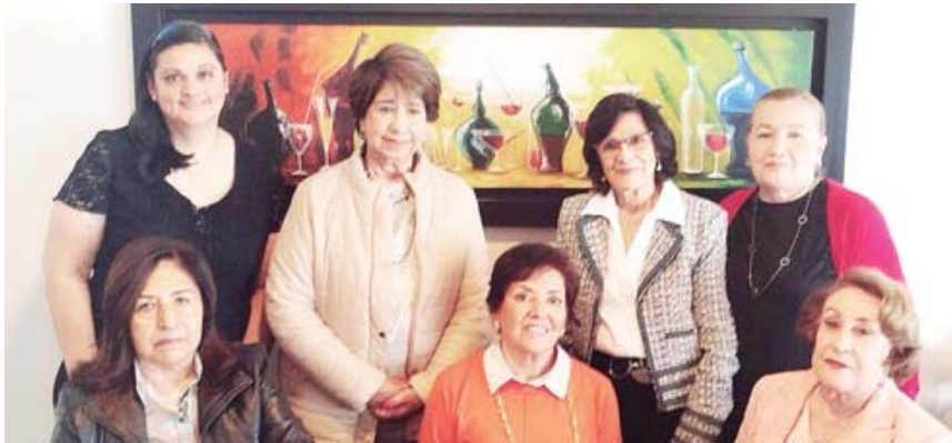
La festejada agradeció a sus amigas su presencia y su cariño este día tan especial.

Antes de concluir la reunión, la festejada agradeció a sus amigas su presencia y su cariño este día tan especial en su calendario personal, también agradeció a la vida por permitirle un año más para festejar al lado de sus entrañables amigas. ¡Enhorabuena!