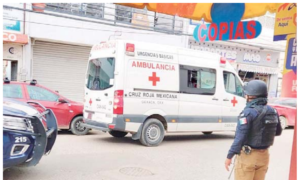
El joven que fue apuñalado fue atendido por la Cruz Roja.