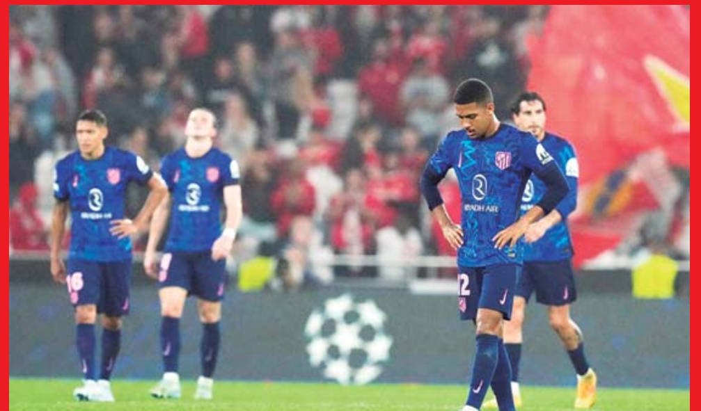
■ Atlético de Madrid, conmovido tras sufrir su peor goleada.

Con goles del turco Kerem Aktürkoğlu (13), del argentino Ángel Di María de penal (52), de Alexander Bah (75) y Orkun Kokçu de penal (84), los portugueses alcanzaron los 6 pun-