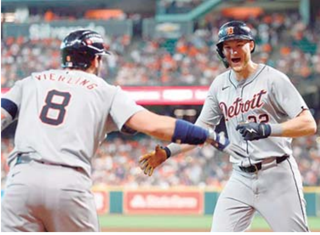
■ Detroit no competía desde la postemporada de 2014.