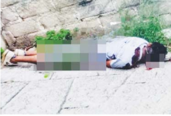
Un joven de alrededor de 25 años fue ejecutado en calles de San Pedro Pochutla.