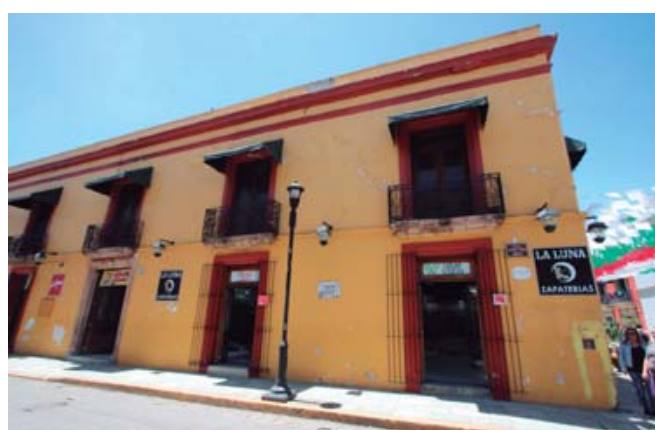
Localizada en la esquina con la avenida Miguel Hidalgo hay una placa en la que se recuerda a José María Armenta y a Miguel López.

Calles y avenidas con los nombres de Miguel Hidalgo o de Morelos, Vicente Guerrero y Armenta y López, inmuebles en los que "sucumbieron los héroes oaxaqueños", aquel en el que fueron encarcelados Felipe