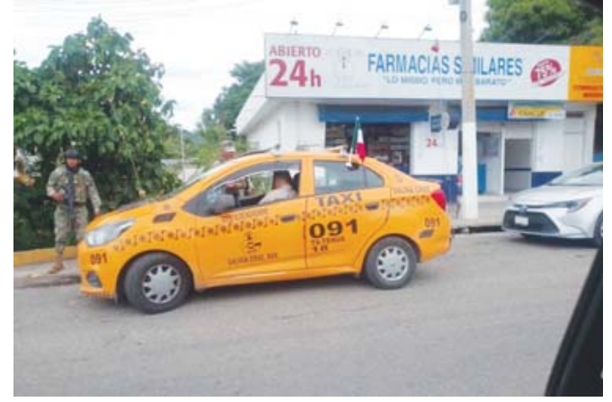
Los tripulantes de un taxi fueron baleados en Salina Cruz, el pasajero perdió la vida en el lugar.