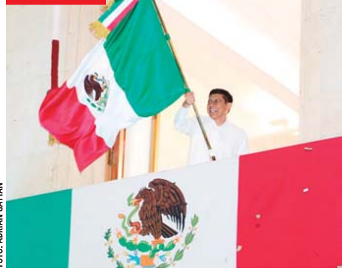
El gobernador Salomón Jara Cruz encabezó el tradicional Grito de Independencia, desde el balcón principal de Palacio de Gobierno, entre la algarabía y fervor patrio de las familias oaxaqueñas en la Plaza de la Constitución de Oaxaca.