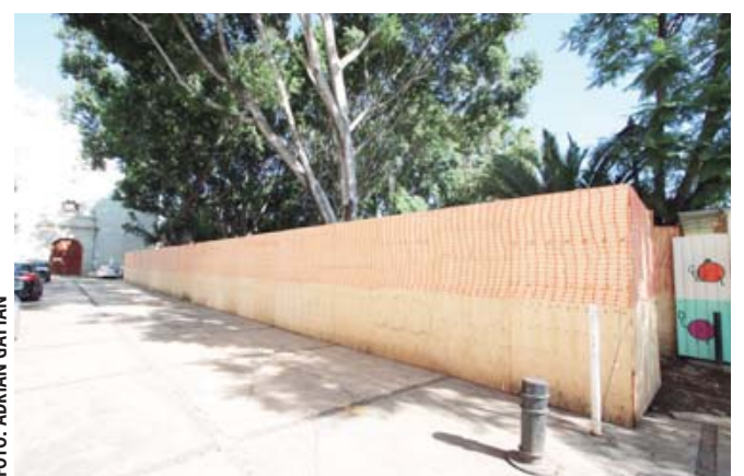
■ Prosiguen las obras de rehabilitación del Jardín Hidalgo.

También se rehabilitará la fuente en este parque a fin de que vuelva a funcionar. La colocación de bancas nuevas, de luminarias led en andadores para aumentar la seguridad; plantación de vegetación endémica de bajo mantenimiento y demanda hídrica, sin parte de esta primera etapa. Sobre el arbolado, parte del cual ha caído en los últimos años, el director explicó que existe coordina-