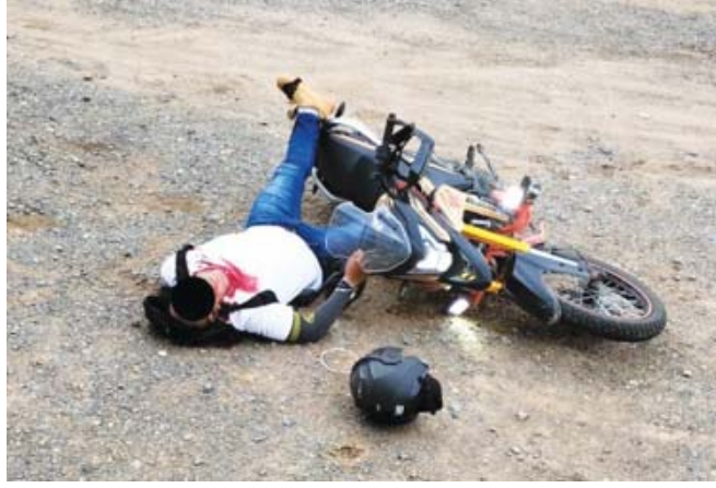
El conductor de una motocicleta perdió la vida por disparos de arma de fuego en Xoxocotlán.