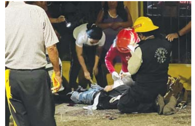
Gustavo N. N. fue baleado en el fraccionamiento Álamos, perdió la vida al día siguiente.

ban en un vehículo particular. Los cuerpos de las víctimas fueron levantados por los agresores y trasladados a otro sitio.