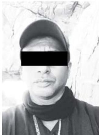
Dos oficiales municipales de Tututepec perdieron la vida tras ser baleados sobre la vía federal 200.