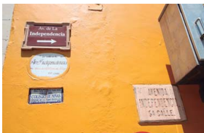
La calle independencia en algunos tramos se llamó calle del Colegio de Niñas (hasta 1884) o calle de San Felipe.

De Hidalgo, la ciudad también tiene una estatua en su honor que también da nombre al parque localizado junto al Paseo Juárez El Llano. Y de la Independencia, la avenida principal de la capital lleva su nombre desde finales del siglo XIX, pues en algunos tramos se llamó calle del Colegio de Niñas (hasta 1884) o calle de San Felipe, a la altura del templo homónimo (hasta 1884). De la avenida José María Morelos, una placa en la esquina con la calle Porfirio Díaz señala que su nombre fue, hasta 1884, calle del Refugio.