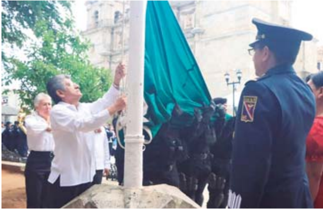
■ Izamiento de la bandera en la Alameda de León.

capital@imparcialenlinea.com Tel. 501 8300 Ext. 3172