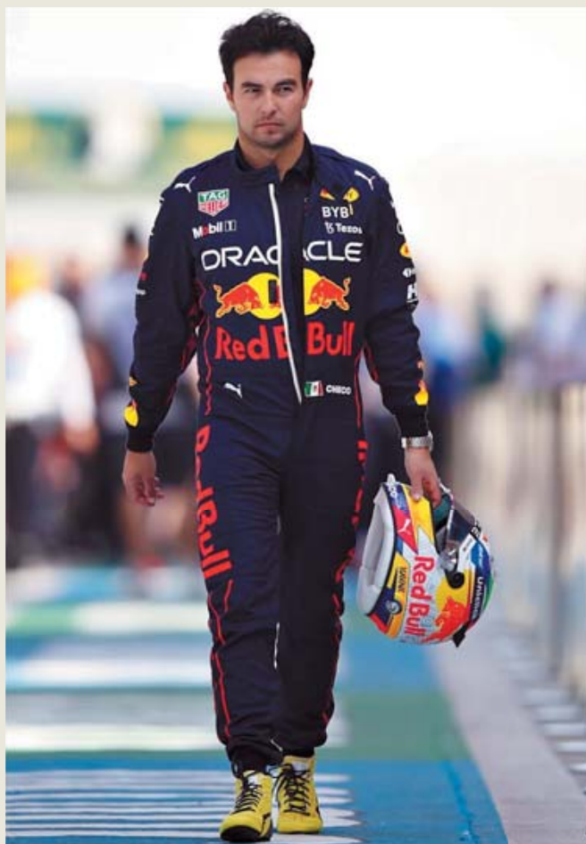
▪ Pese al fuerte impacto, ambos pilotos terminaron ilesos.

La primera detención en pits para Pérez se dio en la vuelta 14 y regresó a pista en la sexta posición con el neumático duro. Checo encontró a Lando Norris en su camino y este intentó bloquear para darle tiempo a Oscar Piastri de alejarse. El de Red Bull superó al británico en el giro 16 y comenzó a buscar al australiano.