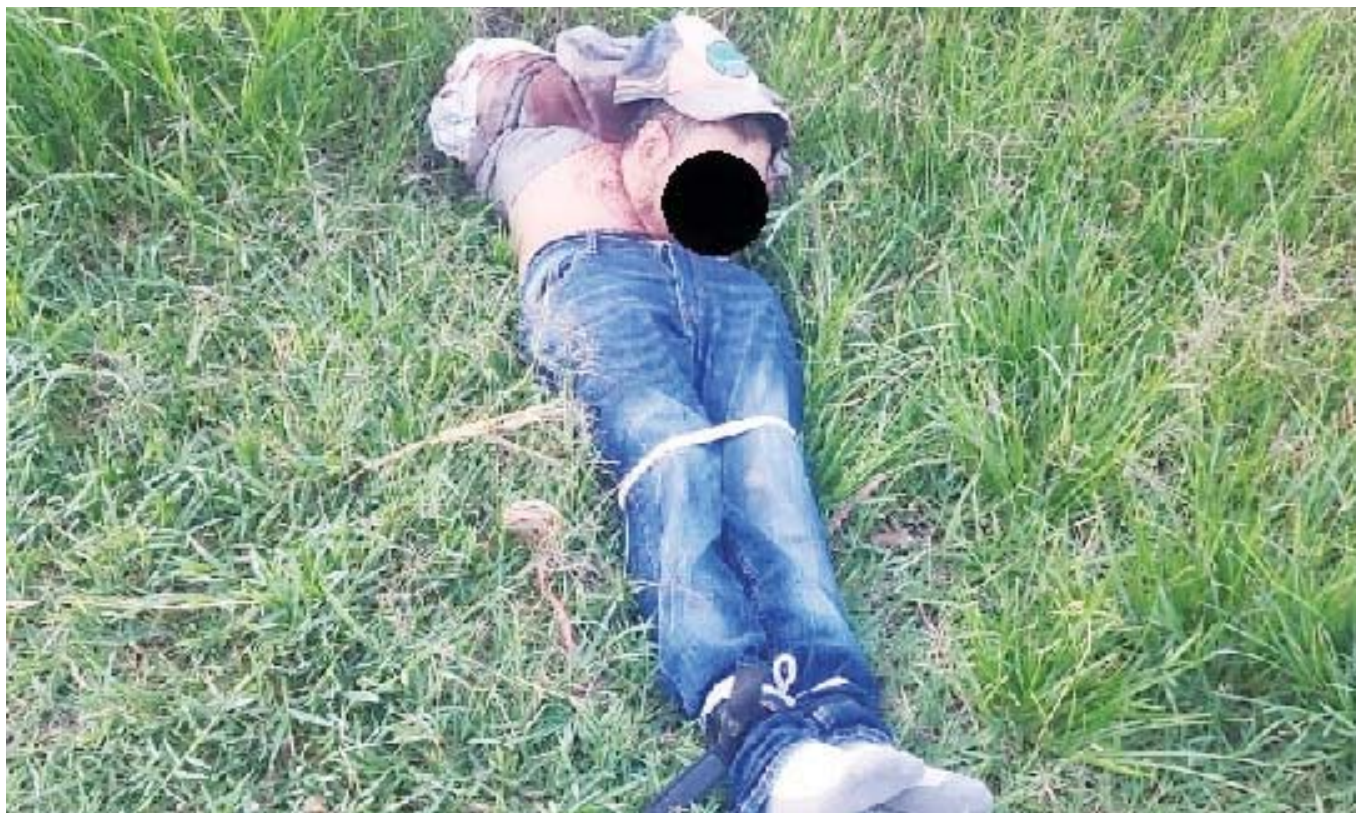
Un presunto líder criminal fue encontrado decapitado en jurisdicción de la Villa de Zaachila.