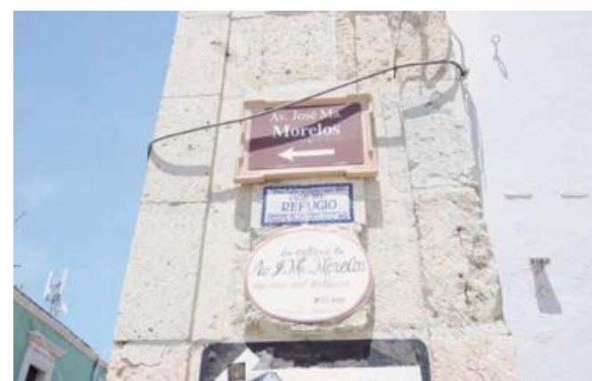
La avenida José María Morelos tuvo el nombre de calle del Refugio hasta 1884.