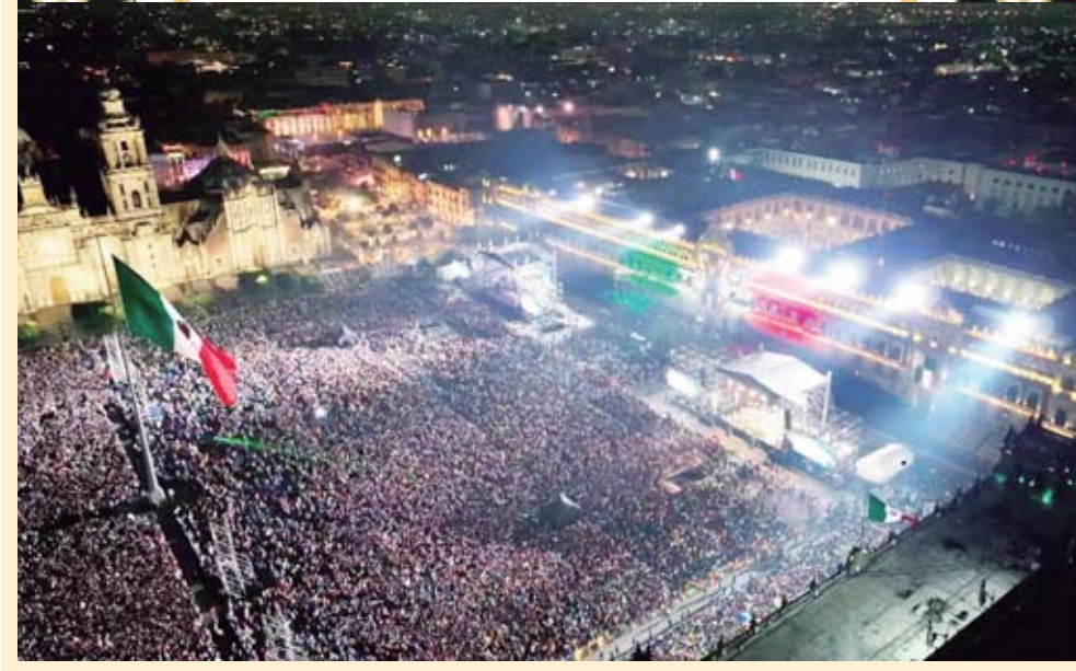
El presidente Andrés Manuel López Obrador dijo adiós al pueblo de México con su último "Grito" de independencia como Presidente, ante un Zócalo capitalino repleto.

nas, mexicanos: ¡Viva la Independencia! ¡Viva Miguel Hidalgo y Costilla! ¡Viva Josefa Ortiz de Domínguez! ¡Viva Ignacio Allende! ¡Viva Leona Vicario! ¡Viva José María Morelos y Pavón! ¡Viva Vicente Guerrero! ¡Vivan las heroínas y los héroes anónimos!", dijo en el arranque de su arenga, para luego gritar: