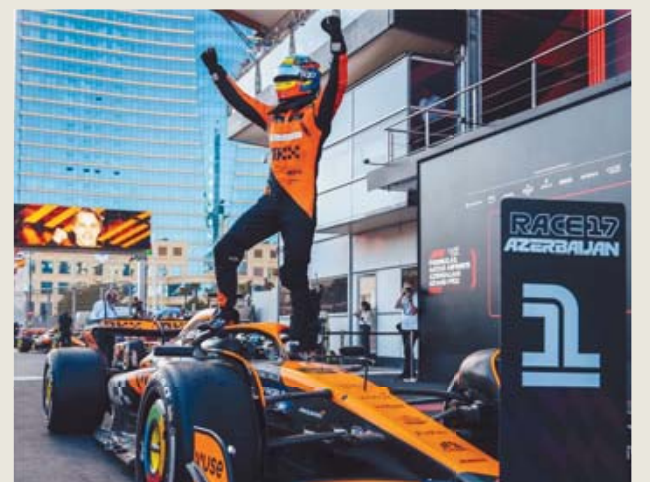
▪ Oscar Piastri catapultó a McLaren por delante de Red Bull en el campeonato.

En Red Bull se quedaron con el trago amargo de no ver un nuevo podio después de un fin de semana fuerte para Pérez, quien parecía que podía sumar su sexto podio en Bakú.