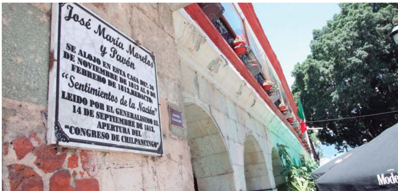
La casa de la esquina de Valerio Trujano y del Portal de las Flores fue en la que José María Morelos y Pavón redactó "Sentimientos de la Nación".

Ya viudo y con setenta años de edad, falleció en esta ciudad el 25 de abril de 1925. En sus "Ligeros apuntes históricos del Instituto de Ciencias y Artes del Estado de Oaxaca", el Lic. Pedro Camacho publicó su testamento, en el cual heredó su acervo bibliográfico a la Biblioteca del Estado, su instrumental quirúrgico al Hospital General así como cuatro mil pesos oro más quince pesos, para la construcción de un monumento en honor a los fundadores del Instituto de Ciencias y Artes del Estado y que aún se encuentra en el Edificio Central de la Universidad, en el extremo norte de la antigua calle del Sagrario, que hoy lleva su nombre.