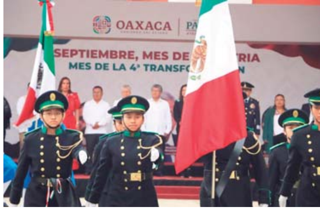
■ Rinden honores al Lábaro Patrio.