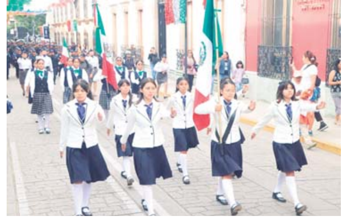
■ Desfile de banderas de la Alameda a la Plaza de la Danza.

PARA HONRAR A LAS Y LOS HÉROES DE LA INDEPENDENCIA