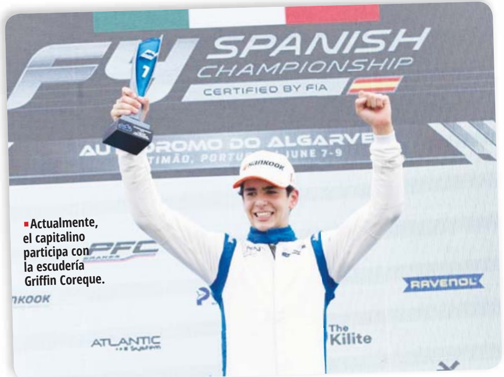
■ Actualmente, el capitalino participa con la escudería Griffin Coreque.

Actualmente, el capitalino participa con la escudería Griffin Coreque per-