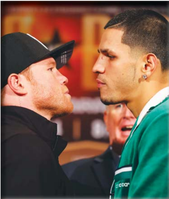
■ Canelo eligió a Berlanga por la gran rivalidad boxística entre Puerto Rico y México.

El piloto capitalino ha despertado el interés de algunos de los patrocinadores más importantes de México, como Escudería Telmex.