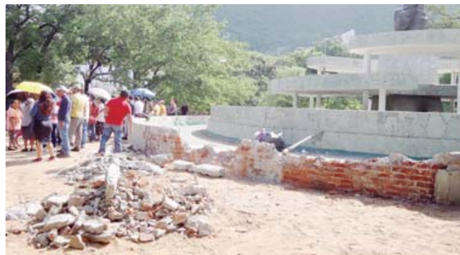
Bloqueo vecinal en defensa del Monumento a la Madre.