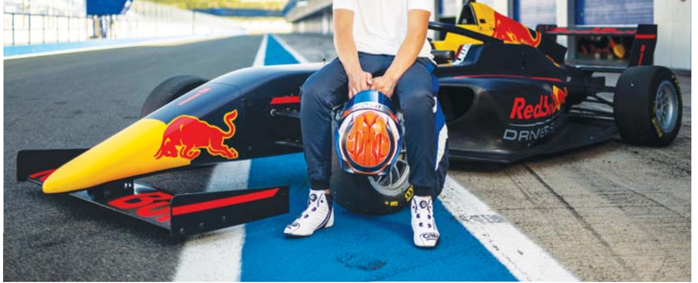
■ El joven capitalino dio el brinco directamente del karting a las categorías europeas.

El equipo GHR Motorsport continúa liderando la clasificación general del Campeonato Mexicano de Rallies cuya quinta fecha se corrió en Oaxaca.