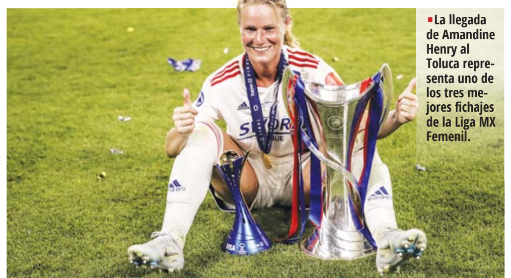
■ La llegada de Amandine Henry al Toluca representa uno de los tres mejores fichajes de la Liga MX Femenil.

Henry se integra al Toluca para el Torneo Apertura 2024 tras su paso por Europa y Estados Unidos donde ha ganado siete veces la UEFA Women's Champions League.