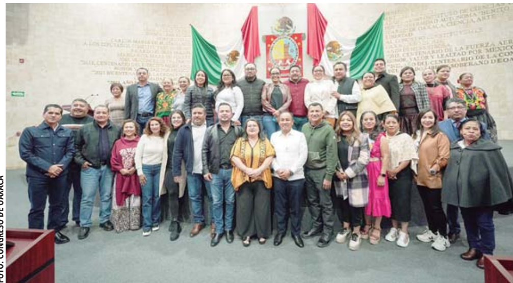
Los 41 que madrugaron para regalar a AMLO el primer aval de un congreso estatal a la Reforma Judicial.

Escasas horas después de ser aprobada la reforma al Poder Judicial en el Senado, con 41 votos a favor, el Congreso de Oaxaca, madrugó, para ser el primero en avalar por unanimidad esta disposición, sin rechazo de los legisladores de oposición al Movimiento de Regeneración Nacional (Morena). Minutos después de las 5:00 horas de este miércoles, comenzó la sesión extraordinaria con la asistencia de todas las y