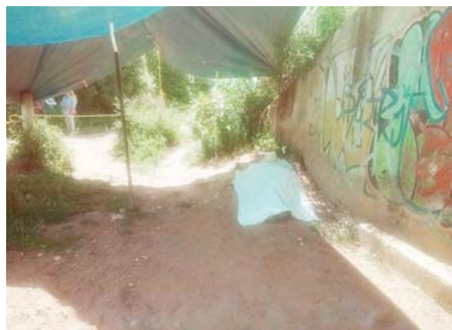
■ El cuerpo fue identificado por el hijo de la persona fallecida quien señaló que sufría de problemas del corazón.

De acuerdo con el agente municipal de Santiago Ixtaltepec, Teotitlán del