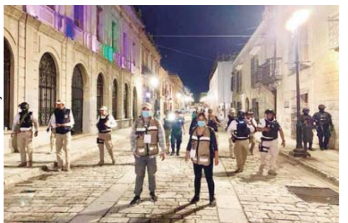
Inspectores impiden la instalación de ambulantes dentro un polígono en el cual se prohíbe la instalación de puestos en la vía pública.

Es importante recalcar que, de acuerdo al artículo 12 del citado reglamento, existe un polígono en el cual se prohíbe la instalación de puestos en la vía pública, el cual abarca: Las Casas, Trujano e Hidalgo, entre las calles 20 de Noviembre y Armenta y López, así como Bustamante y Flores Magón, entre la calle de Aldama y la Avenida Independencia,