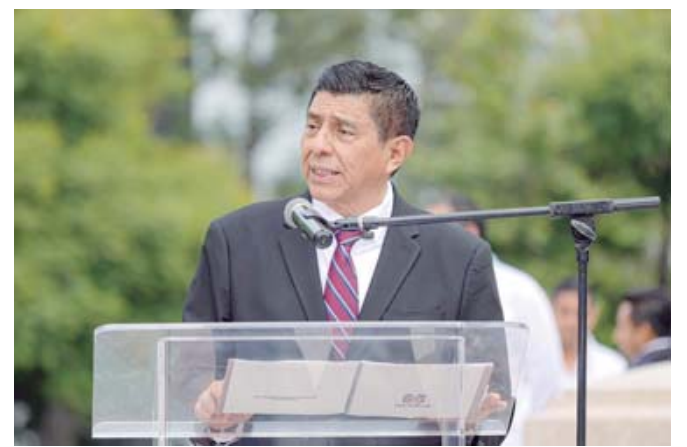
El gobernador, Salomón Jara, en su discurso al pie de la Columna de la Independencia.

cuya dirigencia nacional se manifestó en contra de esta modificación constitucional. Bajo la misma situación las y los diputados del Partido de la Revolución Democrática (PRD) y de Acción Nacional (PAN) quienes se sumaron a esta propuesta del presidente Andrés Manuel López Obrador. INFORMACIÓN 4A