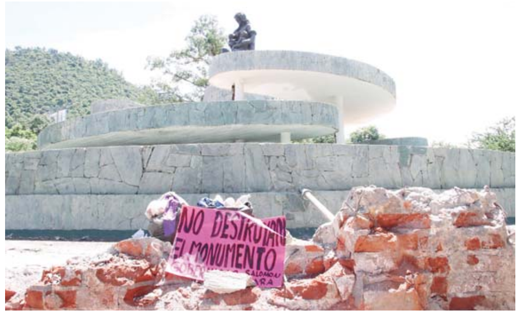
La base del monumento comenzó a ser retirada, además del adoquín.

El monumento a La Madre que tiene la ciudad de Oaxaca es una de las varias construcciones de su tipo que existen en torno a la figura materna en el país. Con diver-