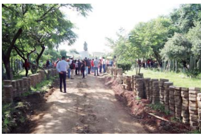
El adoquín retirado; al fondo, el emblemático monumento.

“Lo que sucedió con el parque es que está absolutamente abandonado, vandalizado, lleno de basura y lo que estamos intentando es recuperar el pequeño parque donde hay 301 árboles y plantas suculentas”, indicó el