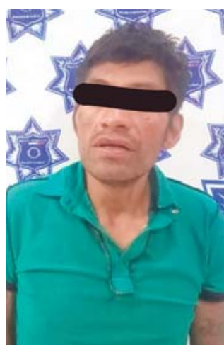
■ El presunto ladrón dijo llamarse Alexis F. A., de 32 años de edad.

Fue detenido tras ser localizado dentro del auto de un vecino de la colonia Libertad intentando arrancar el estéreo