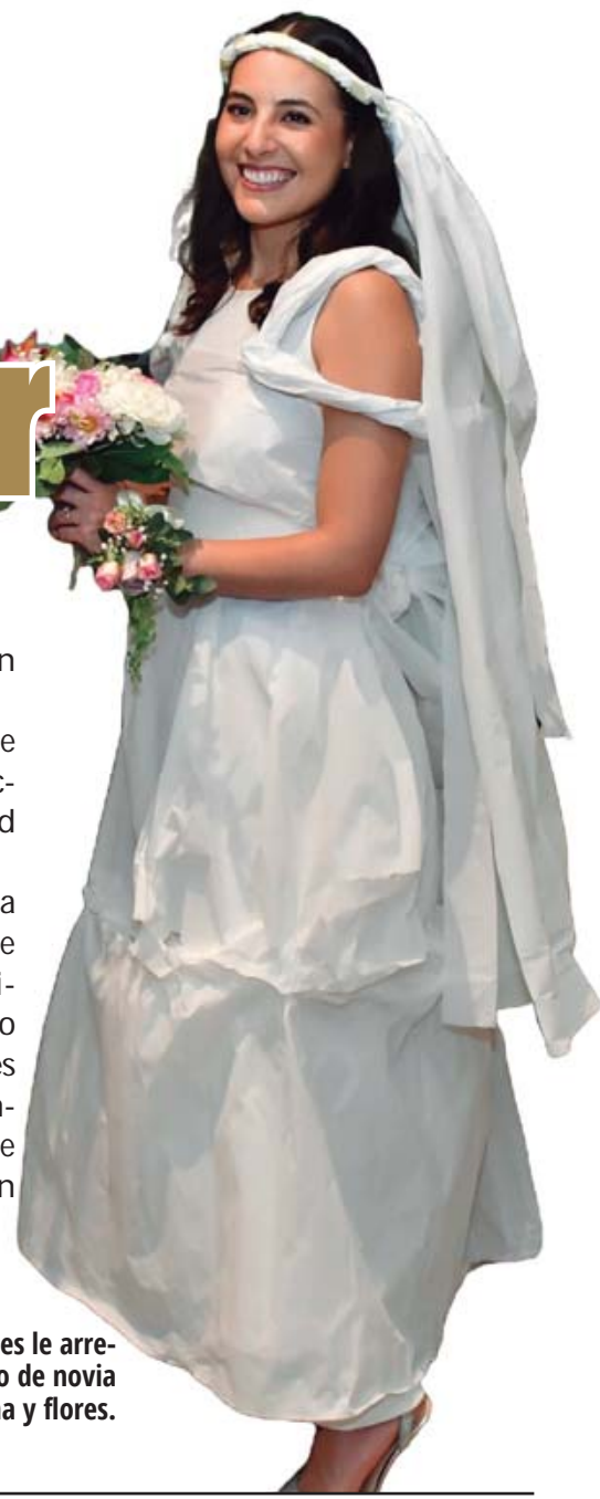
Las asistentes le arreglaron un vestido de novia con papel china y flores.