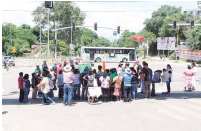
Vecinos inconformes echaron mano de un Citybus para bloquear el acceso a la carretera al Fortín.

El martes, los colonos frenaron las obras en el parque, pues se percataron que el personal estaba retirando el adoquín