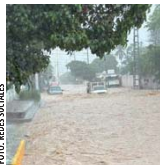
Automóviles bajo el agua, en Salina Cruz.

Luego de montar una guardia de honor y depositar una ofrenda floral en el Monumento a la Independencia en la Ciudad de México, el Mandatario estatal calificó la determinación legislativa como histórica y sin precedentes.