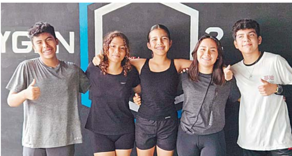
■ Jóvenes comenzaron muy contentos sus rutinas de ejercicios.