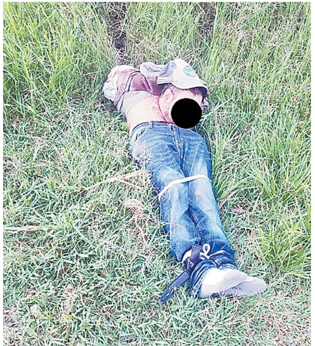
El cuerpo fue localizado por vecinos de la zona del puente del río Atoyac en Zaachila.

cias, el cuerpo fue trasladado a las instalaciones correspondientes para la necropsia de ley, donde se confirmarán la causa exacta de la muerte y se evaluarán las lesiones, que, según las primeras evidencias, apuntan a un acto de tortura.