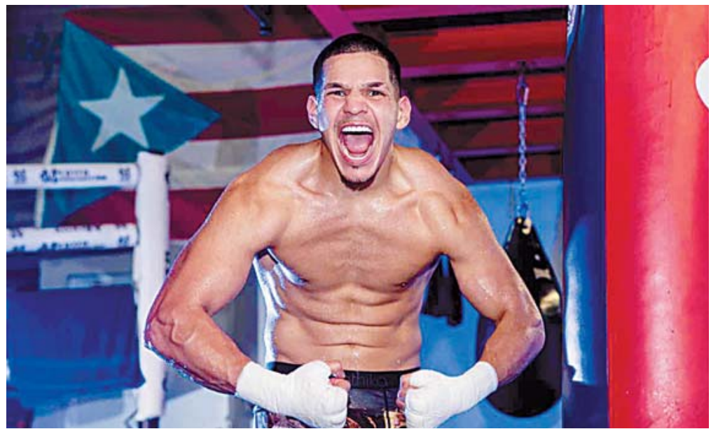
El Elegido no se dejó intimidar y aseguró que piensa lastimar al tapatío.

Por último, Édgar dio su predicción sobre el resultado de la pelea, en la que se ve como el ganador por la vía del nocaut. "Vamos a noquear, vamos a noquear en el sexto. Si él dice que, en el octavo, yo voy a decir que en el sexto", concluyó.