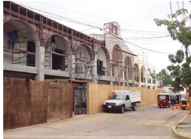
■ Problemas urbanos, de salud, inseguridad, invasión de mototaxis, pavimentación, sinfín de problemas pendientes a resolver en Santa Cruz Xoxocotlán.

Sin embargo, en la etapa de priorización, la mayor parte de estos proyectos quedó fuera, pues únicamente 285 pasaron el filtro. Aun así, se desconoce la cantidad final de la obra pública a eje-