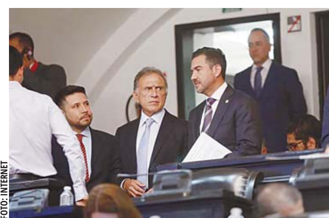
El senador veracruzano Miguel Ángel Yunes Márquez (der.), con su suplente y padre, Miguel Ángel Yunes Linares