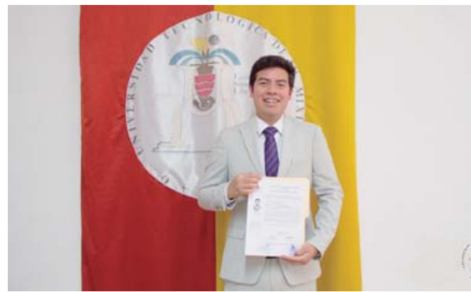
▪ En la UTM realizó su maestría en Robótica y, muy pronto, concluirá su doctorado.