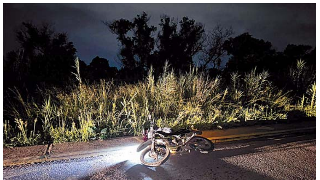
El conductor asesinado se encontraba tirado en la banqueta junto a su vehículo.

ron una inspección ocular del sitio y trasladaron el cuerpo a las instalaciones correspondientes para llevar a cabo la necropsia de ley. Esta autopsia confirmará oficialmente la causa de la muerte y propor-