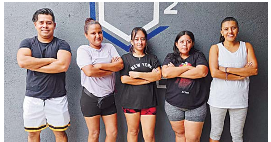
■ Los maestros se unieron para iniciar un plan de ejercicios.