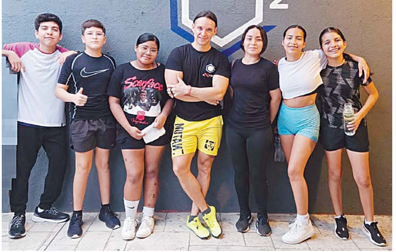
■ Estudiantes del Instituto México iniciaron un programa de ejercicios en Oxygen Fitness en Huatulco.

¡Qué tengas felices Fiestas Patrias, que festejaremos en próximos días; tengamos más educación cívica para demostrar que los mexicanos valemos mucho!