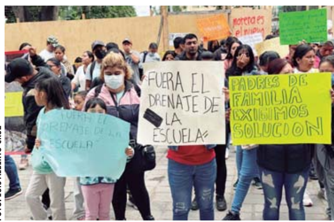
■ Las protestas de padres de familia de Pueblo Nuevo en demanda de mejores condiciones sanitarias en planteles educativos.

La comunidad escolar demanda solución a un problema sanitario por las aguas negras que corren en la cercanía del plantel. Los padres de familia maestros y alumnos de la Escuela "José Vasconcelos" y "Jacobo Herrera Salazar", ubicada en la Colonia del Maestro en la agencia de Santa Rosa Panzacola, se congregaron en el Palacio de Gobierno para exigir el retiro del drenaje que