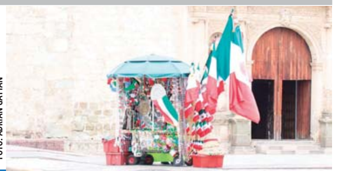
■ Ganan la calle motivos de Fiestas Patrias.