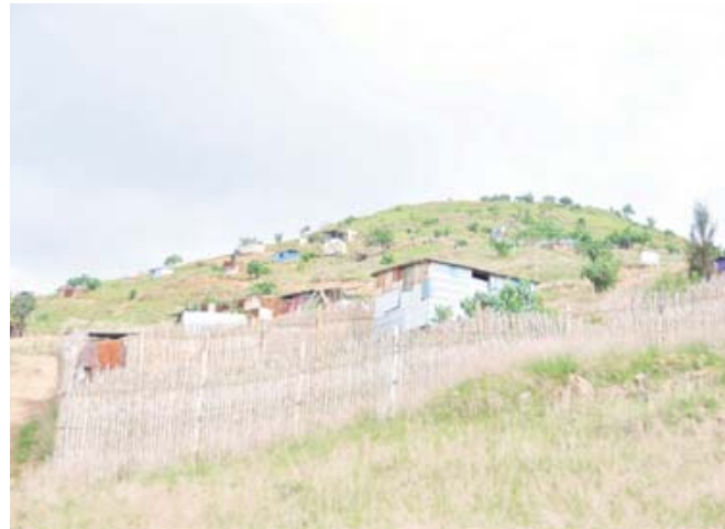
■ Las carencias fuera de casco urbano de Xoxo. Lomas del Quío donde en 2019 fueron desalojados habitantes.

nización (339 proyectos), construcción de la red de drenaje o su rehabilitación (158) y el suministro de agua potable (78).