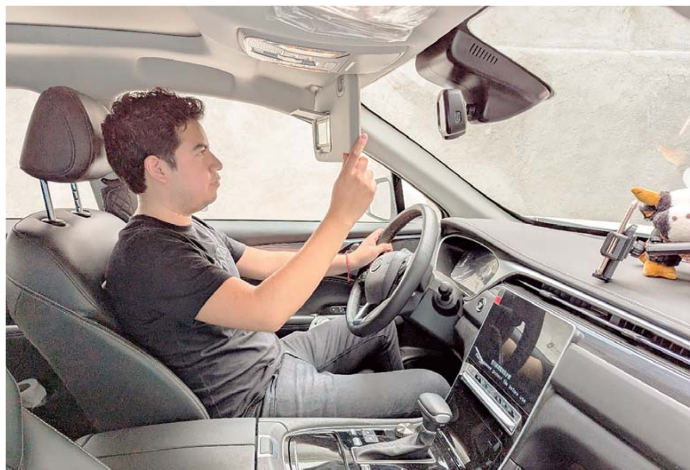
▪ Su proyecto de investigación busca aplicar la tecnología en la seguridad vial para evitar lesiones y salvar vidas.

Sobre su trabajo doctoral nos dice: “Conducir es una acción demasiado compleja; exige que los conductores se involucren tanto física como psicológicamente. De esta manera, el logro de una conducción segura depende no solo de las habilidades del conductor para controlar su vehículo en todo