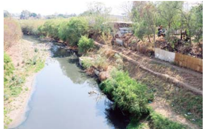
■ Basura, viviendas, invasiones a los márgenes de los ríos Atoyac y Salado.

ejercer las leyes. Incluso, dijo que son las mismas autoridades las que han permitido la realización de obras en estas áreas. "Autorizan puentes, descargas, por ellas (las autoridades) son las que hacen las inspecciones cuando se va a hacer la conexión de descarga", explicó.