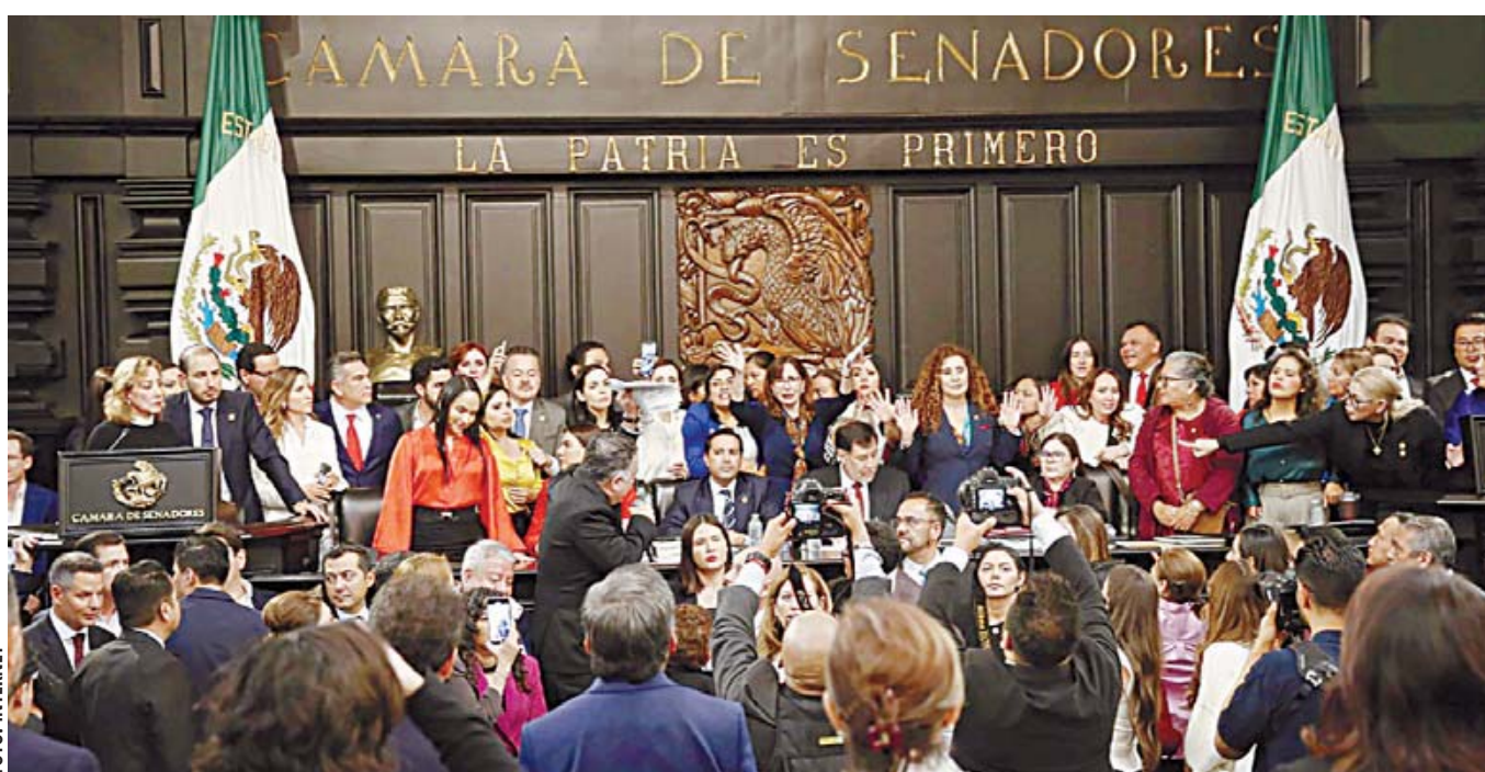
Entre protestas de la oposición, con 86 votos a favor, 41 en contra y cero abstenciones, la madrugada de este miércoles el Pleno del Senado aprobó en lo general el dictamen de la reforma al Poder Judicial, con la mayoría calificada de Morena y aliados.

Esta votación se dio luego de que a las 16:00 horas, manifestantes lograron acceder al Senado ubicado en Avenida Reforma, lo que provocó que los legisladores suspendieran la sesión y se fueran a