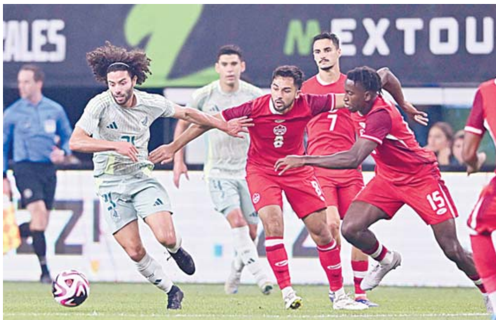
El Tri regresa a casa con un triunfo y empate en los primeros dos encuentros bajo el mando de Javier Aguirre.

Hubo pocas llegadas de claridad o que pusieran en peligro la portería de Canadá, apenas tres días después de que