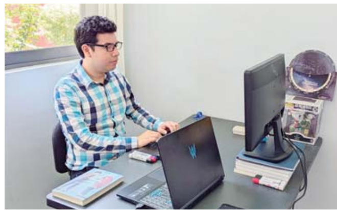
▪ Su trabajo podría impactar de inmediato en la seguridad en calles y carreteras.

momento, además depende de su estado emocional y de las distracciones que su entorno, en constante cambio, le pueda generar. Un conductor distraído puede provocar accidentes”.