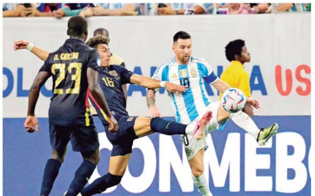
■ Messi no mostró el nivel al que tiene acostumbrado a los aficionados.

un disparo que fue tapado por Willian Pacho.