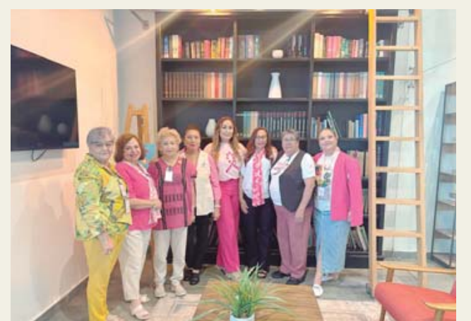
Las asistentes aprovecharon al máximo las reuniones de trabajo.