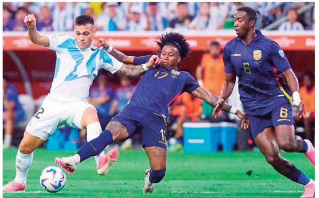
■ Ecuador se plantó bien para anular el ataque albiceleste.

La escuadra Albiceleste sufrió para alejar a Ecuador de zona de peligro, pero finalmente logró retomar el control de la pelota, dando sus primeros avisos a través de Enzo Fernández, comenzando con un cabezazo y posteriormente con