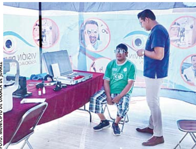
■ Servicios a la ciudadanía con las Brigadas Integrales Bienestar.

Odontología. Estudios de laboratorio. Somatometría. Oftalmología y optometría. Servicios de belleza. Esterilización canina y felina.