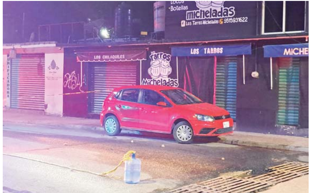
El auto rojo que iban abordar los heridos estaba frente al bar.

Ambos hombres fueron víctimas de una emboscada mientras se disponían a abordar un auto