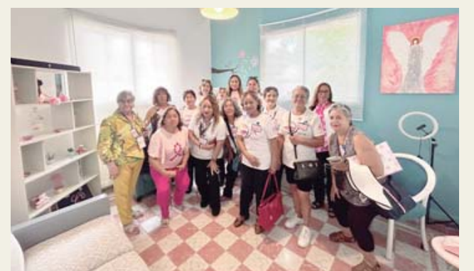
Visitando Casa RETO.