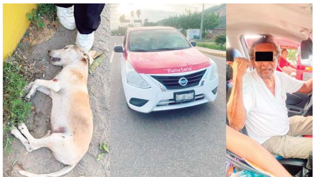
El perrito cruzaba la carretera cuando fue atropellado y murió.

En la audiencia, el ministerio público aportó suficientes elementos de prueba, por lo que el Juez que atiende la causa realizó el análisis correspondiente y conformé a ello dictó auto de formal prisión en contra de R. J. M., por el delito de Homicidio Calificado con las Agravantes de Premeditación, Alevosía, Ventaja y Traición.