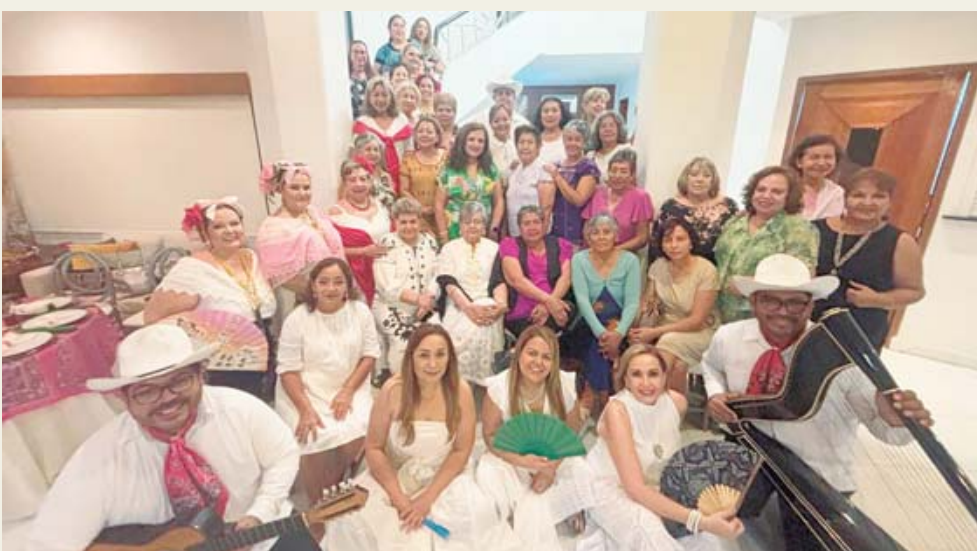
Bienvenida a las asistentes al Tercer Congreso, estando presente un grupo de jarana.