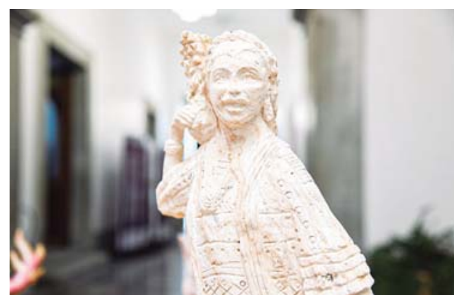
■ Trabajan alrededor de 40 talleres conformados por personas expertas.