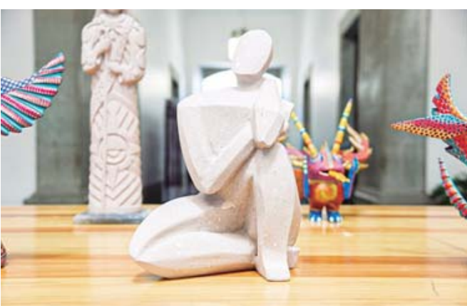
■ La población está orgullosa de esta tradición.

que se llevarán a cabo en el marco de la fiesta patronal en honor a Santa María Magdalena a celebrarse el 22 de julio.