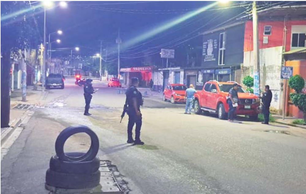
La policía resguardó la zona del atentado para las primeras diligencias.