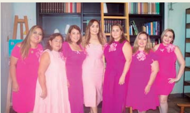
En la sala de juntas del Hospital Español se reunieron las asistentes.