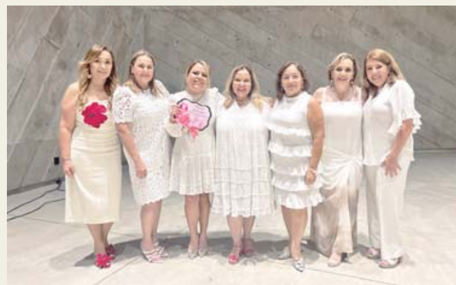
La tarde de la clausura en el Foro Boca.