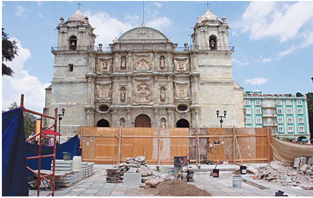
■ Luego de suspensión y aplazamiento, las obras de remodelación lucían ayer abandonadas en la Alameda de León

A decir del edil, los montos no han podido reducirse porque algunas personas de otros municipios siguen trayendo o abandonando sus desechos en la capital. También reconoció que el volumen de desechos aumenta en cada temporada turística, cuando se estima en 49 toneladas extras diariamente. "Tenemos que redoblar esfuerzos, efectivamente, se multiplica la basura y tenemos que recogerla, no podemos dejar-