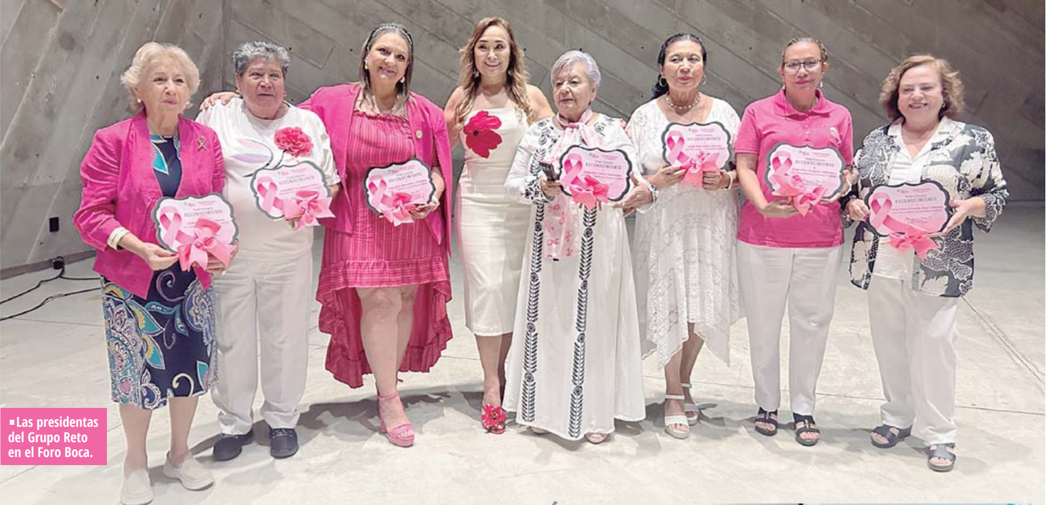
Las presidentas del Grupo Reto en el Foro Boca.