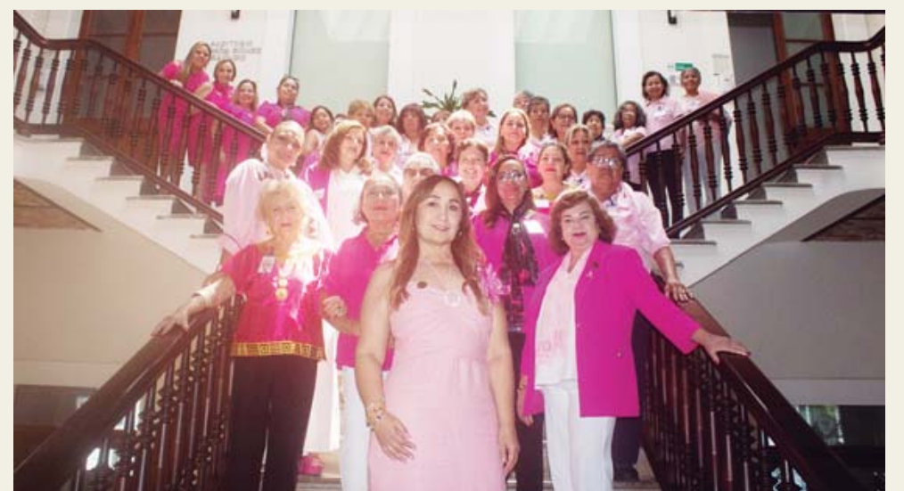
El grupo de presidentas y voluntarias en la escalinata del Hospital Español.