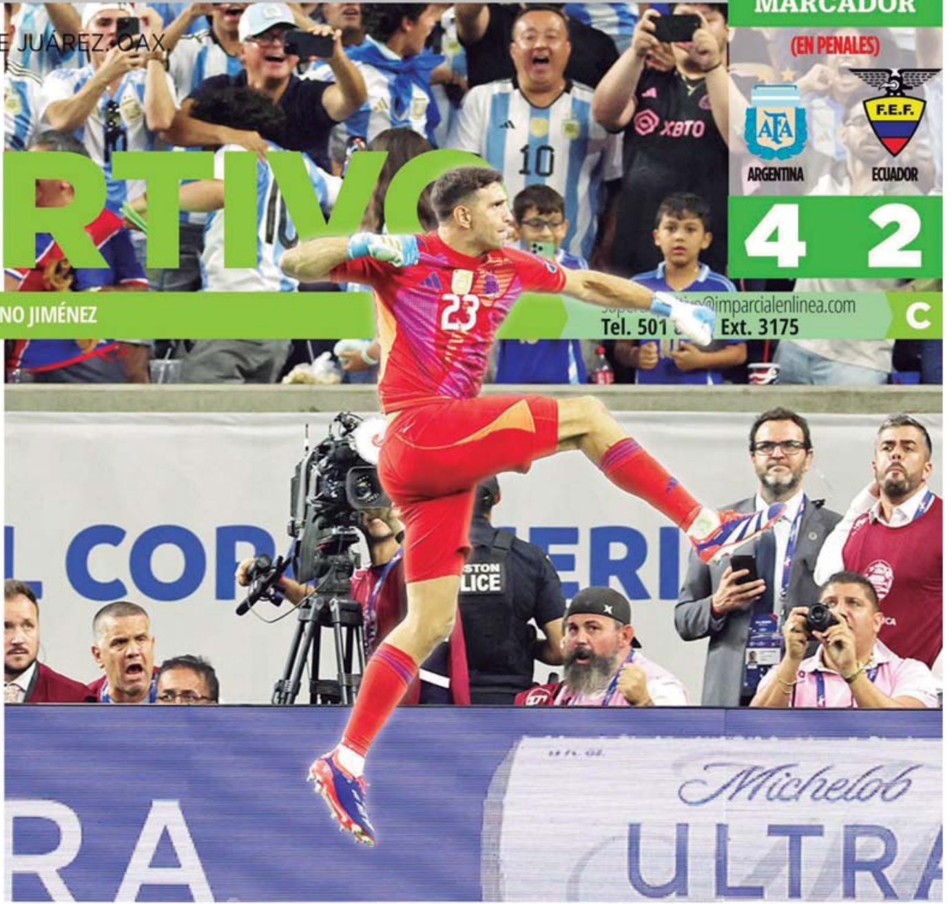
■ Dibu fue la figura de la Albiceleste al parar dos penales, luego de la falla de Messi.

refuerzos termina con Luis Romo. Giorgos Giakoumakis, Andrés Montaña y Jorge Sánchez serán los jugadores que lleguen para el inicio del torneo.