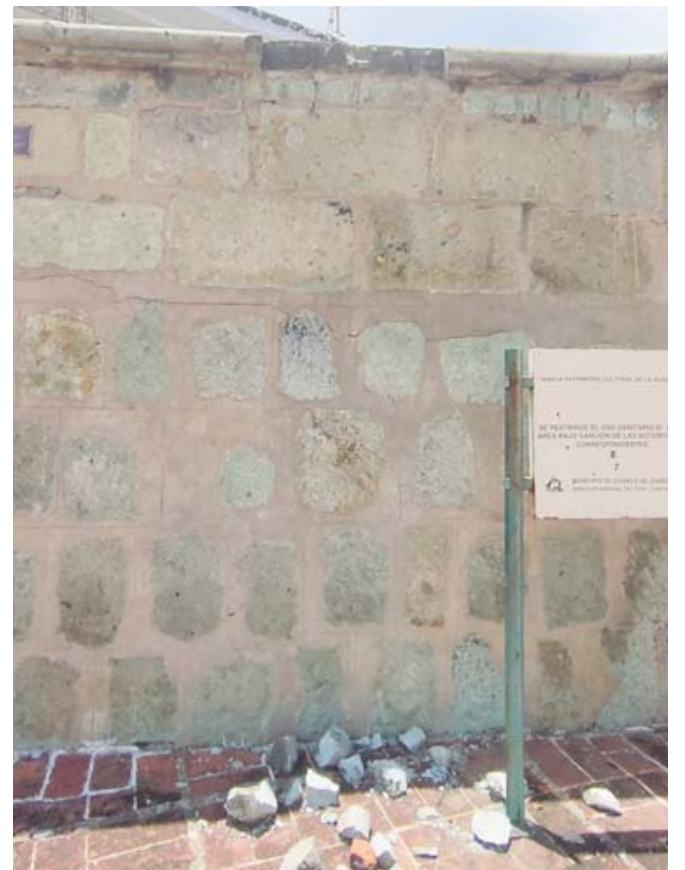
Se observaron los daños en la parte interior de la barda.

La indumentaria de los sacerdotes, diáconos, obispos y del arzobispo de París ha sido diseñada por el estilista Jean-Charles de Castelbajac