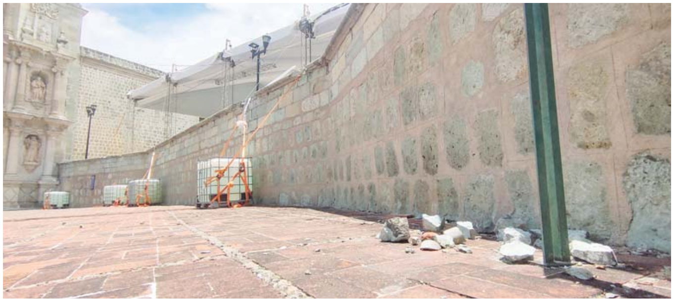
Los daños quedaron en este monumento federal y que está catalogado como parte del patrimonio histórico del centro de la ciudad de Oaxaca.