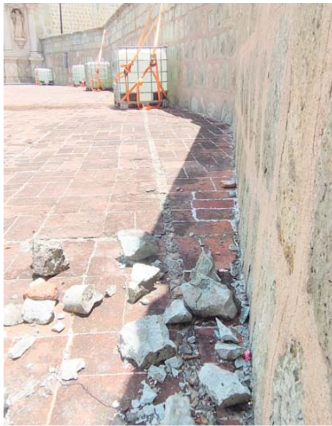
Desde el atrio de la basílica se observaron varios fragmentos de la cantera.