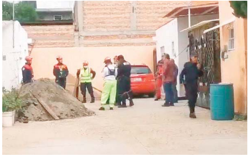
Autoridades realizaron las primeras diligencias y acordonaron la zona.