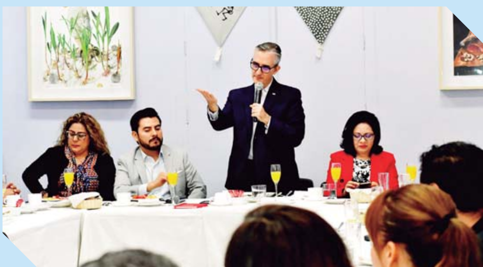
Se impartió la conferencia sobre la generación de empleos y áreas de desarrollo profesional para estudiantes.