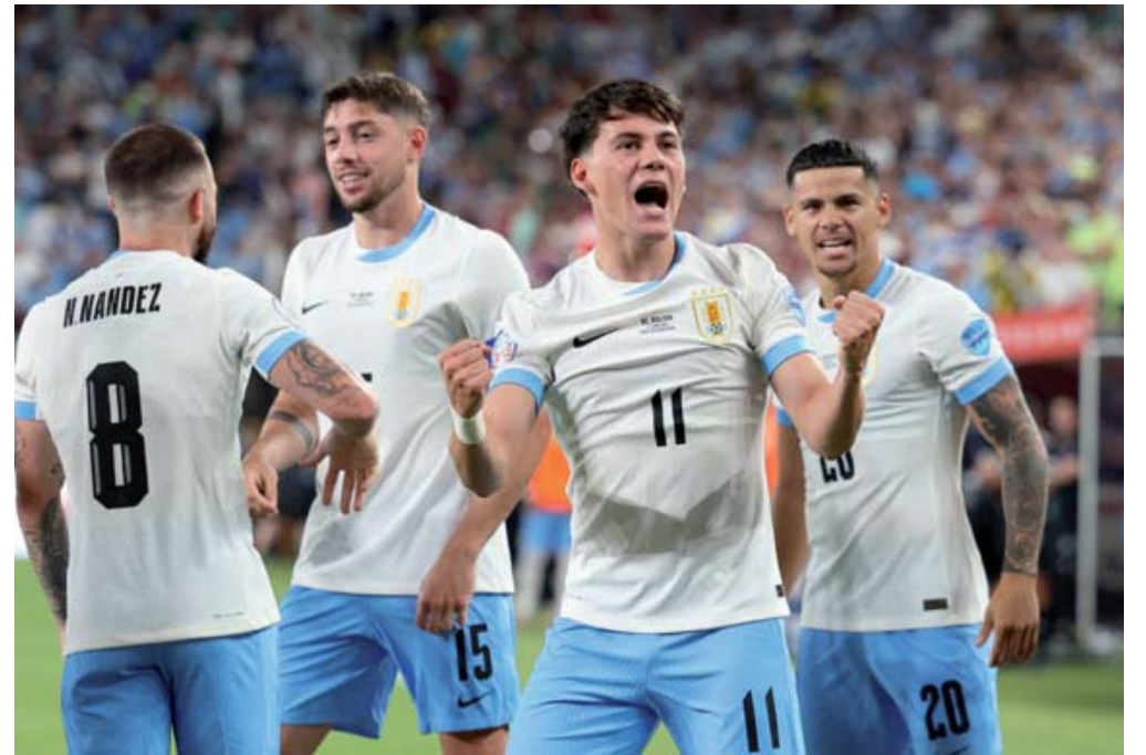
Uruguay está prácticamente clasificado a cuartos de final de la Copa América.

Desde los primeros minutos del partido, Uruguay demostró ser superior a Bolivia y bastaron sólo ocho minutos para adelantarse en el marcador. Ronald Araujo centró un balón tras un centro largo al área boliviana, donde Facundo Pellistri apare-