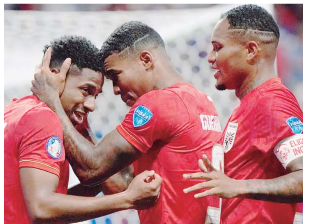
Los dirigidos por Thomas Christiansen sueñan con la clasificación a Cuartos de Final.