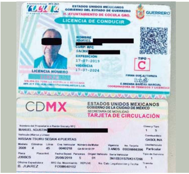
Portaba licencia y tarjeta de circulación presuntamente falsas.