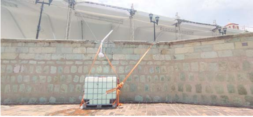
La ley contempla sanciones para quienes causen daños el patrimonio oaxaqueño.