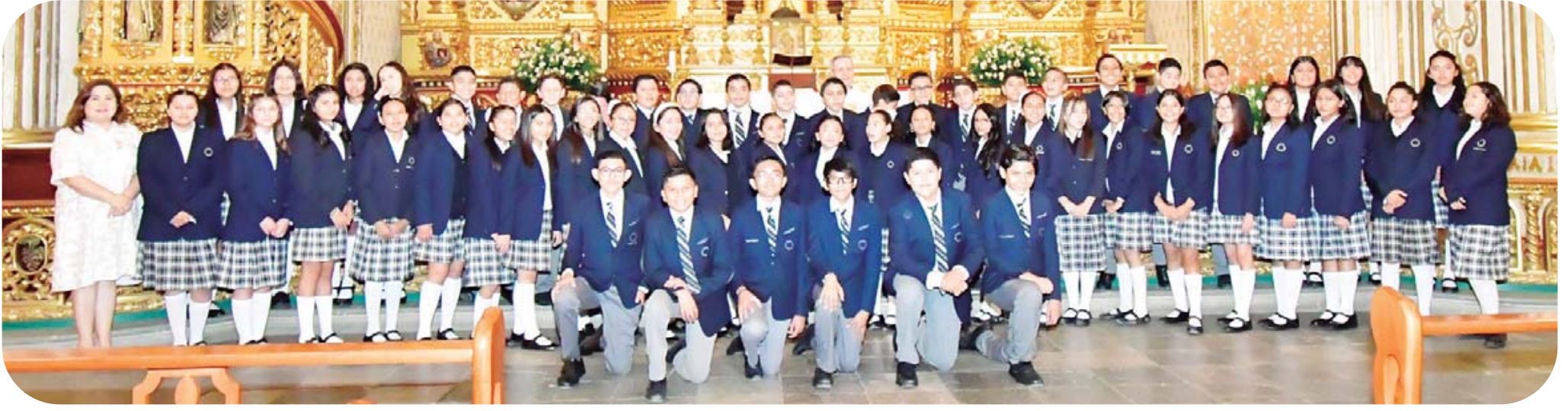
Los alumnos agradecieron al Todopoderoso la culminación de esta etapa con una misa de acción de gracias en el templo de Santo Domingo de Guzmán.

El consumo de melón nos aporta agua, vitaminas A, B, C y E, ácido fólico, fibra, además de minerales como calcio, hierro y potasio; todos estos componentes favorecen a: Mantener hidratado nuestro el cuerpo en días calurosos al mismo tiempo que consumimos una botana dulce baja en calorías.