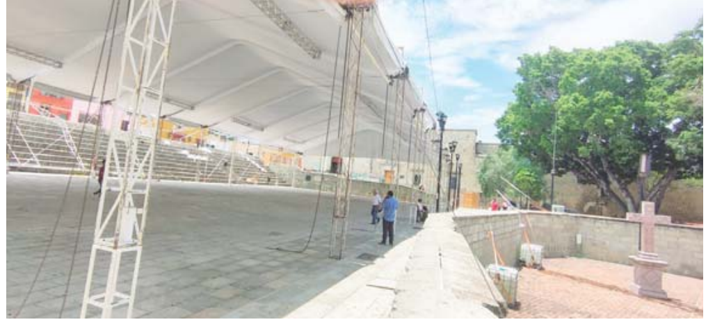
La carpa finalmente tuvo que ser retirada por la empresa.

Este jueves, empleados de la empresa SICA Eventos causaron daños en el bien federal y catalogado, además de que finalmente tuvieron que desmontar la estructura