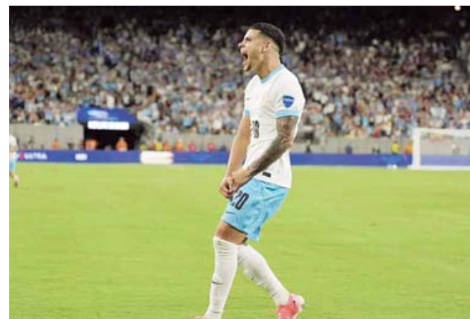
Firmaron la goleada.

ció para empujar el balón y adelantar a su equipo.