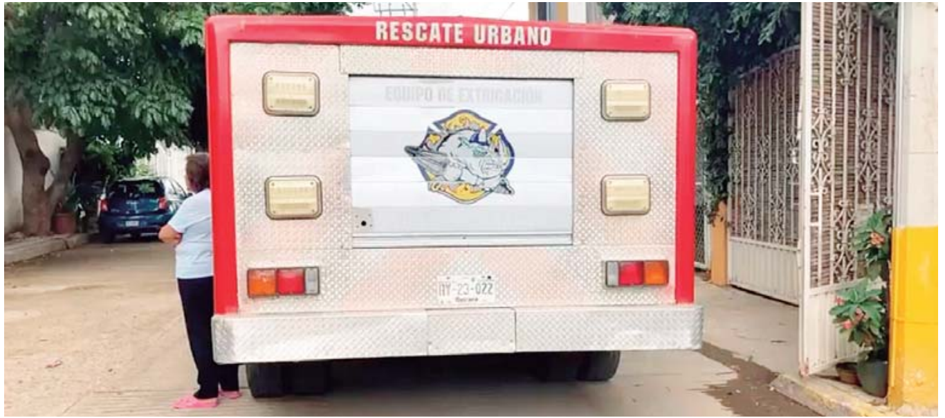
Los bomberos acudieron para rescatar el cuerpo del interior del pozo.