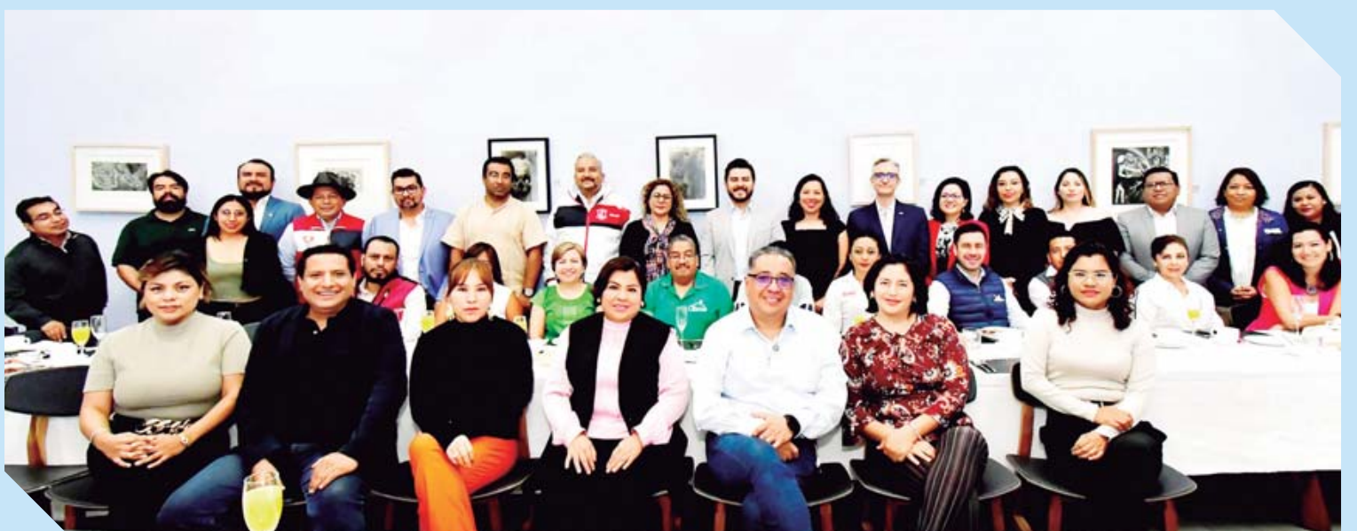
En un conocido restaurante los socios se dieron cita y degustaron de platillos especiales acompañados de frutas y ricas bebidas.