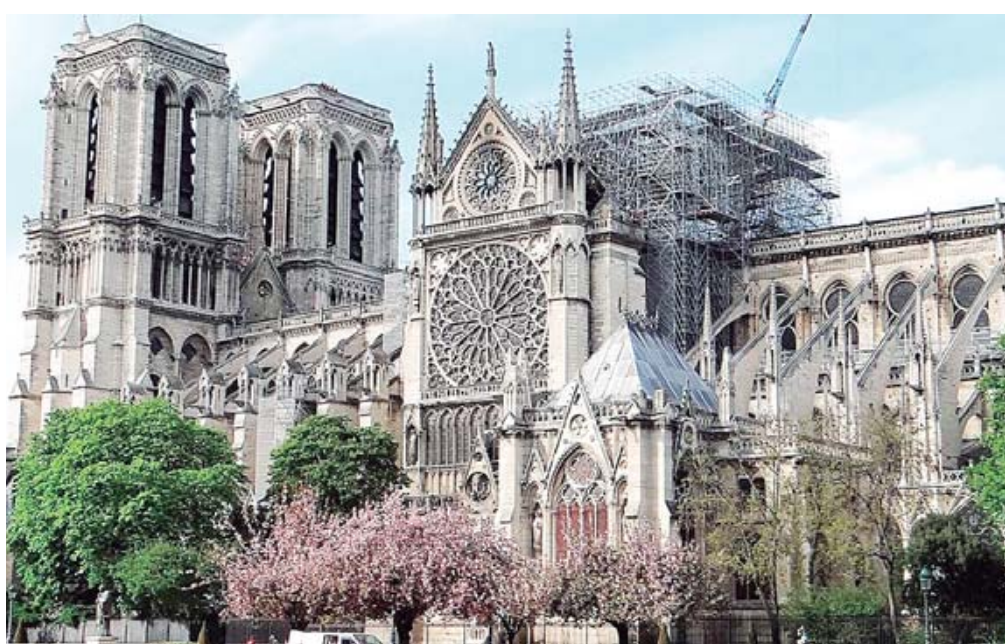
De puertas adentro, tras numerosas consultas artísticas e históricas, se optó por la renovación.

El mobiliario es de bronce, sobrio, diseñado por Guillaume Bardet. Está