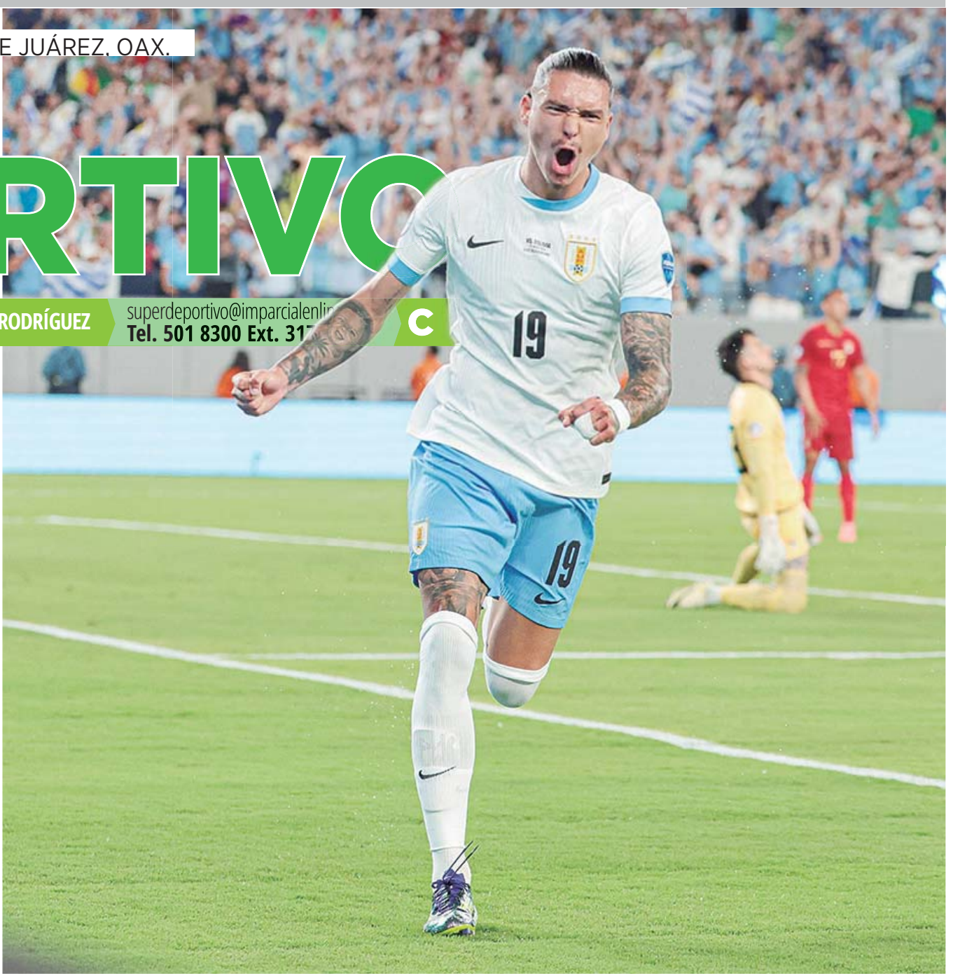
La garra charrúa dominó el partido de principio a fin ante un débil seleccionado boliviano.