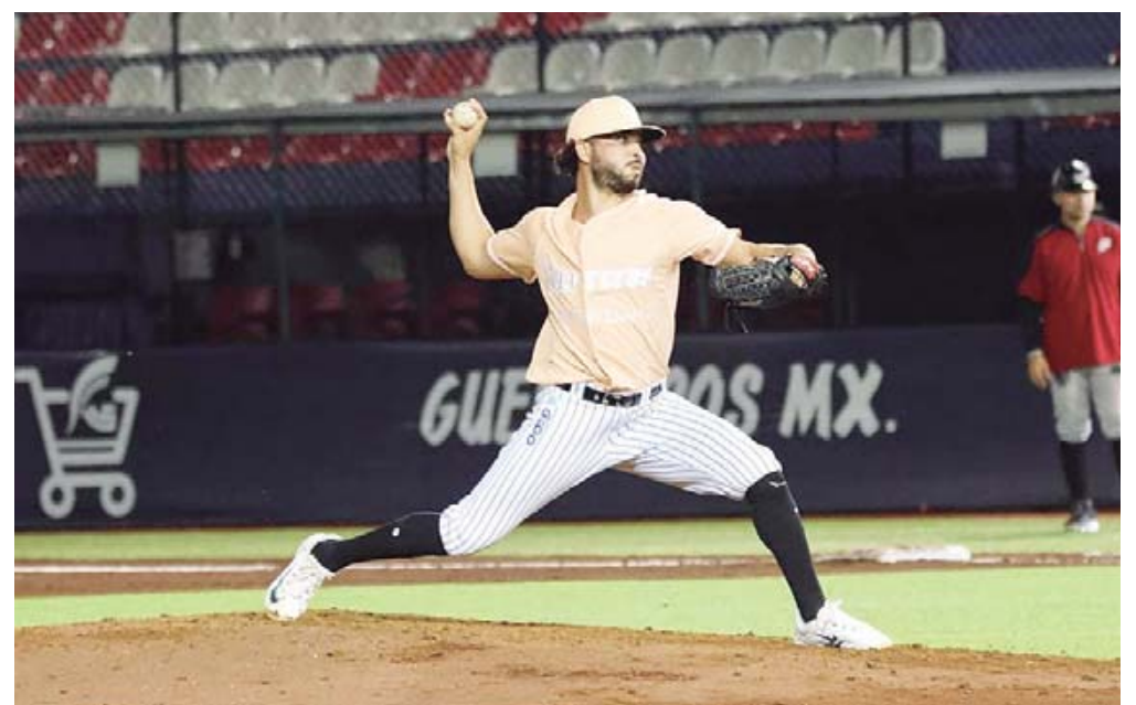
Este sábado continúan las acciones con el segundo juego de la serie a partir de las 17:00 horas.