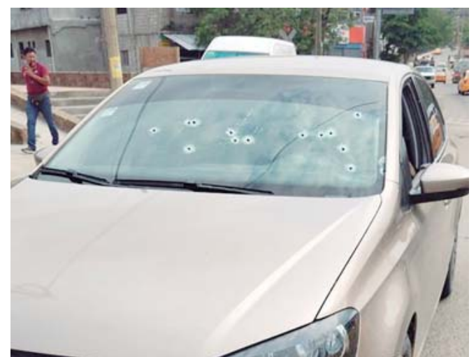
■ El vehículo quedó con múltiples orificios de bala.

timas. Minutos más tarde, dos ambulancias, una del municipio y otra de la Comisión Nacional de Emergencia (CNE), arribaron al lugar para brindar atención médica y trasladar a los heridos a un hospital cercano. La rápida intervención de los servicios de emergencia logró estabilizar a los afectados, cuya condición es reportada como grave.