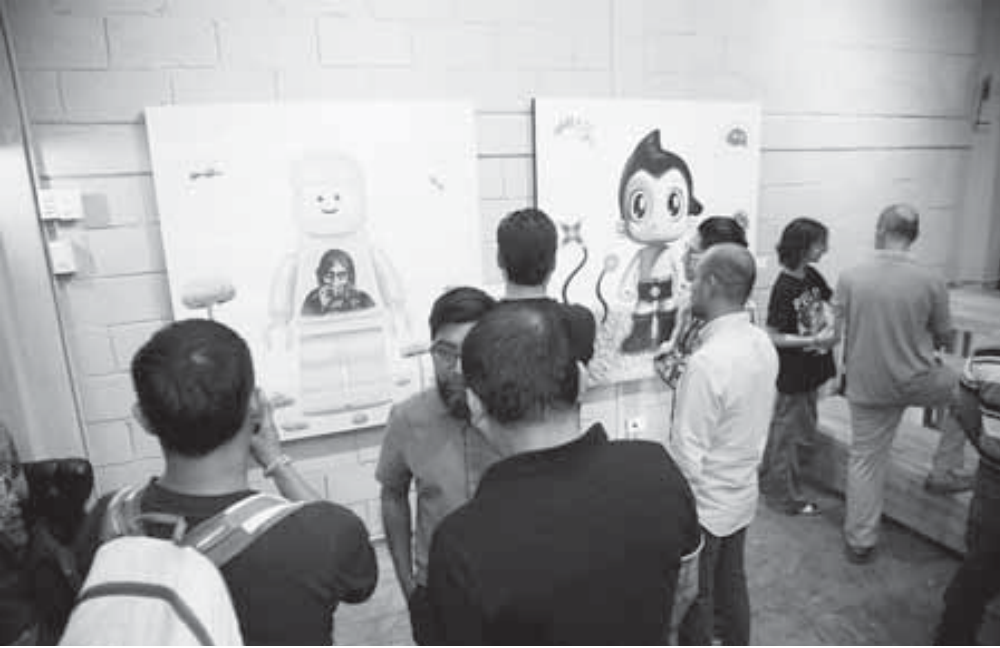
■ Cada artista mostró su esencia a través del arte y sus pinturas.