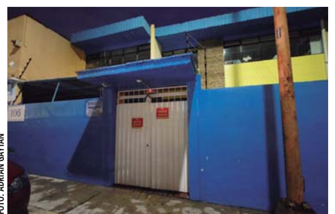
El Centro Educativo Reforma, en la colonia Reforma.

dieron en el hospital, fue que tenía obstruido uno de los pulmones y después de permanecer en la Unidad de Cuidados Intensivos (UCI), fue llevado a piso, pero el diagnóstico es que podría quedar con secuelas de por vida.