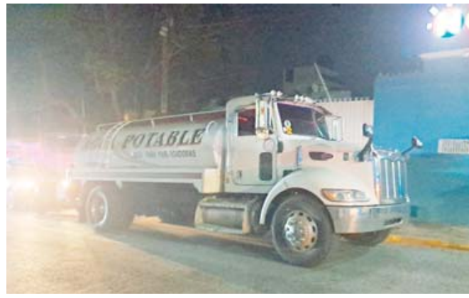
■ El chofer de la pipa fue detenido en la intersección de Joaquín Amaro y Héroes de Chapultepec.

dente, continuando su marcha sobre la calle Crespo. La persecución terminó en la calle Joaquín Amaro, donde elementos de la Policía Municipal lograron detenerlo en la intersección con avenida Héroes de Chapultepec.