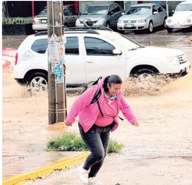
En Pueblo Nuevo, los encharcamientos habituales ante la mirada impávida de autoridades.

En la zona del Periférico, Parque del Amor y Central de Abasto, además de las maniobras de carga y descarga, se pudo observar nudos viales por el afán