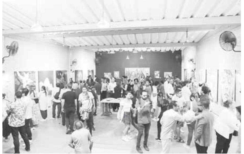
■ No hubo tema principal, cada artista tuvo la libertad de elegir qué quería mostrar.

Nueve autores muestran su más íntima esencia a través de una propuesta artística