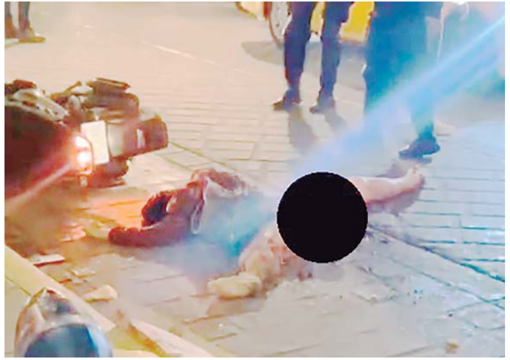
■ La mujer fue triturada por el pesado vehículo que transportaba agua, perdiendo la vida en el lugar.

El conductor de la pipa se dio a la fuga inmediatamente después del acci-