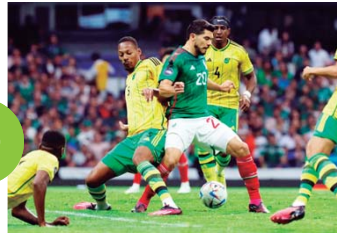
La Selección Mexicana debutará en la Copa América el sábado 22 de junio ante la escuadra de Jamaica.

superdeportivo@imparcialenlinea.com Tel. 501 8300 Ext. 3175