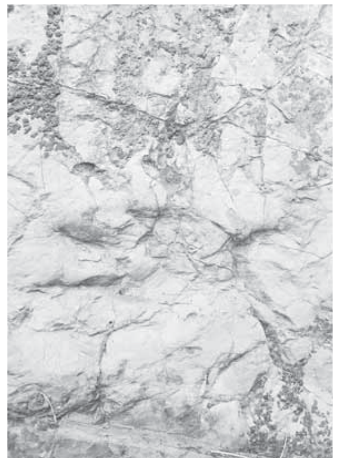
■ También a las huellas de dinosaurio en Santa María Xochixtlapilco.

Finalmente, exhortó a la población en general a que visite estos lugares para apoyar en su conservación, “si visitan estos lugares procuren conservarlos para que toda la gente pueda conocerlos; para ello, entre todos debemos cuidar estos espacios”.