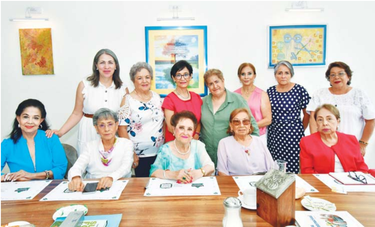
■ Socias de la Asociación de Mujeres Navegando en el tiempo, en su desayuno mensual de trabajo.