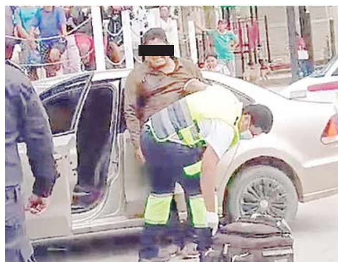
■ Los servicios de emergencia lograron estabilizar a los afectados.

UN VIOLENTO ataque armado registrado la tarde de este viernes en Salina Cruz dejó como saldo