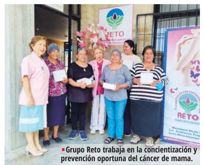
■ Grupo Reto trabaja en la concientización y prevención oportuna del cáncer de mama.

Esta acción causó gran satisfacción y emoción por continuar apoyando a mujeres que enfrentan la enfermedad del cáncer y que no cuentan con el recurso suficiente para adquirir una prótesis de silicón.