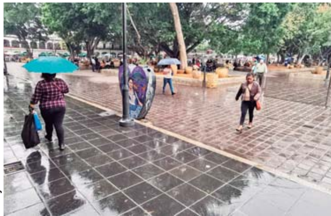
La lluvia sobre el primer cuadro.

de los automovilistas por ganar el paso, los intentos por librar los charcos y evitar caer en baches por los daños en la cinta asfáltica. El tráfico pesado continuó hacia alrededor de las 21:00.