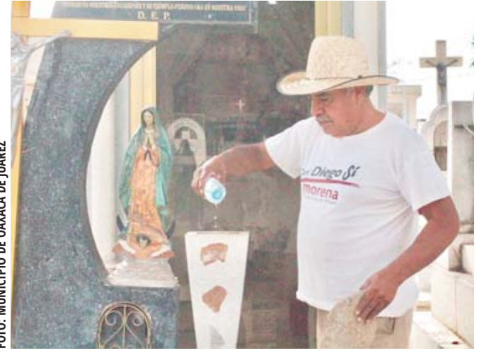
Personal municipal vertió la sustancia química en los depósitos de agua y floreros al interior de panteones.

Mediante un comunicado de prensa difundido anoche, la Coordinación Estatal de Protección Civil y Gestión de Riesgos (CEPCyGR) indicó que se esperan episodios de lluvias de intensidad variable, que pueden llegar a ser fuertes o localmente muy intensas en los próximos cinco días.